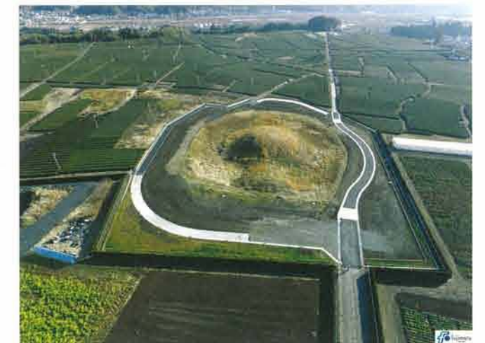
29年度工事終了 西から