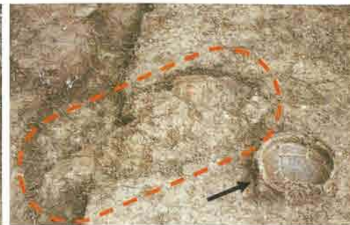
竪穴住居跡内 焼土・土器