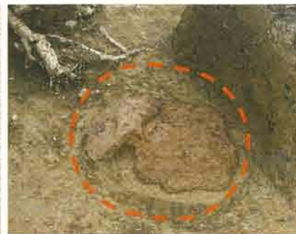
竪穴住居跡内 炉跡