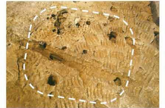
竪穴住居跡1 南から