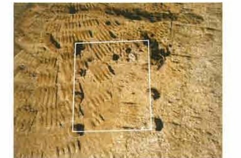
掘立柱建物跡 北から

めいわ 明和7年(1722)5月21日(陰暦)、現在のながやこでがや 地区において銅鐸一口が発見され、掛川藩に届け出されました。掛川市教育委員会では、この日を記念して、市民の埋蔵文化財に対する理解と保護・保存しようとする意識の向上を願い、出土文化財展を開催しています。