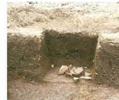
竪穴住居跡2内出土土器