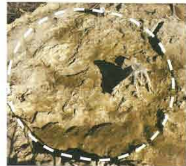
竪穴住居跡 南から