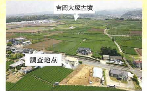
調査地点全景 南から

今回の調査で見つかった土器は少ないですが、壺や甕、高坏の破片が見つかりました。甕は煮炊き、壺は食べ物の貯蔵、高坏は食べ物などを盛り付けるために使われたと考えられています。その他に、祭祀に使われたと考えられている小型の土器の破片や、漁網の重りに使われた土錘などが見つかりました。