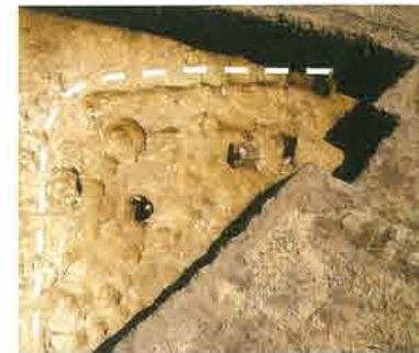
竪穴住居跡2 北西から