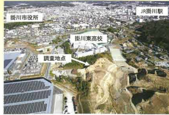
調査区遠景 南から

発見された竪穴住居跡は、出土した土器から平成9年度の調査で発見された竪穴住居跡と同時期のものであり、集落がさらに南まで展開していたことがわかりました。竪穴住居跡内からは煮炊きに使われた炉や土器が見つかりました。今回発見された竪穴住居跡の特徴として、一般的な竪穴住居跡にみられる、4本の柱を立てた穴が見つかりません。平成9年度の調査で発見された竪穴住居跡からは見つかりている点が興味深いところです。また、調査地中央付近では幅1.5m程の溝が、尾根を断ち切る方向で2本並んで発見されました。この溝を境に、南側では住居跡は存在しなかったことから、居住区の境を示すための溝だった可能性が考えられます。