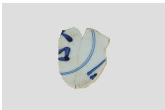
34. D②区出土遺物 (Fig. 12-2)