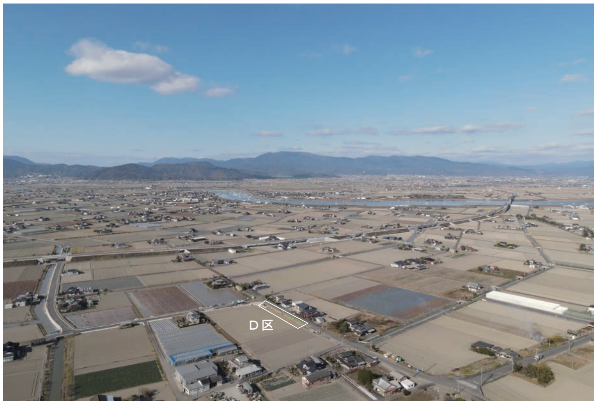
2. 六千間土居跡D区全景(南東から)