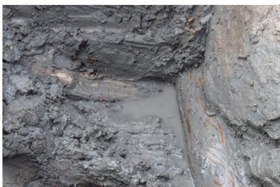
13. D①区トレンチ胴木留め杭検出 (東から)