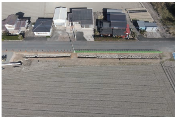
3. D①区(左)・②区(右)完掘(南から)