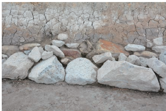
8. D①区石積1・2検出近景(南から)