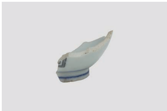
27. D①区出土遺物 (Fig. 8-3)