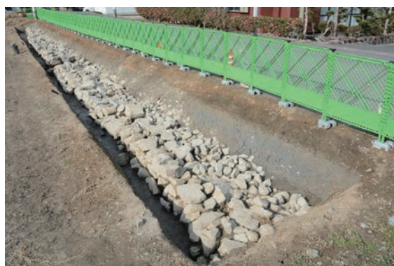
14. D②区完掘 (南東から)