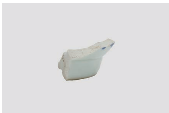
30. D①区出土遺物 (Fig. 8-6)