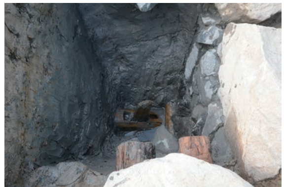
22. D②区トレンチ胴木留め杭検出(東から)