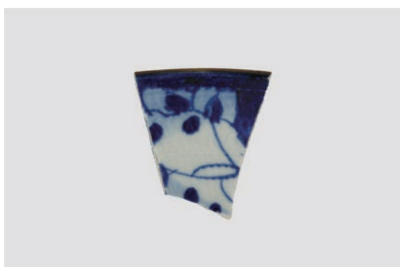
29. D①区出土遺物 (Fig. 8-5)