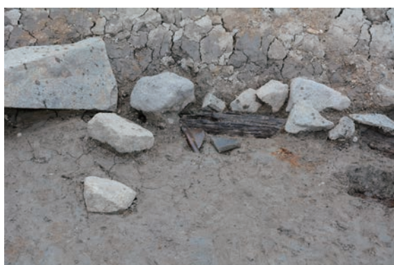
6. D①区石積2下胴木横遺物出土状況(南から)