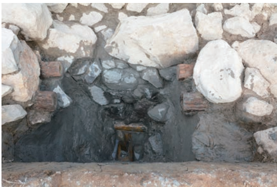
23. D②区トレンチ完掘(南から)