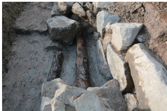
10. D①区トレンチ石積2下胴木検出(東から)