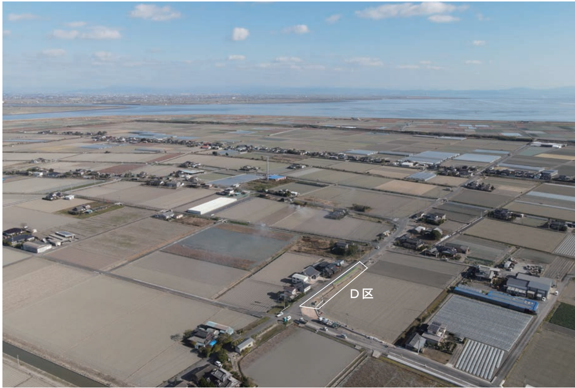
1. 六千間土居跡D区全景(南西から)