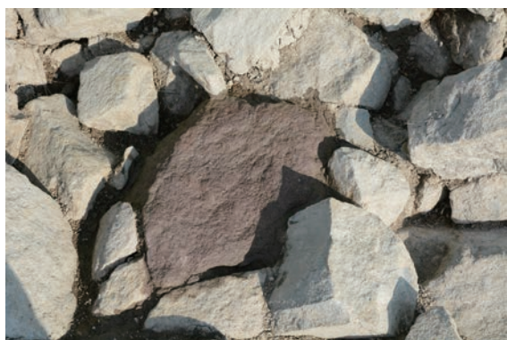
17. D②区赤石検出近景 (南から)