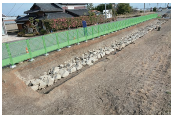
15. D②区完掘 (南西から)