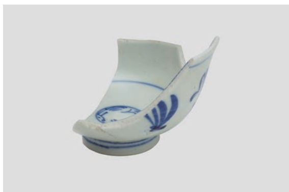
33. D②区出土遺物 (Fig. 12-1)