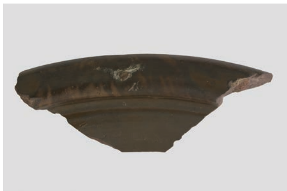
31. D①区出土遺物 (Fig. 8-7)