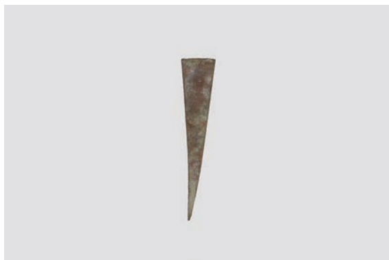
32. D①区出土遺物 (Fig. 8-8)