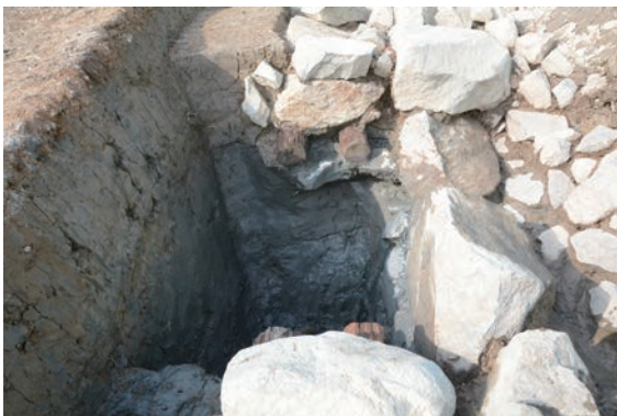
21. D②区トレンチ西壁土層(東から)