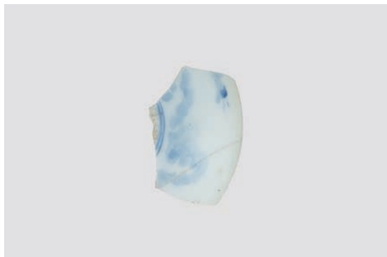
28. D①区出土遺物 (Fig. 8-4)