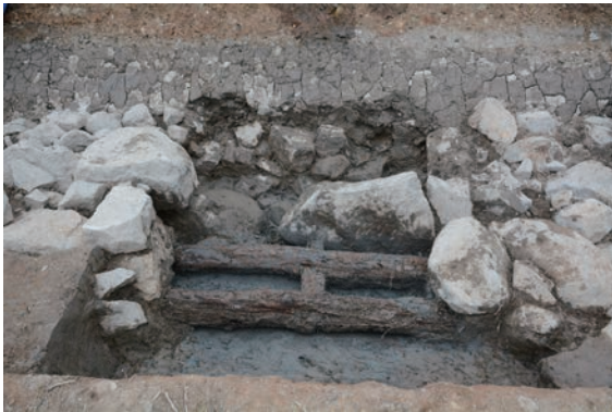
19. D②区トレンチ石積2下胴木検出(南から)