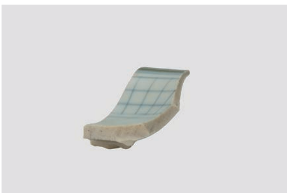
25. D①区出土遺物(Fig. 8-1)