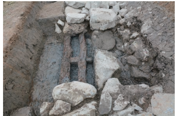
20. D②区トレンチ石積2下胴木検出(東から)