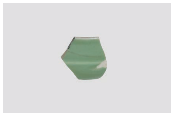
26. D①区出土遺物(Fig. 8-2)