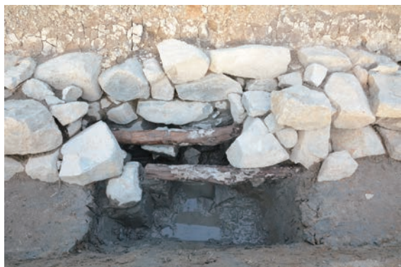
11. D①区トレンチ完掘 1 (南から)