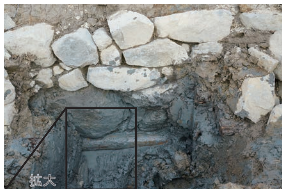
12. D①区トレンチ完掘 2 (南から)