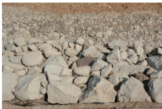
16. D②区石積 1・2 及び赤石検出 (南から)