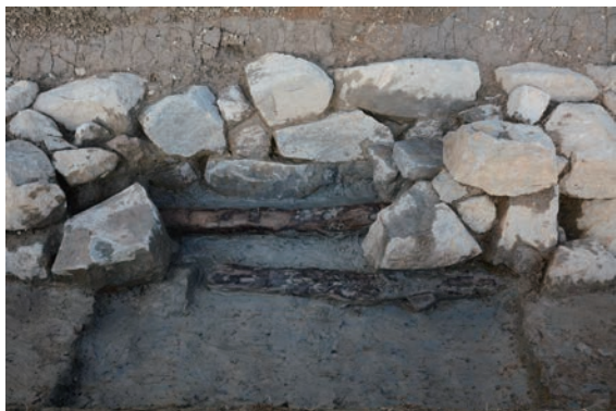
9. D①区トレンチ石積2下胴木検出(南から)