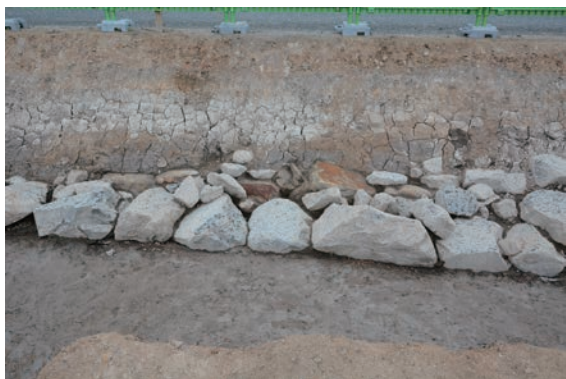
7. D①区石積1・2検出(南から)