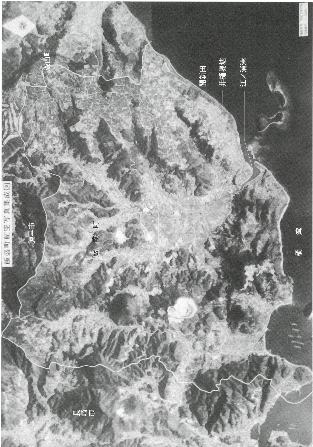
図版1 飯盛町域空中写真