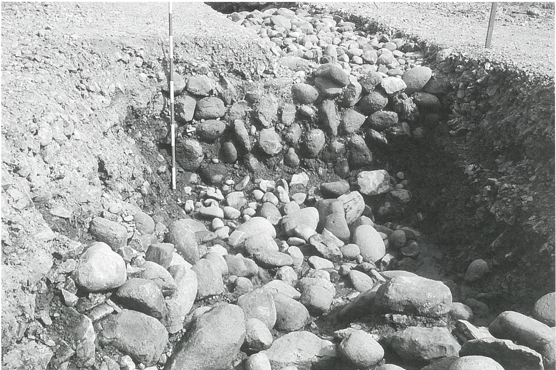
上部堰堤と中部堰堤（南側から）