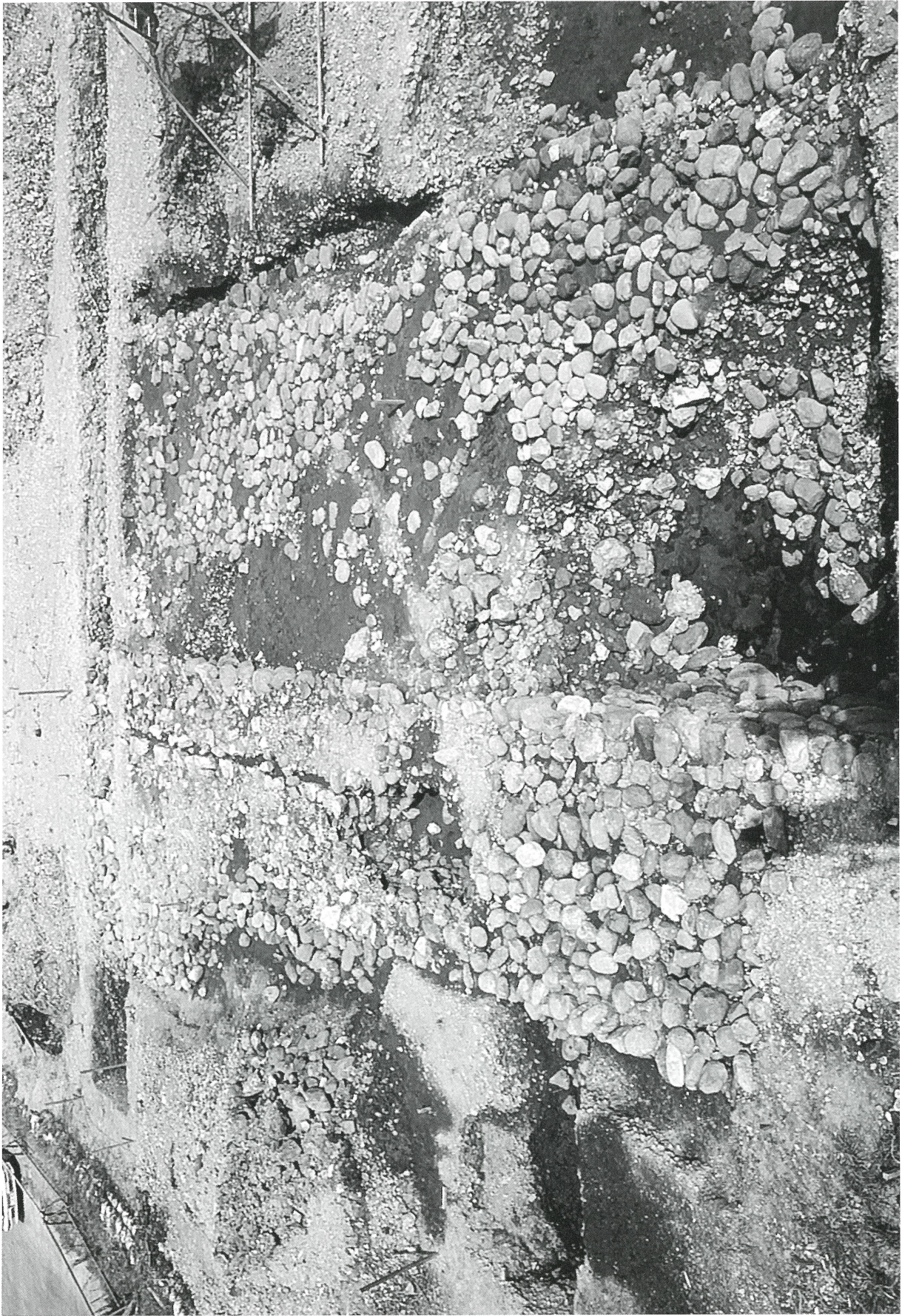
図版10 上位堰堤の北堤（左側）と南堤（右側）