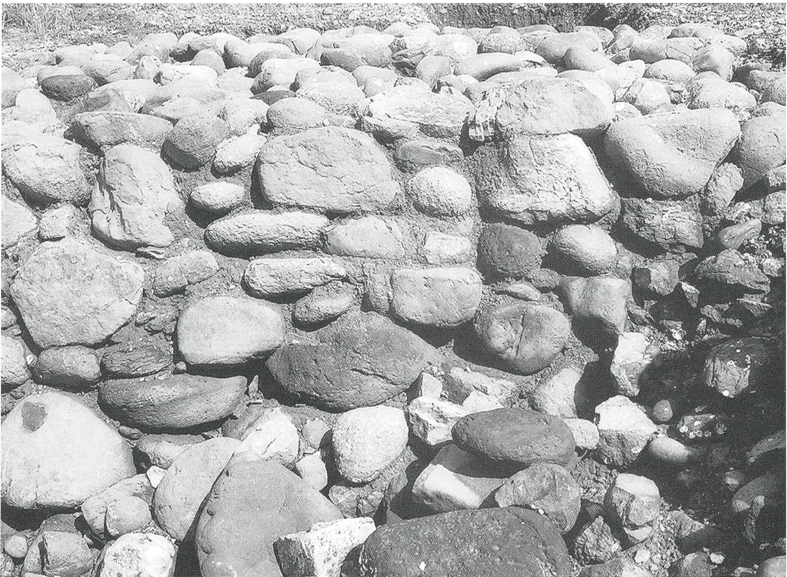
「はがねどろ」(粘土の充填状況)