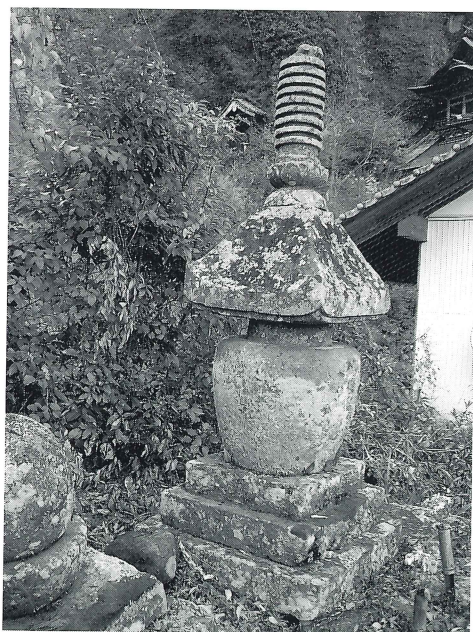
写真3 中津市本耶馬溪羅漢寺宝塔