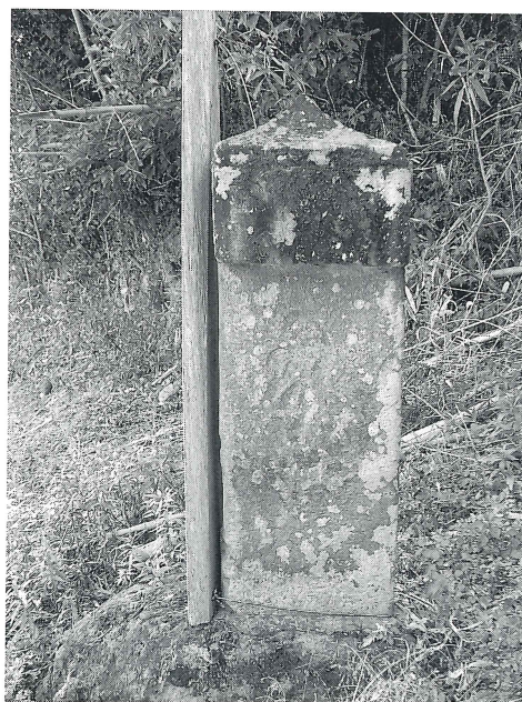
写真2 宇佐市上元重千手観音堂板碑