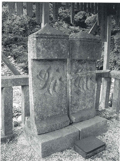
写真1 宇佐市木内妙楽寺板碑

これまで、大分県下においては、県北地域である中津市・宇佐市域の石造物について、他地域に比較すれば、調査・研究の遅れが存在することは否めない現状にある。今年度の調査において、県北地域の石造物の特徴の一端が把握できたことは、大きな成果であった。次年度以降もこの調査を継続することにより、その実態をさらに解明できる資料化を実現していきたい。