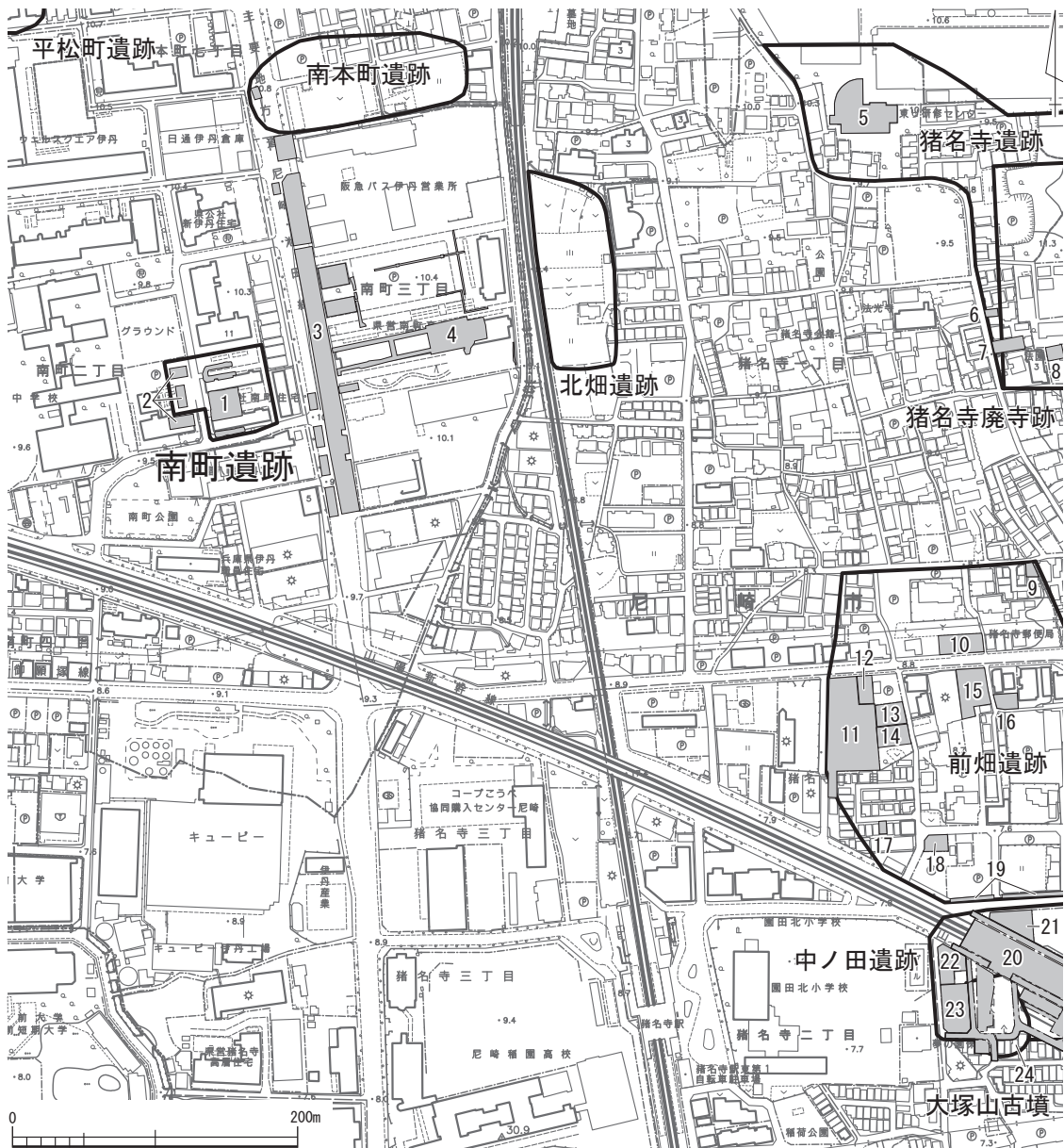
図2 周辺調査位置図（1：5,000）

以上、概観してきたように、周辺には主に、弥生時代後期から古墳時代中期の集落や古墳、飛鳥時代から奈良時代にかけての遺構・遺物が比較的多く分布している地域といえる。