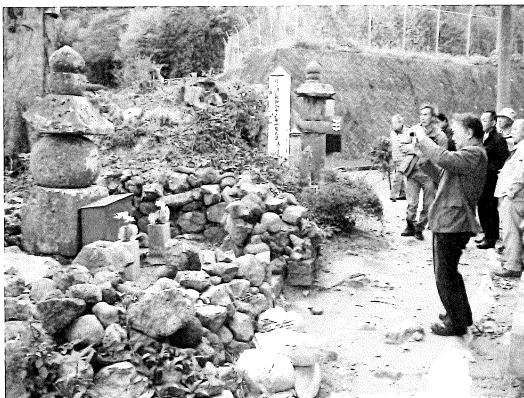
調査委員会現地調査風景 (大分市大友頼泰墓)

また、昨年度に引き続き、調査成果を刊行したが、今年度はこれまでの悉皆調査の成果を分布図・地名表に纏め、3 分冊の内、2 冊目「分布図・地名表編(中)」を上梓した。