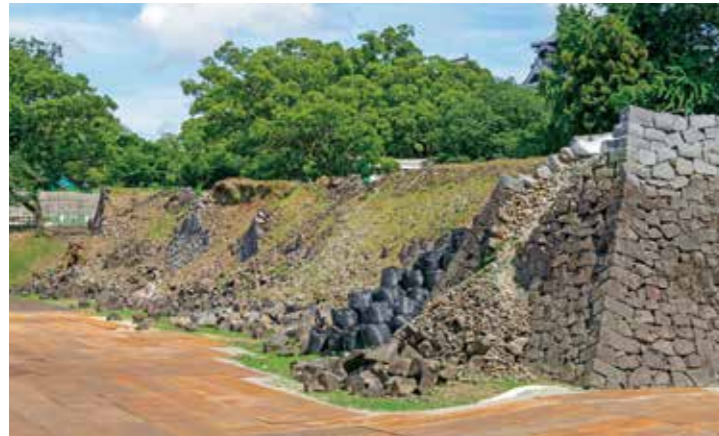
石材回収前の戌亥櫓周辺石垣