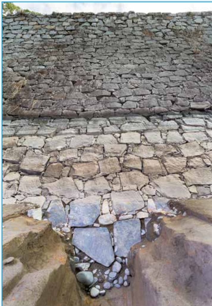
北側の飯田丸・要人櫓石垣は根石の下に丸い石を敷いています。