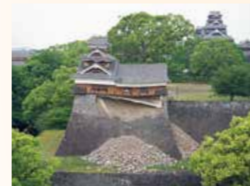
熊本地震後の飯田丸五階櫓石垣