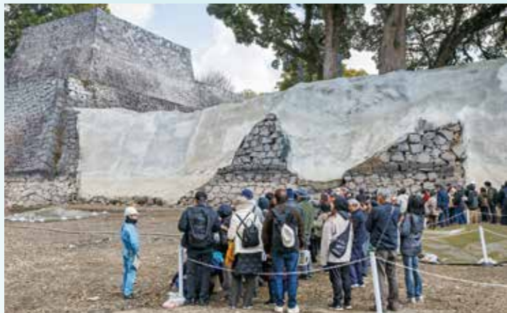
調査成果説明会当日の様子(令和6年2月10日)

備前堀は、行幸坂の東側にある水堀です。この堀に面した石垣は、平成28年熊本地震で南側が大きく崩れました。今後この石垣を復旧する際の基礎資料を得るために、令和6年(2024)1・2月に発掘調査を行いました。発掘調査はまず堀の水を全て抜いた上で、石垣下の4か所を調査しました。その結果、今回確認した石垣は一樣に地面を一段低く掘り下げて根石(石垣最下底の石)を据えていることが判明しました。しかし、場所によっては根石の据え方に差が見られました。北側にある飯田丸・要人櫓石垣では、掘り下げた底に人の頭程の大きさの石を敷き、その上に根石を据えていました。それに対して、南側の一段低い石垣では掘り下げた地面の上に直接根石を据えていました。このように隣接する石垣で築き方に違いが見られる理由ははっきりしませんが、石垣の高さや根石を据える地面の状況に応じた当時の人々の工夫かもしれません。