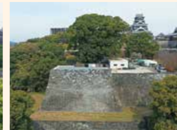
復旧が完了した飯田丸五階櫓石垣