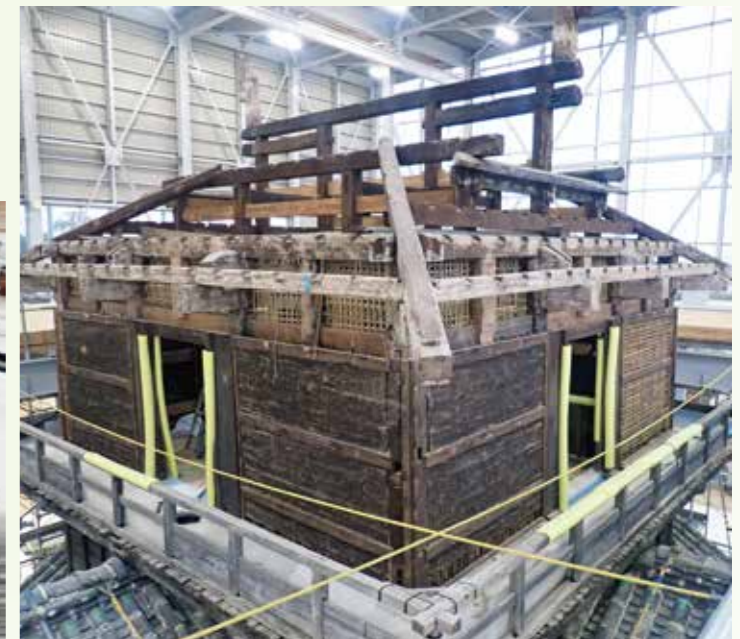
野地板が取り外された宇土櫓最上階