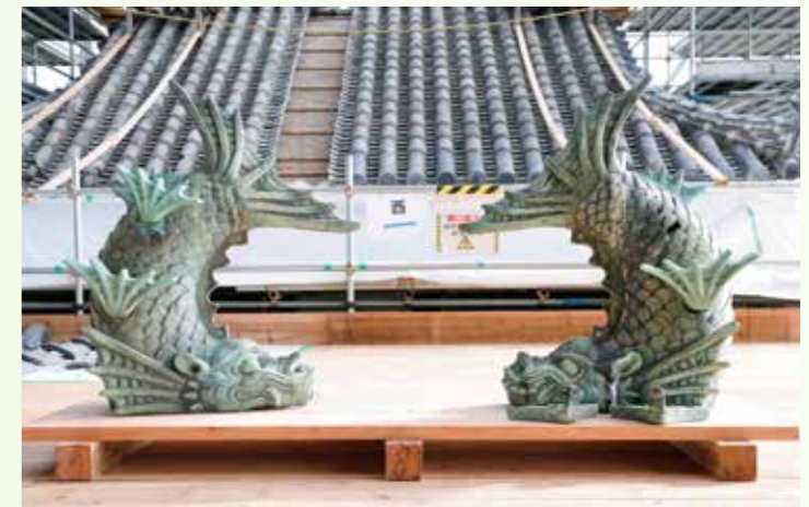
約100年間宇土櫓を見守った鯨