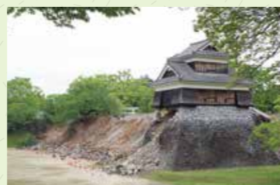
被災直後の戌亥櫓と崩落した石垣