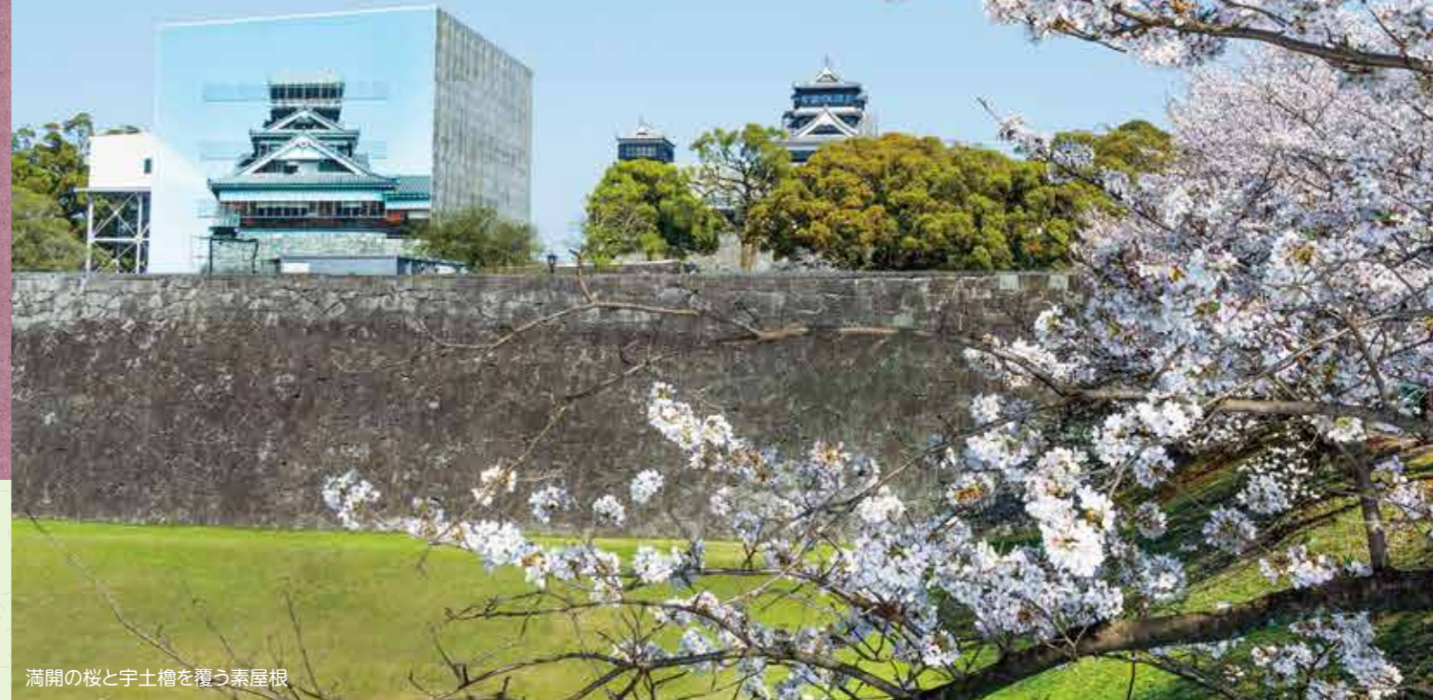
満開の桜と宇土櫓を覆う素屋根