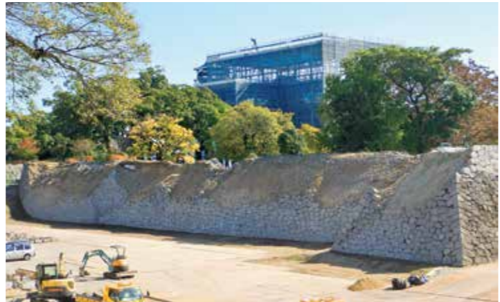
石材回収が完了した戌亥櫓周辺石垣