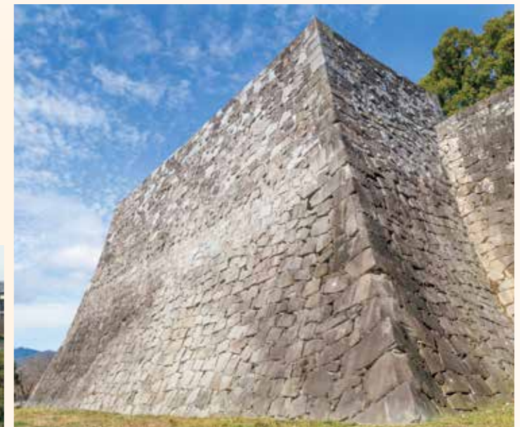
復旧が完了した天高くそびえる飯田丸五階櫓石垣