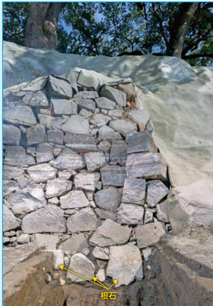
南側の石垣は掘り込みの底に直接根石を据えています。