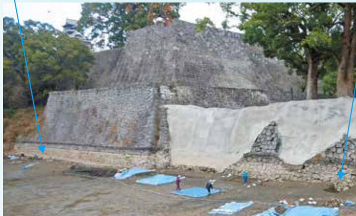
南西から見た発掘調査中の備前堀(写真奥は飯田丸五階櫓石垣)