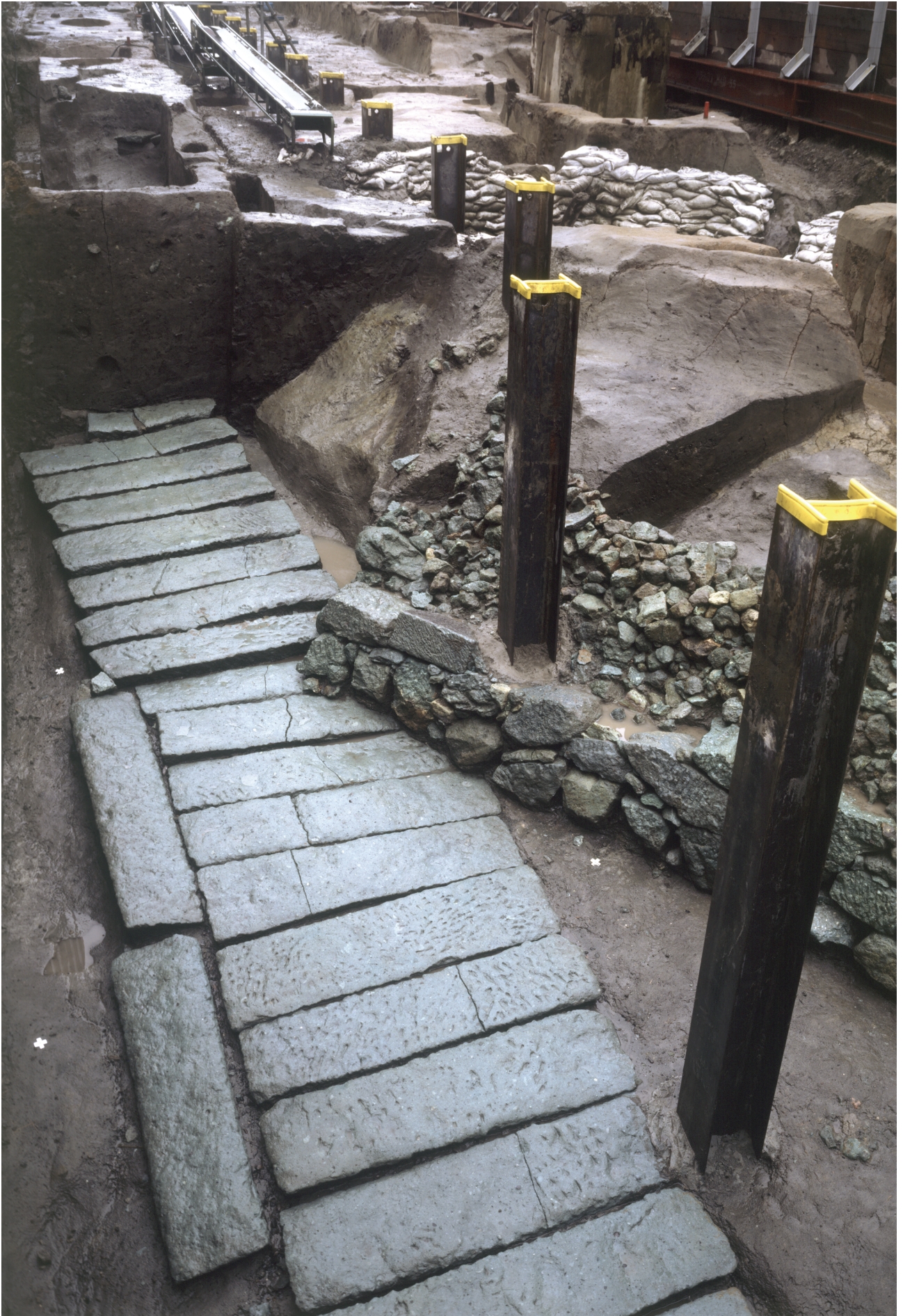
6. FKJ02-4 石垣 I と板石敷通路状遺構 (東)