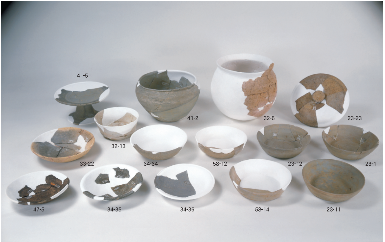
(1) 大塩向山遺跡G地区出土の主要な土器