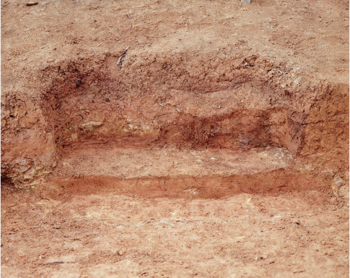
(1) 大塩向山遺跡C地区S K24 (焼土坑) 切断状況……南から