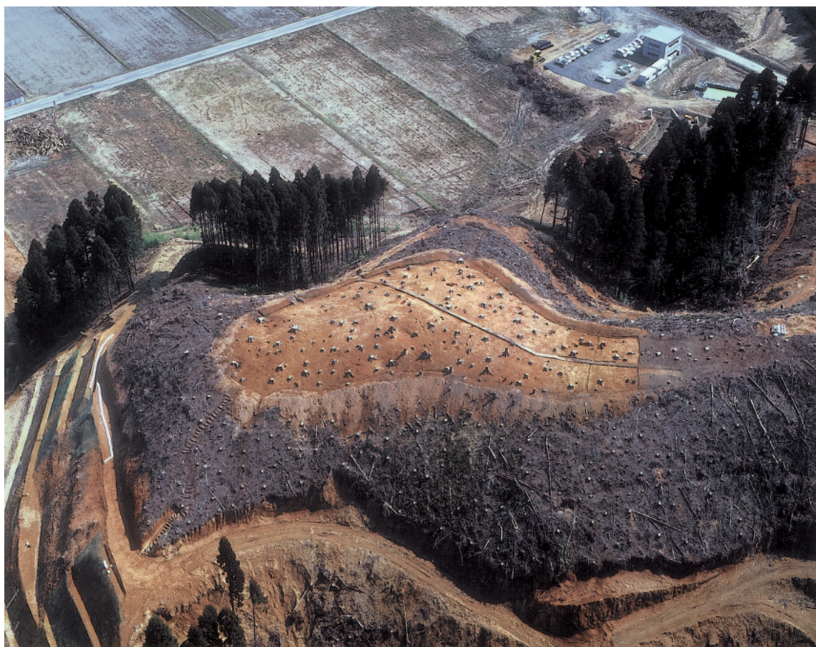
(2) 大塩向山遺跡全景C地区全景……北西上空から