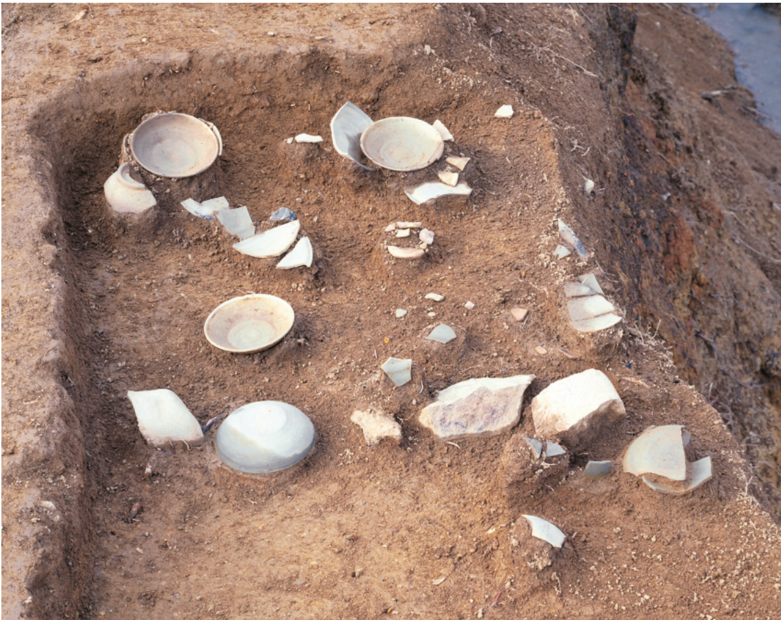
(2) 大塩向山遺跡N地区S K03遺物出土状況……東から