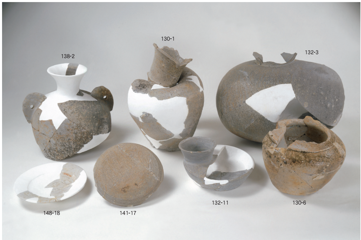
(2) 山腰遺跡S D02・5・包含層出土の主要な土器