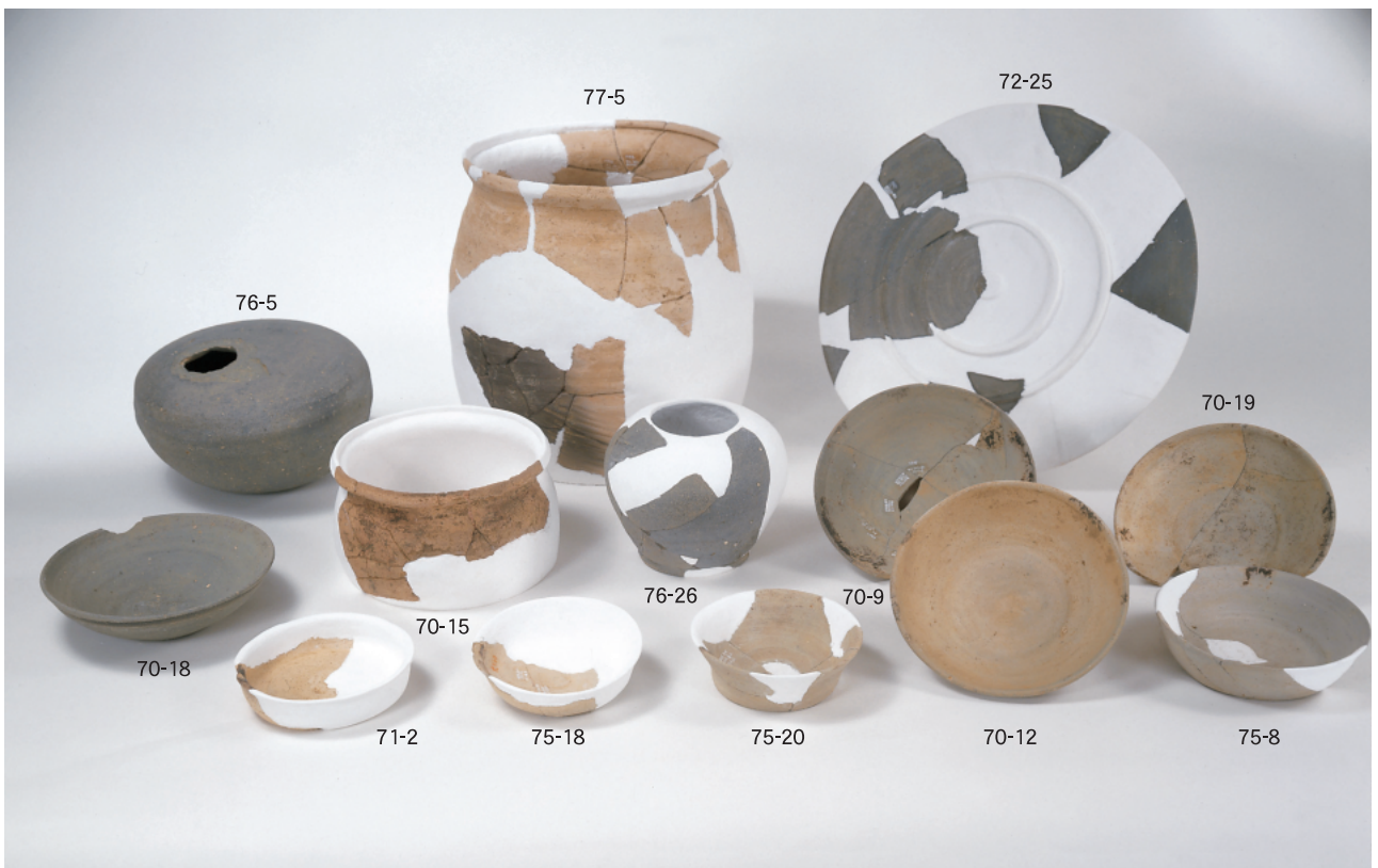
(2) 大塩向山遺跡N地区出土の主要な土器