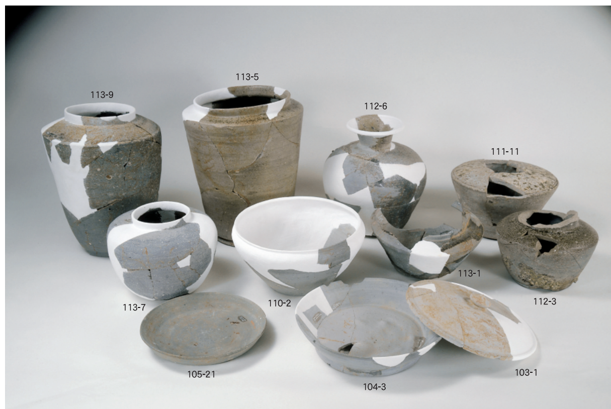
(2) 山腰遺跡 S D01出土の主要な土器