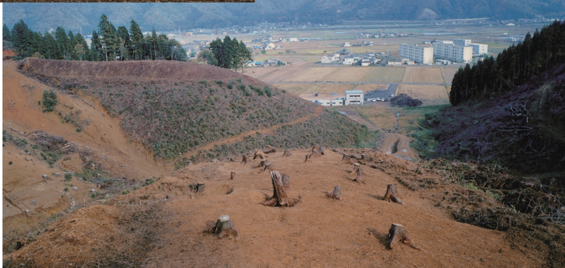
(1) 大塩向山遺跡N地区尾根から望んだ日野山と市街地南部から望む霊峰白山(上)