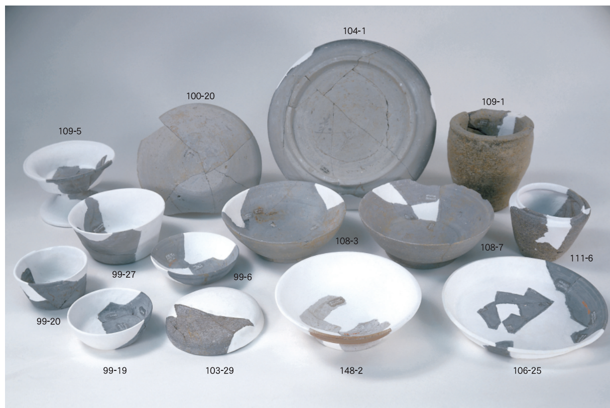
(1) 山腰遺跡 S D01出土の主要な土器