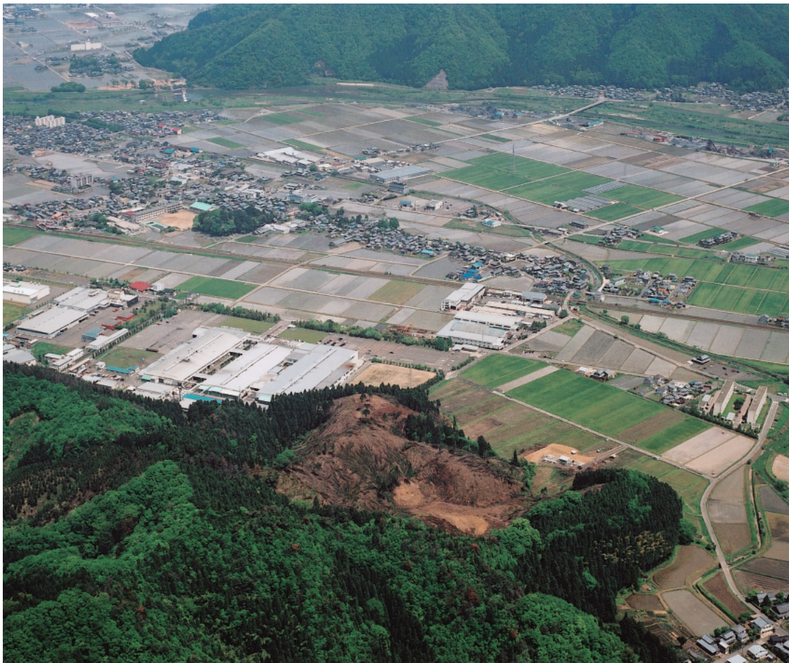
(2) 大塩向山遺跡・山腰遺跡全景（南西上空から）