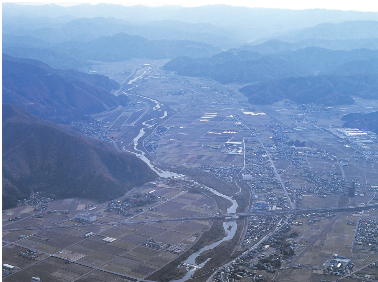
(2) 大塩向山遺跡・山腰遺跡周辺……北（越前市街地）から