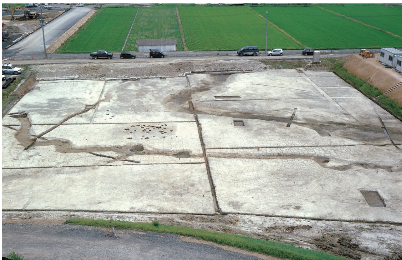
(2) 山腰遺跡全景……西 (大塩向山遺跡C 地区付近) から