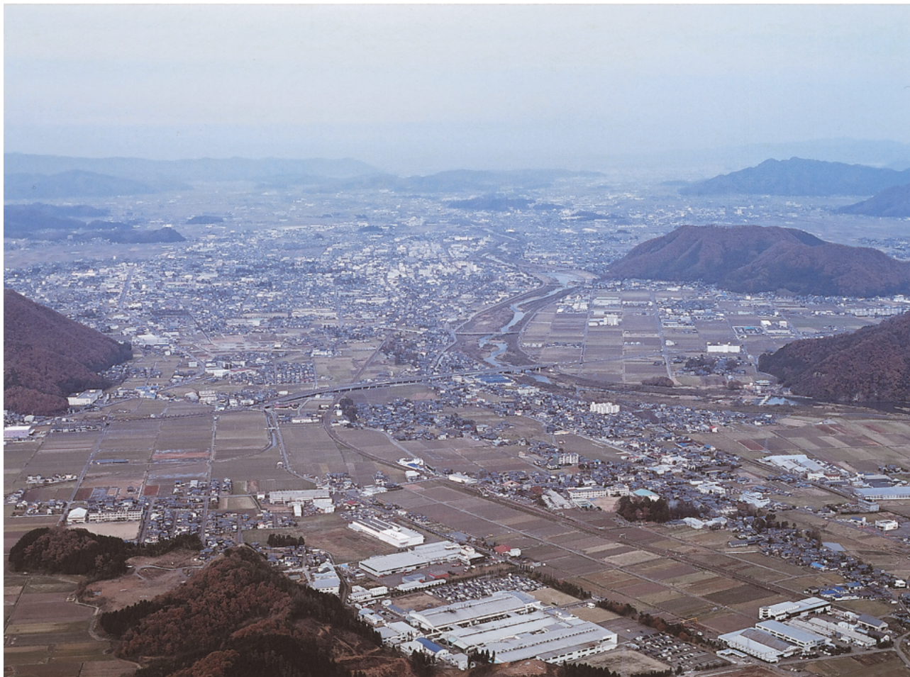
(1) 大塩向山遺跡全景上空から越前市（旧 武生市街地）を望む……南東上空から