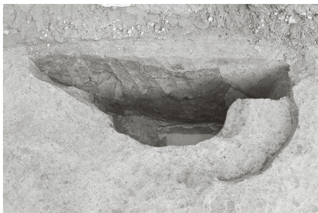
(3) SE 3 断面 (西から)