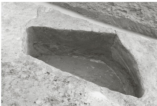
(4) SE 4 断面 (北西から)