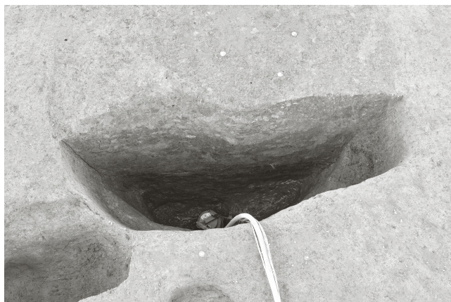
(1) SE 1 断面 (南から)