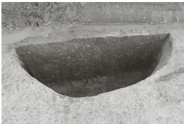
(2) SE 2 断面 (北から)