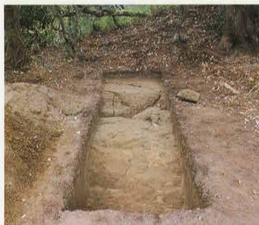
第11号トレンチ 平場 The 11th Trench in Hira-ba