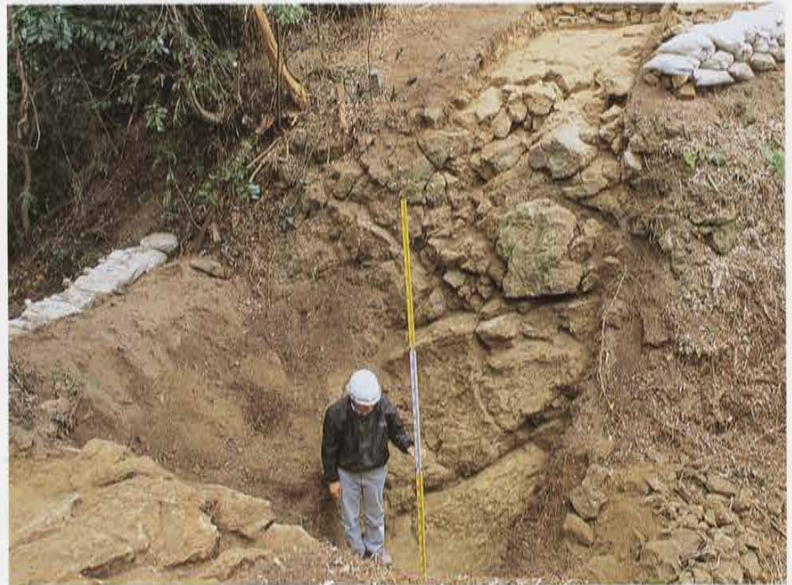
稲葉越の堀切 Horikiri Moat in Inabagoe Street