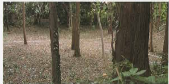
仏法寺跡の柱穴列 Line of Postholes in Buppouji Temple Site 「一升榊」 Isshoumasu

世後期の頃に墓地もしくは供養所となったものと推定されます。採集した五輪塔地輪には、「元弘三年 七月十三日」と銘があり、かわらけも13世紀中葉まで遡ることから、もともと切通を警護するために作られた五合榊が、鎌倉幕府が滅亡した元弘三年（1333）を機に、墓地もしくは供養所へと変化したとも考えられます。