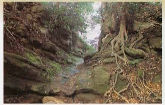
貝吹地蔵脇の切通道 Kiridoshi Street beside Kaibuki-jizou Statue

貝吹地蔵の上方から南東～南側に伸びる尾根には、階段状の地形が見られます。この段々に第6号トレンチとして3箇所設定しました。2段目のトレンチでは溝や30cmほどの深さで方形を基調に削られている石切痕が検出され、層塔の未製品と思われる凝灰岩塊が出土しました。トレンチ外にも切り出された凝灰岩塊が散乱していることを考え合わせると、この石切痕は石塔を切り出した痕跡と考えることができ、この周辺は石塔製作址と推定されます。鎌倉では、中世まで遡る石塔製作址は今回が初めての発見です。都市周縁に存在する種々の産業のうち、鎌倉石の切出しや加工は鎌倉独自の産業であり、鎌倉文化の特徴を表す遺構として注目されます。