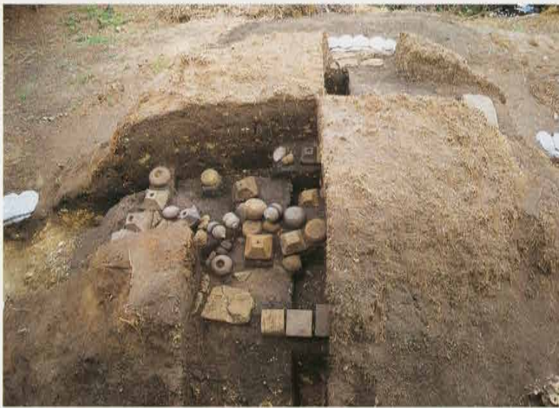
霊山山の塚 Earthen Mound in Mt. Ryouzen-yama