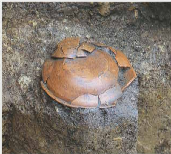
第3号トレンチ 合わせ口かわらけ Biscuit Ware Small Dish with a Fitted Lid in the 3rd Trench