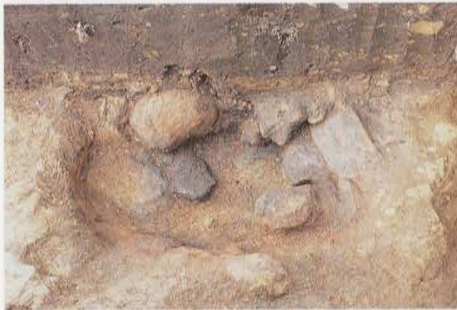
衣張山山頂の茶毘址 Site of Crematory on the Top of Mt. Kinubari-yama