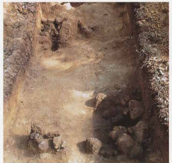
第6号トレンチ 茶毘址 Site of Crematory in the 6th Trench

浄智寺の谷の最奥部平場に設定した第9号トレンチでは2時期の生活面を確認し、上位面は山裾の岩盤を削り平場面積を拡張していることがわかりました。平場の性格は不明ですが、おそらく浄智寺に関連した塔頭跡と考えられます。出土遺物には、14世紀後半～15世紀のかわらけ皿・国産陶器・舶載陶磁器・瓦・金属製品等があります。この時期には尾根の頂上部付近まで寺院の造営が行われていることが分かり、鎌倉の周囲をめぐる山の状況を示す重要な発見となりました。