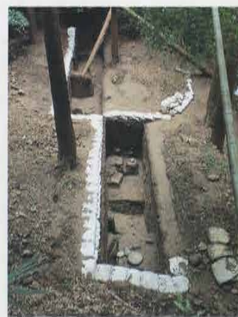
宝鏡寺跡 Site of Houkyouji Temple