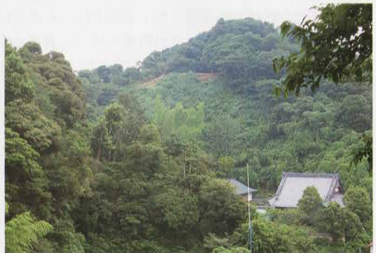
「五合榭」遠景 Distant View of Gongoumasu