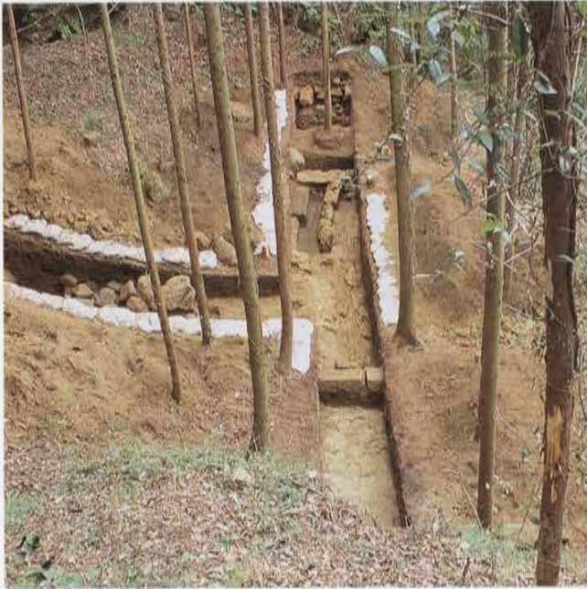
第10号トレンチ やぐら・茶毘址 Site of Yagura Crematory in the 10th Trench