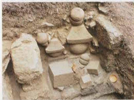
第10号トレンチ やぐら Yagura in the 10th Trench