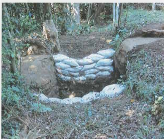
禅居院奥の堀割 Canal at the Back of Zenkyoin Temple

円応寺の東側、巨福呂坂隧道の脇には二段になった切岸が存在します。ここにトレンチを設定したところ、15世紀段階には、現在尾根道になっている下に、岩盤を削平した平場が存在したことがわかりました。この場所は巨福呂坂の山ノ内側であることから、旧巨福呂坂の遺構かと推定されています。