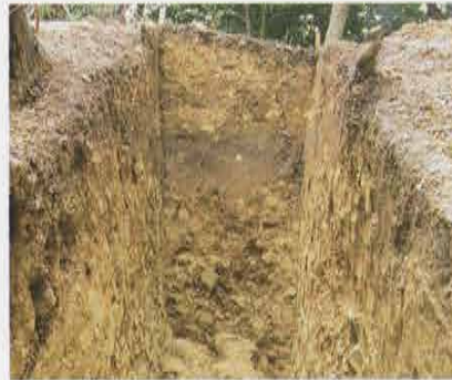
「一升榭」土塁 Earthwork in Isshoumasu