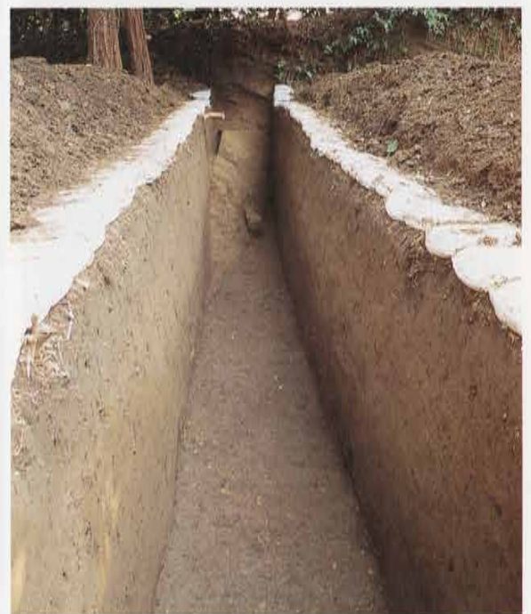
浄智寺奥の造成跡 Site of Development at the Back of Jouchiji Temple