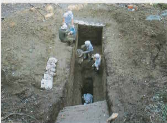
旧巨福呂坂上の調査区 Investigation Area above Old Kobukuro-zaka