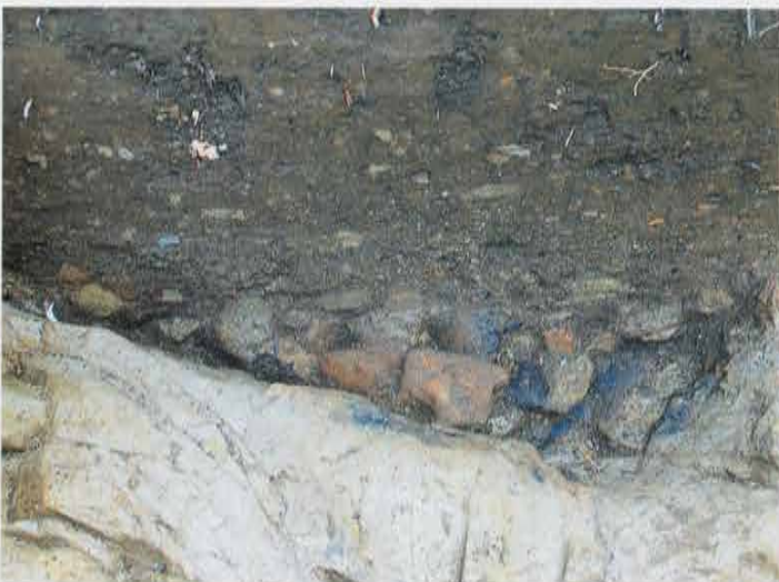
第2号トレンチ 茶毘址 Site of Crematory in the 2nd Trench