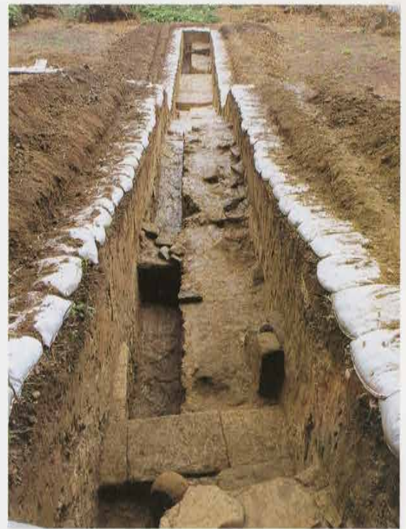
仏法寺跡の敷石 Paved Stone in Buppouji Temple Site