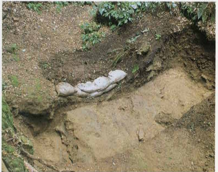
切通の道路跡 Site of Street in Kiridoshi