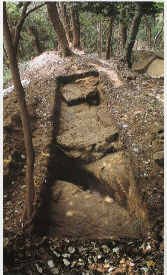
第6号トレンチ 石切痕 Quarry in the 6th Trench