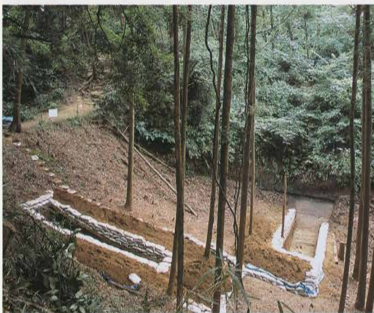
大堀切の調査 Investigation of Large Horikiri Moat