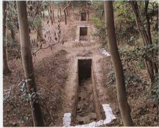
五眸庵跡の平地 Hira-ba in Site of Gobouan Temple