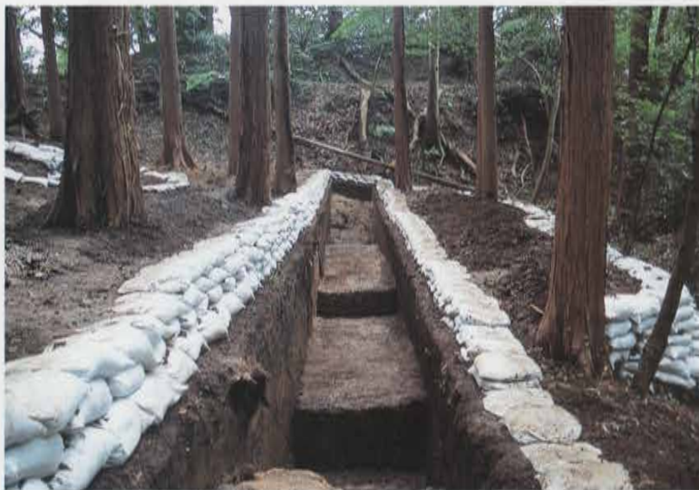
S字状鞍部の平場 Hira-ba Next to S-shaped Col

しかしながら、佐助稲荷社の裏山・桔梗山付近は近現代の地形的改変を大きく受けています。とくに「S字状鞍部」等は、太平洋戦争末期の陣地構築などによる近現代の造成によって造られた地形であり、中世まで遡る人為的な防衛施設と断言しうる遺構は乏しいものでした。