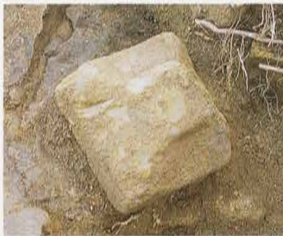
層塔の未製品 Incomplete Object of Multi-storied Stone Stupa