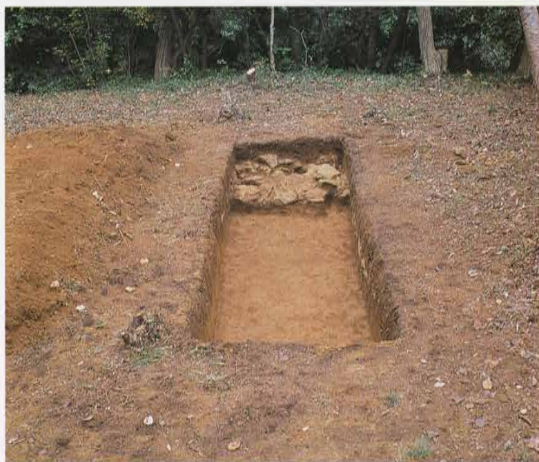
第10号トレンチ 大切通上の平場 The 10th Trench in Hira-ba above Large Kiridoshi