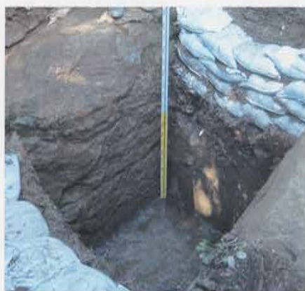
禅居院奥の堀割 Canal at the Back of Zenkyoin Temple