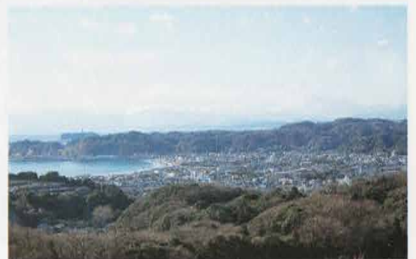
鎌倉遠景 Distant View of Kamakura

今回の調査を実施する中で、山稜部の遺構が思いのほか良好に残されていたということが分かりました。藪を少しかき分けて歩いてみると、切岸、平場、堀切などが非常に良く残っています。これらの遺構群は、漫然と歩いていると見過ごしてしまいそうな、決して派手な遺構群ではありませんが、「武士の都」に残された貴重な遺産であり、しっかりと後世に伝えていく必要があると思います。