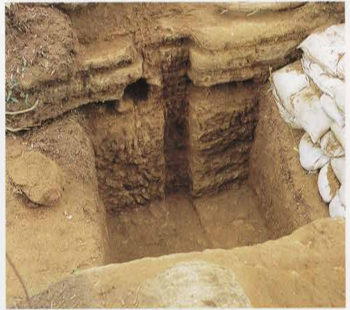
釈迦堂口の堀切（門跡） Horikiri Moat in Shakadou-guchi (Site of Gate)