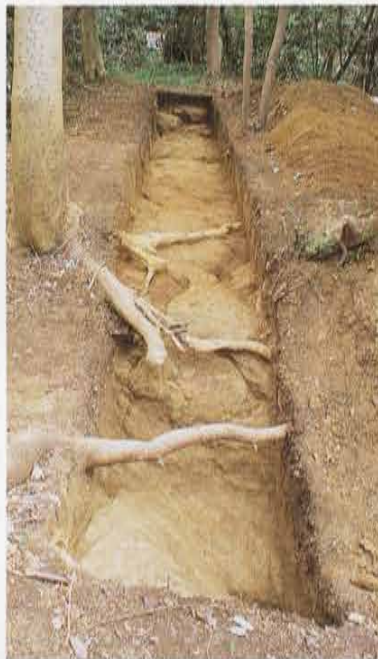
貝吹地蔵上の平場 Hira-ba above Kaibuki-jizou Statue