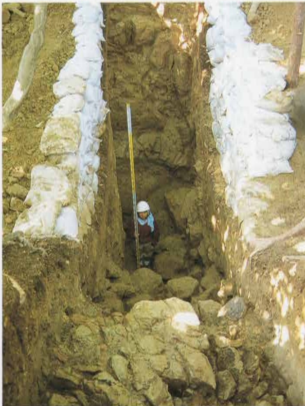
第 2 号特レンチ 堀切 Horikiri Moat in the 2nd Trench

成就院の背後の丘陵上には「五合榭」と呼ばれる榭形遺構の存在が古くから知られています。極楽寺切通の鎌倉側を見下ろす極めて重要な地点で、平場の東と北には土塁状の高まりがあり、この平場に第 26 号特レンチを十字に設定しました。北側で石塔が 3 点出土し、中央部からはかわらけが集中して出土しました。出土遺物から、土塁状の高まりのうち、いくつかは塚である可能性が高く、中