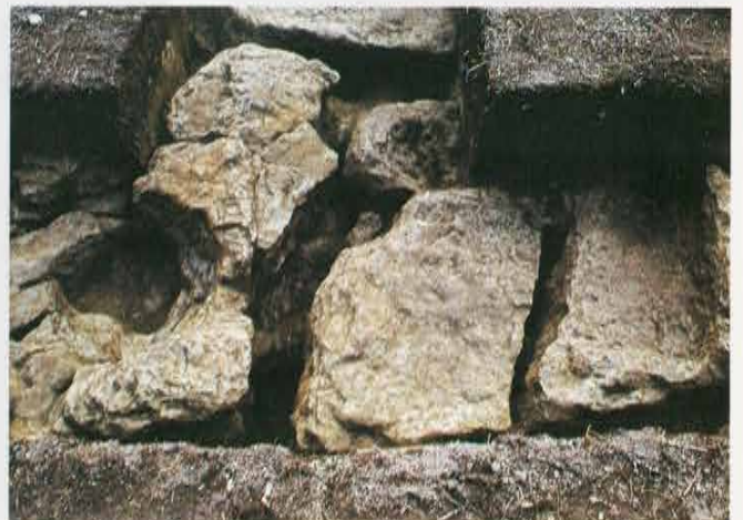
第1号トレンチ 土坑 Earthen Pit in the 1st Trench