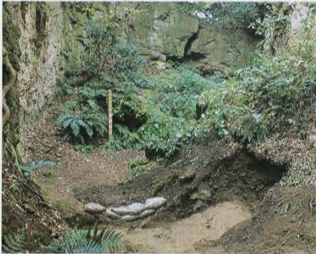
切通道の調査 Investigation of Kiridoshi Street

第6号トレンチは国指定史跡「名越切通」の現在通行止めになっている逗子市側の切通に設定しました。ここでは、およそ4時期の道路面が確認されました。道路面は切通の崖面から崩落した泥岩塊が踏み固められたものです。最も上の道路面は、現在の道路面の15～20cm程下にあり、両側に排水溝を伴っていたようです。この時の道路幅は約3.4mで、排水溝は3時期目以降に掘られたようで、それ以前にはありません。最も下の道路面は岩盤を直接掘りくぼめたものでした。この時の道路幅は約2m、道路中央での切通の高さは8.2m前後と推定できます。岩盤直上に堆積する土層から、中世～近世の遺物が出土し、最下道路面が近世に使われていたことがわかりました。