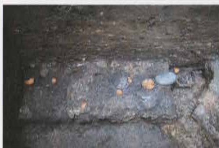
宝鏡寺跡の火災址 Site of Fire in Site of Houkyouji Temple