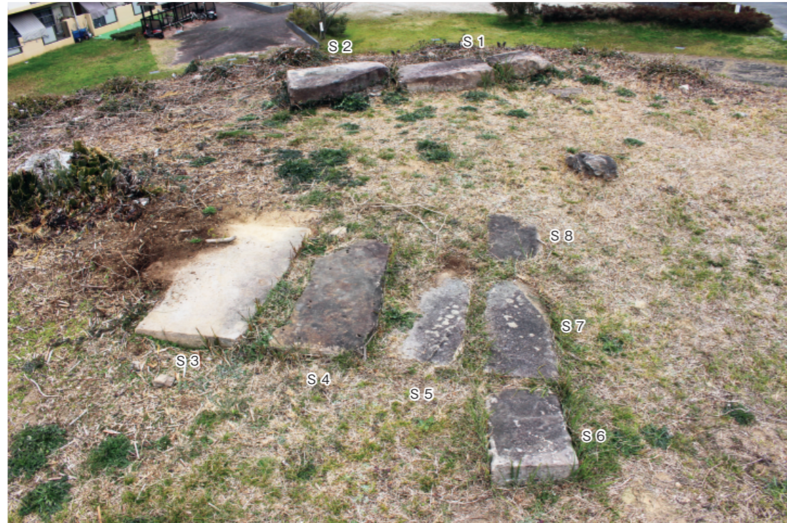
a. 釜塚古墳墳頂部 板石群現状 (南から)