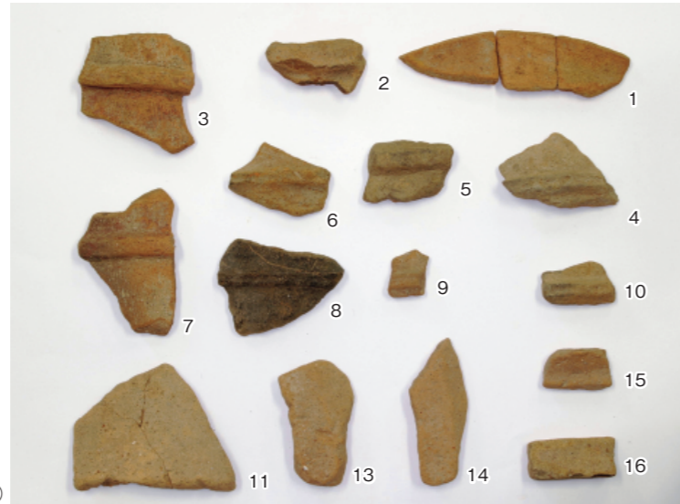
a. 釜塚古墳採集埴輪①