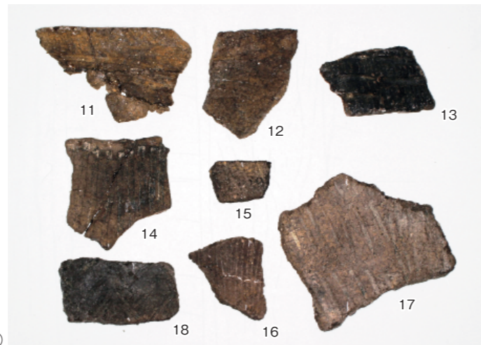
c. 同上 32層出土縄文土器①