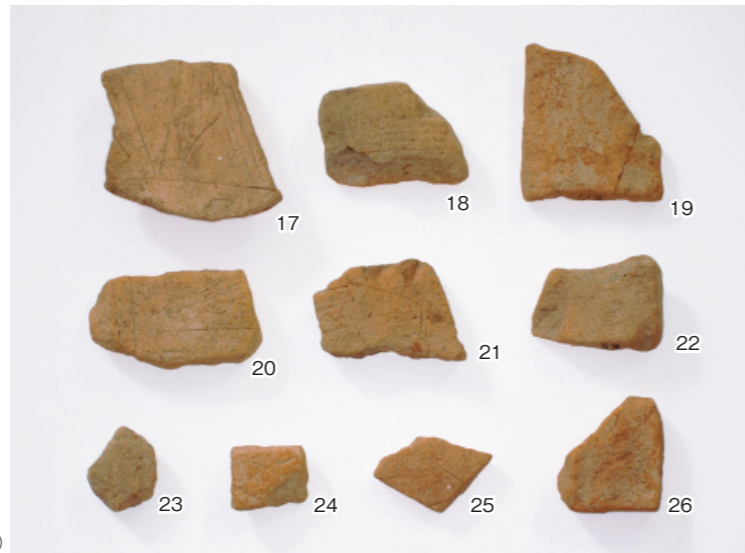
b. 釜塚古墳採集埴輪②