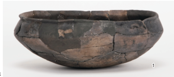
a. 第4次調査 5層出土精製浅鉢