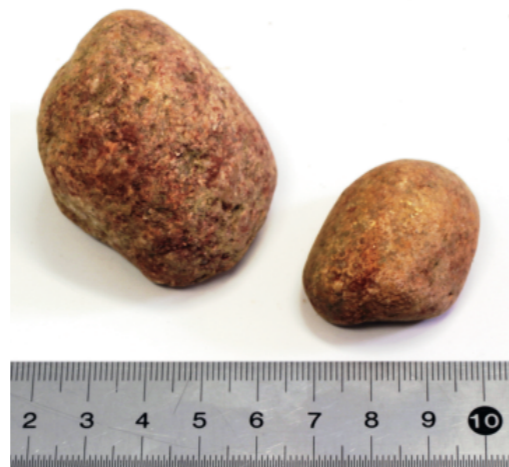
d. 釜塚古墳採集赤色顔料付着円礫