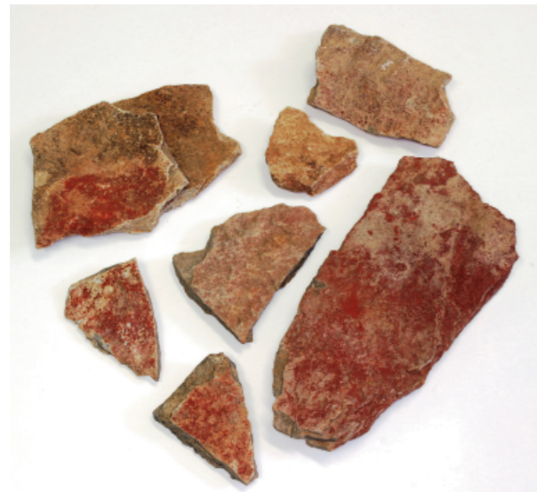
c. 釜塚古墳採集赤色顔料付着板石