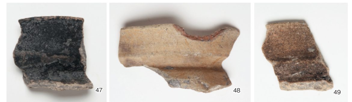
b. 同上 出土古式土師器