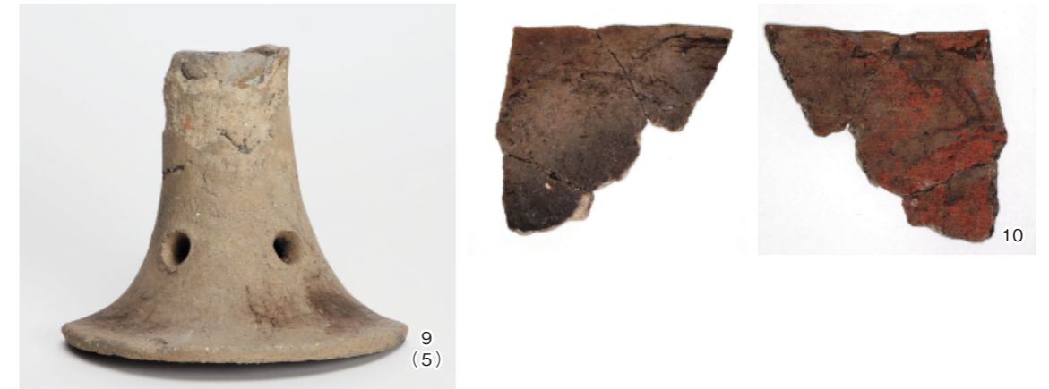
a. 8 トレンチ土器溜り出土土器