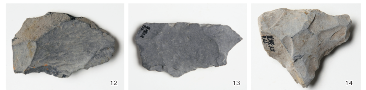
釜塚古墳出土石器