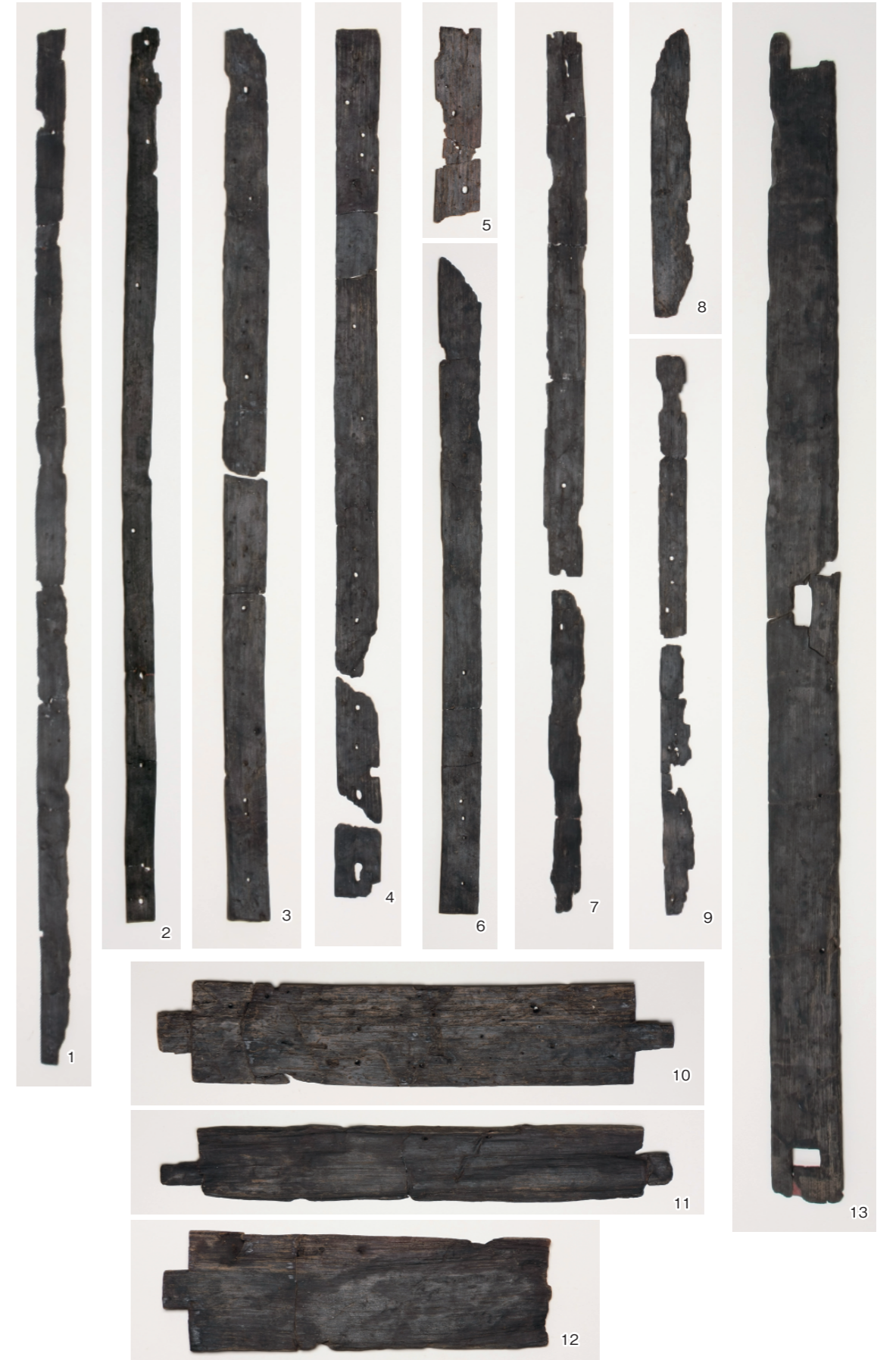
組み合わせ式木製品