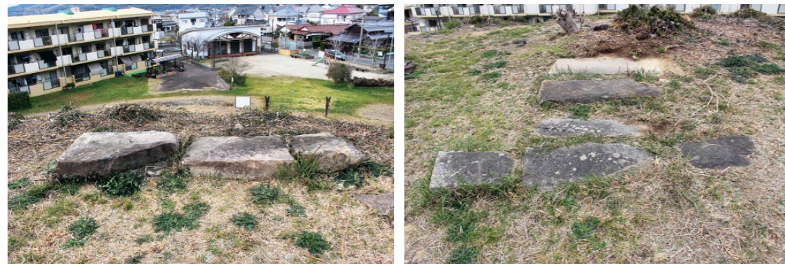
b. 同上 倒壊した供養碑石 (S1, 2 南から) c. 同左 供養碑前の石置転用石材 (S3~8, 東から)