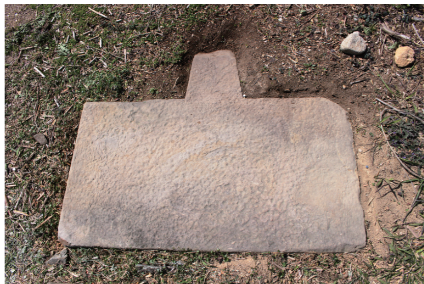
d. 同上 S3近景 (東から)