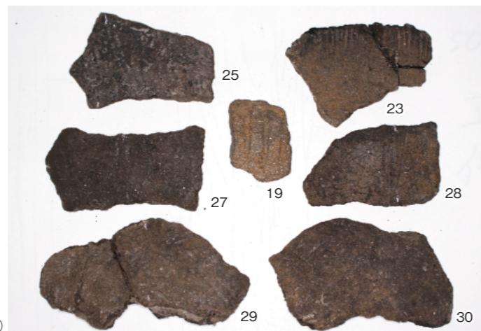
d. 同上 32層出土縄文土器②