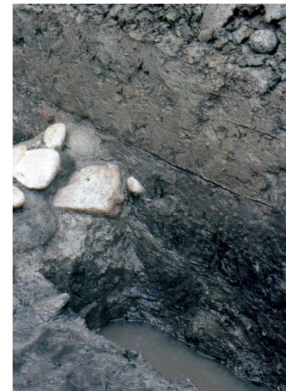
b. 同上 1トレンチ葺石裾土層断面（南西から）