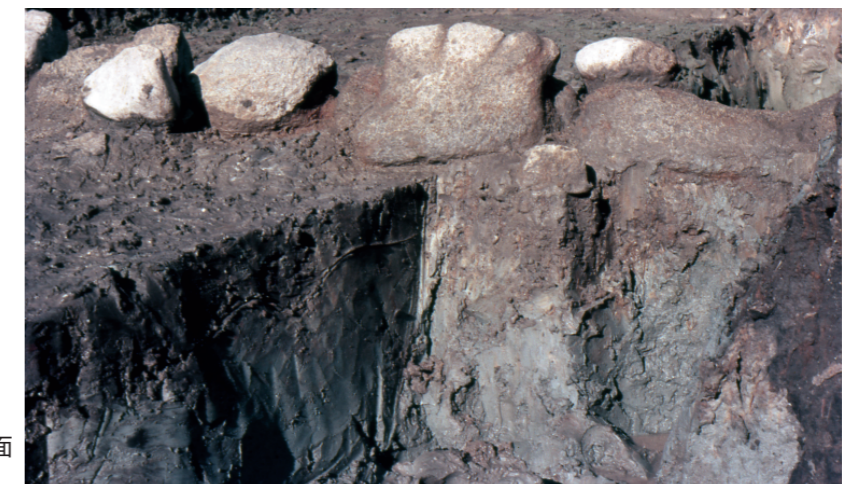
d. 同上 2トレンチ葺石裾土層断面 （南西から）