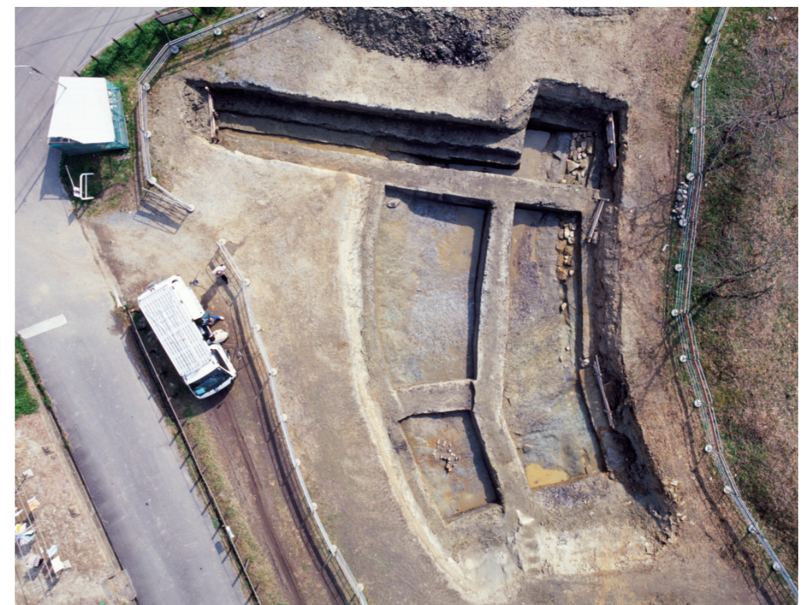
b. 同上 12 トレンチ（上から 写真上が南東）