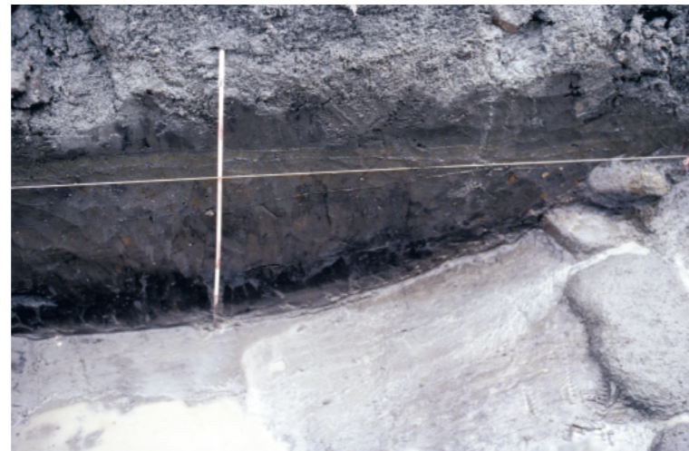
b. 同上 13トレンチ 墳丘裾土層 (西から)