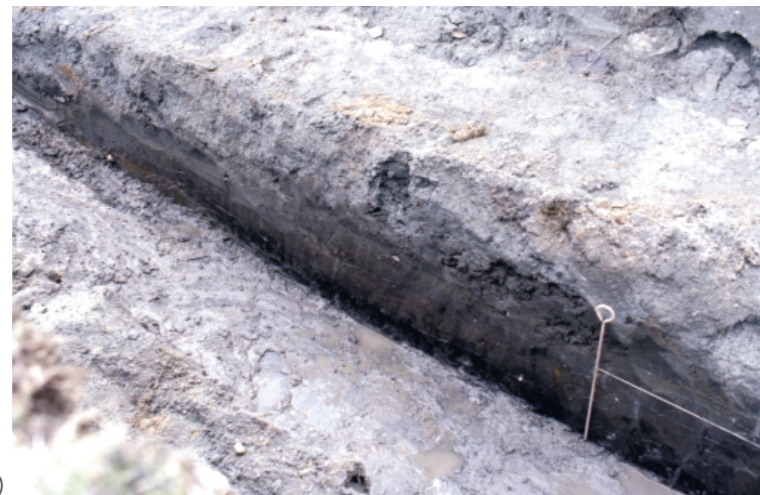
c. 同上 13トレンチ 周濠外縁土層 (南西から)