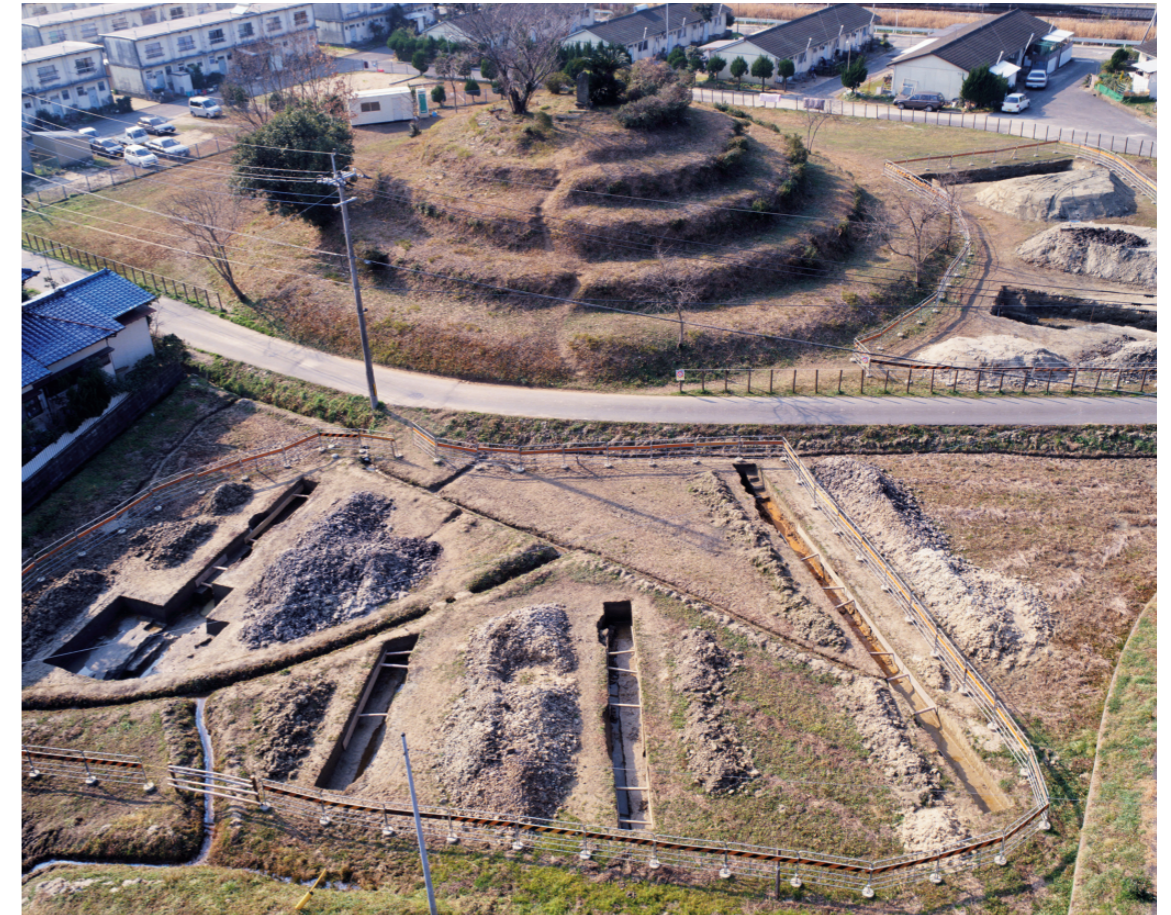
a. 第3次調査 8～11トレンチ（東から）