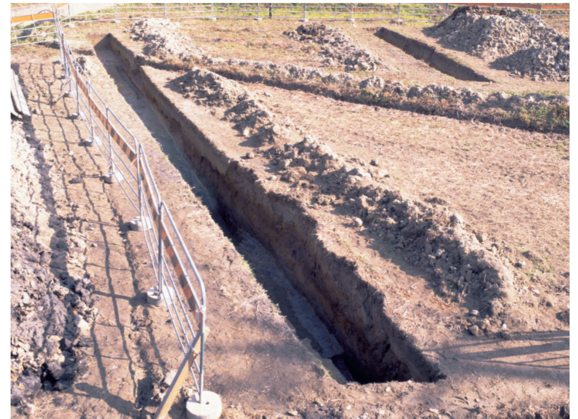
a. 第3次調査 11 トレンチ（西から）