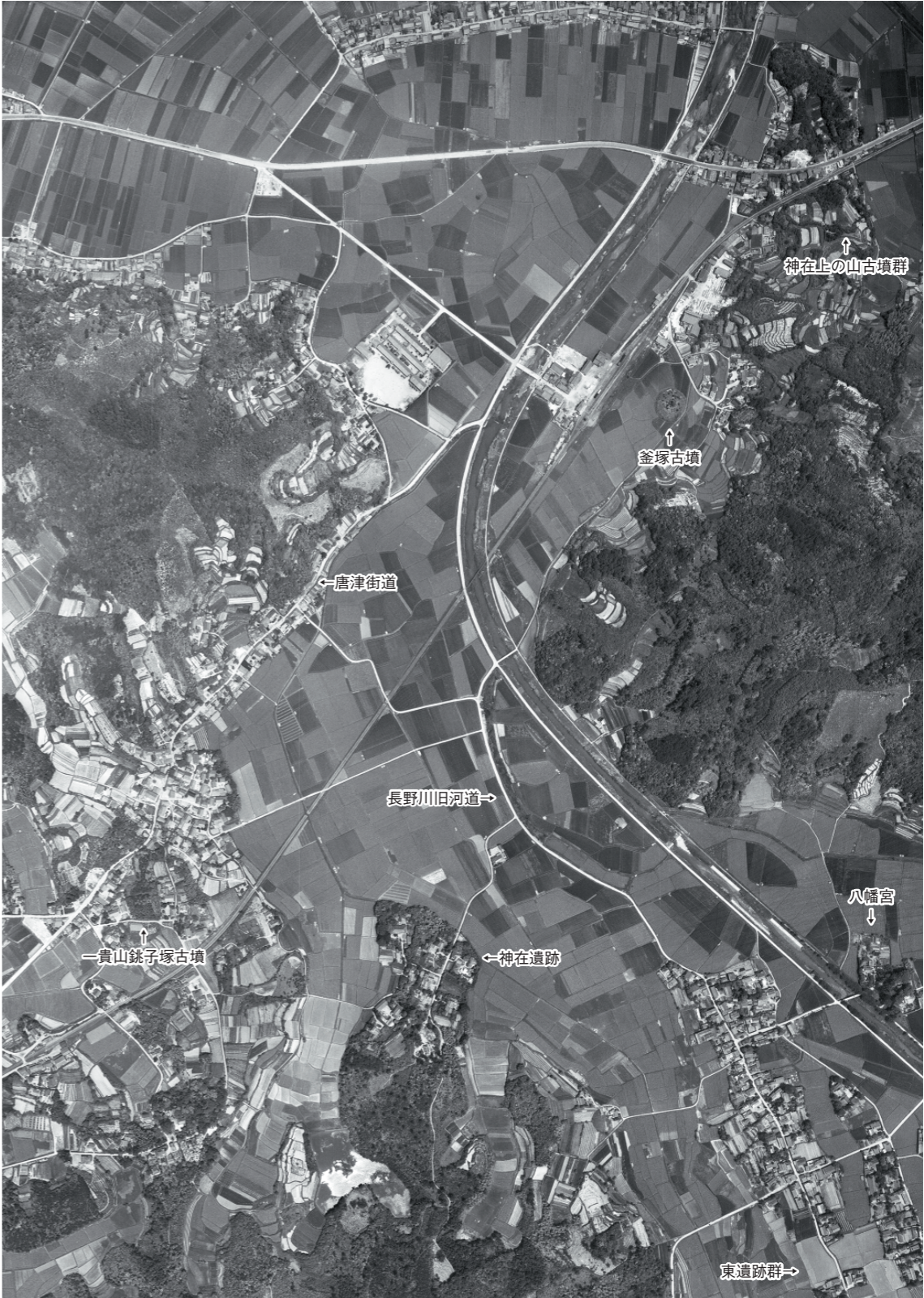
釜塚古墳周辺の航空写真（上が北 1961年）