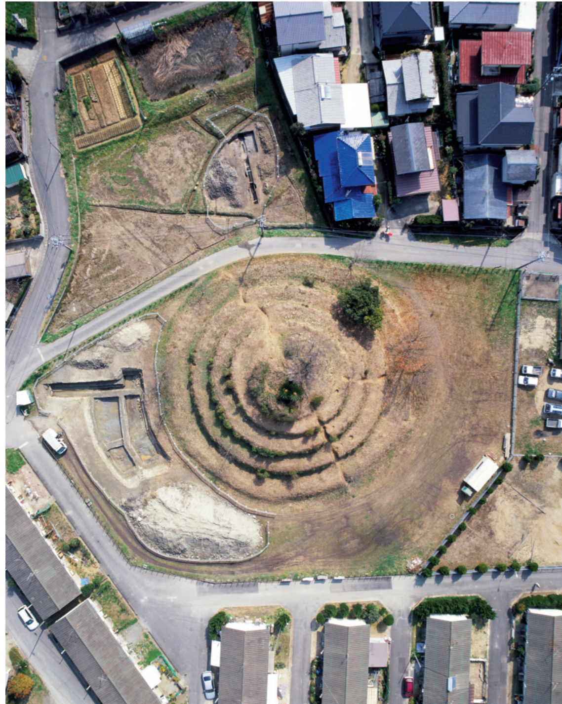
第3次調査 全景（上から 写真上が東）