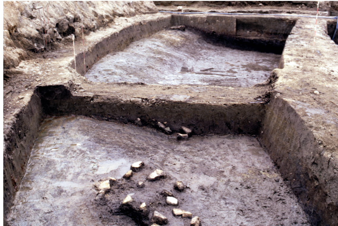
a. 第3次調査 12トレンチ渡り土堤南北縦断壁土層（西から）