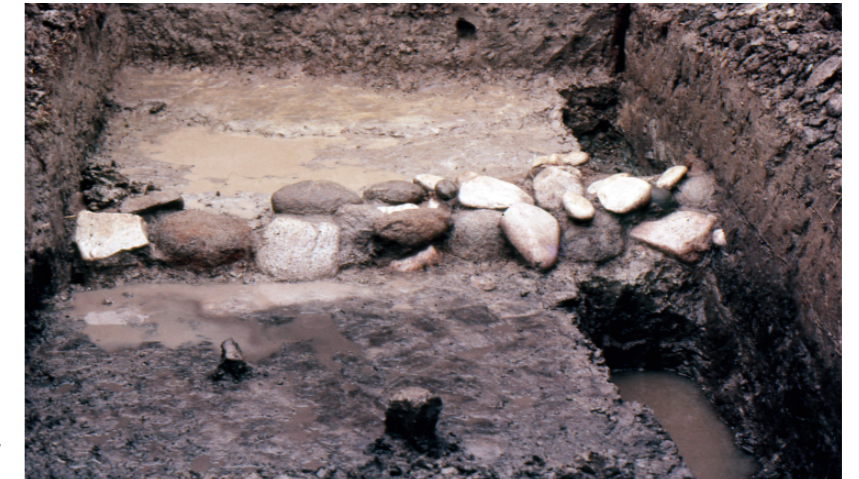
a. 第1次調査 1トレンチ葺石検出状況 （南から）