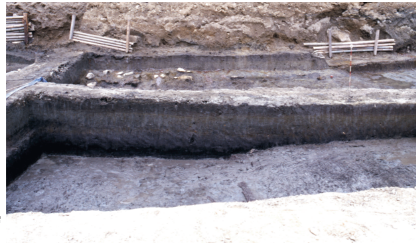
b. 同上 12トレンチ 渡り土堤東西壁東土層 （北から）