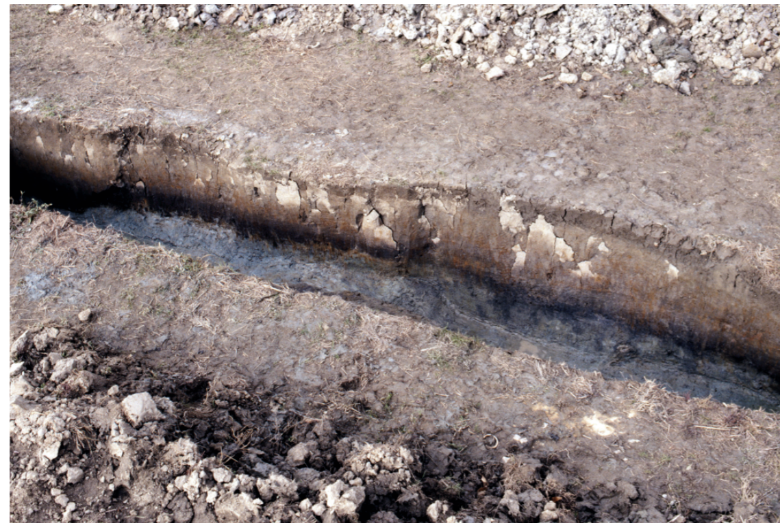
b. 同上 11トレンチ外堤断面（北西から）