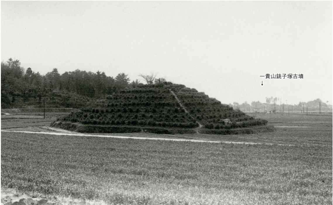
b. 釜塚古墳全景（北から 1950年）