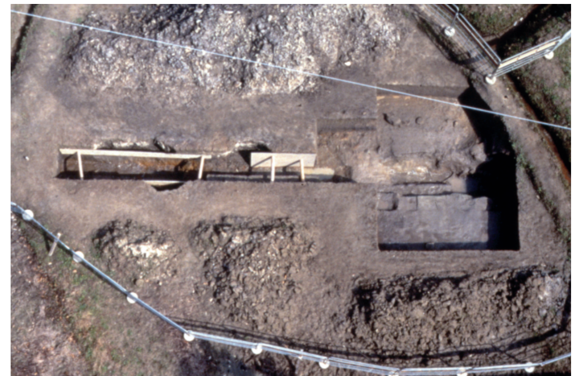
b. 同上 8トレンチ（上から 写真上が北）