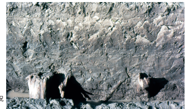
c. 同上 2 トレンチ丸木検出状況 (東から 1973年10月)