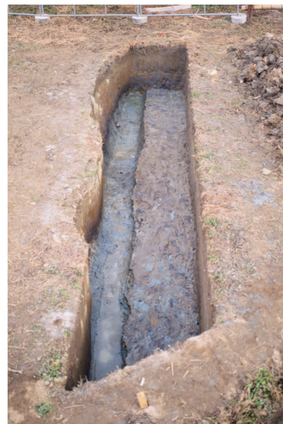
b. 同上 9 トレンチ（西から）