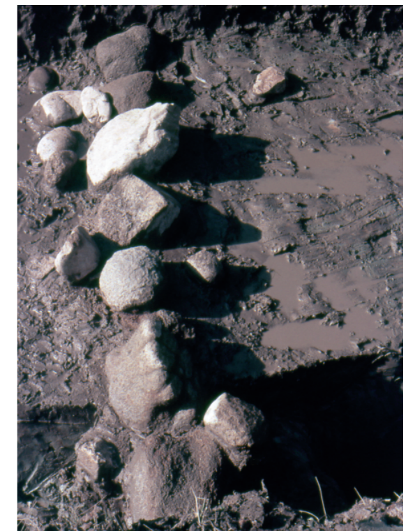
c. 同上 2トレンチ葺石検出状況（東から）