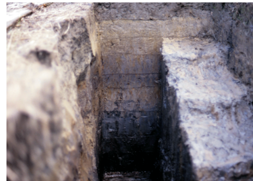
b. 同上 8トレンチ 周濠土層 (東から)