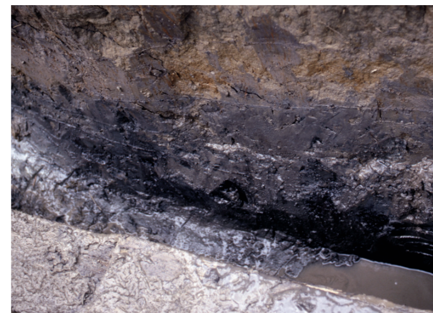
c. 同上 11トレンチ 周濠外縁土層 (北西から)