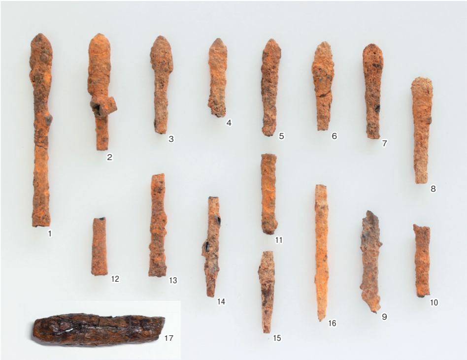
糸島高校附属郷土博物館所蔵の釜塚古墳出土形象埴輪（上）と鉄鍬（下 17は、伊都国歴史博物館蔵の刀子状鉄器）