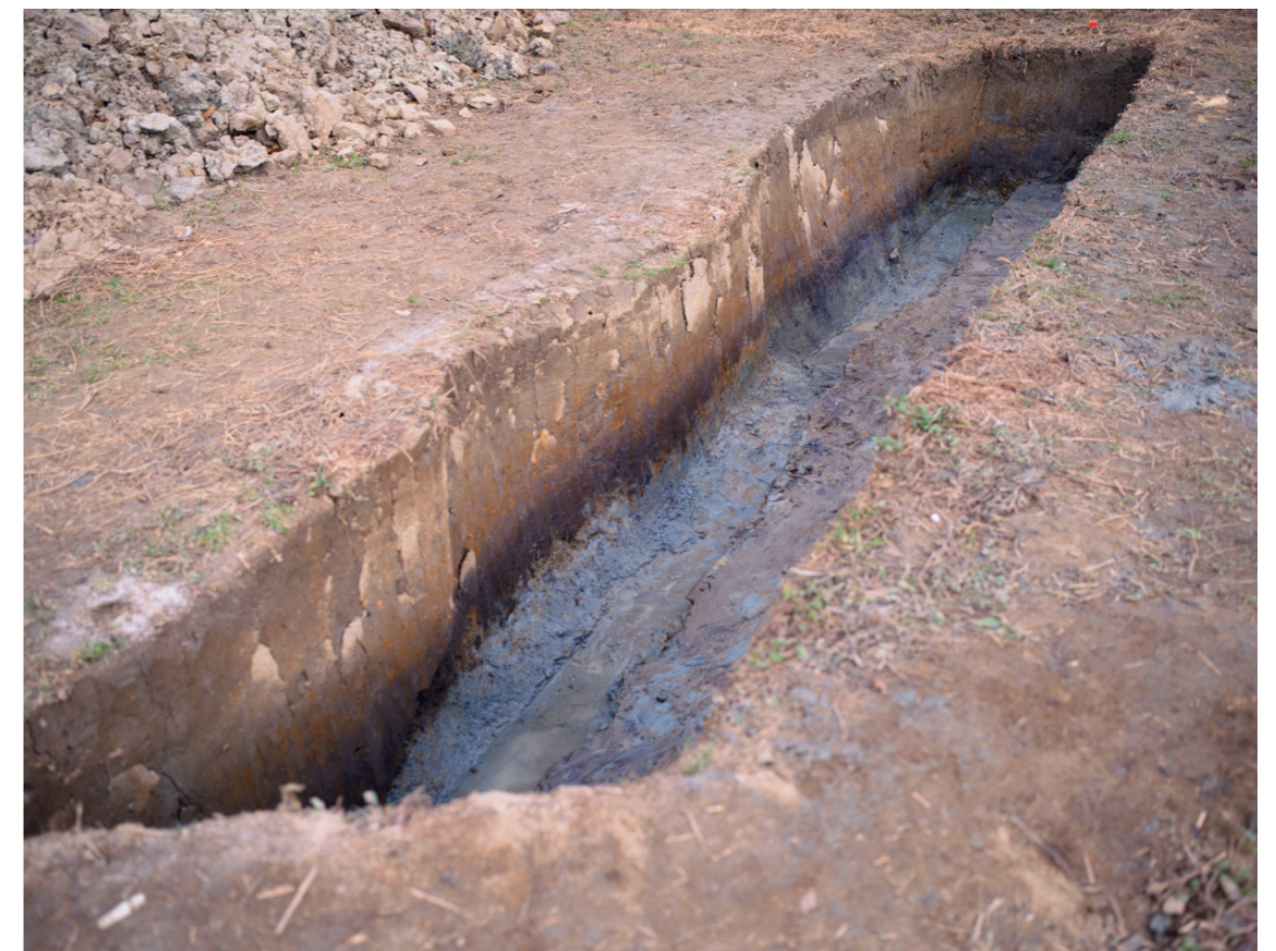
b. 同上 9トレンチ外堤断面（南西から）