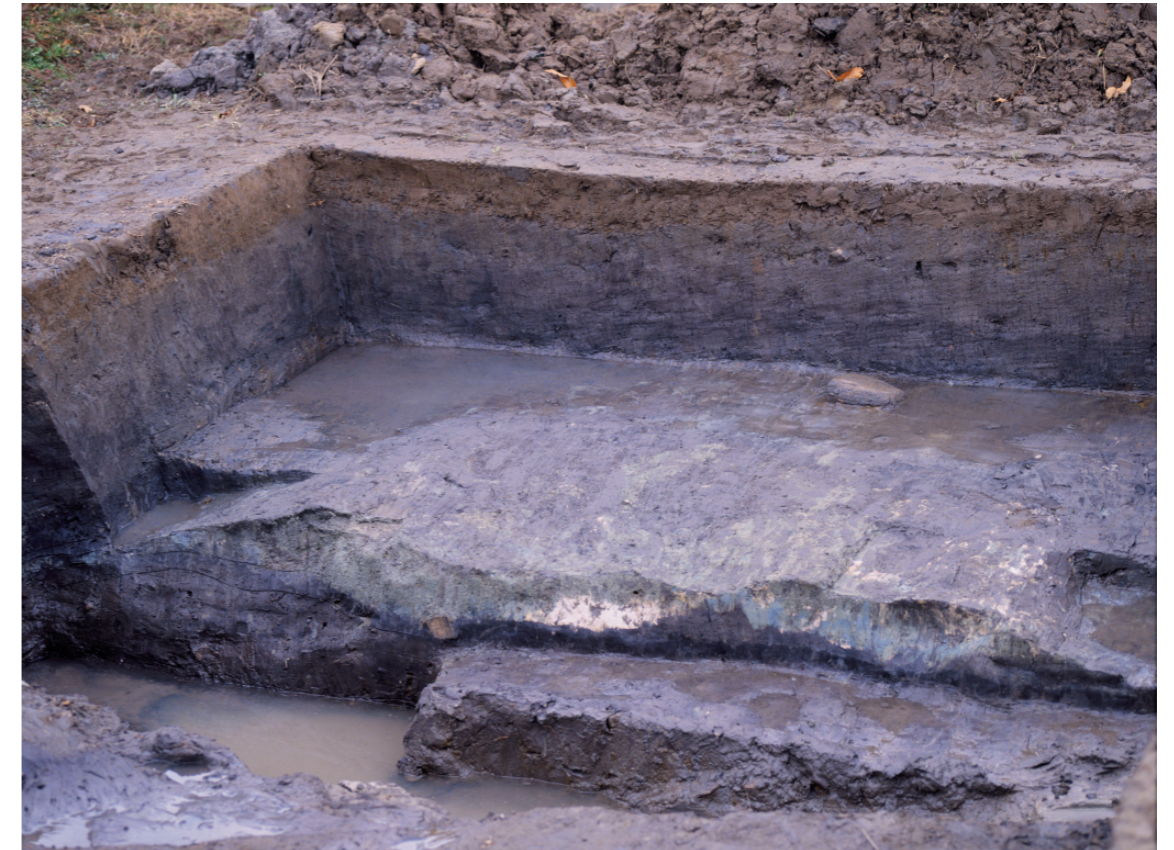
a. 第3次調査 8トレンチ外堤断面（北から）