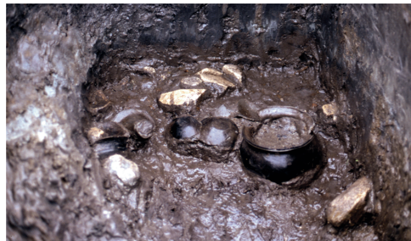
c. 同上 8トレンチ 外堤下土器溜り 遺物出土状況（西から）