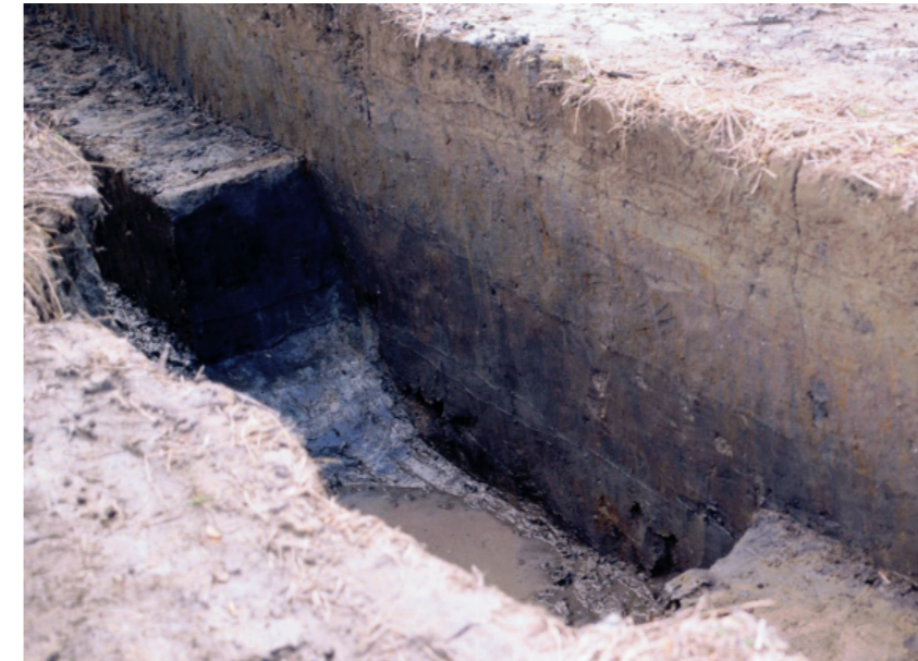
a. 第3次調査 8トレンチ 周濠外縁土層 (北西から)