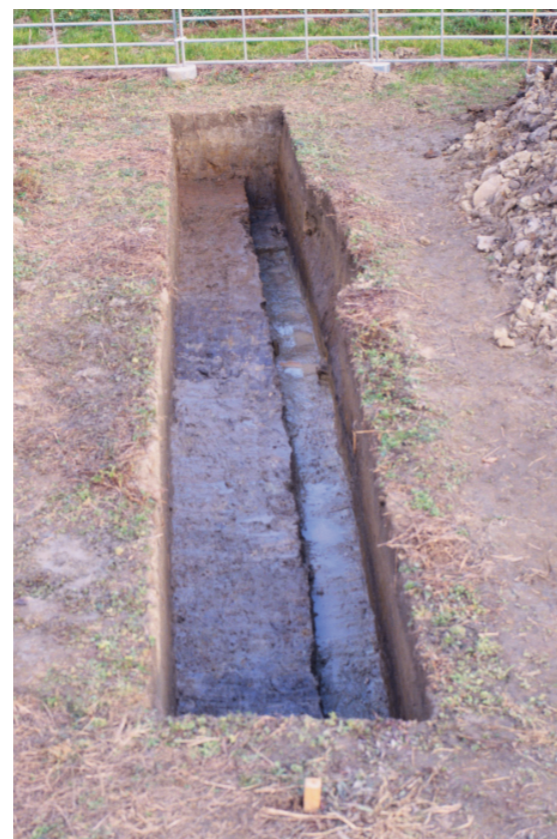
c. 同上 10 トレンチ（西から）