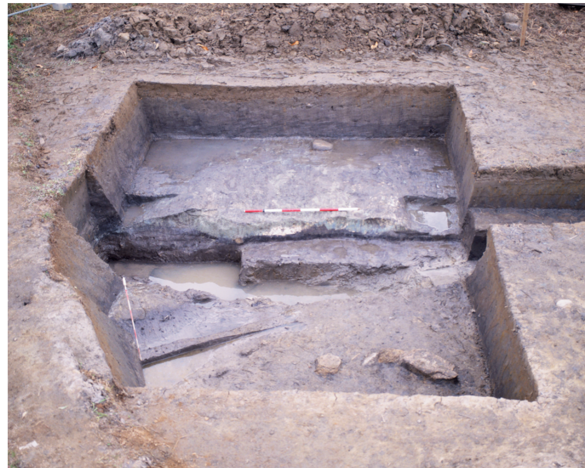
a. 第3次調査 8 トレンチ東拡張区近景（北から）