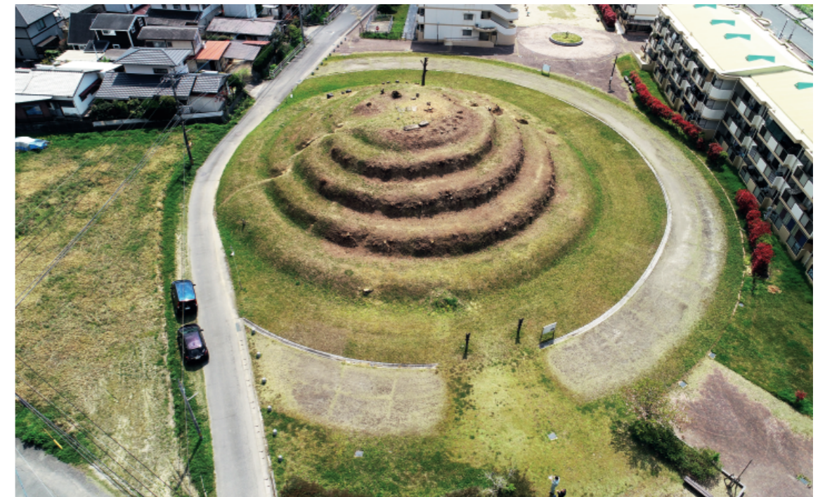
a. 釜塚古墳全景(北から 2019年4月)