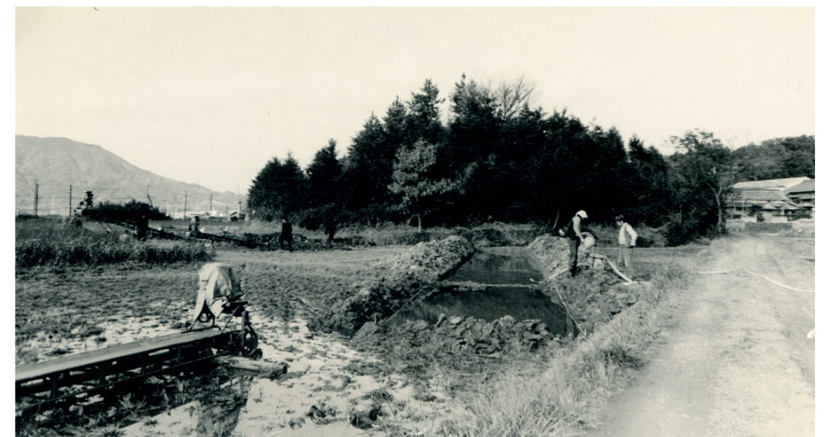
b. 第1次調査 1 トレンチ調査風景 (南から 1973年10月)