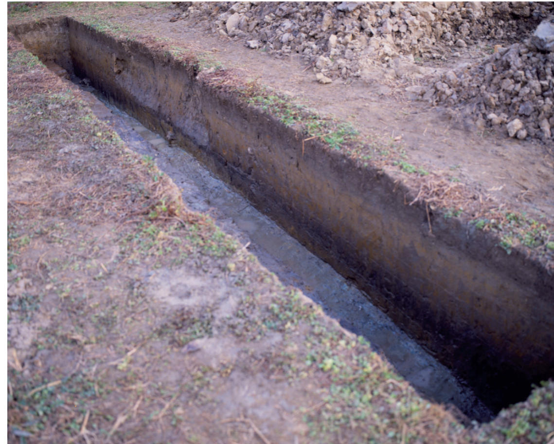
a. 第3次調査 10トレンチ外堤断面（北西から）