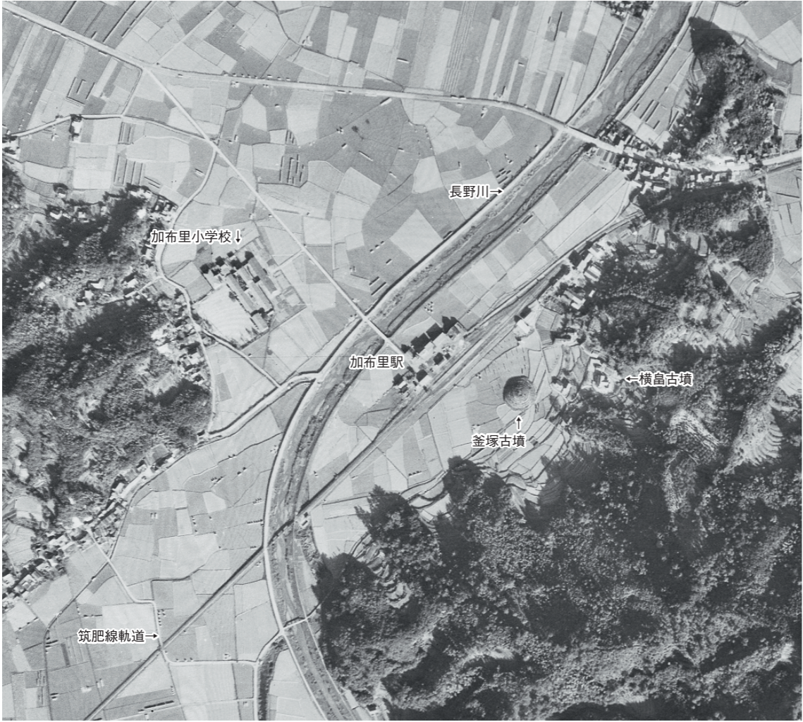
a. 釜塚古墳周辺の米軍撮影写真（上が北 1947年 国土地理院提供）