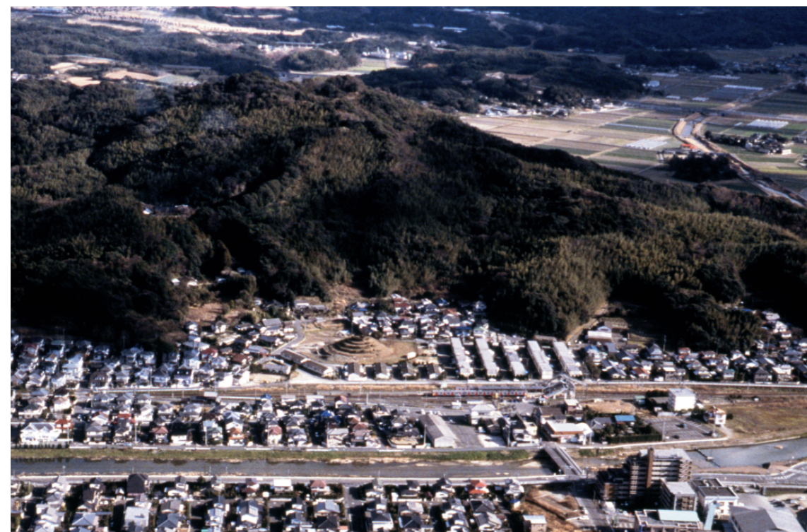
c. 長野川越しに西から釜塚古墳と宮地嶽をのぞむ(2002年2月)