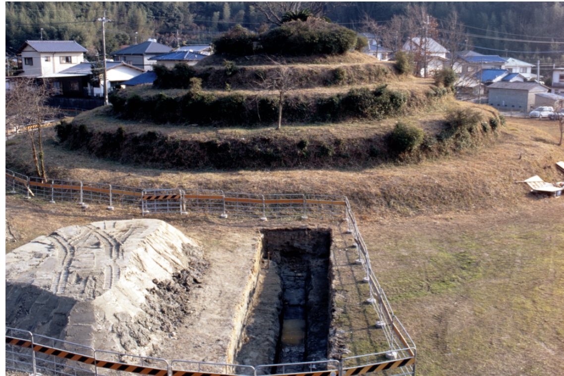
a. 第3次調査 13トレンチ (北から)