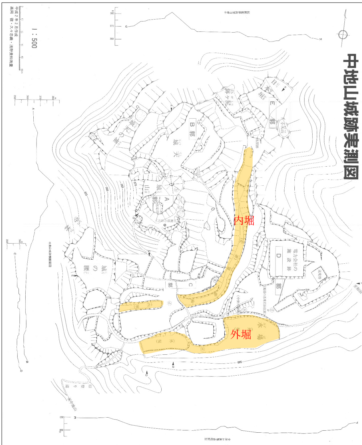
図4. 中地山城跡縄張り図 (高岡 1990 に加筆)