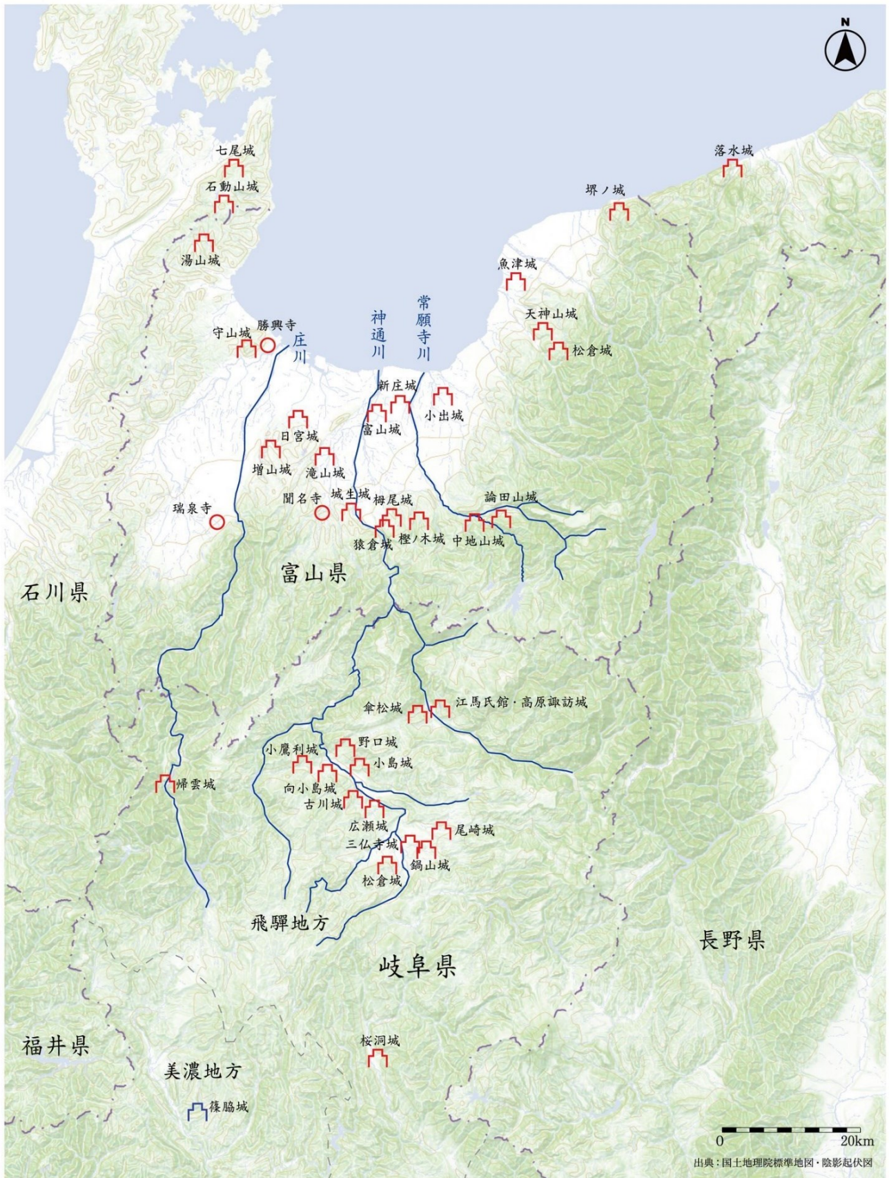
図1. 戦国時代の飛越主要城館等位置図