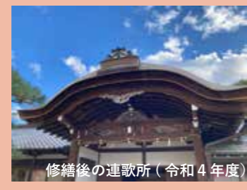
修繕後の連歌所（令和4年度）

岡天満宮の社務所は、大正時代に建てられたもので、かつては連歌所として使われた。市有形文化財に指定されており、市・府の補助を受けて屋根の葺き替えを行った。京都府では、指定の有無にかかわらず、文化資源を活かして地域活力の向上を目指す事業に対しての補助制度もある。