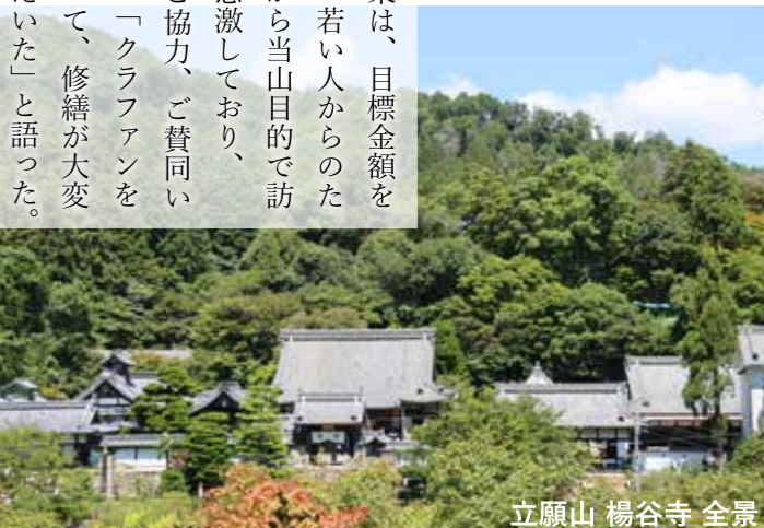
立願山 楊谷寺 全景

第三十一世住職。花手水をはじめアートやSNSなど、次の世代に向けた様々な取り組みにより幅広い世代から愛される寺院へと奔走中。