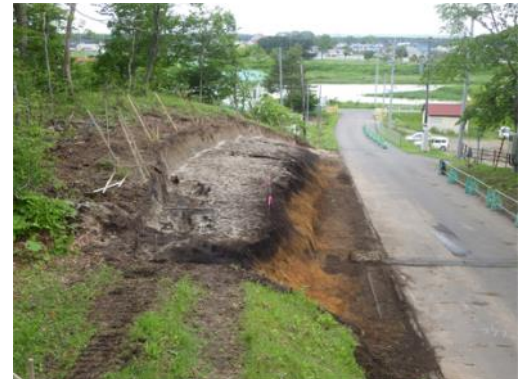
調査区全景（東から撮影・写真奥は厚真川）

今回の発掘調査で特筆すべき成果はアイヌ文化期のウバガイを伴う遺物集中です。調査区東端部の台地平坦面に位置し、調査区外へも広がっていますが、確認できた平面規模は長軸約2m、短軸約1mの範囲にわたってウバガイ集中を検出しています。貝殻は全て破砕されており、殻頂部で確認できた最少個体数は32個体で、推定個体長は概ね11～12cmの貝殻と思われます。検出層位は有珠b火山灰（1663年降下）から1～2cm程度黒色土を被覆しており16～17世紀前葉にかけての年代が推定できます。ウバガイ集中の下層からは、エゾシカを主体とする頭蓋骨や四肢骨の集中、刀剣類、灰ブロック、ホタテガイ貝殻を検出し、数回にわたる廃棄行為を確認しました。この遺物集中は、アイヌ民俗例の送り場跡と考えられ、厚真川下流域におけるアイヌ民族の歴史を探るうえで貴重な発見例と言えます。