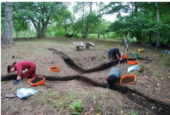
令和3年度竪穴調査状況