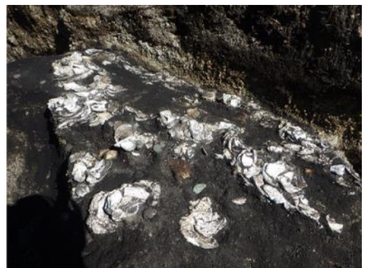
ウバガイ集中（アイヌ文化期）