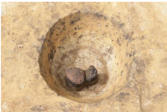
底に礫が置かれた土壌

また、土壌の中には礫を大量に敷き詰めたり、大きな礫を壙底に置いたり、土壌の上に礫をのせているものなどがあり、主に石器が見つかっています。土器の破片と一緒に置かれていたものもあり、主に縄文時代晩期頃のものでした。発掘区からは縄文時代中期～晩期の土器や石器が見つかっています。