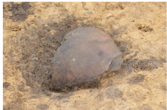
発掘区から見つかった土器の破片