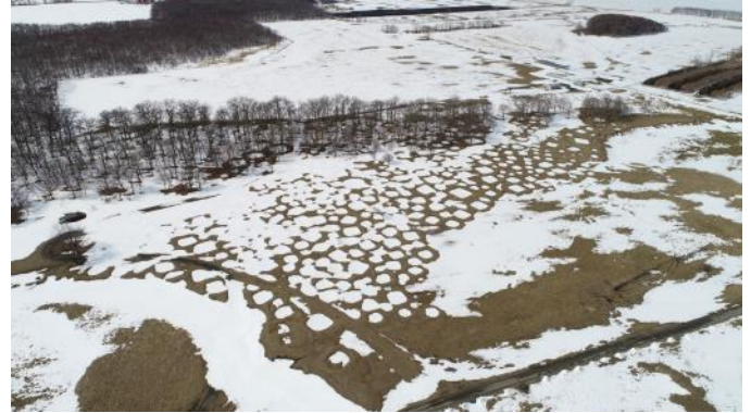
写真1：シブノツナイ堅穴住居群 全景

今年の調査成果として、発掘調査概要報告書を令和4年3月末に刊行予定です。発掘調査は来年度も同程度の規模で実施する予定です。