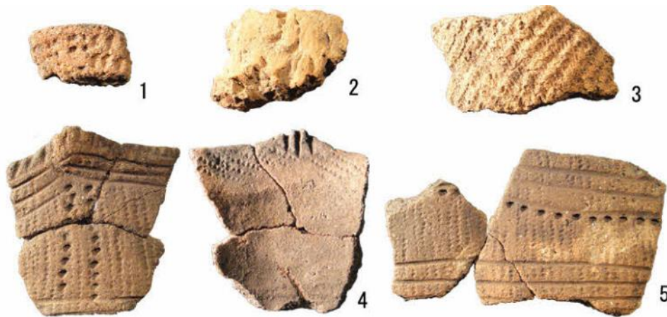
1 ピット出土 2～5 包含層若しくは風倒木痕出土 4・5は同一個体