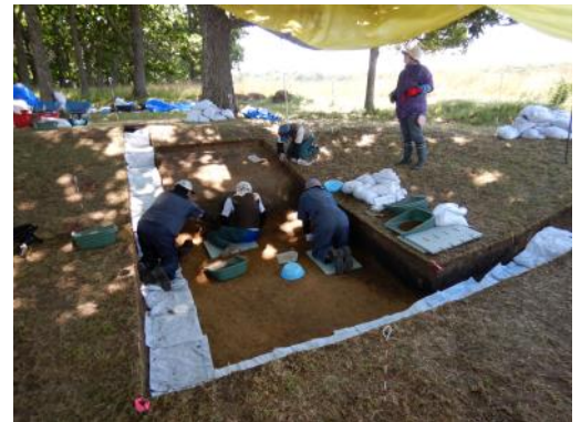
写真2：堅穴住居跡の発掘風景