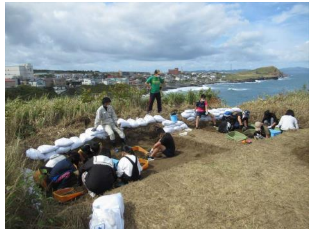
体験発掘授業のようす