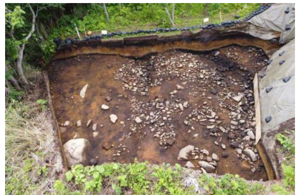
Ⅴ層完掘状況（東から）