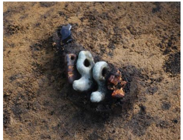
土壌から出土した勾玉と琥珀玉