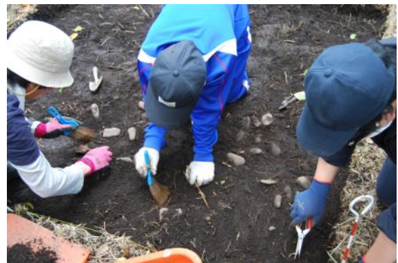
令和3年度高校生による調査状況