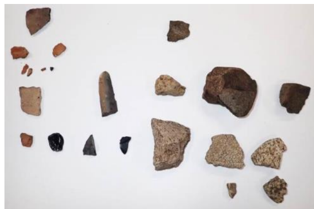
柏原65遺跡出土資料（一部）