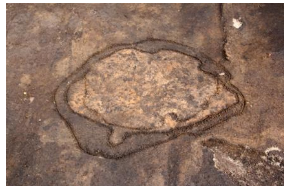
焼土（中世アイヌ文化期）