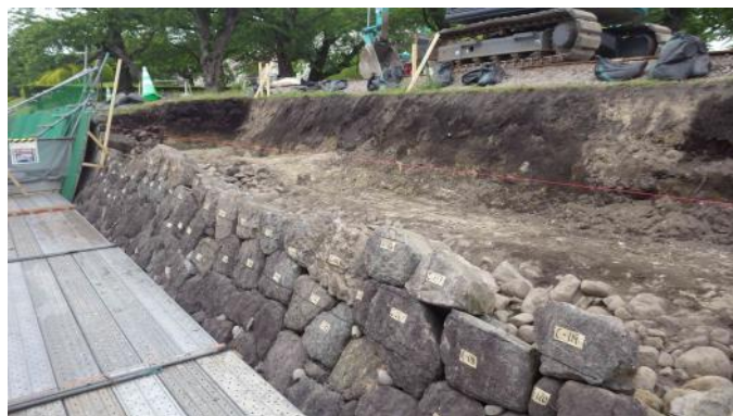
堀内周南側石垣の解体

調査の結果、地山を掘り込んで栗石による裏込め層を構築し、その前面に空積みにより積石を積んで石垣を築いていたことが確認されました。なお幕末期の石垣構築に伴う石垣以外の遺構の検出や、当該期に属する出土遺物はありませんでした。