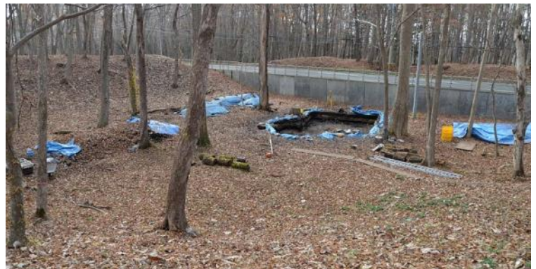
キウス2号周堤墓発掘区遠景（北東から）