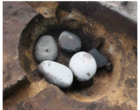
大型礫が埋納された土壌

土壌は直径約60～80cmのものが多く、長径1.1mを超える楕円形の土壌（写真）からは安山岩の大型礫等がいくつも配され、その中には台石や北海道式石冠が含まれていました。土器は全体的に縄文時代中期のものが多く、縄文時代早期～擦文時代の土器も出土しました。今年度の調査成果は、他2か所の調査成果とあわせて令和4年度に報告書を刊行する予定です。