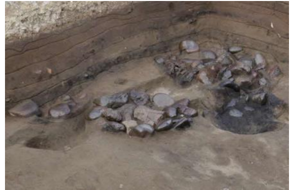
集石炉検出状況（南東より）

なお、来年度以降も隣接地で調査を行う計画で、発掘調査の成果については、開発予定地内の調査完了後に報告書を刊行する予定です。