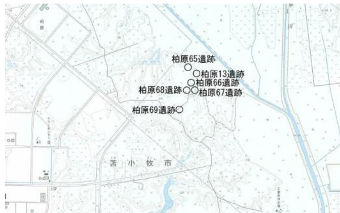
柏原13・65・66・67・68・69遺跡位置図

苫東開発区域内の柏原地区の調査で、新たに柏原65・66・67・68・69遺跡を発見しました。また、柏原13遺跡の範囲を確定しました。遺構として柏原66～69遺跡で落とし穴をそれぞれ1基確認しました。遺物は柏原65遺跡で土器7点、石器等33点、柏原13遺跡で土器10点、石器等14点が出土しています。いずれも縄文時代のものです。報告書は令和5年度に刊行予定です。