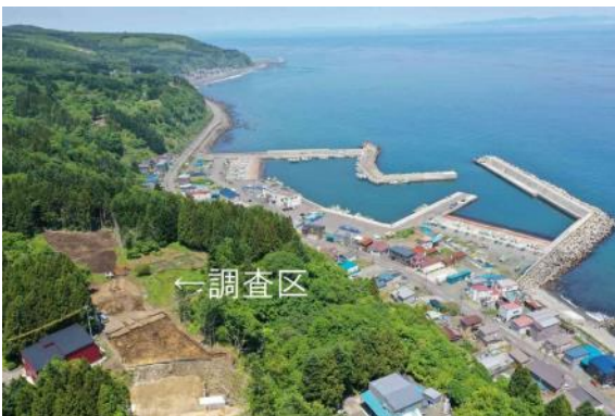
遺跡全景（南東上空から）