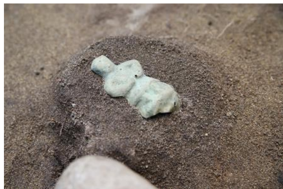
懸仏（毘沙門天）出土状況