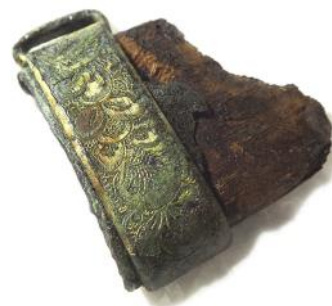
蒔絵金銅装直刀・足金具