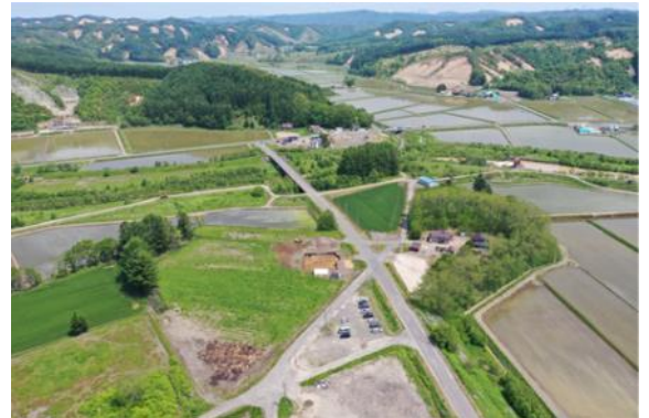
調査区遠景（南から撮影・調査区は写真中央）

樽前c火山灰（約2,500年前降下）より上層の黒色土からは樽前b火山灰（1667年降下）以前の中世アイヌ文化期の焼土1カ所、礫15点が出土しています。焼土からはフローテーション作業の結果、ウグイと思われるコイ科の焼骨片が出土し、サケ科の焼骨片は極僅かで、これまでの発掘調査成果と同様、厚真川流域でのサケ科の遡上、利用頻度が少ないことが判明しています。炭化種子も回収でき、ブドウ科やコナラ属の野生種のほか、アワ、キビ、オオムギ、ムギ類が確認されています。オオムギはオホーツク文化期以降に大陸からの由来とされる短粒形裸性オオムギであり、注目に値する試料が得られています。