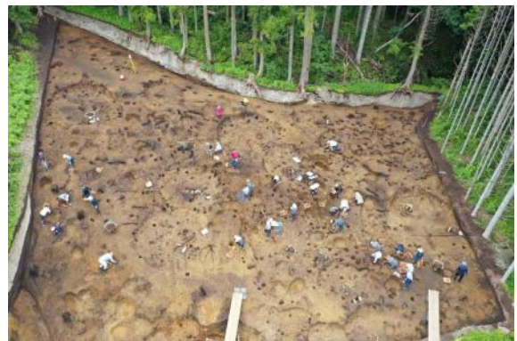
作業風景（南東上空から）