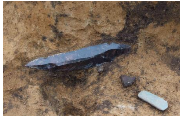
長さ約30cmもある大型剥片石器

土器は全体的に縄文時代晩期～続縄文時代初頭のものが多く、縄文時代中期の土器も出土しました。今年度の調査成果は、他2か所の調査成果とあわせて令和4年度に報告書を刊行する予定です。