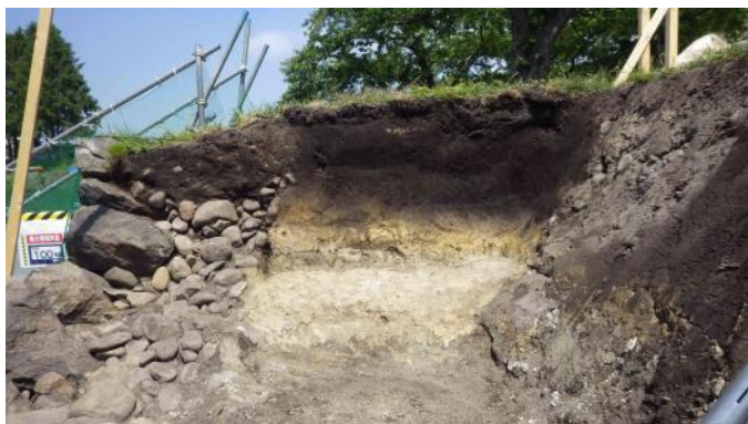
石垣背面の土層堆積