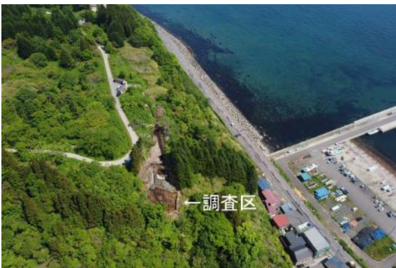
調査区遠景（南から）

Ⅴ層の調査で検出した遺構は、焼土3カ所、剥片集中2カ所です。Ⅴ層の地形は山側から海側方向へと沢状の窪地が2条調査区内を横断しており、大小無数の礫が調査区を覆っています。遺物は約1,300点出土しました。土器は根崎式、中茶路式、東釧路Ⅳ式などが出土し、それぞれがまとまって出土しています。石器は石鏃、つまみ付ナイフ、石斧、擦石、石皿、砥石などが出土しています。集落本体の様子はわかりませんが、調査区は作業場的な空間とみられます。