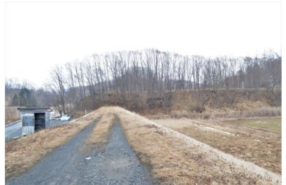
湯の沢川1遺跡遠景

軽石層で完結しており、軽石層直下の安定した土層を底面とします。覆土は、土壌の混じった軽石を主体とする内容物であり、細かい木炭に混じって、炭化した堅果類も出土しました。このほか、編み物石と推定される、長さ5cm前後の細長い礫も複数出土しています。年代を特定できる遺物の出土はありませんでしたが、竪穴状遺構は樽前a及び駒ヶ岳c2に相当する軽石に覆われていることから、遺構の年代として、1667年～1694年の範囲内、およそ17世紀後半に位置付けられました。この他、樽前b軽石層直下の土層から、骨片が出土していますので、樽前b軽石が降下する以前にも、生活域が形成されていたものと考えられます。そこで、より古い時代の文化層を確認するため、サブトレンチを掘削したところ、シルト層の中から黒曜石のチップ2点に加え、集石を1基検出しました。集石は、7個の礫がC字状に配されているようにみえます。灰や焼土の検出はありませんでした。