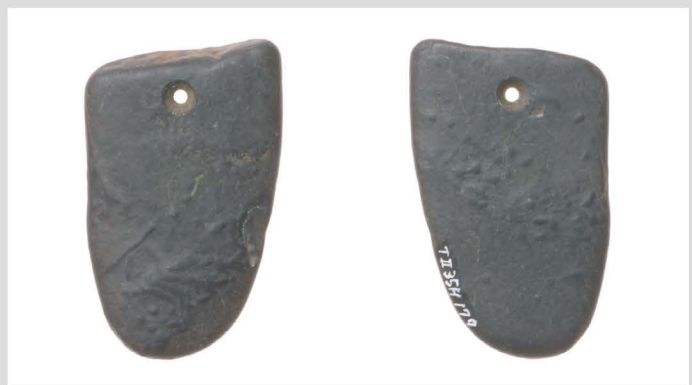
22 quartz clinochlore muscovite