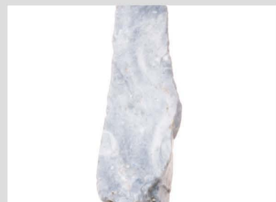
15 真脇遺跡出土石器 3