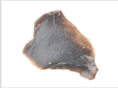
4 玉髓質泥岩原石001 300℃ 2h