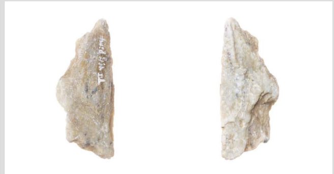
39 clinochlore talc