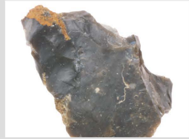
3 玉髓質泥岩原石001 200℃ 2h