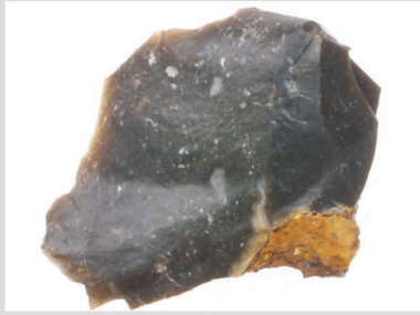
1 玉髓質泥岩原石001 非加熱