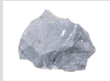
9 玉髓質泥岩原石001 800℃ 2h