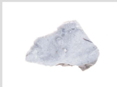
11 玉髓質泥岩原石001 1000℃ 2h