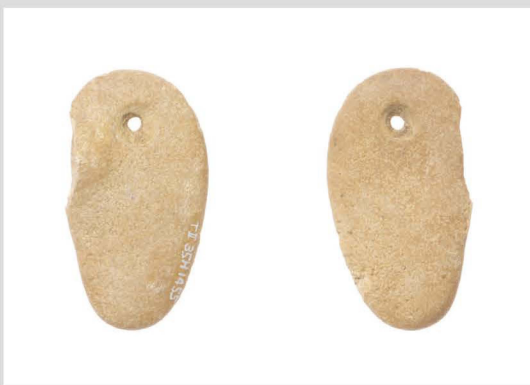
23 quartz kaolinite