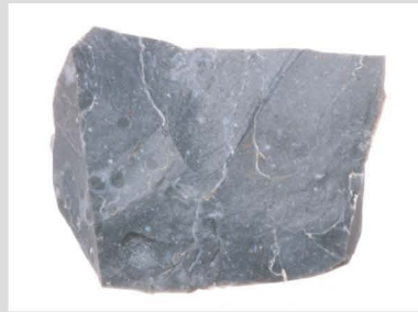
8 玉髓質泥岩原石001 700℃ 2h