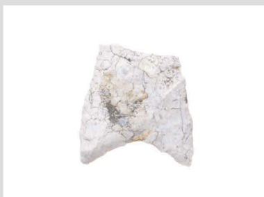
13 真脇遺跡出土石器 1