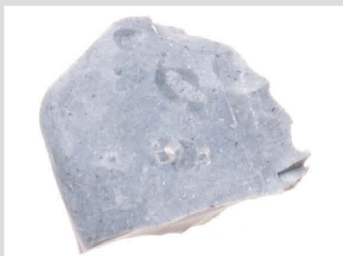
10 玉髓質泥岩原石001 900℃ 2h