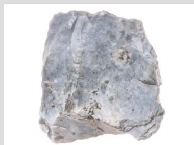
14 真脇遺跡出土遺跡 2