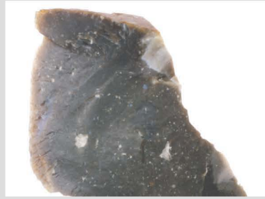
2 玉髓質泥岩原石001 100℃ 2h