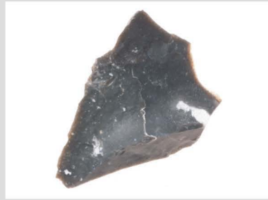
5 玉髓質泥岩原石001 400℃ 2h