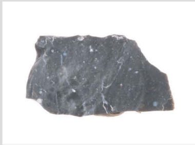
7 玉髓質泥岩原石001 600℃ 2h