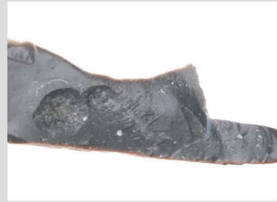
6 玉髓質泥岩原石001 500℃ 2h