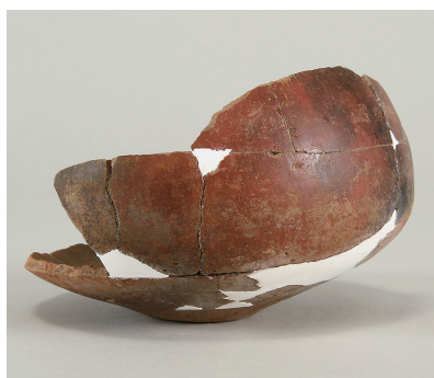
2 第 114 号住居跡出土土師器 (第 253 图 3)