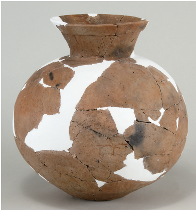
1 第5号方形周溝墓出土土師器 (第259図1)