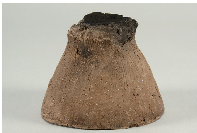
3 東の谷出土遺物 (第 281 図 10)