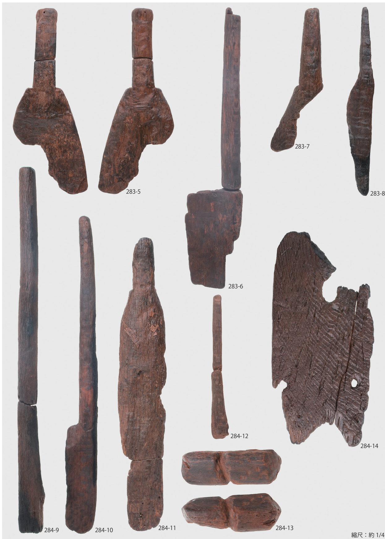
1 東の谷木製品集中地点出土木製品 (第 283・284 図)