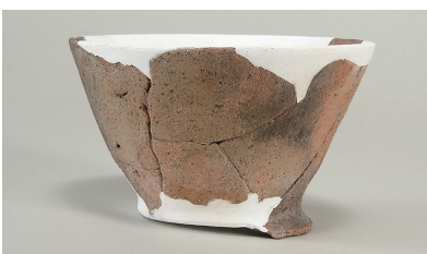
5 第 111 号住居跡出土土師器 (第 248 图 2)