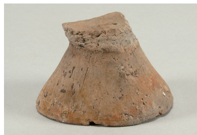
9 東斜面出土土師器 (第 293 図 15)