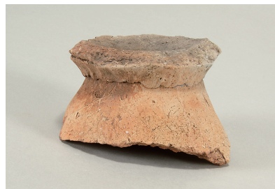
8 東斜面出土土師器 (第 293 図 14)