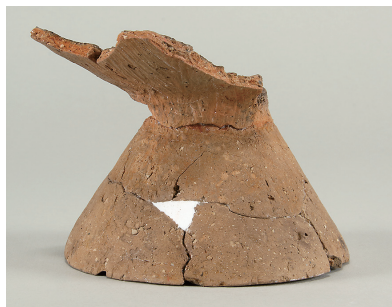
7 第 111 号住居跡出土土師器 (第 248 图 5)