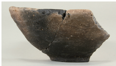
7 東の谷出土遺物 (第 281 図 14)