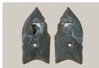
11 西斜面出土磨製石鏃(第294図6)