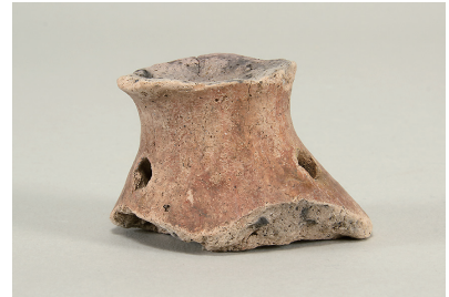
11 東斜面出土土師器 (第 293 図 18)