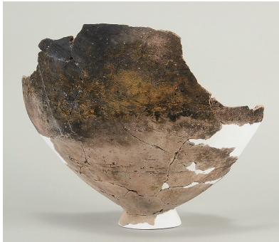
6 第742号土壙出土土師器 (第265図3)