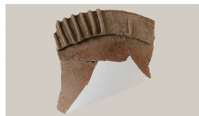
13 東斜面出土土師器(第 293 図 1)