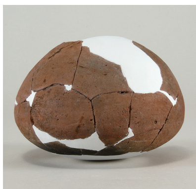
3 第 114 号住居跡出土土師器 (第 253 图 4)