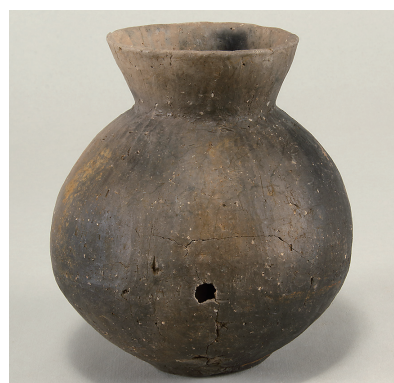
12 第 120 号住居跡出土土師器 (第 255 图 3)