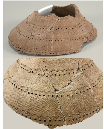
10 東の谷出土土師器(第281図3)