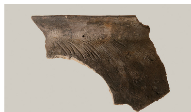
14 第 120 号住居跡出土土師器 (第 255 图 5)