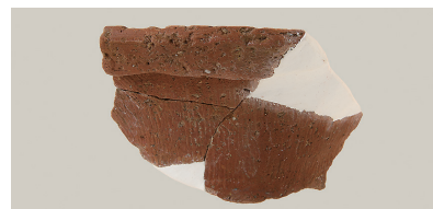
15 東斜面出土土師器(第 293 図 3)