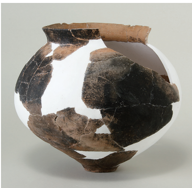
2 第 110 号住居跡出土土師器 (第 246 图 1)