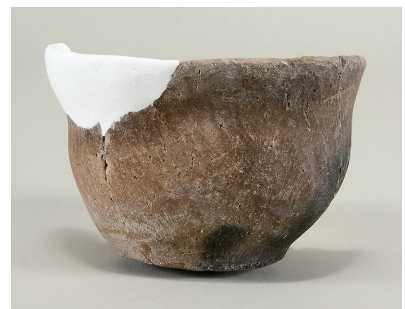
13 東斜面出土土師器 (第 293 図 20)