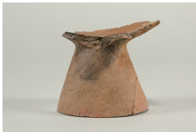
7 第 114 号住居跡出土土師器 (第 253 图 8)