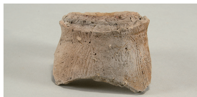
10 第 112 号住居跡出土土師器 (第 250 图 2)