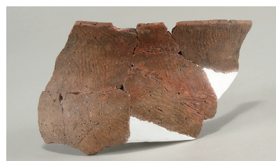
12 北の谷出土土師器(第 292 図 5)