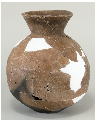
3 西斜面出土土師器(第 294 図 1)