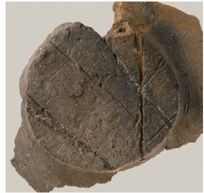
12 第 113 号住居跡出土土師器 (第 251 图 1)