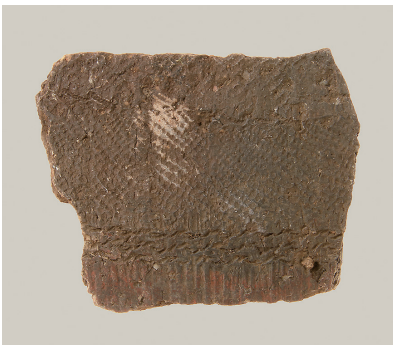
3 東斜面出土土師器(第 293 図 8)