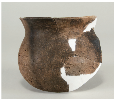
2 東の谷出土遺物 (第 281 図 9)