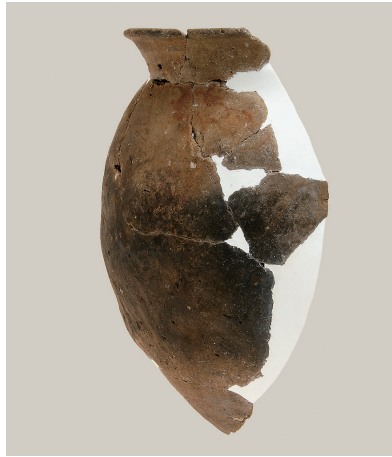
6 第 111 号住居跡出土土師器 (第 248 图 4)