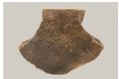
14 東斜面出土土師器 (第 293 図 22)