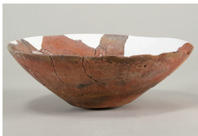
8 第 114 号住居跡出土土師器 (第 253 图 10)