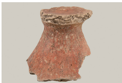
10 東の谷出土遺物 (第 281 図 17)