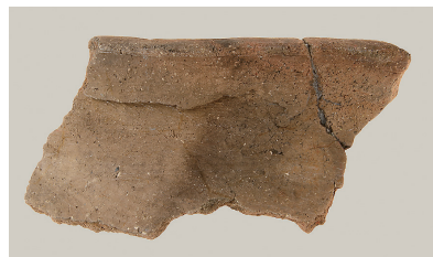
6 東斜面出土土師器 (第 293 図 11)