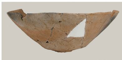
9 第 111 号住居跡出土土師器 (第 248 图 7)