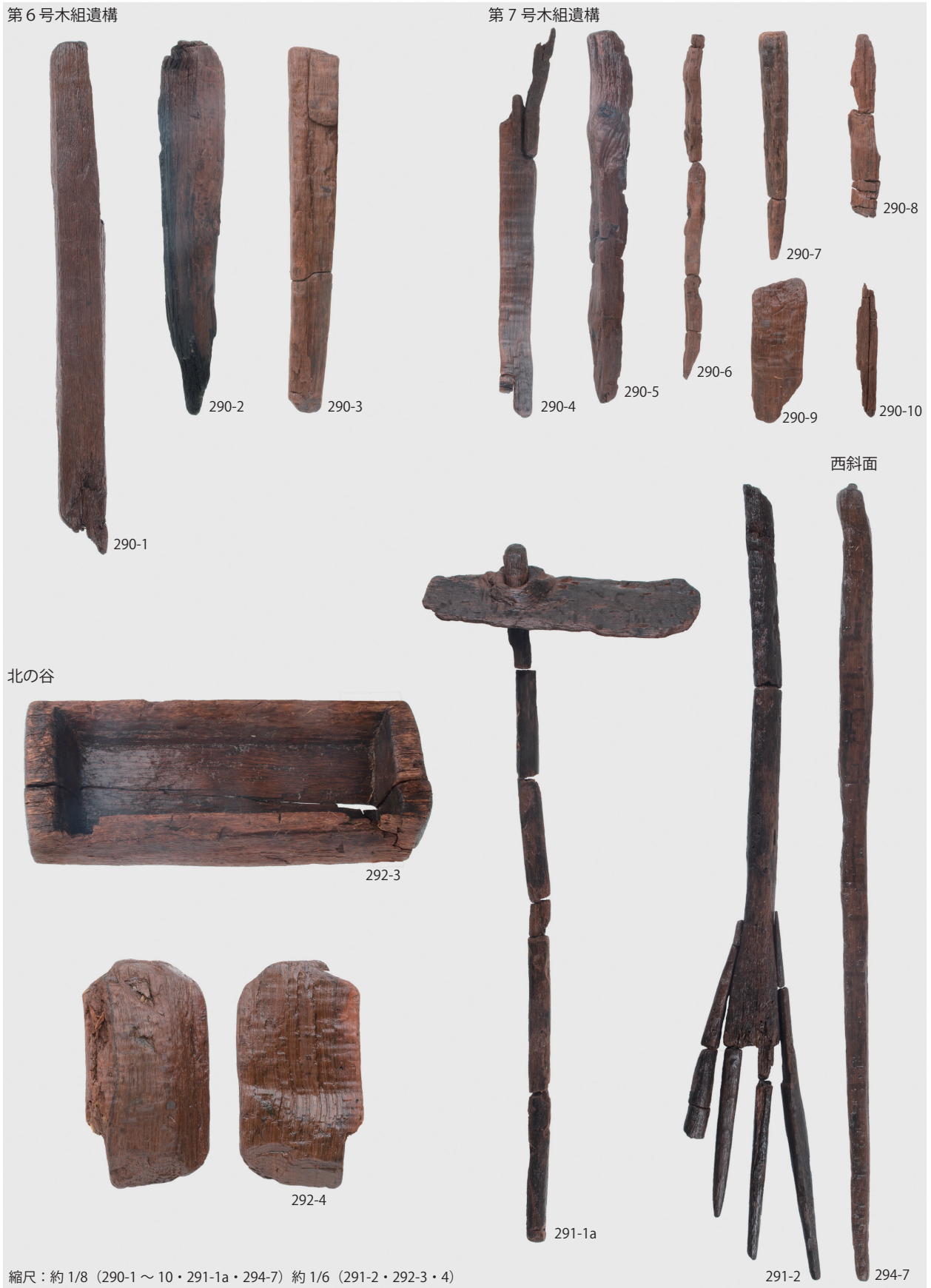
1 第6・7号木組遺構・北の谷・西斜面出土木製品 (第290・291・292・294 図)