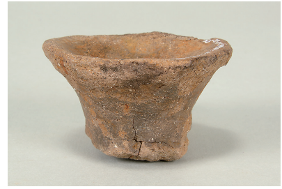
10 東斜面出土土師器 (第 293 図 16)