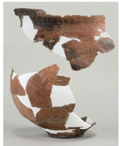
11 東の谷出土土師器(第281図4)