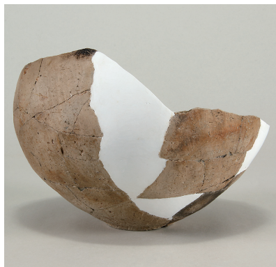
1 第 114 号住居跡出土土師器 (第 253 图 2)