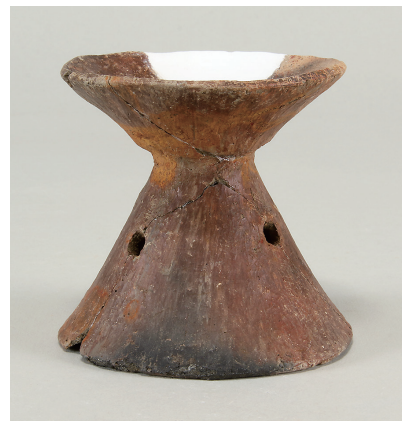
13 第 113 号住居跡出土土師器 (第 251 图 2)