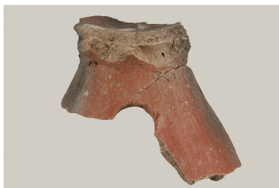
8 東の谷出土遺物 (第 281 図 15)