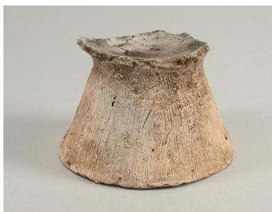
4 東の谷出土遺物 (第 281 図 11)