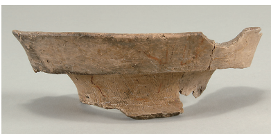
4 第5号方形周溝墓出土土師器 (第259図4)