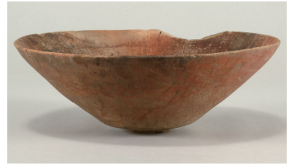
11 第 112 号住居跡出土土師器 (第 250 图 3)