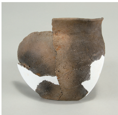
6 第 114 号住居跡出土土師器 (第 253 图 7)