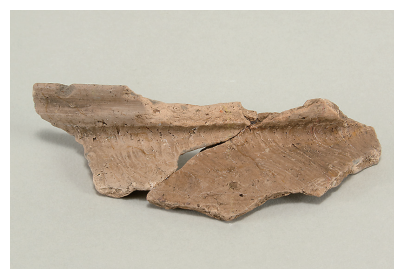
9 遺構外出土土師器(第 295 図 4)