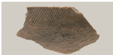
6 東の谷出土遺物 (第 281 図 13)