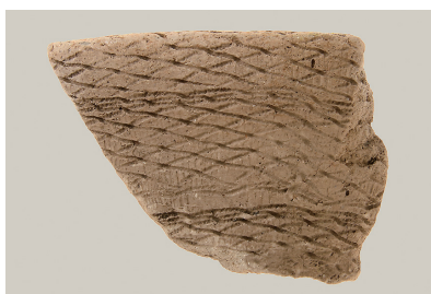
4 西斜面出土土師器(第 294 図 2)