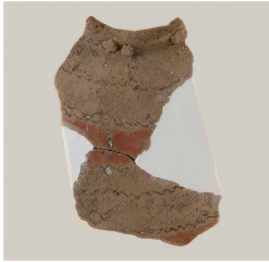
5 東斜面出土土師器 (第 293 図 10)