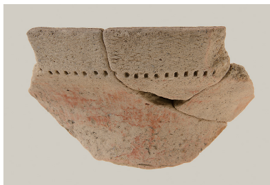
9 東の谷出土土師器 (第281図2)