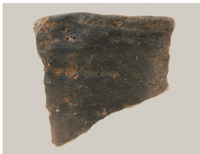
1 東斜面出土土師器 (第 293 図 24)