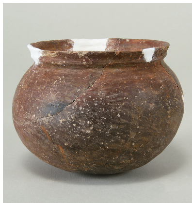
4 第 114 号住居跡出土土師器 (第 253 图 5)