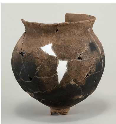
6 西斜面出土土師器(第 294 図 4)