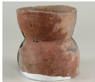
11 東の谷出土遺物 (第 281 図 18)