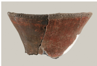
8 東の谷出土土師器 (第281図1)