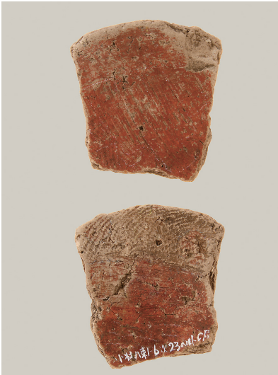
1 東斜面出土土師器(第 293 図 6)