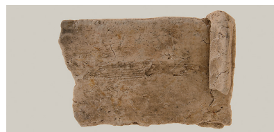
16 東斜面出土土師器(第 293 図 5)