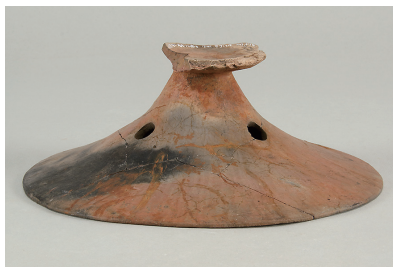
9 第 114 号住居跡出土土師器 (第 253 图 11)