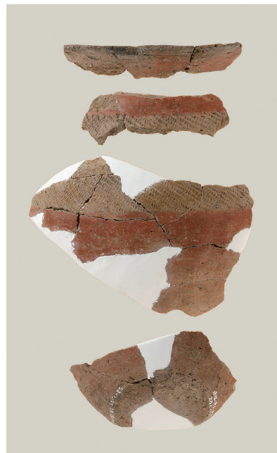
8 遺構外出土土師器(第 295 図 3)