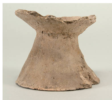
10 遺構外出土土師器(第 295 図 5)