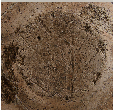
5 西斜面出土土師器(第 294 図 3)