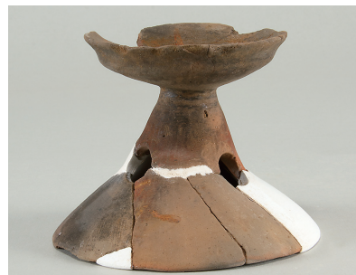
10 第 114 号住居跡出土土師器 (第 253 图 12)