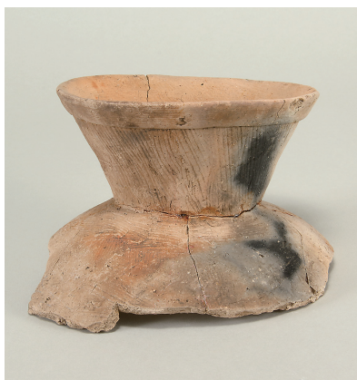
7 遺構外出土土師器(第 295 図 1)