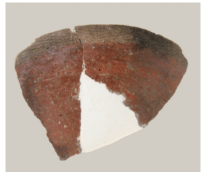
12 東斜面出土土師器 (第 293 図 19)