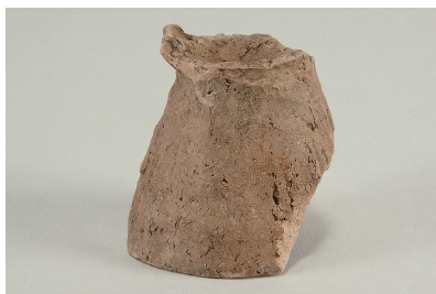
5 東の谷出土遺物 (第 281 図 12)