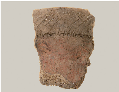
2 東斜面出土土師器(第 293 図 7)