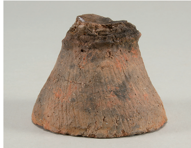
8 第 111 号住居跡出土土師器 (第 248 图 6)