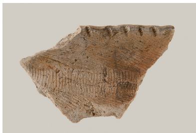
5 第 114 号住居跡出土土師器 (第 253 图 6)