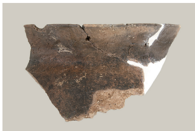
1 東の谷出土遺物 (第 281 図 8)