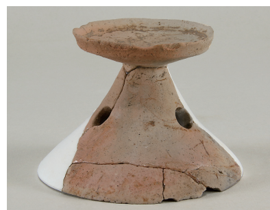
11 第 114 号住居跡出土土師器 (第 253 图 13)