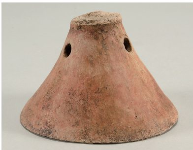
7 第754号土壙出土土師器 (第265図4)