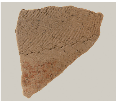
4 東斜面出土土師器(第 293 図 9)