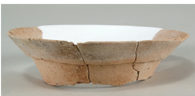
4 第 111 号住居跡出土土師器 (第 248 图 1)