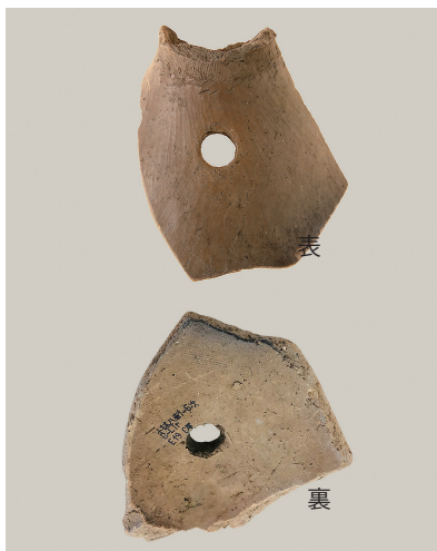
9 東の谷出土遺物 (第 281 図 16)