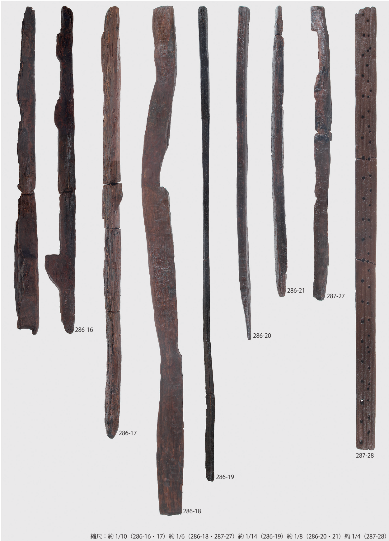
1 東の谷木製品集中地点出土木製品 (第 286・287 図)