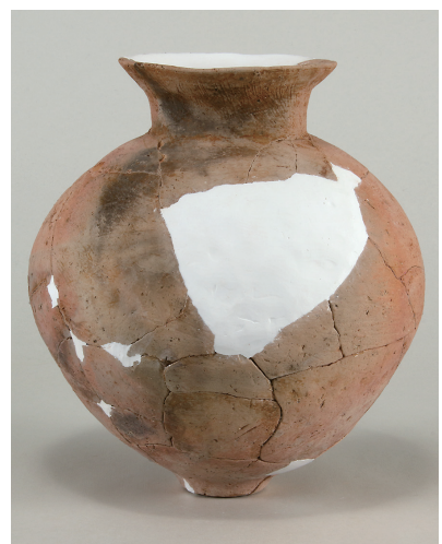
14 第 114 号住居跡出土土師器 (第 253 图 1)