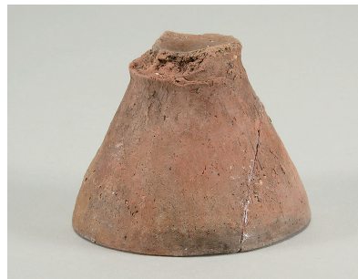
7 東斜面出土土師器 (第 293 図 13)