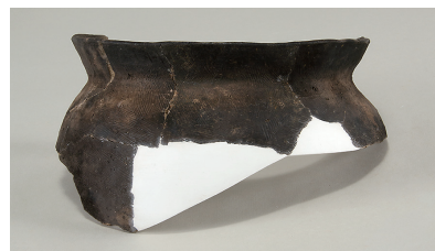
13 第 120 号住居跡出土土師器 (第 255 图 4)