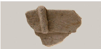
3 第 110 号住居跡出土土師器 (第 246 图 2)