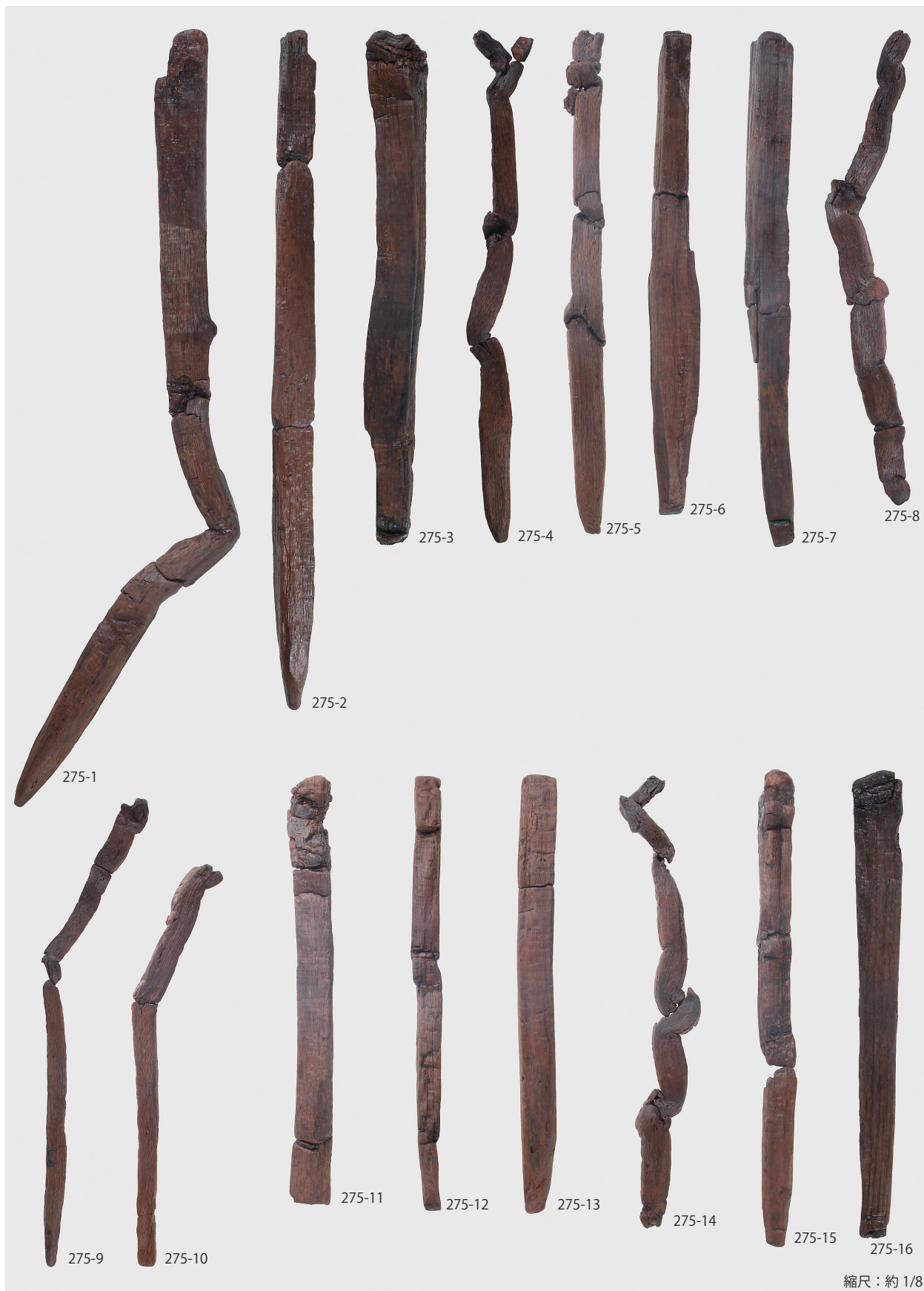
1 東の谷杭列出土木製品 (第 275 図)