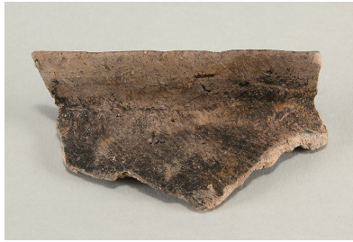
5 第707号土壙出土土師器 (第265図1)