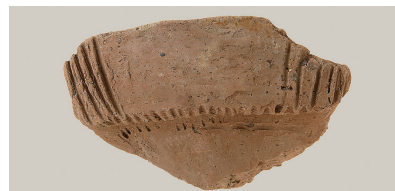
14 東斜面出土土師器(第 293 図 2)