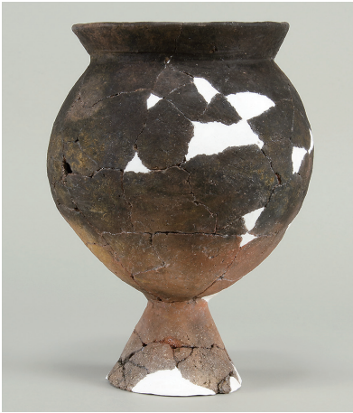
1 第 109 号住居跡出土土師器 (第 245 图 5)