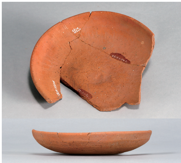
10 第37号住居跡 (第271图6)