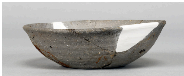
9 第230号溝跡 (第376図71)