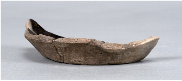
1 第38号住居跡 (第273图16)