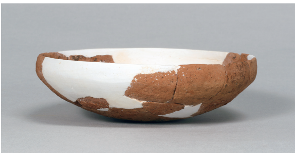
5 第66号住居跡 (第290图1)