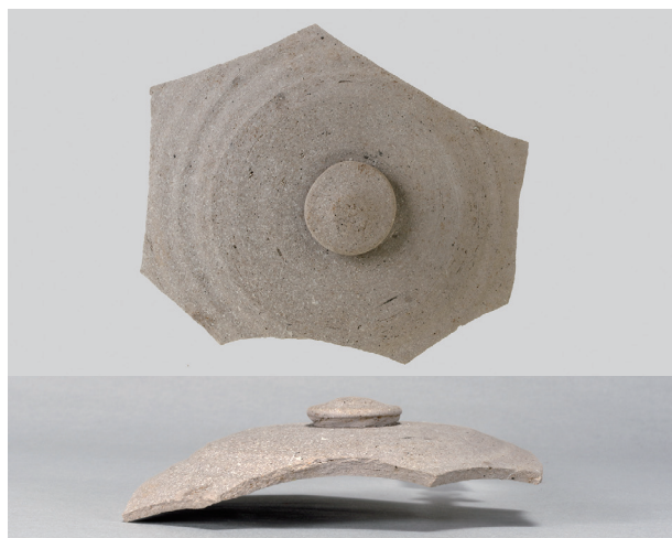
8 第27号住居跡 (第252图1)