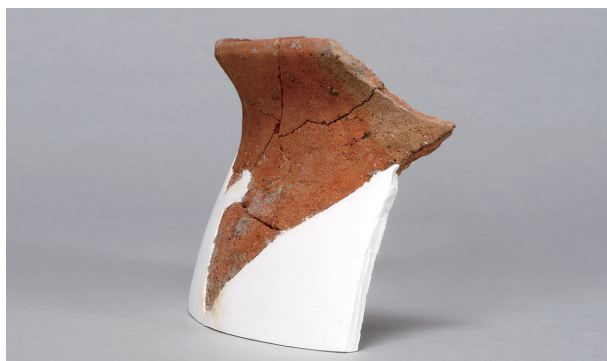
8 第75号住居跡 (第306图116)