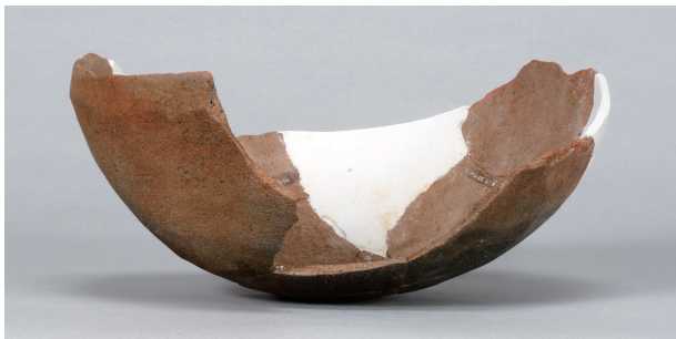
3 第36号住居跡 (第268图58)