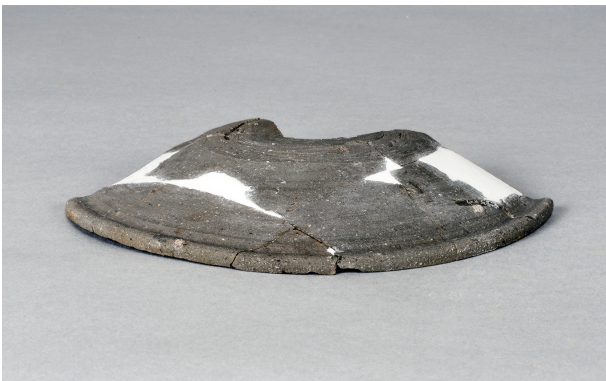
3 第 420 号土壙 (第 404 図 182)