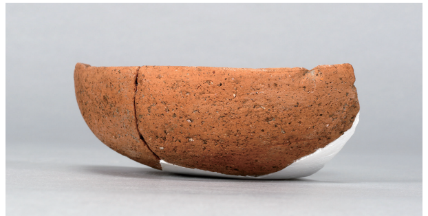
8 第43号住居跡 (第280图1)