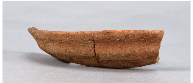
7 第39号住居跡 (第276图13)