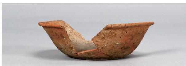
10 第81号住居跡 (第318图2)