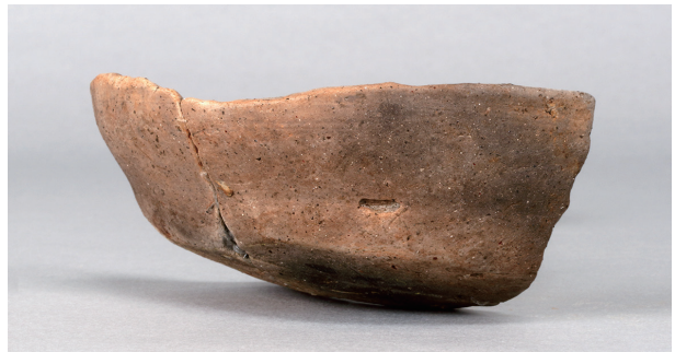
7 第 237 号土壙 (第 400 図 95)