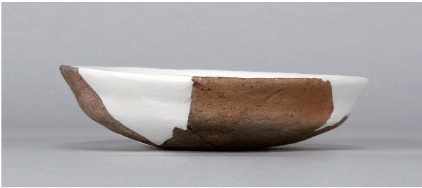
3 第 153 号土壙 (第 399 図 37)