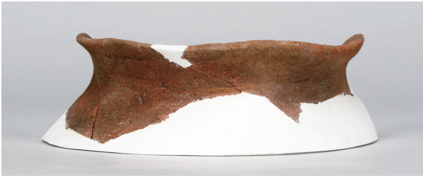
1 第27号住居跡 (第252图41)