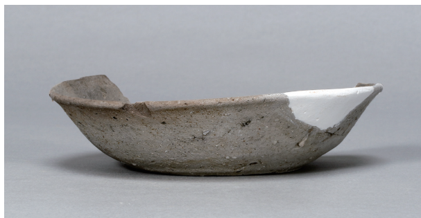
10 第75号住居跡 (第307图150)