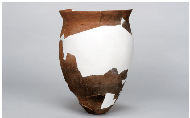
8 第 82 号住居跡 (第 323 図 25)