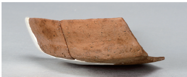
4 第263号土壙 (第401图 117)