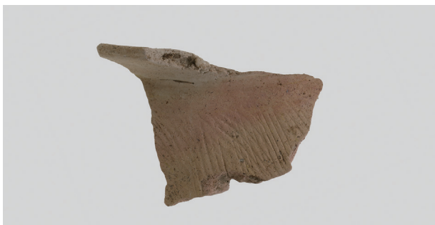
3 第2号住居跡 (第239图54)