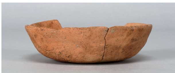
2 第263号土壙 (第401图 115)