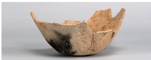
8 第36号住居跡 (第268图70)