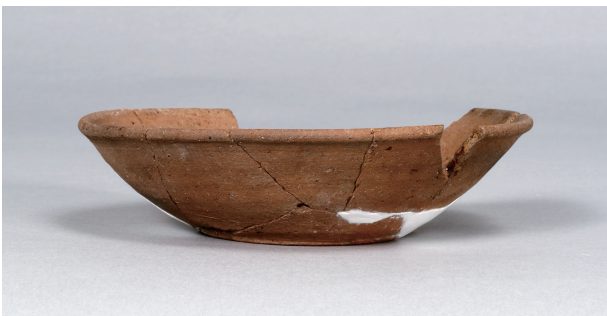
4 第 89 号住居跡 (第 338 図 4)