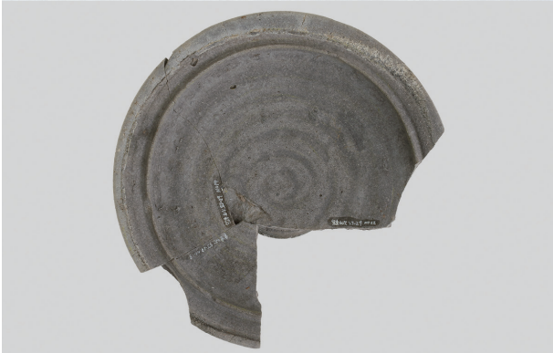
2 第 82 号住居跡 (第 323 図 11)