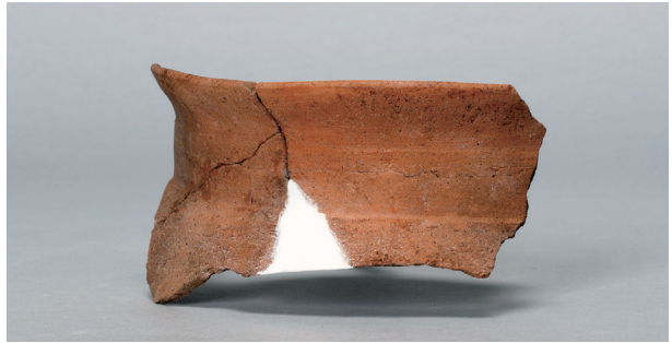
4 第3号住居跡 (第243图42)