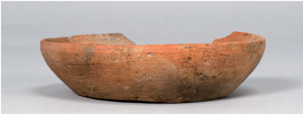
1 第 82 号住居跡 (第 323 図 6)