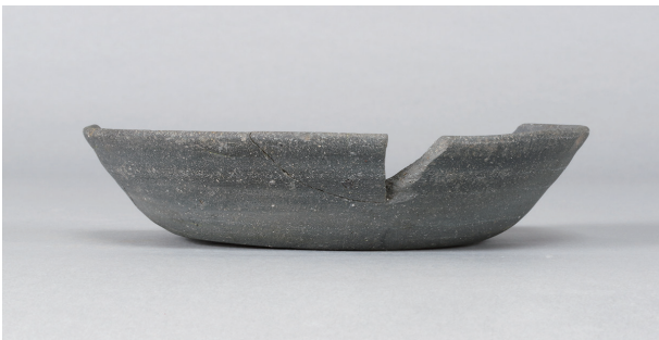
5 第 178 号土壙 (第 399 図 52)