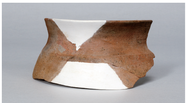
7 第12号住居跡 (第245图8)