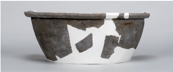
3 第28号住居跡 (第255图1)