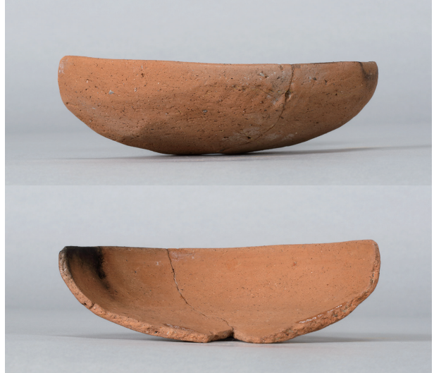
6 第112号井戸跡 (第356図14)