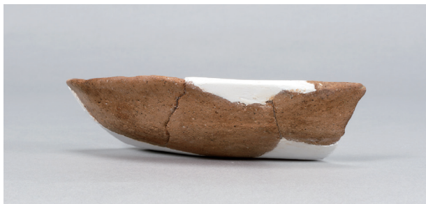
1 第73号住居跡 (第294图26)