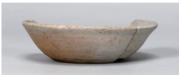
6 第 102 号住居跡 (第 345 図 2)