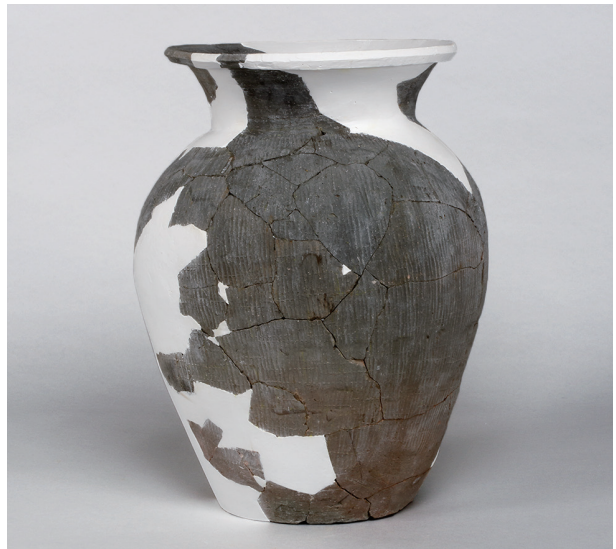
7 第142号井戸跡 (第357図31)