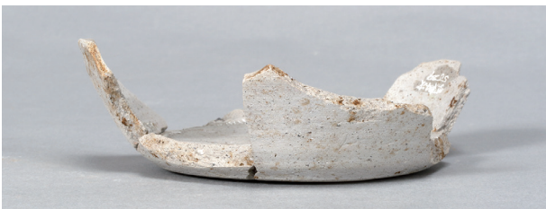
3 第 82 号住居跡 (第 323 図 13)