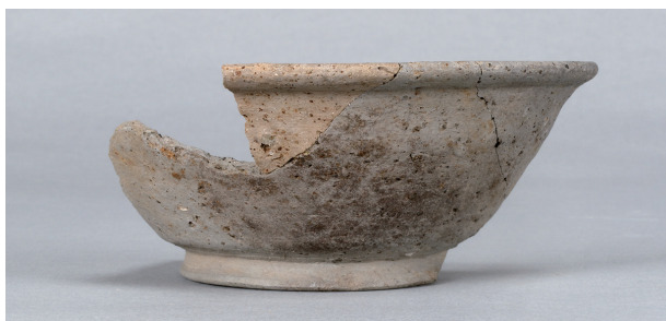
4 第22号住居跡 (第249图10)