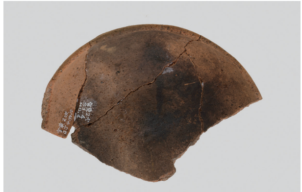
7 第33号住居跡 (第260图4)