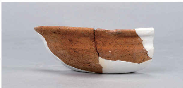
2 第73号住居跡 (第294图27)