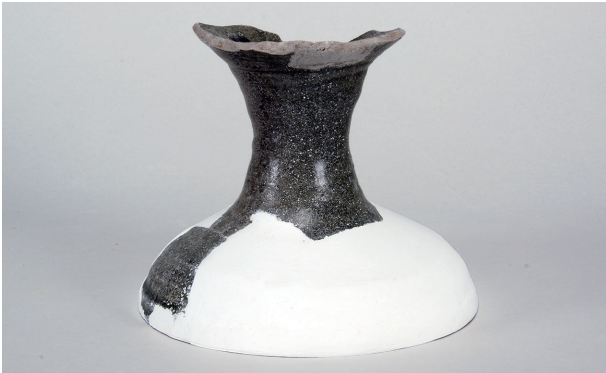
2 第 67 号土壙 (第 398 図 10)