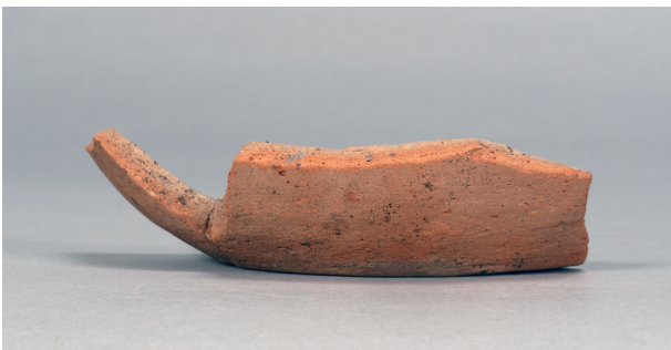
4 第58号住居跡 (第287图8)