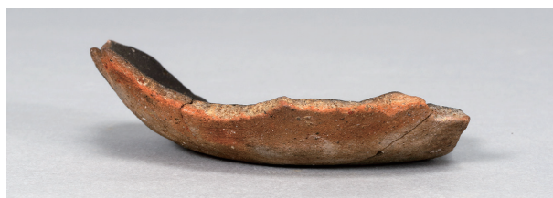
8 第78号住居跡 (第314图15)