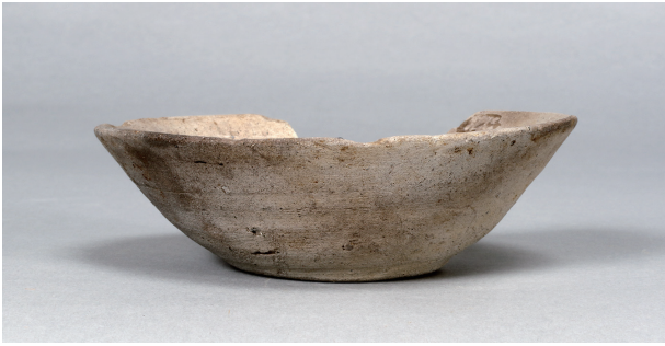
1 第 86 号住居跡 (第 333 図 3)