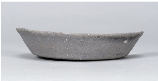
1 第36号住居跡 (第267图4)