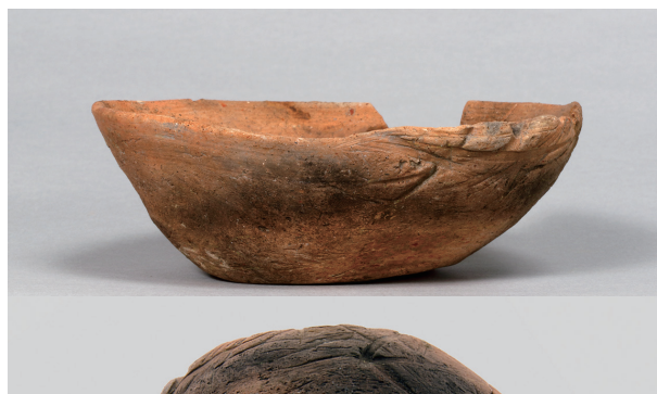
8 第74号住居跡 (第296图6)