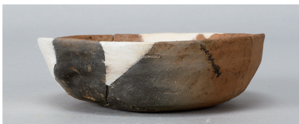
3 第263号土壙 (第401图 116)