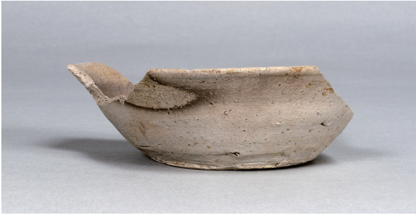
2 第 89 号住居跡 (第 338 図 2)