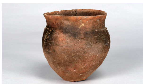
11 第81号住居跡 (第318图18)