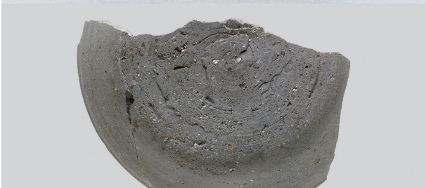
6 第33号住居跡 (第260图3)