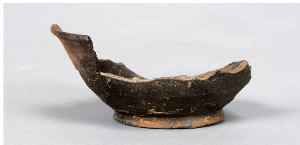
6 第74号住居跡 (第296图2)