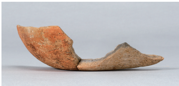
1 第13号住居跡 (第246图7)