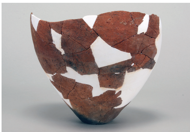
3 第2号遺物集中 (第408图18)