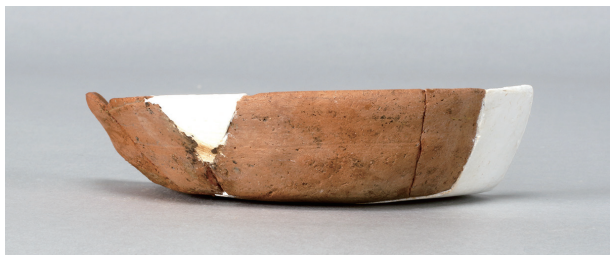
1 第263号土壙 (第401图 114)