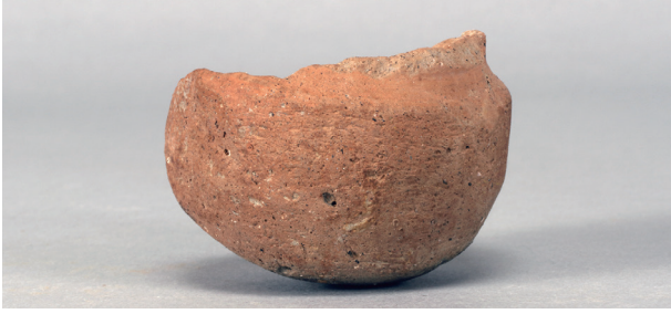
1 第2号掘立柱建物跡 (第353図6)