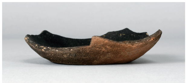
8 第 430 号土壙 (第 405 図 208)