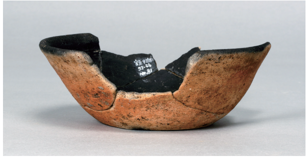
7 第 89 号住居跡 (第 338 図 25)