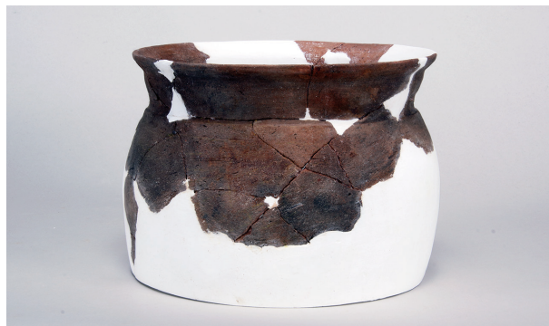
4 第2号遺物集中 (第408图19)