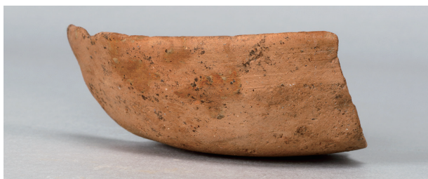
5 第263号土壙 (第401图 118)