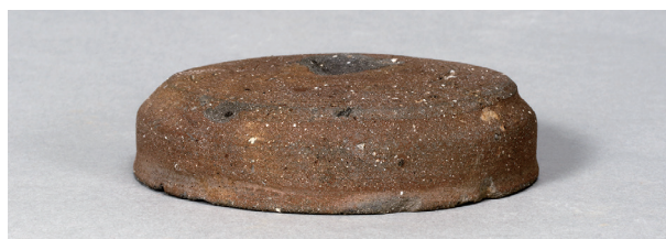
12 第82号住居跡 (第323图1)