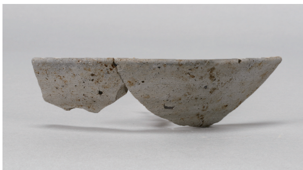
2 第36号住居跡 (第267图6)