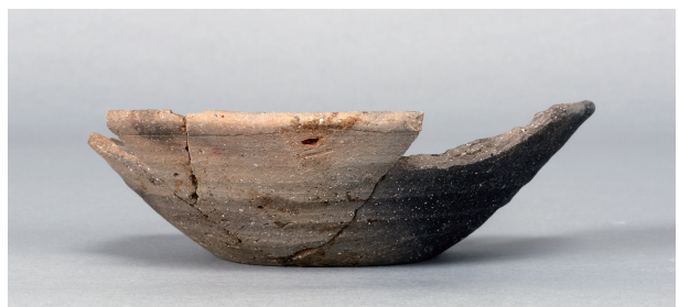
9 第 430 号土壙 (第 405 図 207)