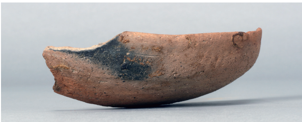
4 第112号井戸跡 (第356図13)