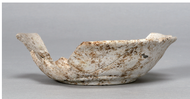
9 第75号住居跡 (第307图149)