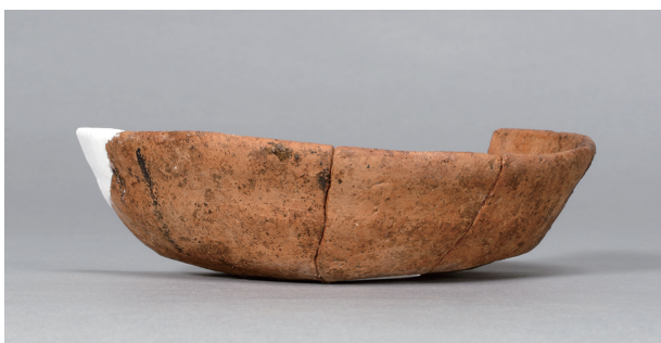
3 第75号住居跡 (第305图52)