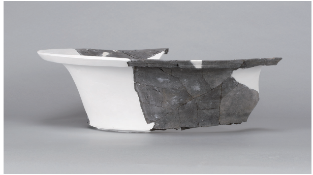
5 第 420 号土壙 (第 404 図 186)