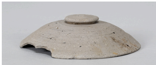
6 第149号溝跡 (第375図27)