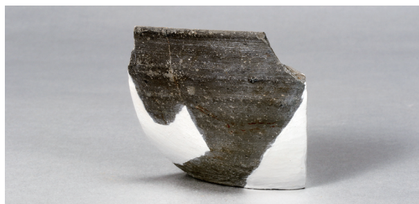
7 第78号住居跡 (第314图8)