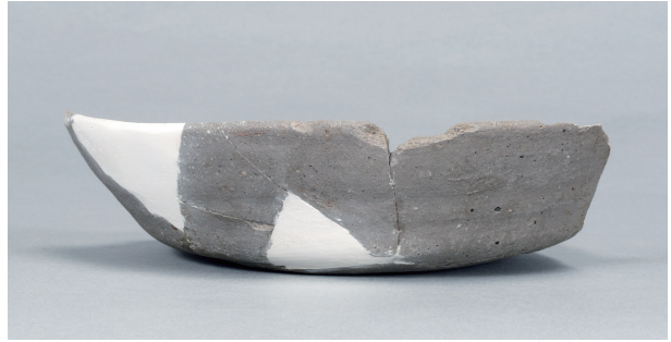
7 第73号住居跡 (第294图5)