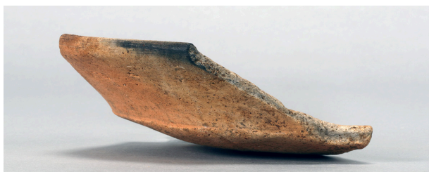
2 第39号溝跡 (第374図6)