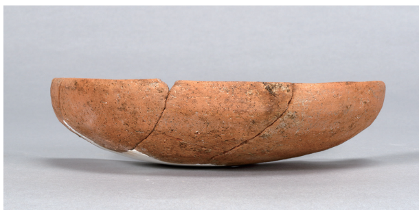
4 第36号住居跡 (第267图22)