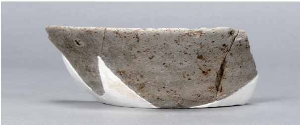
4 第31号住居跡 (第257图4)