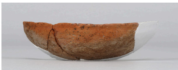
3 第56号溝跡 (第374図12)