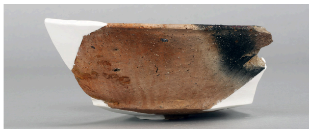
10 第5号畠跡 (第384図13)