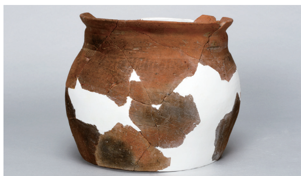
10 第 102 号住居跡 (第 345 図 36)