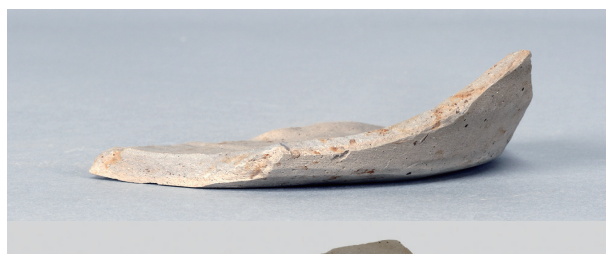
9 第272号土壙 (第402图 136)