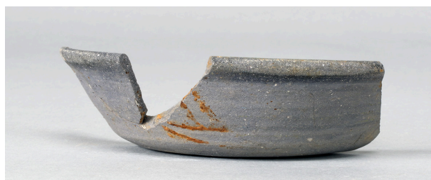
8 第216号溝跡 (第376図64)