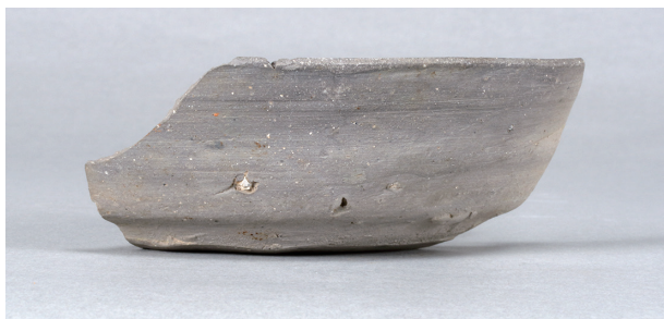
2 第20号住居跡 (第247图2)