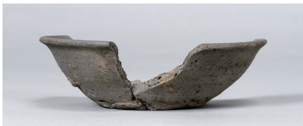
4 第 91 号住居跡 (第 342 図 1)