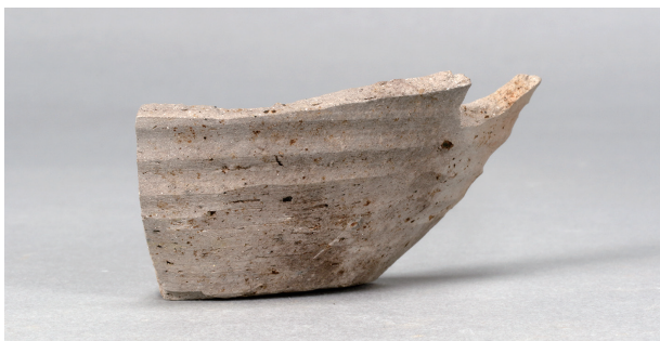
5 第75号住居跡 (第306图71)