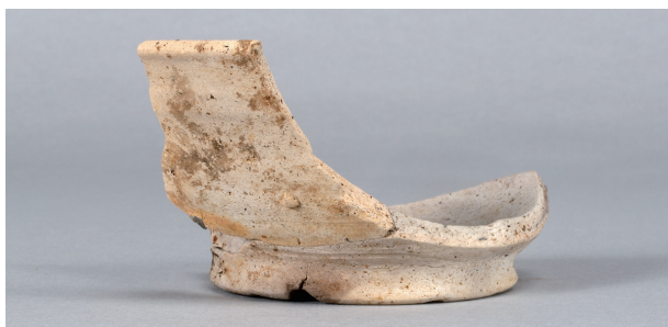
3 第22号住居跡 (第249图9)