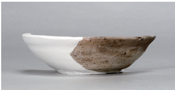
1 第75号住居跡 (第305图41)