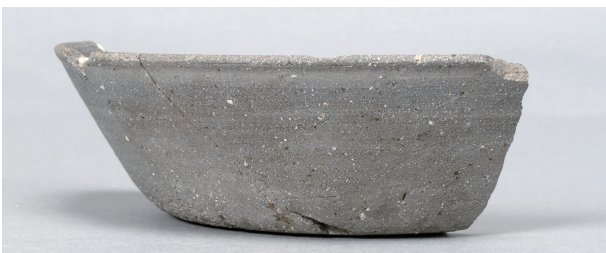
5 第33号住居跡 (第260图1)