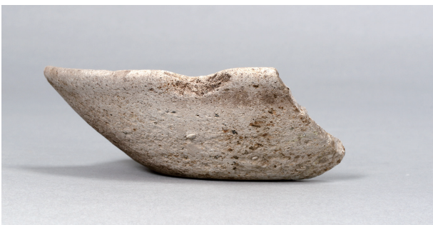
5 第 89 号住居跡 (第 338 図 7)