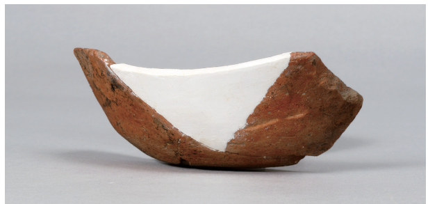
7 第 82 号住居跡 (第 323 図 22)