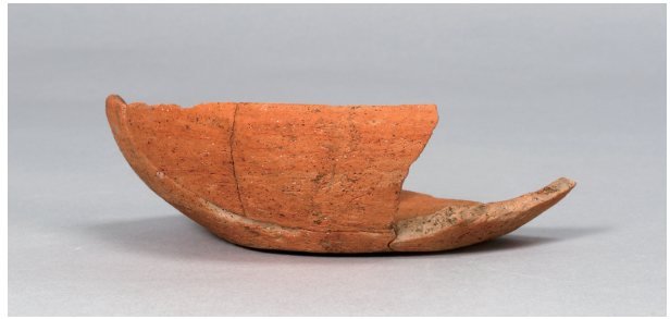
6 第 82 号住居跡 (第 323 図 19)