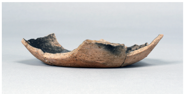
10 第 89 号住居跡 (第 338 図 34)