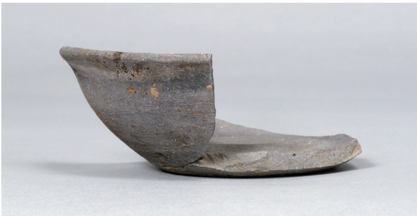
3 第 89 号住居跡 (第 338 図 3)