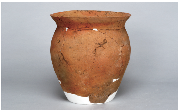
2 第2号住居跡 (第239图46)