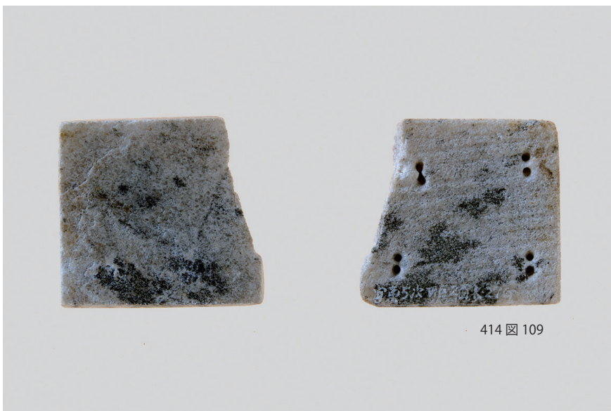
3 石製品 (1)