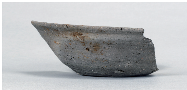
7 第74号住居跡 (第296图3)