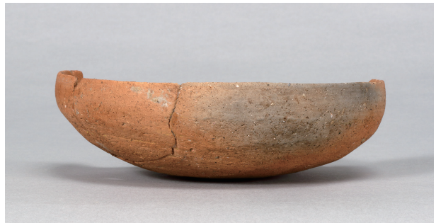
8 第73号住居跡 (第294图8)