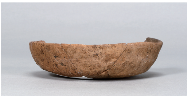
2 第75号住居跡 (第305图51)