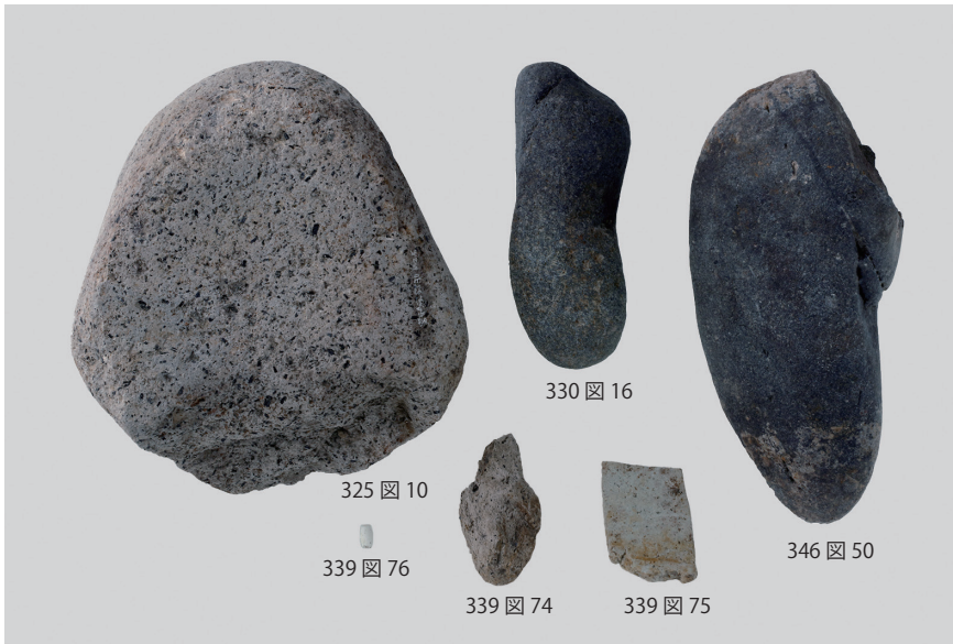
1 石製品 (5)