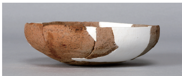
8 第271号土壙 (第402图 128)