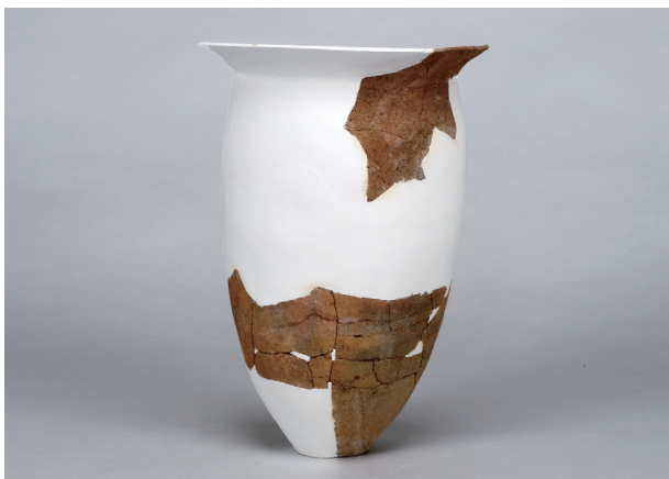
5 第36号住居跡 (第268图60)