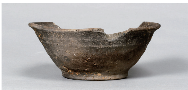
5 第74号住居跡 (第296图1)