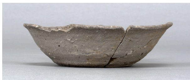
7 第152号溝跡 (第375図33)