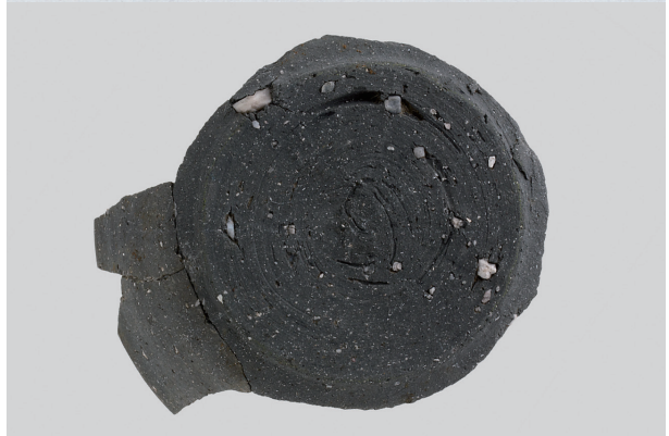
6 第12号住居跡 (第245图2)