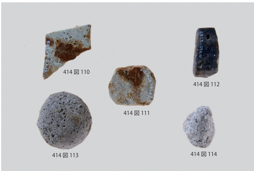
3 石製品 (7)