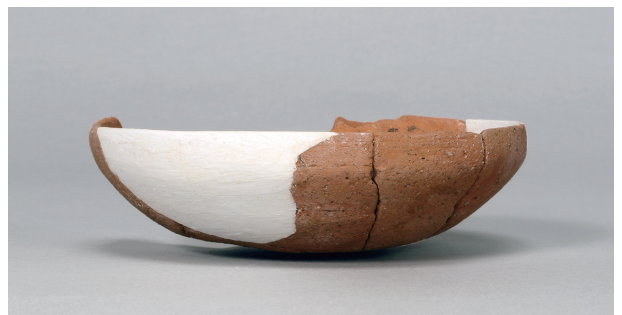
10 第44号住居跡 (第283图7)