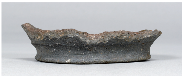
5 第 91 号住居跡 (第 342 図 2)