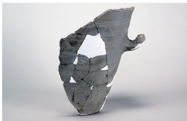
6 第3号遺物集中 (第412图46)