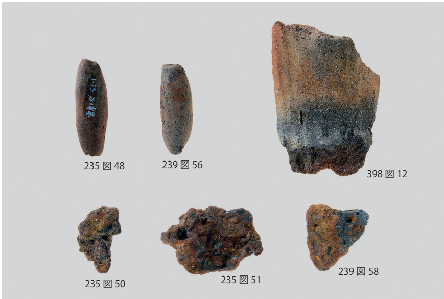
1 土錘・羽口・鉄滓