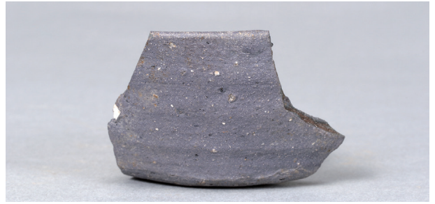
6 第39号住居跡 (第276图1)