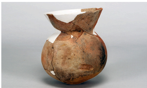
5 第57号溝跡 (第374図18)