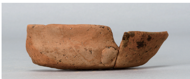
6 第263号土壙 (第401图 119)