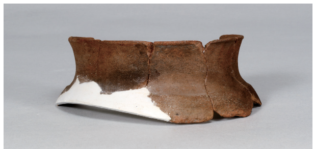
9 第 82 号住居跡 (第 323 図 28)