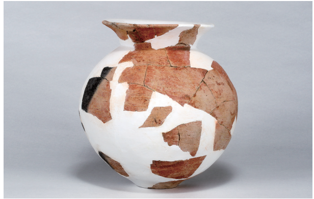
6 第 234 号土壙 (第 400 図 81)