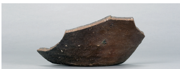
3 第75号住居跡 (第308图169)