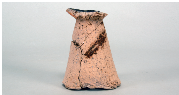
7 第3号遺物集中 (第414图106)