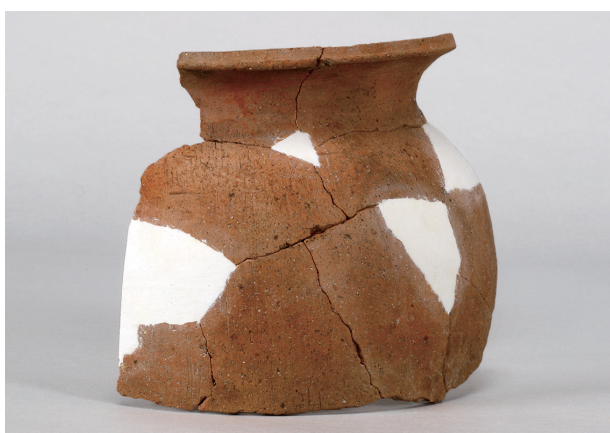
2 第434号土壙 (第405图212)