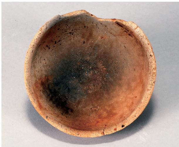
1 第434号土壙 (第405图211)