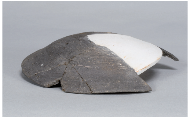
9 第44号住居跡 (第283图1)