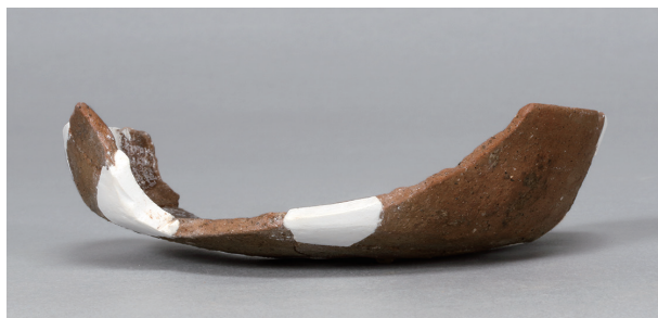
7 第75号住居跡 (第306图75)