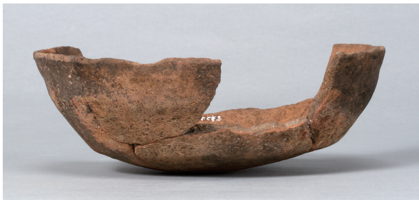
4 第36号住居跡 (第268图59)