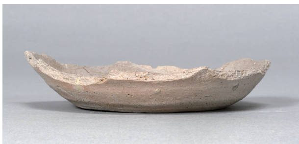
1 第75号住居跡 (第308图165)