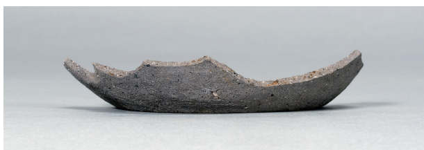
2 第75号住居跡 (第308图166)