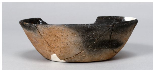
8 第 102 号住居跡 (第 345 図 21)