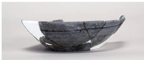
5 第3号遺物集中 (第411图7)