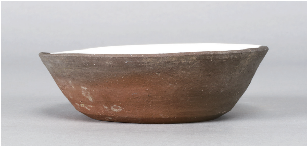
1 第 55 号土壙 (第 398 図 1)