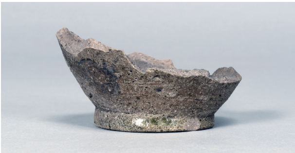
3 第56号住居跡 (第284图1)