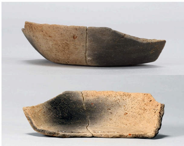
1 第39号溝跡 (第374図5)