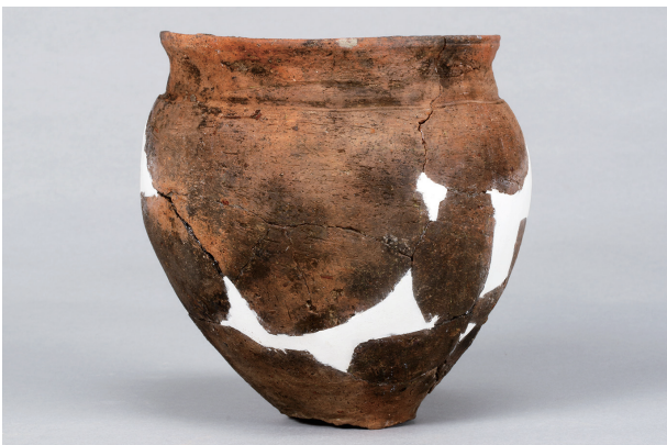
5 第38号住居跡 (第273图34)