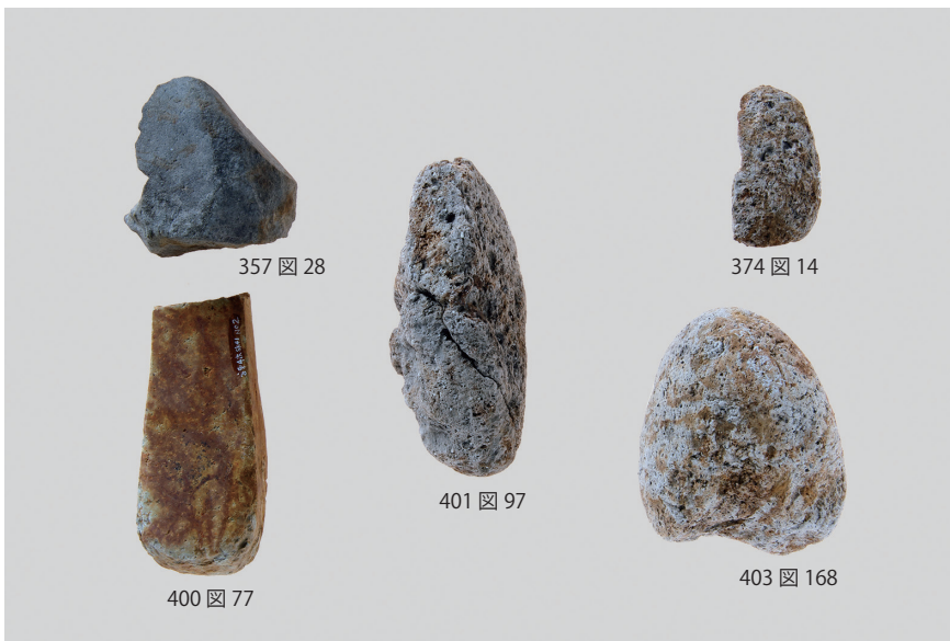
2 石製品 (6)