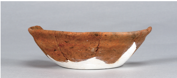
3 第38号住居跡 (第273图18)