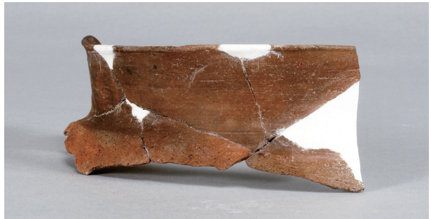
5 第3号住居跡 (第243图43)