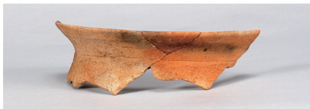
7 第36号住居跡 (第268图63)