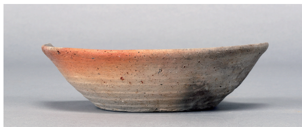
11 第309号土壙 (第403图 158)