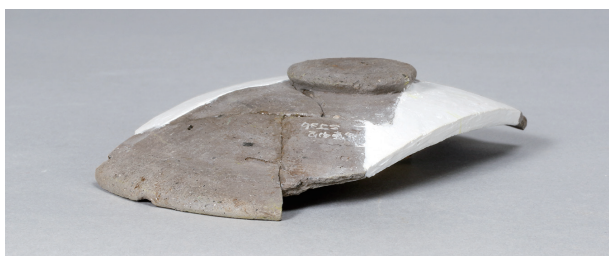
3 第 89 号住居跡 (第 339 図 54)