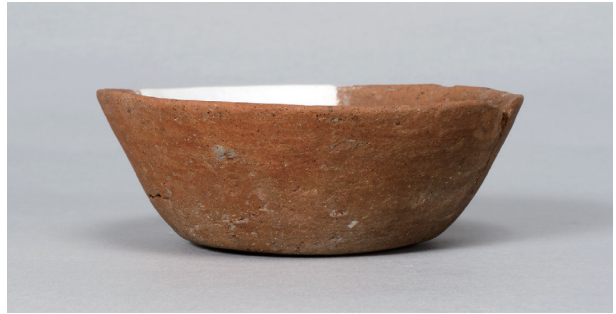
5 第 82 号住居跡 (第 323 図 18)