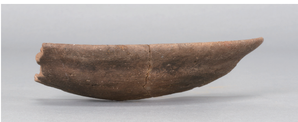
5 第112号井戸跡 (第356図17)