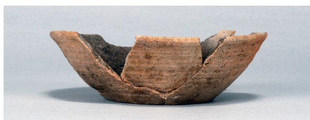
9 第81号住居跡 (第318图1)