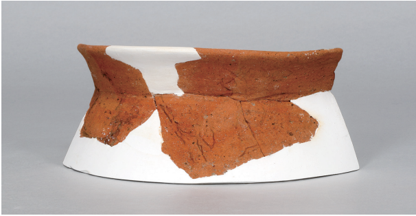
2 第44号住居跡 (第283图19)