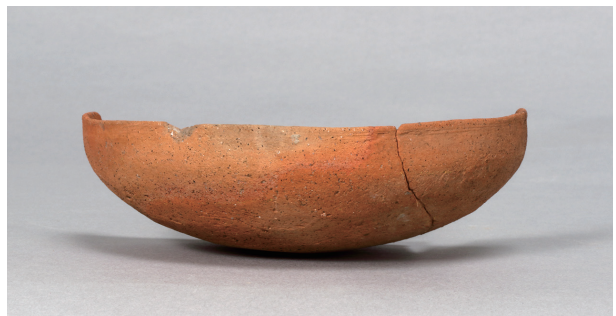
9 第73号住居跡 (第294图9)