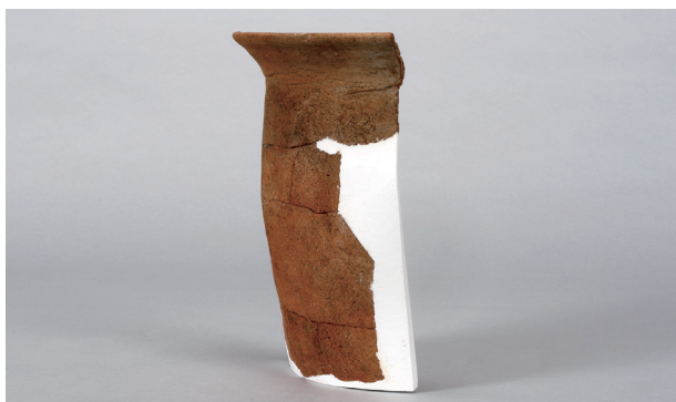
3 第73号住居跡 (第294图33)