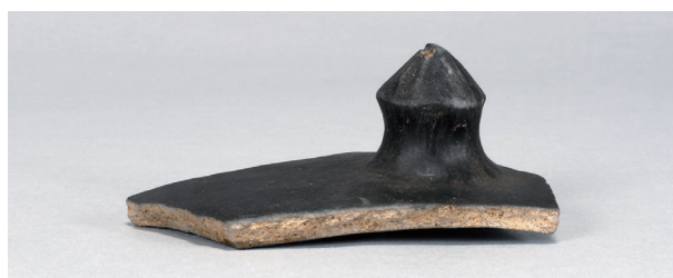
8 遺構外 (第416图4)