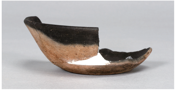
6 第 89 号住居跡 (第 338 図 24)