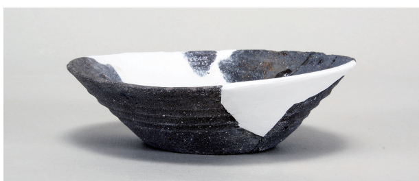
5 第78号住居跡 (第314图1)