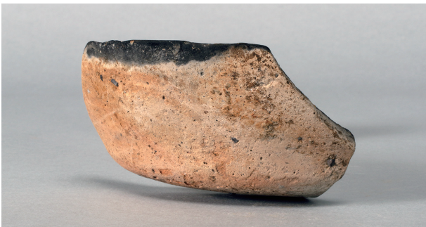
4 第 171 号土壙 (第 399 図 47)