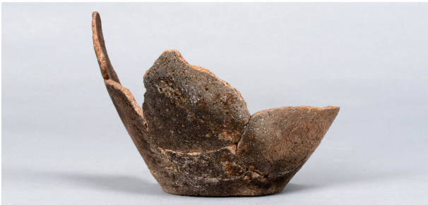
2 第27号住居跡 (第252图44)