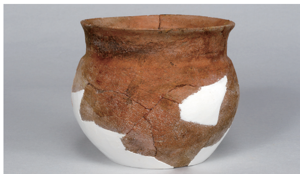
9 第 102 号住居跡 (第 346 図 45)