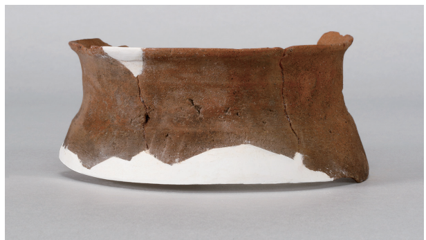
7 第 429 号土壙 (第 405 図 205)