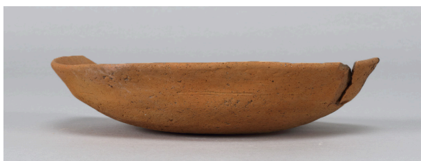
4 第56号溝跡 (第374図13)