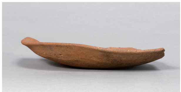
10 第73号住居跡 (第294图25)