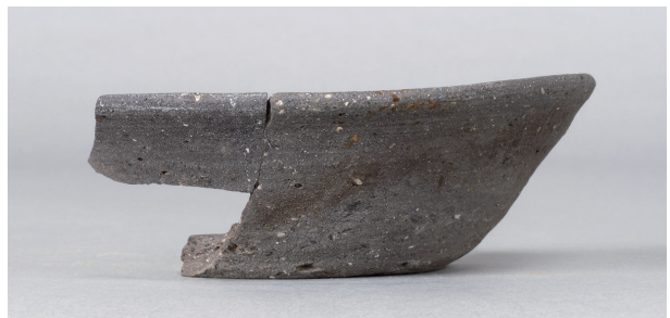
9 第 257 号土壙 (第 401 図 102)