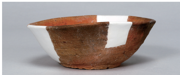
6 第22号住居跡 (第249图24)