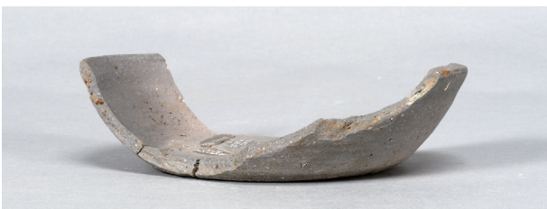
4 第 82 号住居跡 (第 323 図 14)