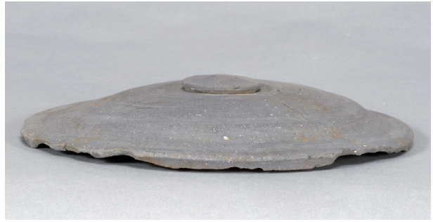
6 第73号住居跡 (第294图1)