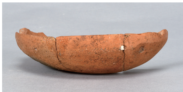
7 第36号住居跡 (第267图27)