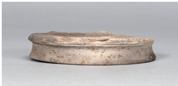
6 第75号住居跡 (第306图72)