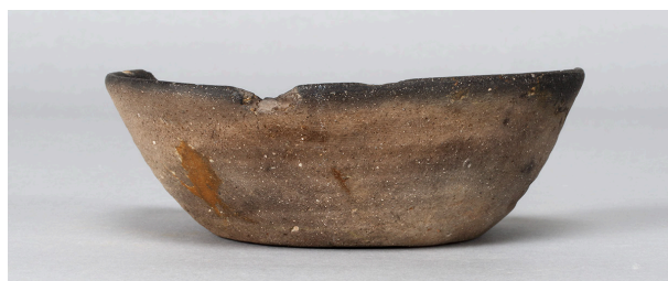
11 第6号畠跡 (第384図23)