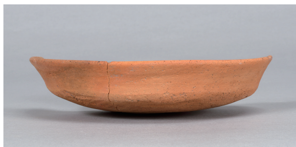
9 第36号住居跡 (第267图43)