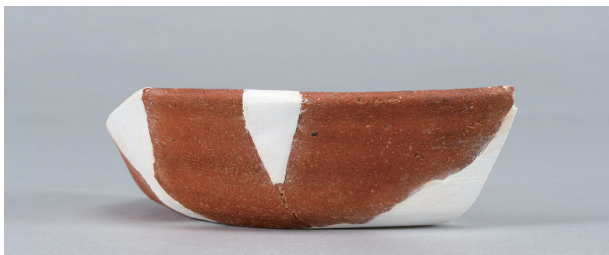
1 第2号住居跡 (第238图44)