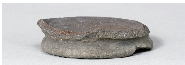
6 第78号住居跡 (第314图7)