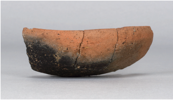
1 第 318 号土壙 (第 403 図 161)