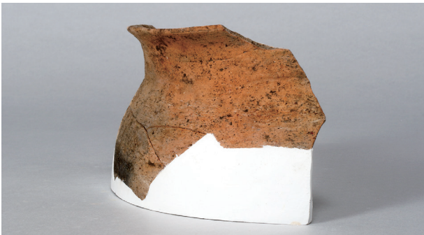
4 第38号住居跡 (第273图22)