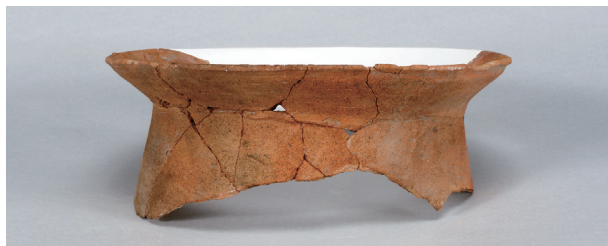
6 第36号住居跡 (第268图61)