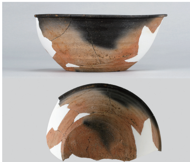
6 第3号住居跡 (第242図30)