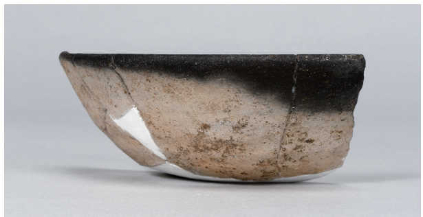
9 第 89 号住居跡 (第 338 図 27)