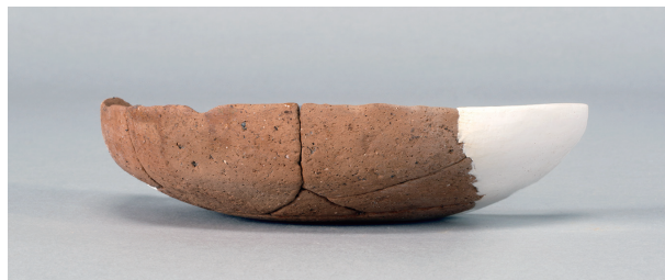
7 第268号土壙 (第401图 125)