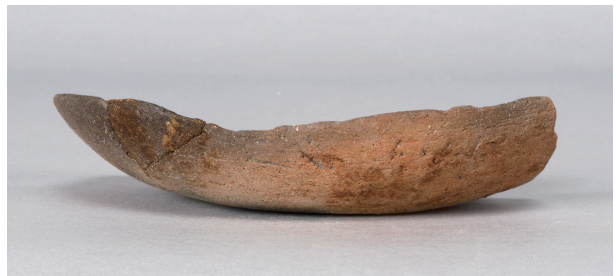
8 第 247 号土壙 (第 401 図 99)