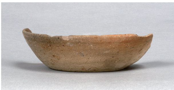
4 第75号住居跡 (第306图63)