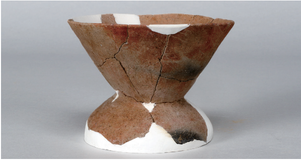
2 第3号掘立柱建物跡 (第353図11)