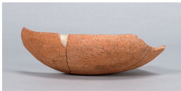
8 第36号住居跡 (第267图41)