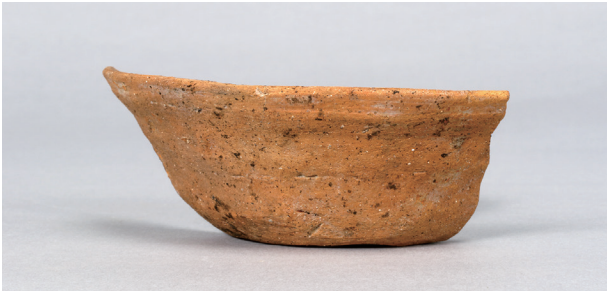
2 第38号住居跡 (第273图17)