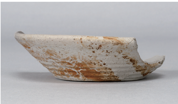
2 第 331 号土壙 (第 403 図 166)