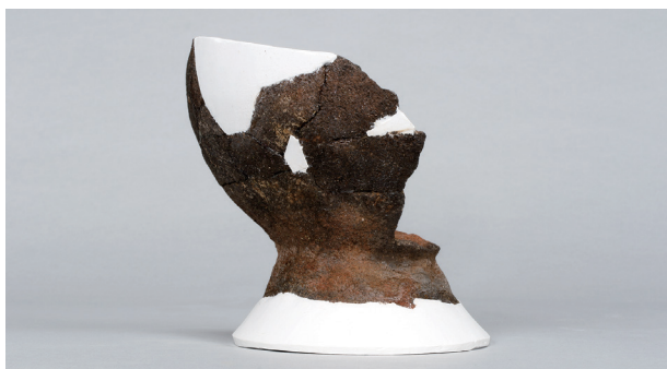
4 第73号住居跡 (第294图40)