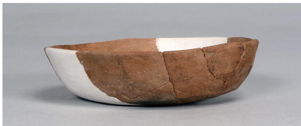
1 第 89 号住居跡 (第 338 図 39)