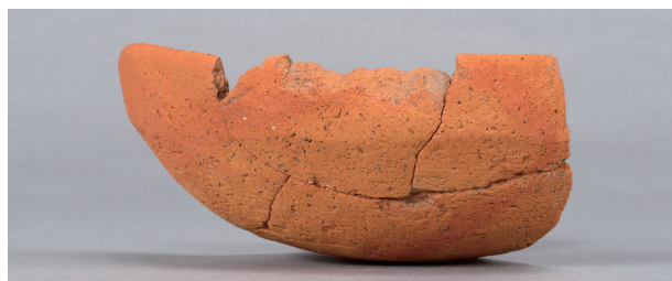
9 第27号住居跡 (第252图7)