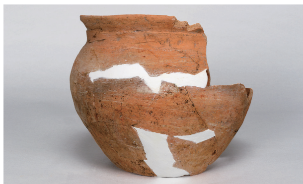
7 第22号住居跡 (第249图31)