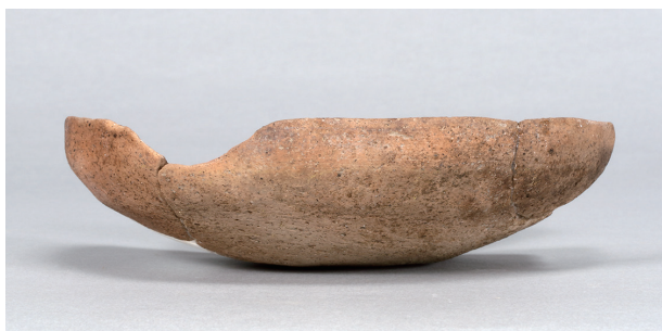
3 第36号住居跡 (第267图19)