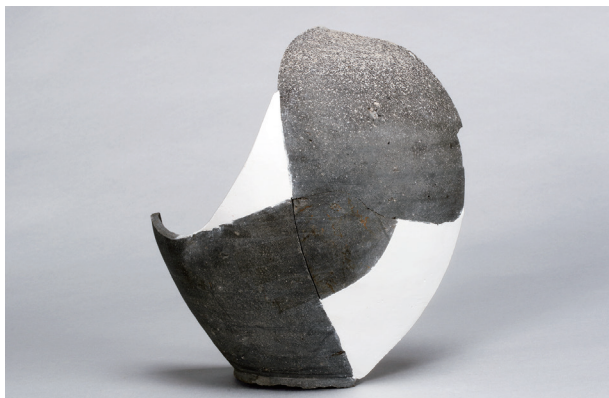
5 第22号住居跡 (第249图13)