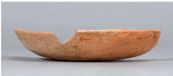
1 第36号住居跡 (第267图47)