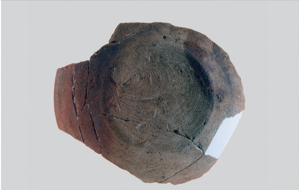
2 第3号住居跡 (第243图33)