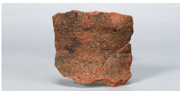
4 第77号住居跡 (第311图3)