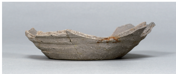
7 第 102 号住居跡 (第 345 図 17)