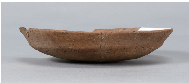
2 第36号住居跡 (第268图52)