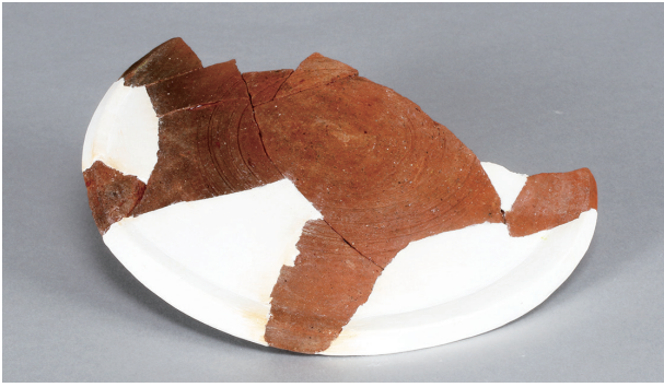
1 第3号住居跡 (第243图32)