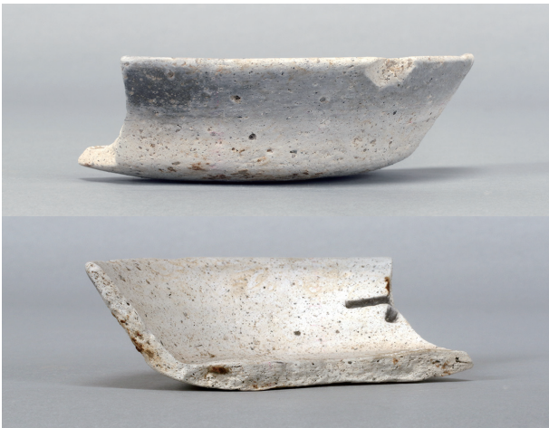
3 第112号井戸跡 (第356図12)