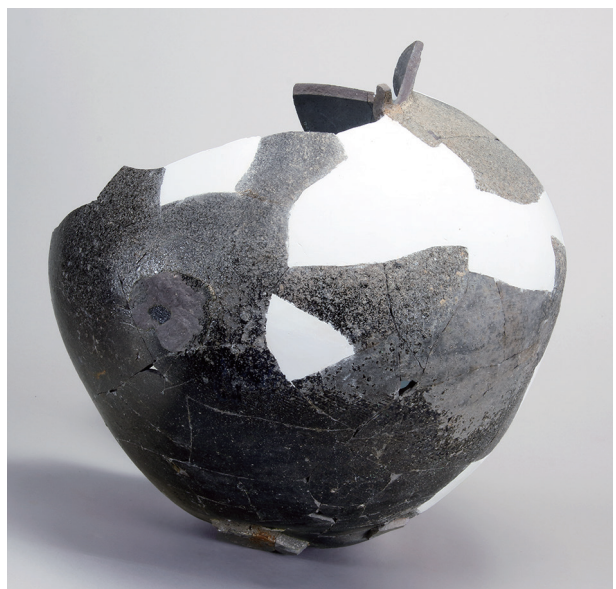
8 第142号井戸跡 (第357図32)