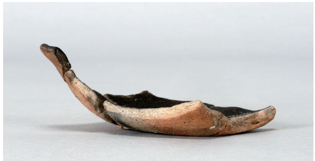
8 第 89 号住居跡 (第 338 図 26)