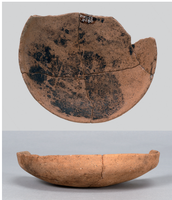
6 第36号住居跡 (第267图25)