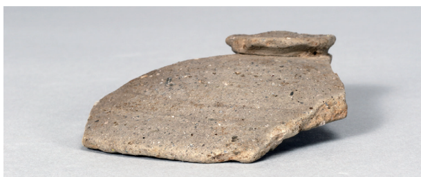
2 第 89 号住居跡 (第 339 図 53)