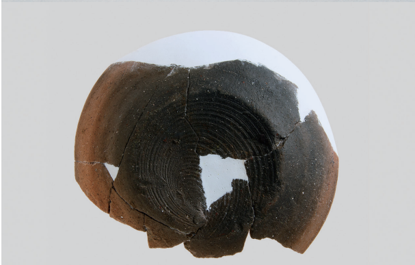
3 第3号住居跡 (第243图34)