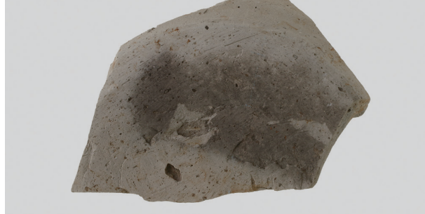
10 第284号土壙 (第402图 150)