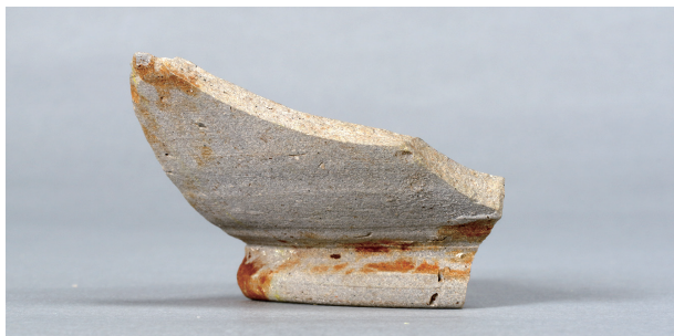
1 第3号住居跡 (第242図10)