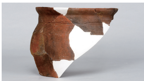
11 第 102 号住居跡 (第 345 図 37)