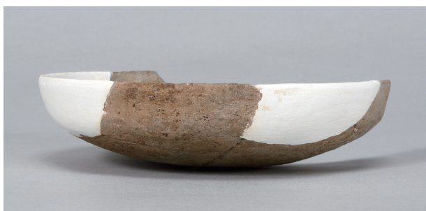
5 第36号住居跡 (第267图23)