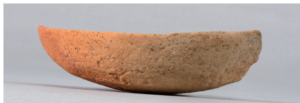
10 第27号住居跡 (第252图13)