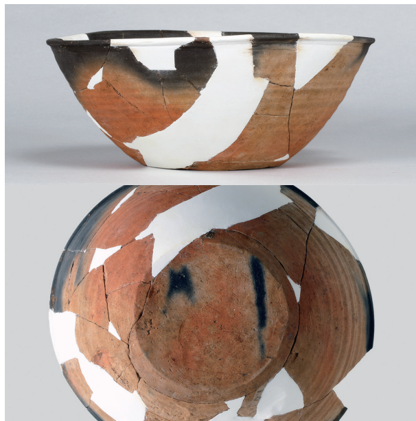
5 第3号住居跡 (第242図29)