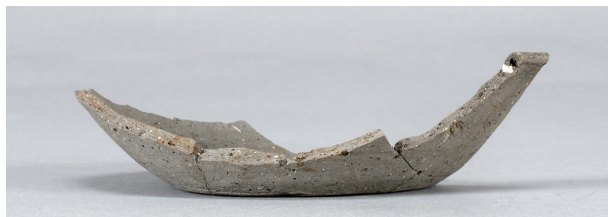
5 第3号住居跡 (第242图2)