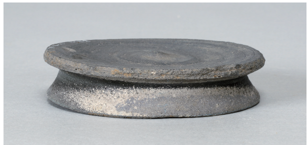
10 第 263 号土壙 (第 401 図 113)