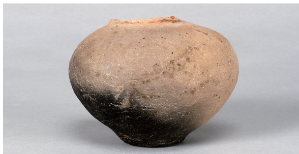
9 第36号住居跡 (第268图75)