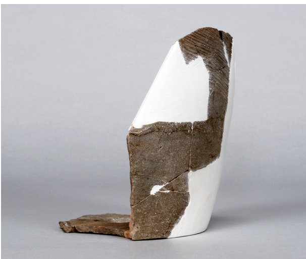
4 第 420 号土壙 (第 404 図 188)