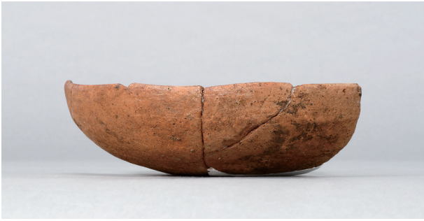
1 第44号住居跡 (第283图10)