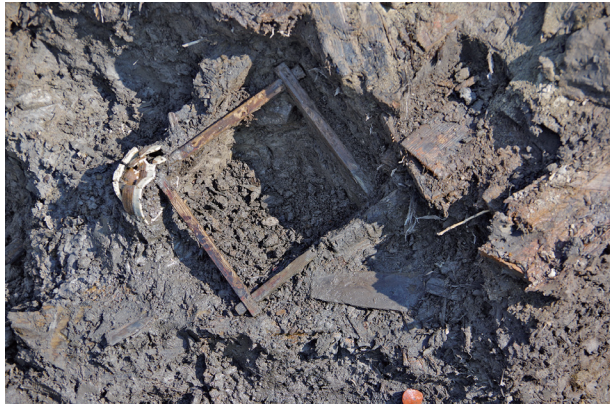
5 第 518 号土壤遺物出土狀況 (6)