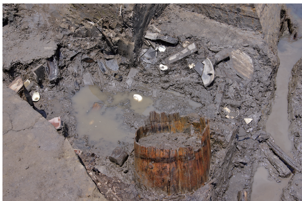
7 第 517 号土壤遺物出土狀況 (12)