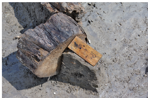
4 第 527 号土壙遺物出土状況 (6)