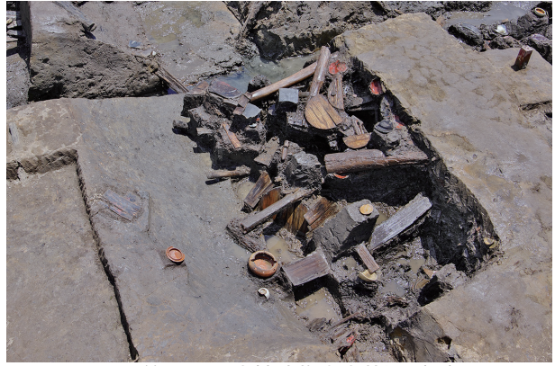
2 第 518 号土壤遺物出土狀況 (3)