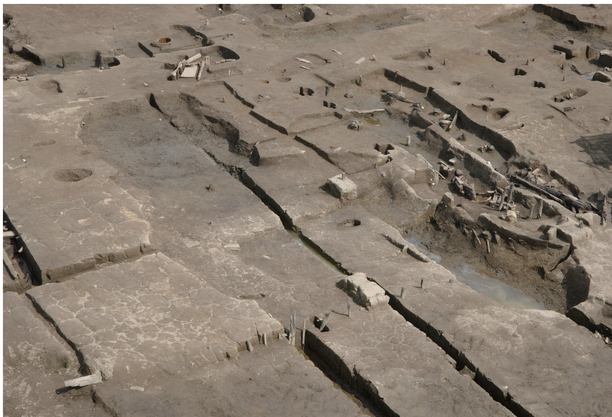
1 第 538・539 号土壇