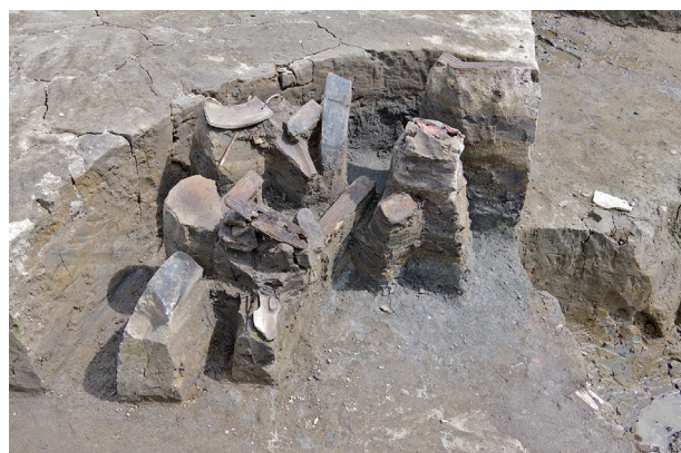
8 第 528 号土壙遺物出土状況