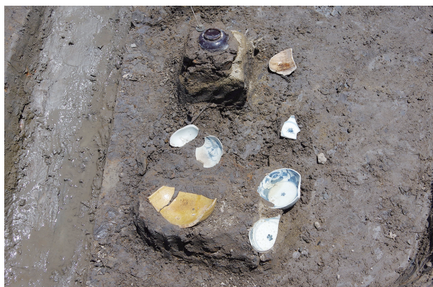
1 第 527 号土壙遺物出土状況 (3)