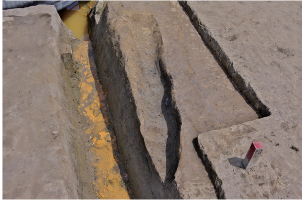
1 第 529 号土壤