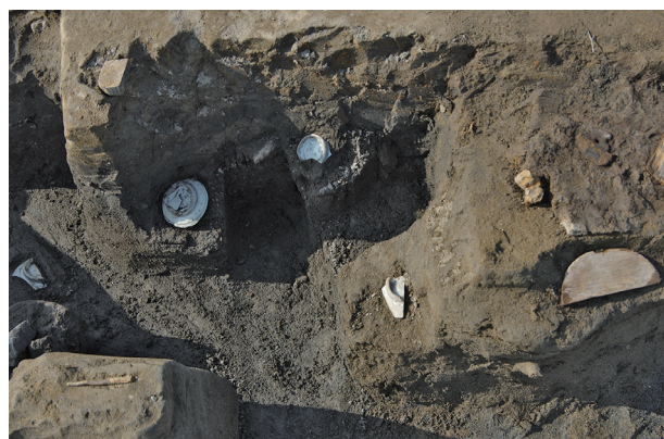
5 第 537 号土壙遺物出土状況 (3)