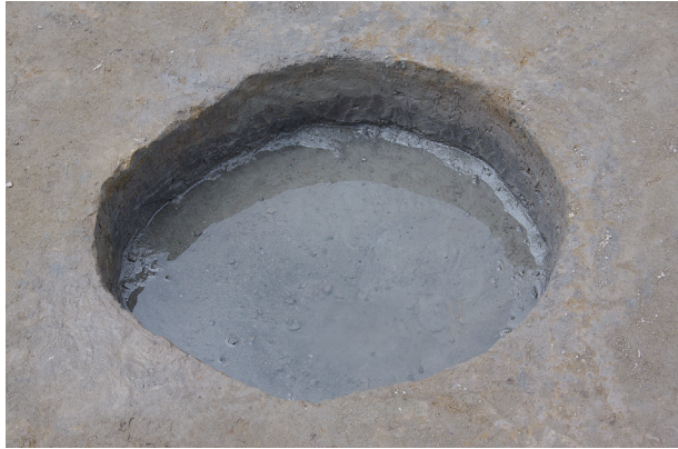
1 第 525 号土壤