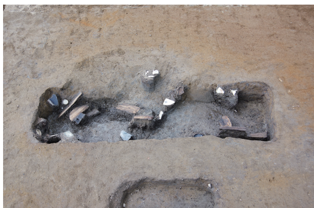
3 第 520 号土坑