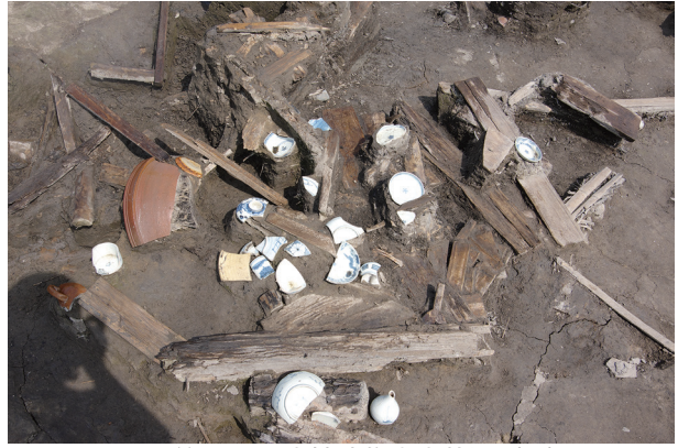
2 第 538 号土壙遺物出土狀況 (3)