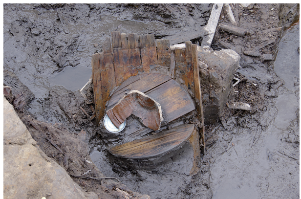
8 第 517 号土壤遺物出土狀況 (13)