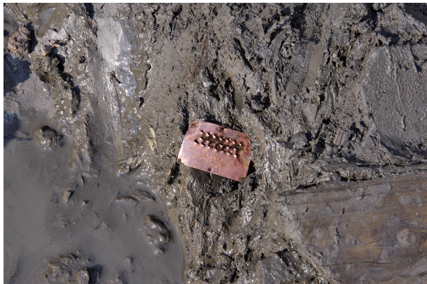
5 第 517 号土壤遺物出土狀況 (10)