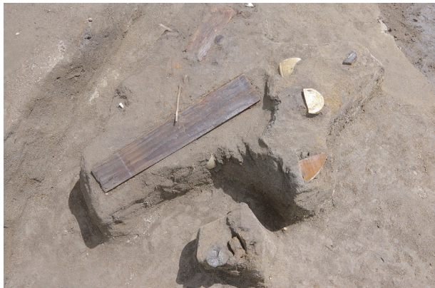
7 第 537 号土壙遺物出土狀況 (10)