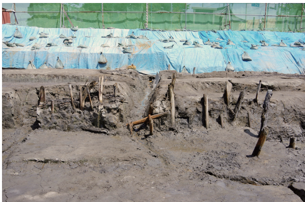
5 第504号土壌 土留め杭列(2)