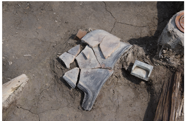
8 第 538 号土壙遺物出土狀況 (9)