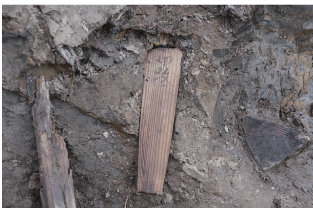
3 第517号土壌遺物出土状況(16)