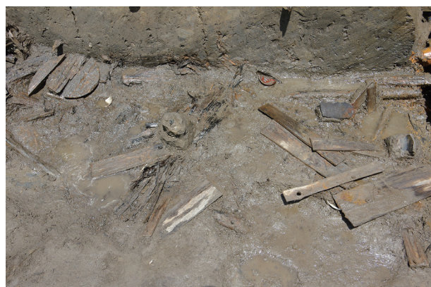
6 第 516 号土壙遺物出土状況 (2)