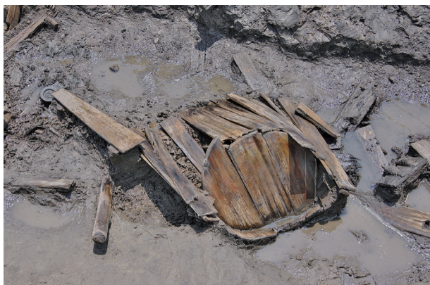
7 第 518 号土壤遺物出土狀況 (8)