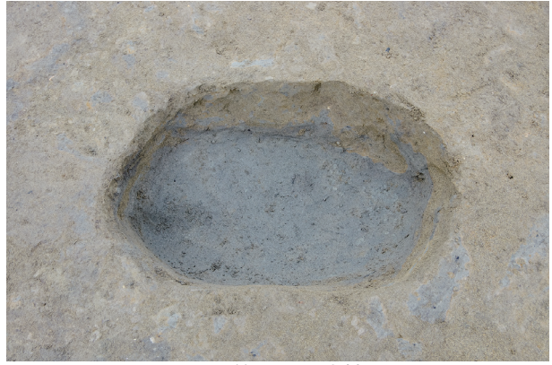
2 第 510 号土壤