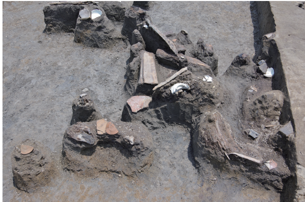
3 第 537 号土壙遺物出土狀況 (6)