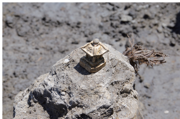
2 第 527 号土壙遺物出土状況 (4)