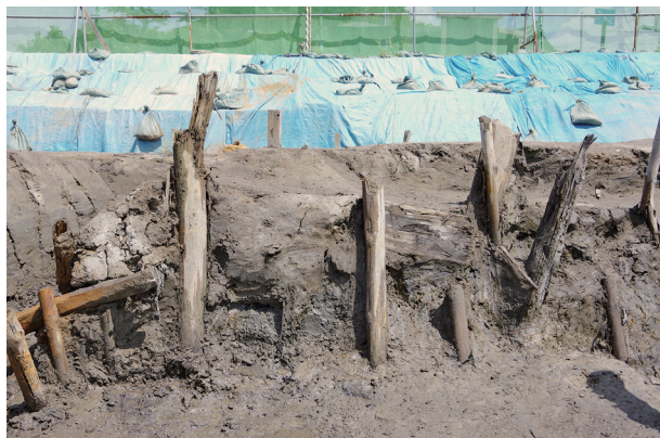
6 第504号土壌 土留め杭列(3)