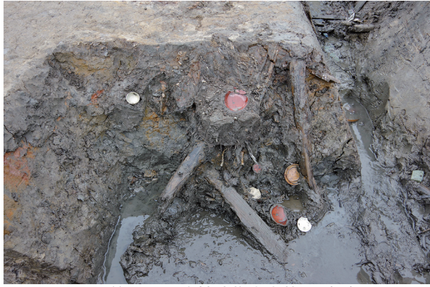
1 第 518 号土壤遺物出土狀況 (2)