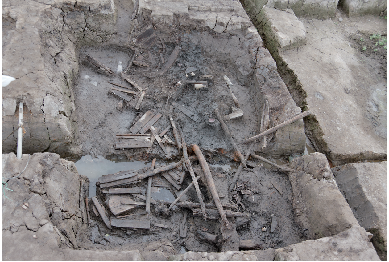
1 第 516 号土壤遺物出土狀況 (5)