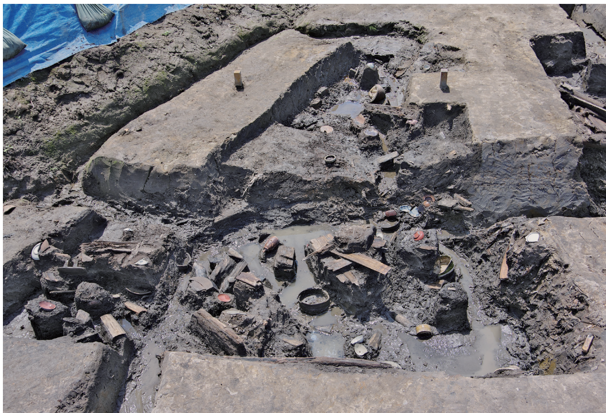
1 第 517 号土壙遺物出土状況 (1)