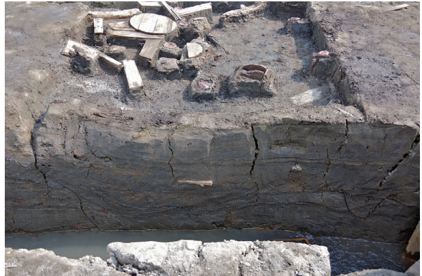
4 第 536 号土壤断面