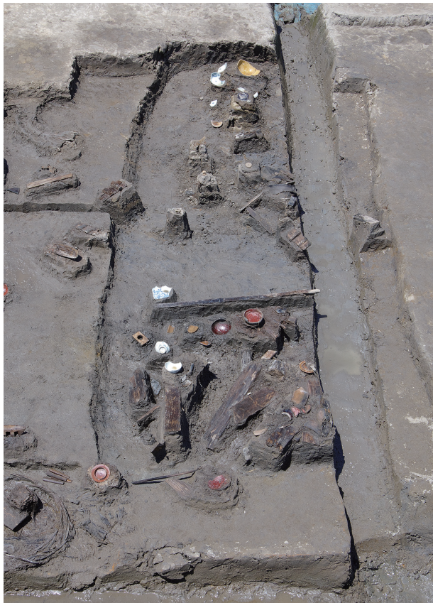
6 第 527 号土壤遺物出土狀況 (1)