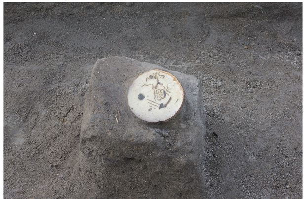
8 第 537 号土壙遺物出土狀況 (11)