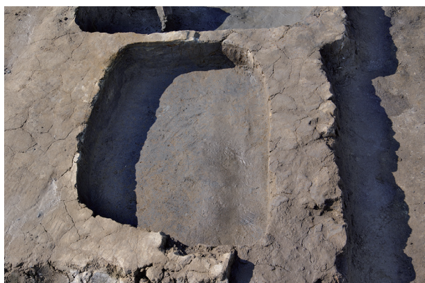
5 第 522 号土坑