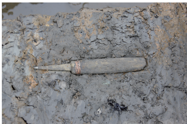
2 第504号土壌遺物出土状況(13)