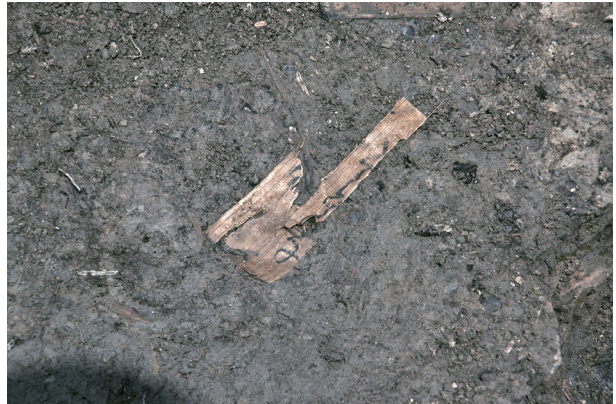
4 第 539 号土壤遺物出土狀況 (10)