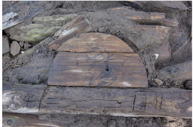
6 第 538 号土壙遺物出土狀況 (7)