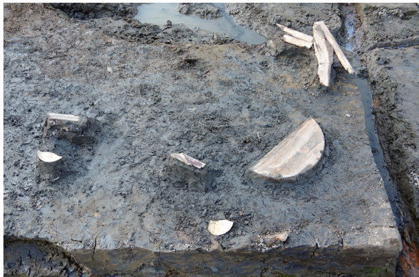
5 第 504 号土壤遺物出土狀況 (8)