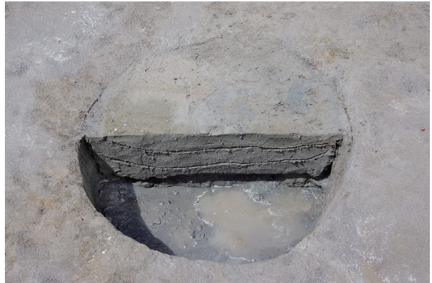
4 第 526 号土壤断面