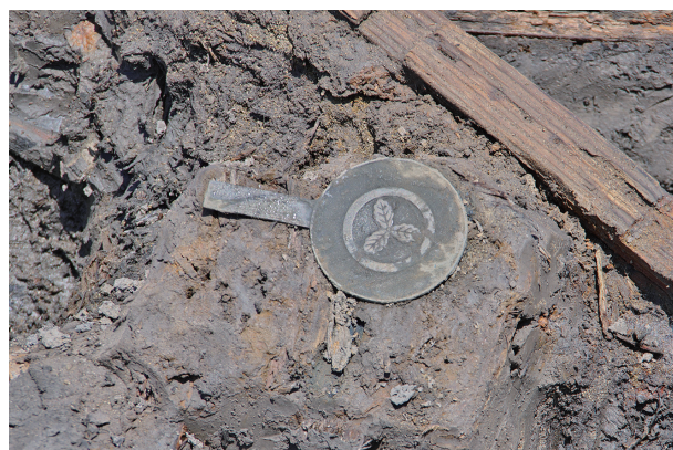
5 第 517 号土壙遺物出土状況 (5)