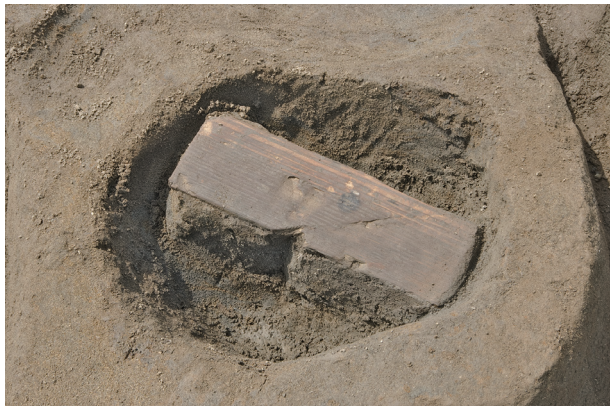
5 第 514 号土壤遺物出土狀況