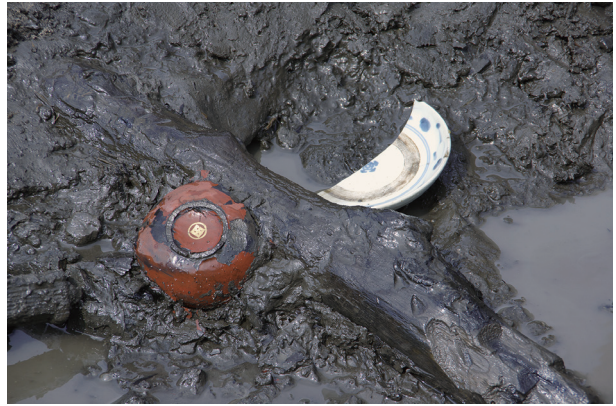
4 第 517 号土壤遺物出土狀況 (9)