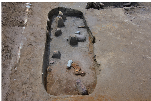
7 第 523 号土坑