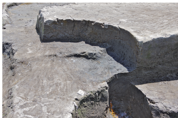
6 第 528 号土壙