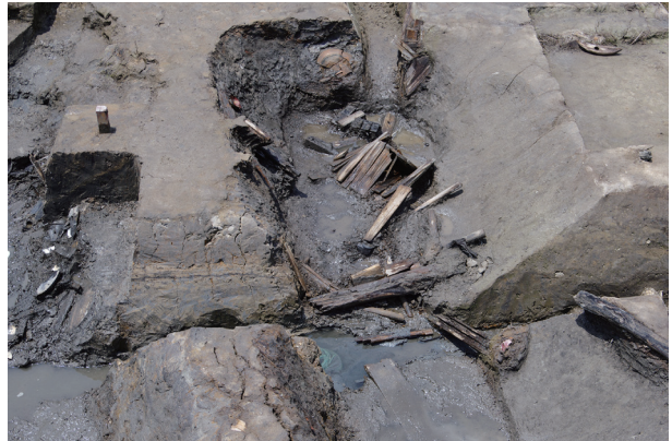
6 第 518 号土壤遺物出土狀況 (7)