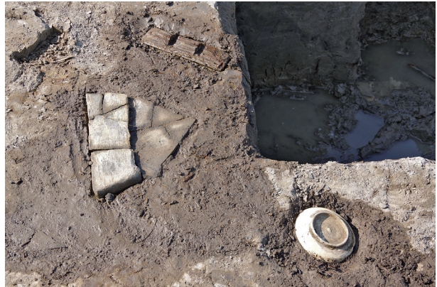
4 第 504 号土壤遺物出土狀況 (7)