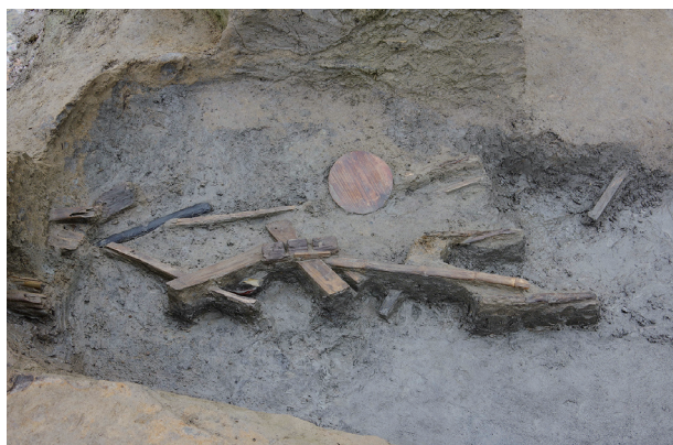
1 第 515 号土壙遺物出土状況 (3)