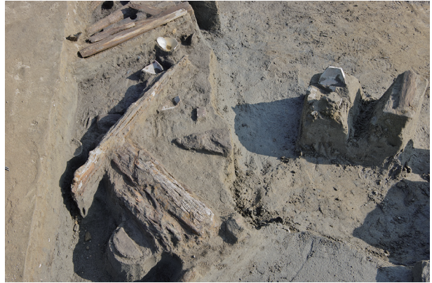
2 第 537 号土壙遺物出土狀況 (5)