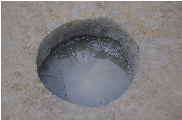
3 第 526 号土壤