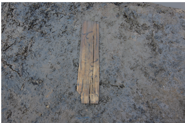
3 第504号土壌遺物出土状況(14)