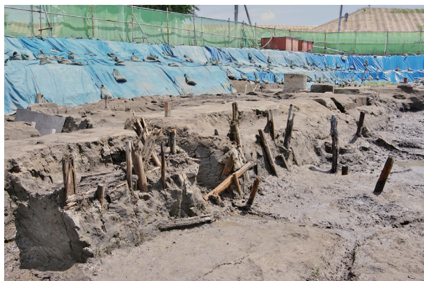
4 第504号土壌 土留め杭列(1)