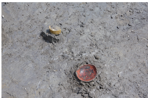
5 第 527 号土壙遺物出土状況 (7)