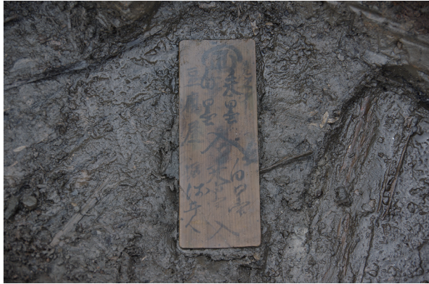
1 第 539 号土壤遺物出土狀況 (7)