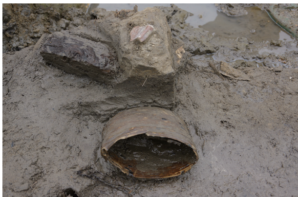
7 第 504 号土壤遺物出土狀況 (10)