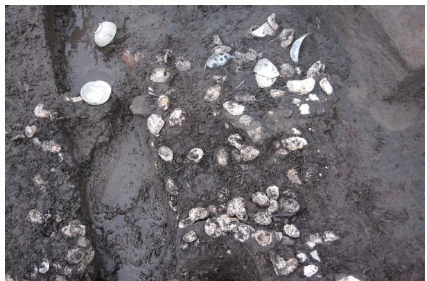
8 第 539 号土壤貝層檢出狀況 (2)