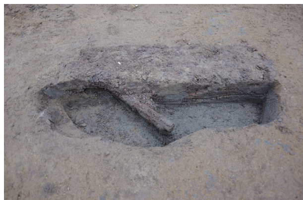
2 第 519 号土坑断面