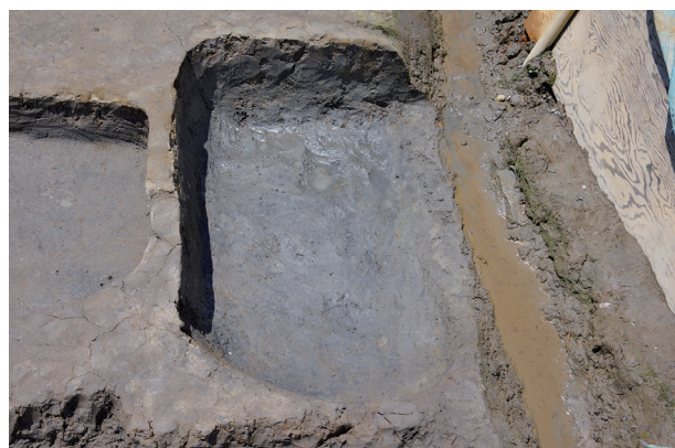
4 第 521 号土坑