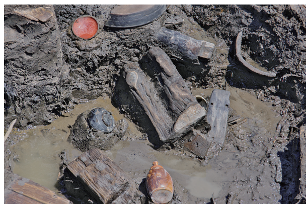
3 第 517 号土壙遺物出土状況 (3)