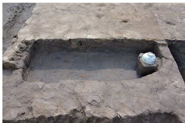
6 第 522 号土坑断面・遺物出土狀況