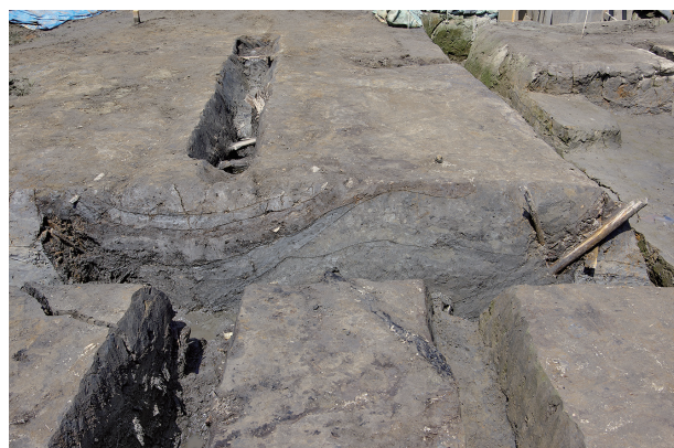
4 第 516・518 号土壙断面