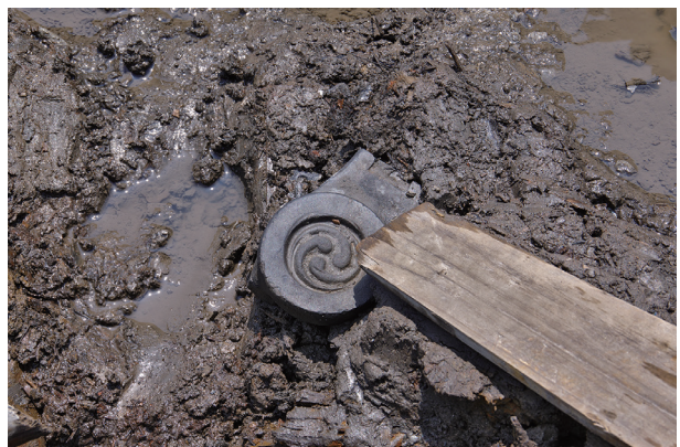
8 第 518 号土壤遺物出土狀況 (9)