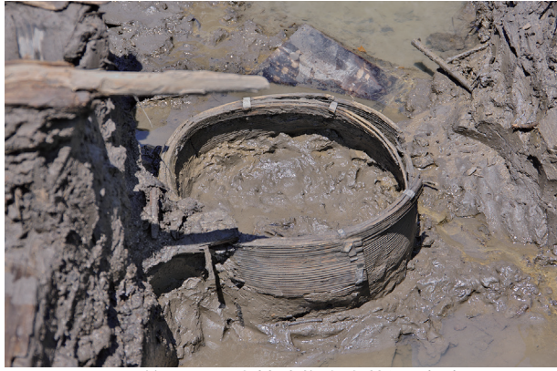
1 第 517 号土壤遺物出土狀況 (6)