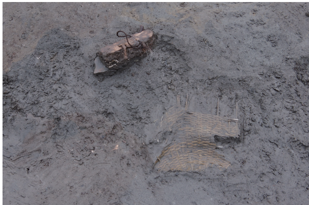
5 第 539 号土壤遺物出土狀況 (11)