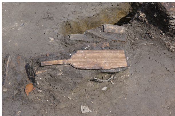
1 第 538 号土壙遺物出土状況 (10)