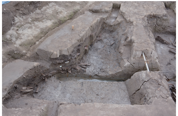
3 第 517 号土壤