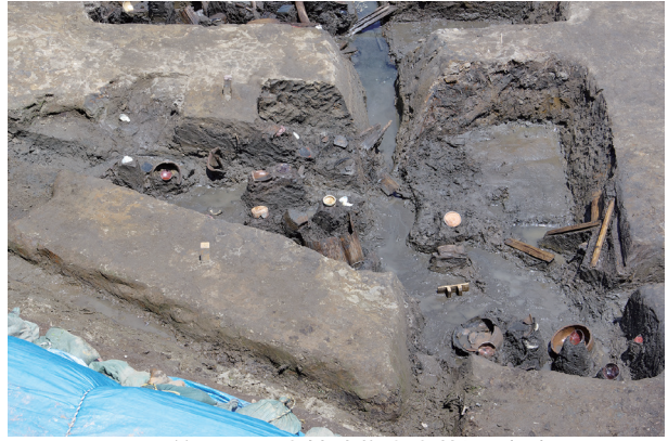
2 第 517 号土壤遺物出土狀況 (7)