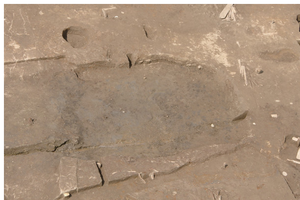
2 第 539 号土壙