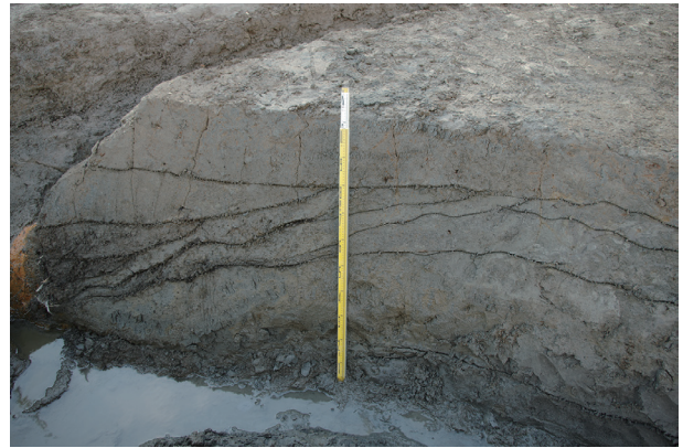
2 遺物包含層 1 断面