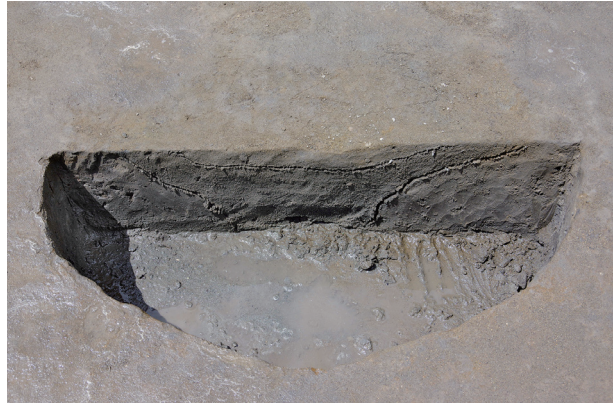
2 第 525 号土壤断面