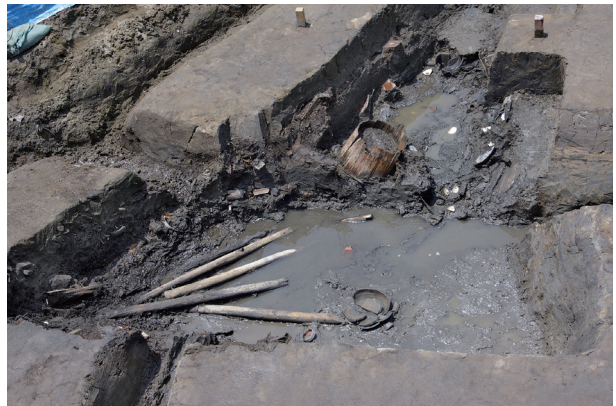
6 第 517 号土壤遺物出土狀況 (11)