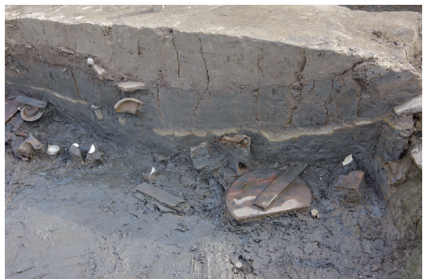
5 第 517 号土壤断面 (2)