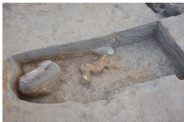
8 第 523 号土坑断面・遺物出土狀況