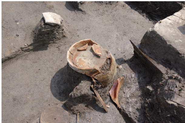
7 第 538 号土壙遺物出土狀況 (8)