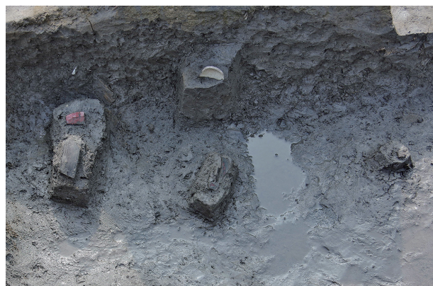
2 第 515 号土壙遺物出土状況 (4)