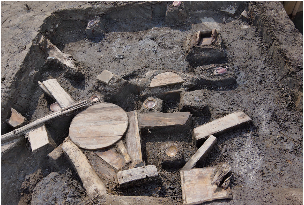
5 第 536 号土壤遺物出土狀況