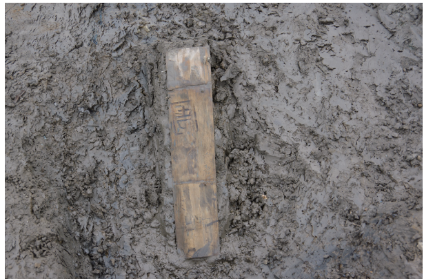
6 第 504 号土壤遺物出土狀況 (9)