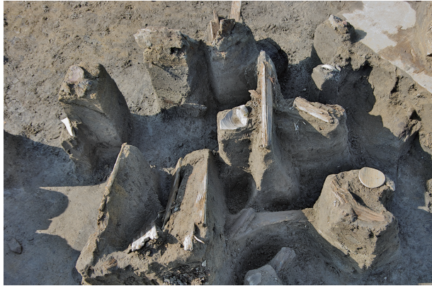
1 第 537 号土壙遺物出土狀況 (4)