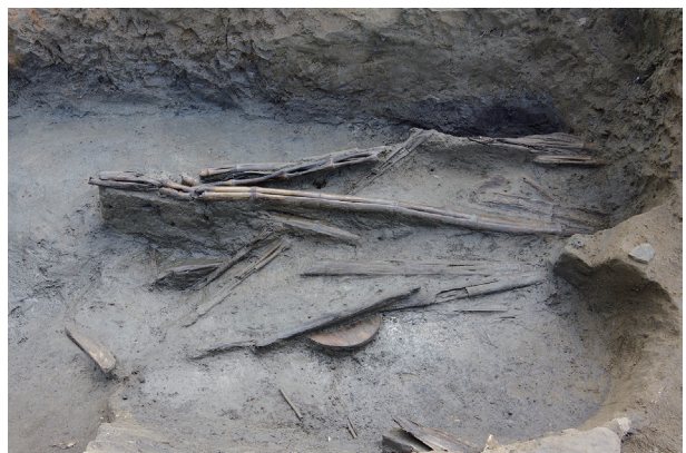
8 第 515 号土壤遺物出土狀況 (2)