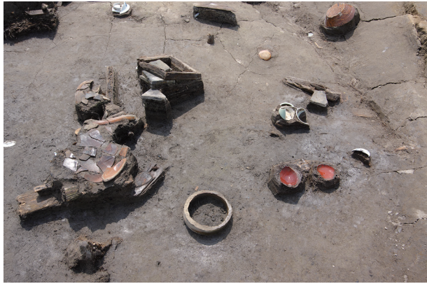
3 第 538 号土壙遺物出土狀況 (4)