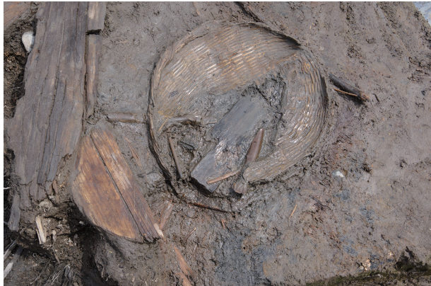
5 第 538 号土壙遺物出土狀況 (6)