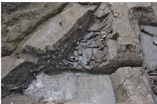
1 第517号土壌遺物出土状況(14)