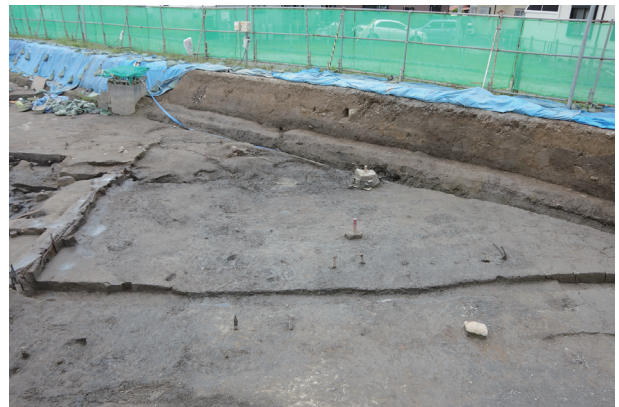
4 遺物包含層 2 (2)