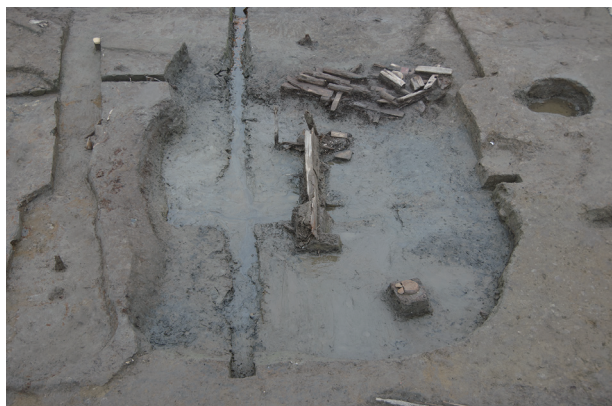
3 第 539 号土壙遺物出土状況 (1)