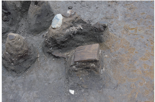
4 第 537 号土壙遺物出土狀況 (7)