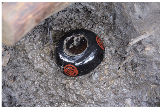
7 第 516 号土壙遺物出土状況 (3)