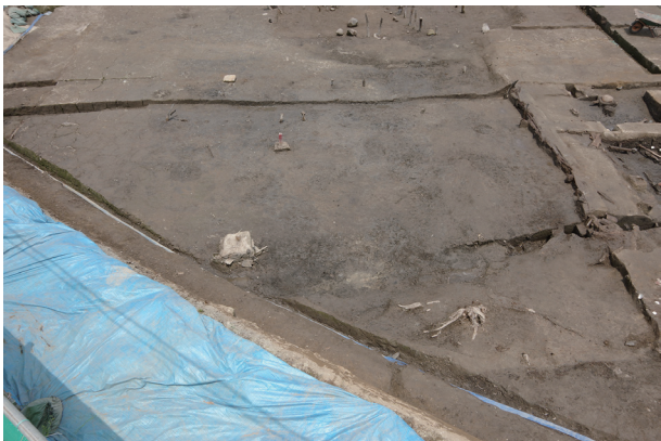
3 遺物包含層 2 (1)