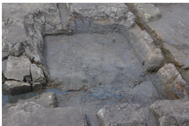
3 第 516 号土壙