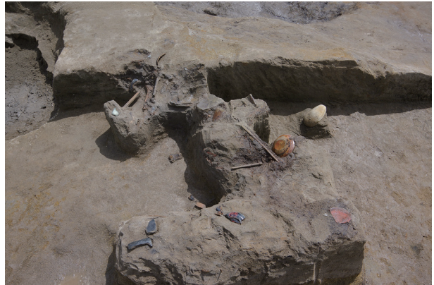
6 第 537 号土壙遺物出土狀況 (9)