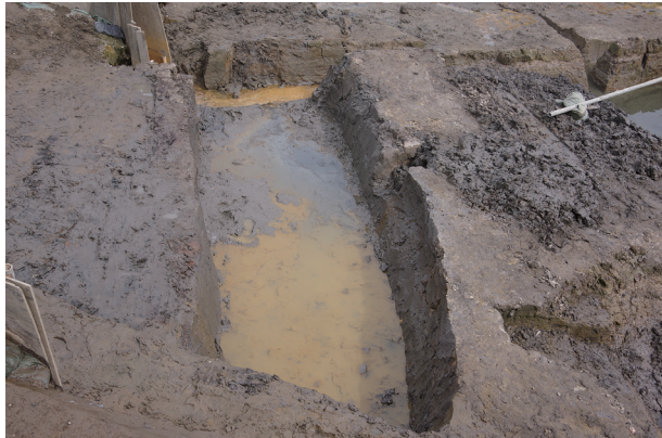
3 第 536 号土壤