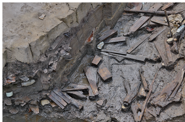
2 第517号土壌遺物出土状況(15)