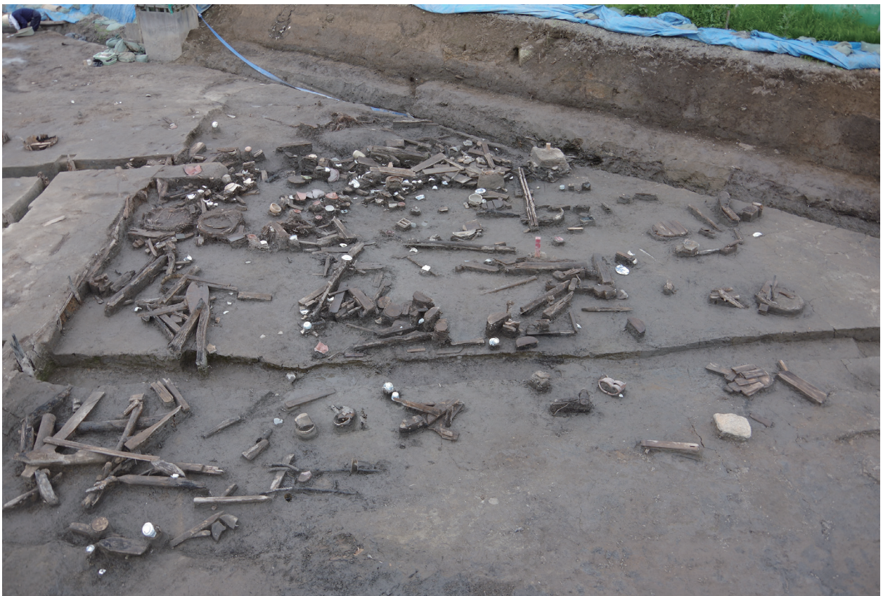
5 遺物包含層 2 遺物出土状況 (1)