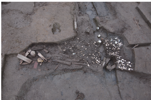
7 第 539 号土壤貝層檢出狀況 (1)