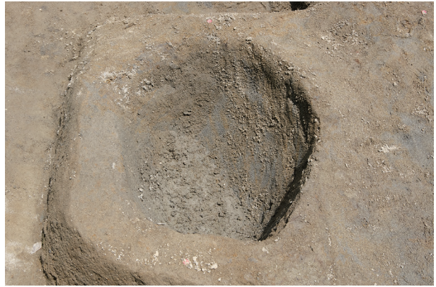
4 第 514 号土壤