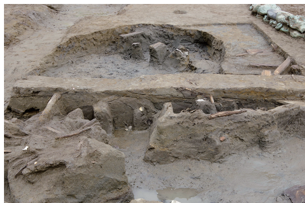
2 第 537 号土壙断面