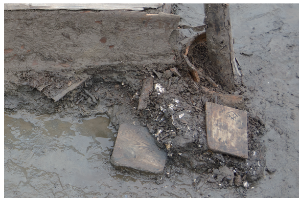
4 第 539 号土壙遺物出土状況 (2)