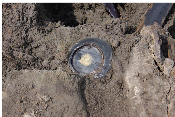
6 第 539 号土壙遺物出土状況 (4)