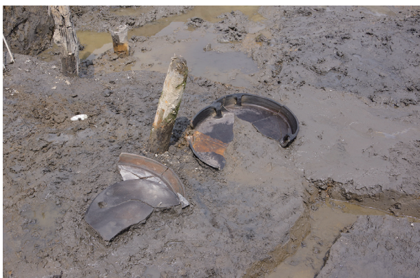
1 第504号土壌遺物出土状況(12)