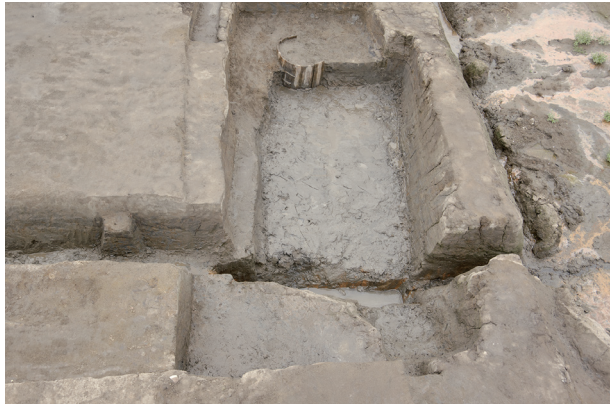
3 第 513 号土壤