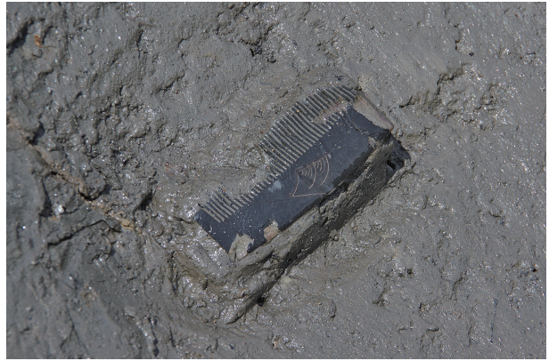
4 第 518 号土壤遺物出土狀況 (5)