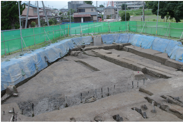
1 遺物包含層 1