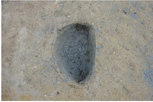
1 第 509 号土壤