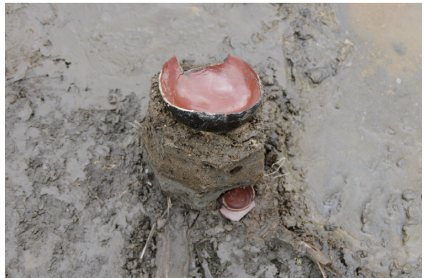
6 第 539 号土壤遺物出土狀況 (12)