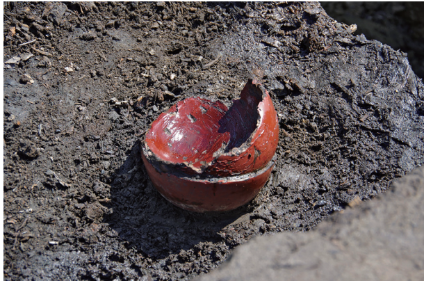
3 第 504 号土壤遺物出土狀況 (6)