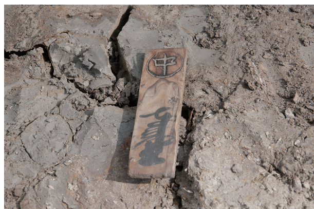
8 第 516 号土壙遺物出土状況 (4)