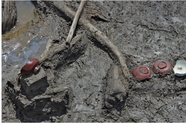
1 第 504 号土壤遺物出土狀況 (4)