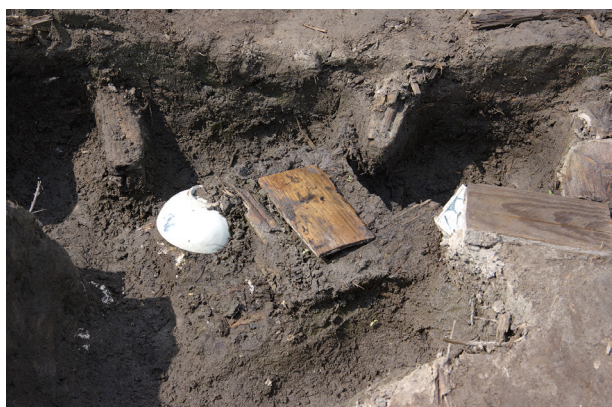
7 第 539 号土壙遺物出土状況 (5)