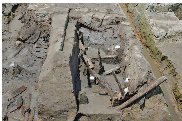
5 第 516 号土壙遺物出土状況 (1)