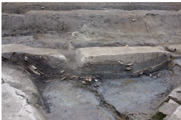
4 第 517 号土壤断面 (1)