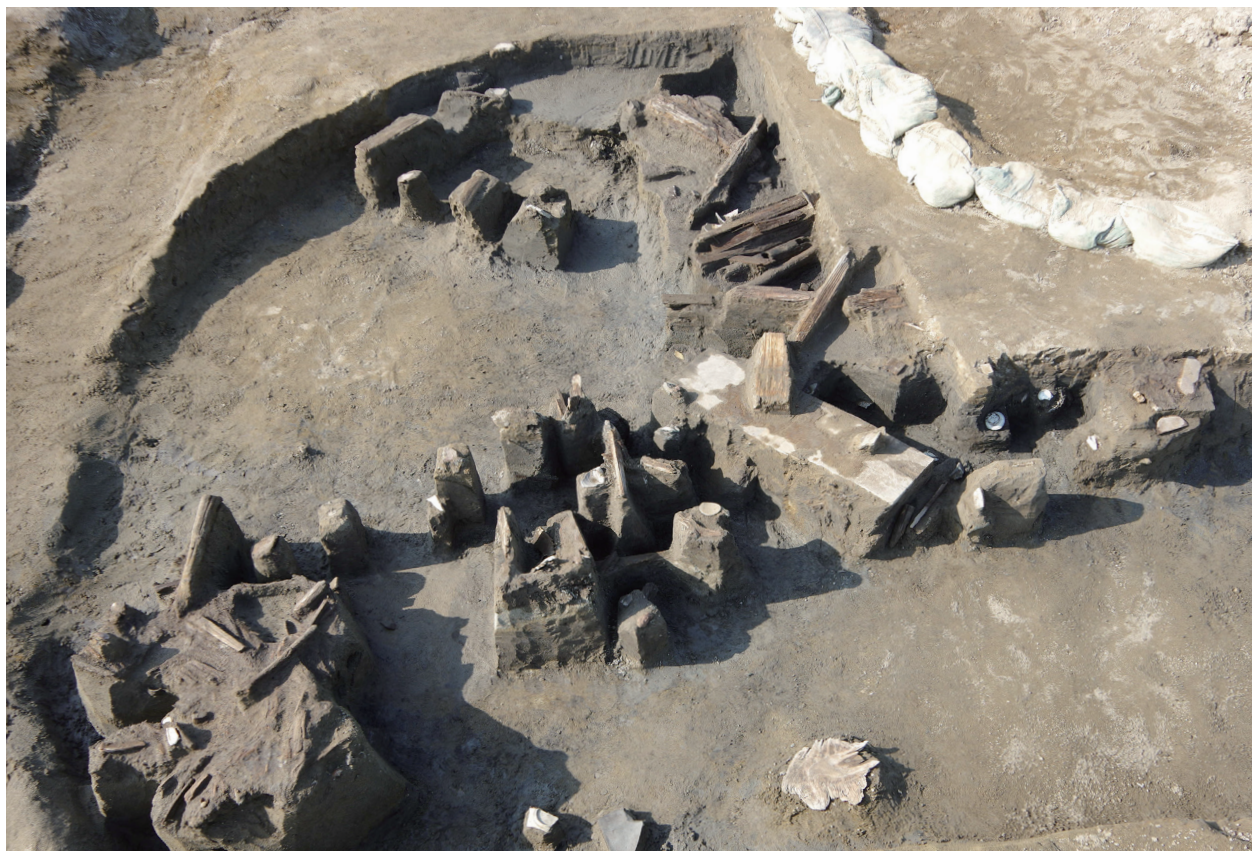
3 第 537 号土壙遺物出土状況 (1)