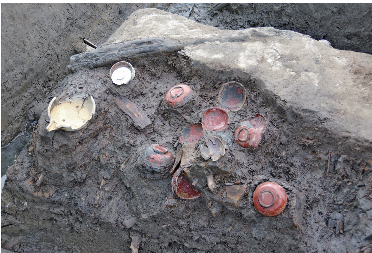
5 第518号土壌遺物出土状況(1)