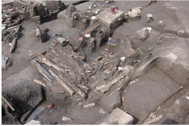
1 第 538 号土壙遺物出土狀況 (2)