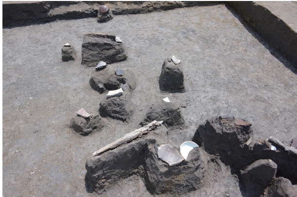
5 第 537 号土壙遺物出土狀況 (8)