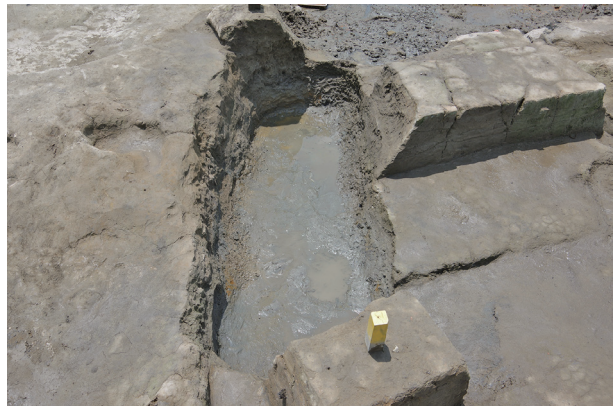
6 第 515 号土壤