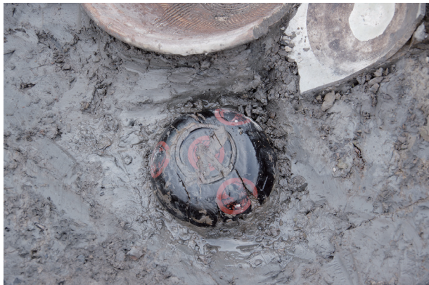
2 第 516 号土壤遺物出土狀況 (6)