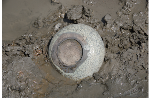
2 第 504 号土壤遺物出土狀況 (5)