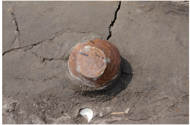
4 第 538 号土壙遺物出土狀況 (5)