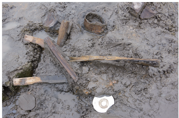
8 第 504 号土壤遺物出土狀況 (11)