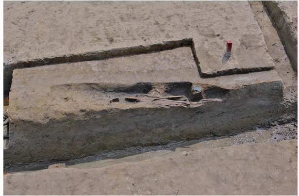
2 第 529 号土壤遺物出土狀況