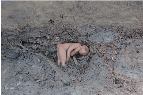
3 第 539 号土壤遺物出土狀況 (9)