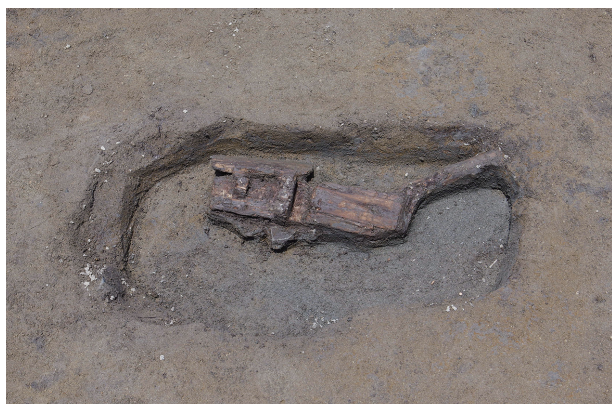
1 第 519 号土坑