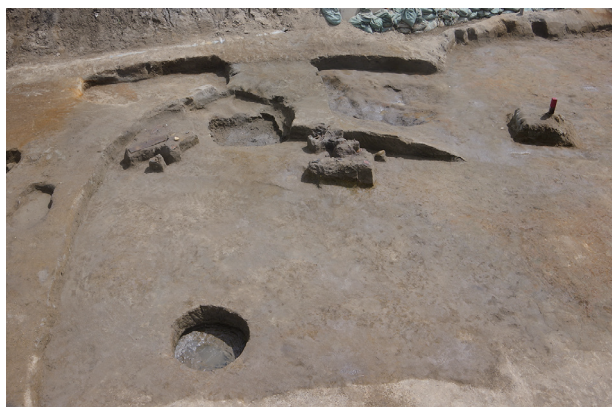
1 第 537 号土壙