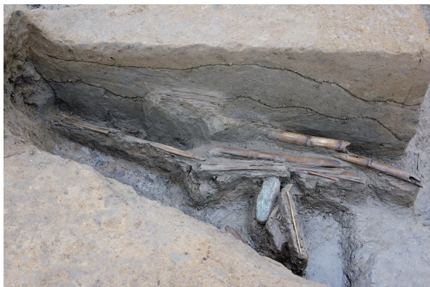
7 第 515 号土壤遺物出土狀況 (1)