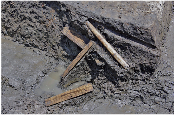
3 第 517 号土壤遺物出土狀況 (8)