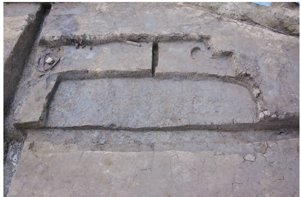
5 第 527 号土壤