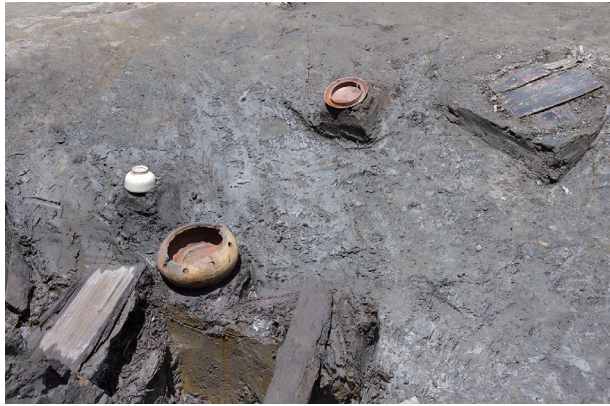
3 第 518 号土壤遺物出土狀況 (4)