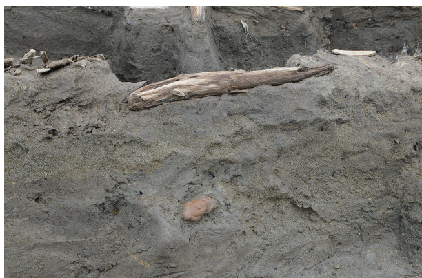
4 第 537 号土壙遺物出土状況 (2)