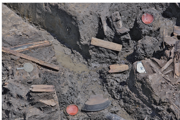
4 第 517 号土壙遺物出土状況 (4)