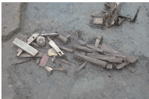
5 第 539 号土壙遺物出土状況 (3)