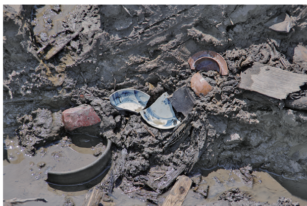
2 第 517 号土壙遺物出土状況 (2)