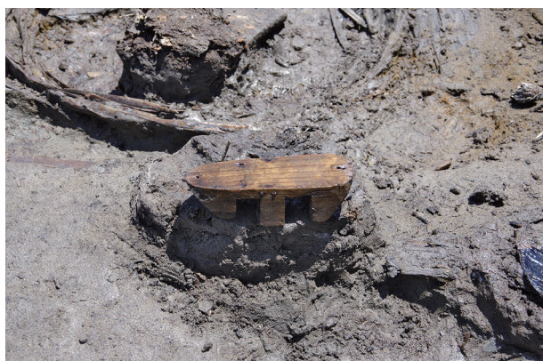
3 第 527 号土壙遺物出土状況 (5)