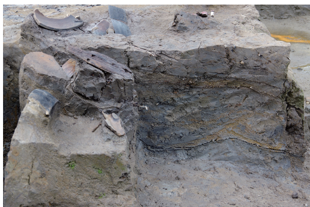
7 第 528 号土壙断面