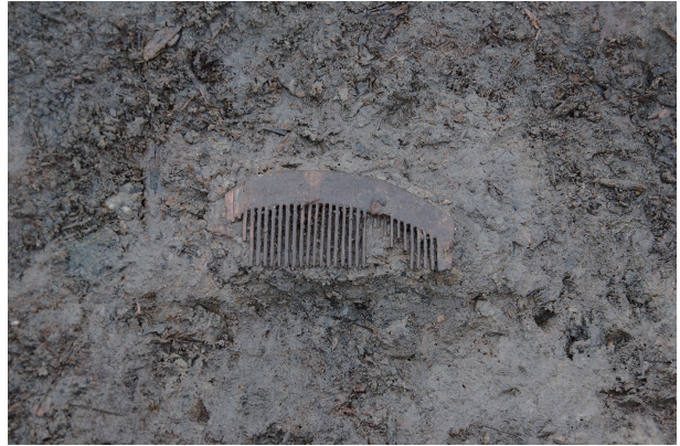
2 第 539 号土壤遺物出土狀況 (8)