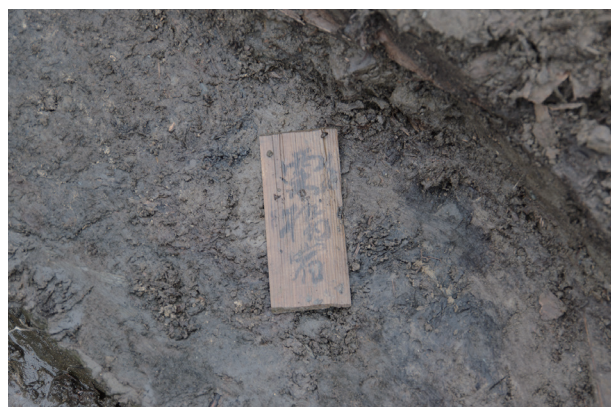
8 第 539 号土壙遺物出土状況 (6)