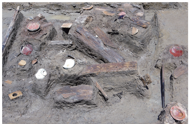
7 第 527 号土壤遺物出土狀況 (2)