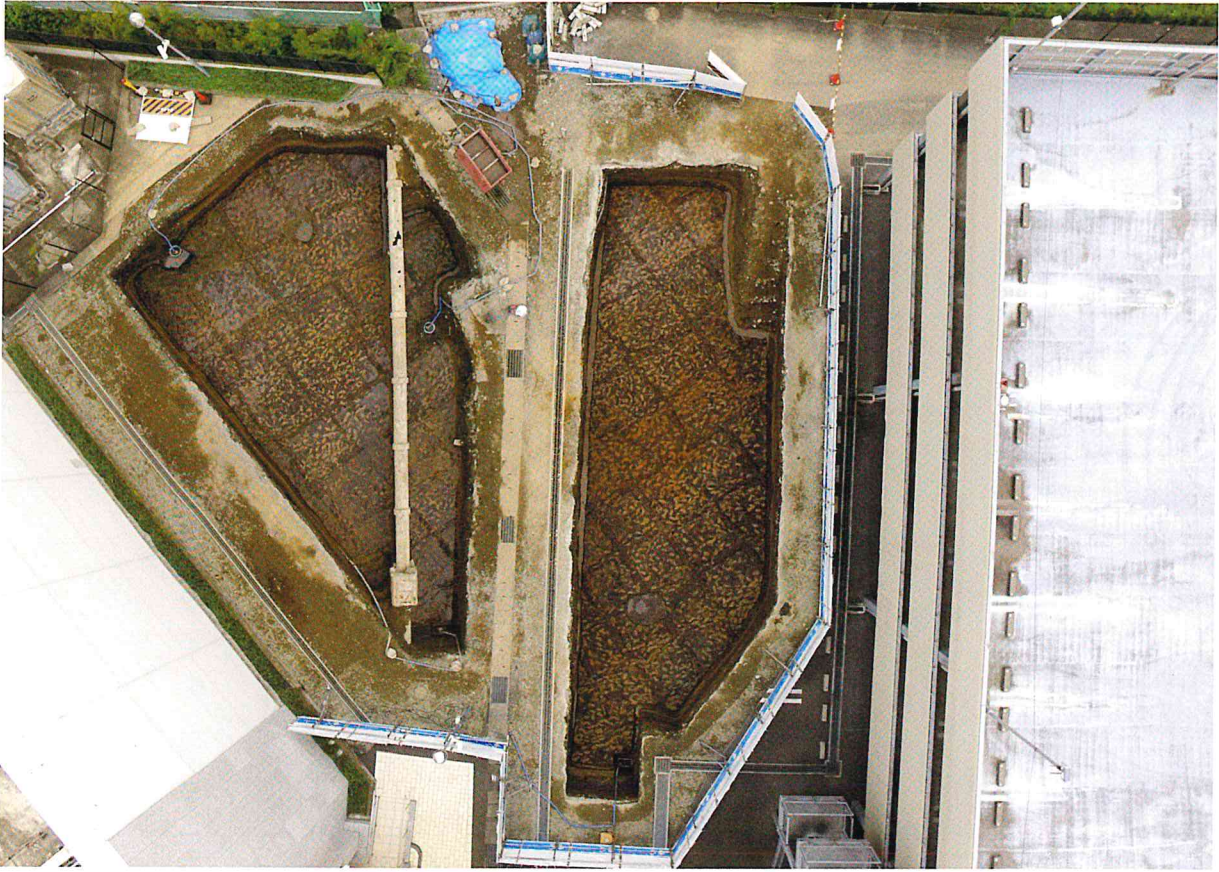
Hr-FA 泥流層下水田跡全景（上が北）