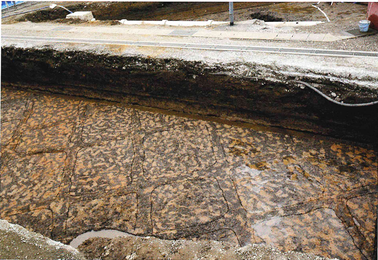
Hr-FA 泥流層下水田跡足跡検出状態（北東から）