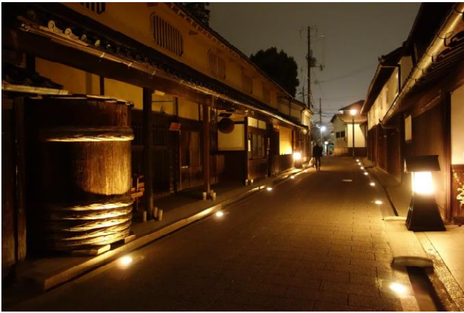
景観整備された酒蔵通りの夜景

その効果で近年ではサイクリストの増加も顕著になりました。しかし一方でそれらの人々が滞留し、楽しむ場所が少ないままで、一層まちの拠点作りの必要性が増しています。