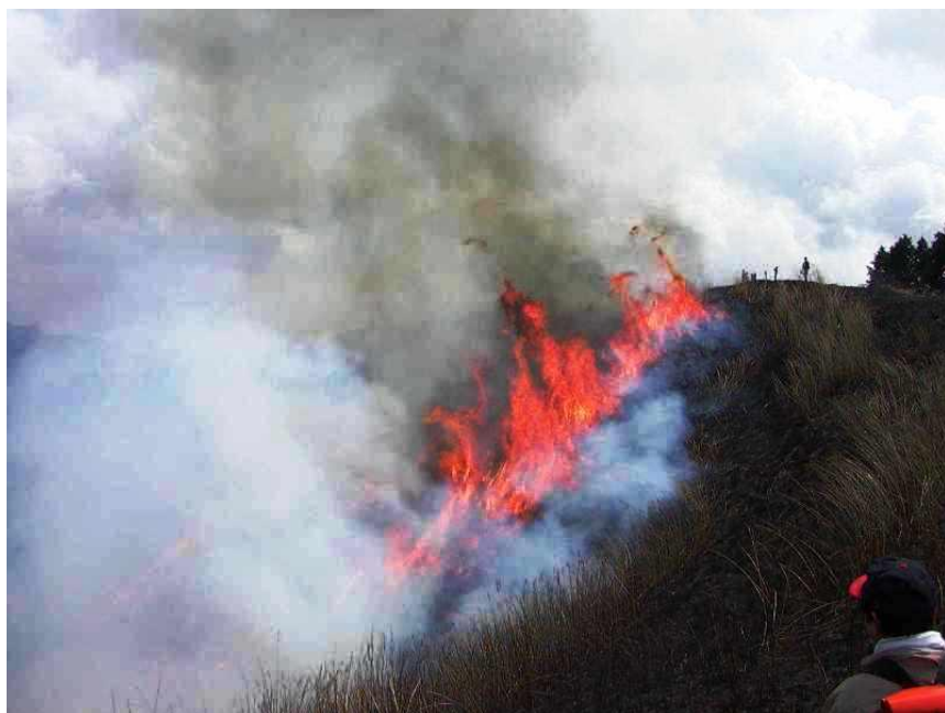
岩湧山 山カヤ焼き風景

このように、河内長野市には豊富な文化遺産があり、それを修復するための植物性資材がある。これを有機的に結びつけ、文化遺産の保存と活用をこれからも積極的に進めていかなければならない。