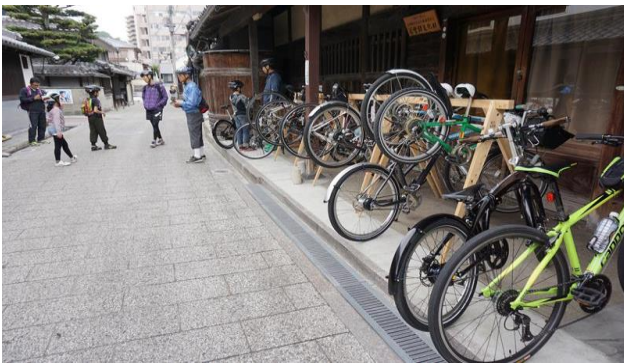
増加したサイクリング客

その効果で近年ではサイクリストの増加も顕著になりました。しかし一方でそれらの人々が滞留し、楽しむ場所が少ないままで、一層まちの拠点作りの必要性が増しています。