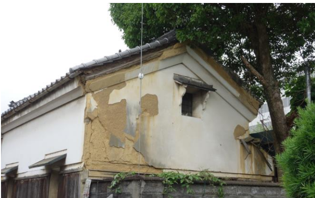
経年劣化によって損傷した外観

文化的価値のある建物を修復して保存活用することは有意義なことです、しかしそこに至るにはいくつもの困難な課題があります。