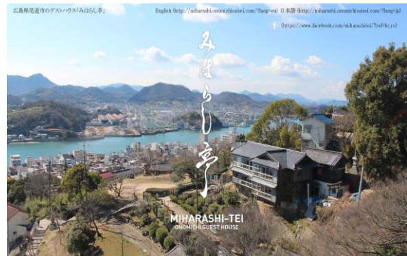
広島県尾道市のゲストハウス「みはらし亭」

広島県尾道市のゲストハウス「みはらし亭」は、「NPO法人 尾道空き家再生プロジェクト」がファンド運営会社「キャンプファイア」を利用して成功させたものです。