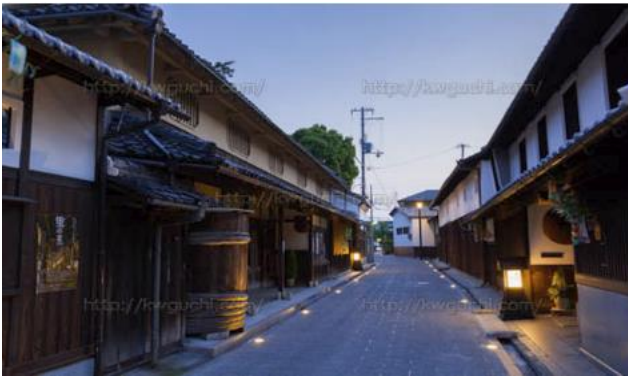
旧街道の左側が旧店舗、右側が酒蔵

旧街道をはさんで北側に店舗や酒造場などが建ち、反対の南側には国登録文化財の「サカミセ」と呼ばれていた町家の旧店舗と土蔵が建っています。また他に精米所や倉庫なども建ち並んでいます。