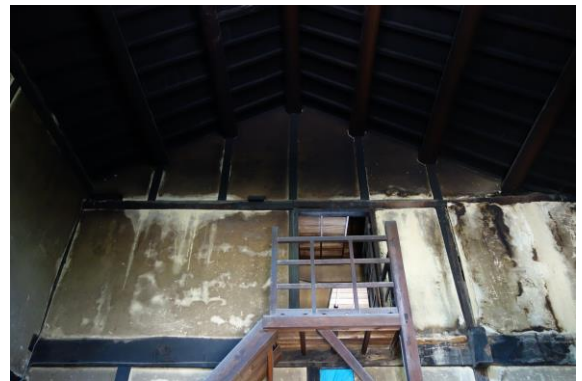
雨漏りによる損傷と耐震性の不足

また躯体の安全性や耐震性能などを正確に評価し、必要に応じて構造の補強策や躯体の保全策を講じなければならず、これにも時間と費用がかかってしまいます。