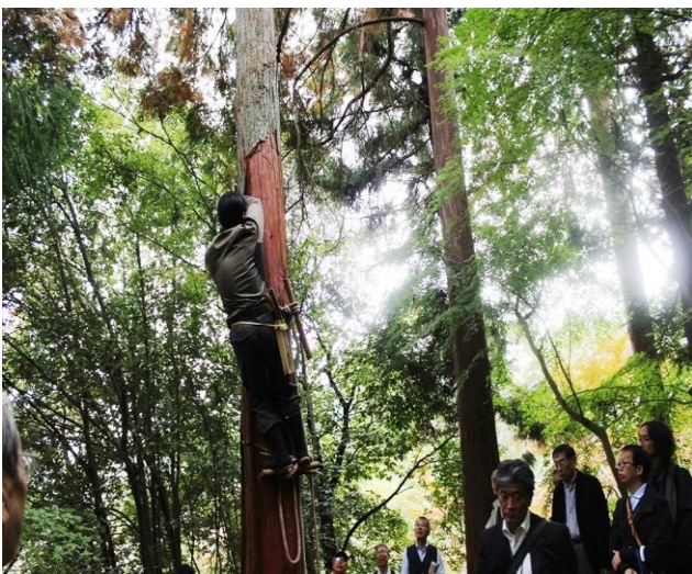
河内長野檜皮採取

このうち文化財建造物は、国宝重要文化財で構成される観心寺・金剛寺などの寺院建築群、長野神社・烏帽子形八幡神社などの神社建築群、左近家や山本家に代表される民家建築まで分布している。その他大阪府指定文化財、河内長野市指定文化財、登録文化財などを含めて建造物は 58 棟である。これらのうち 34 棟の屋根が檜