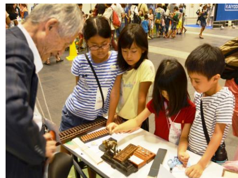
天秤バカリで物をはかる小学生

また、懐中電池ができる前、ろうそくの火が常に上を向くように工夫された「がんどろ」も展示しました。