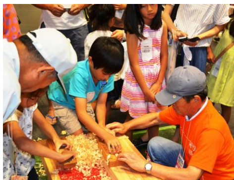
カンナをかける小学生

展示内容は、それぞれの団体の取組状況をパネル化することにしましたが、それだけでは、小学生が興味をもって取り組んでくれるとは、思われないので、何か興味をもって作れるもので、宿題として持って帰れるものが良いということで、古建築に携わっている宮