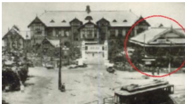
● 堺大濱潮湯本館【中央】と潮湯家族湯