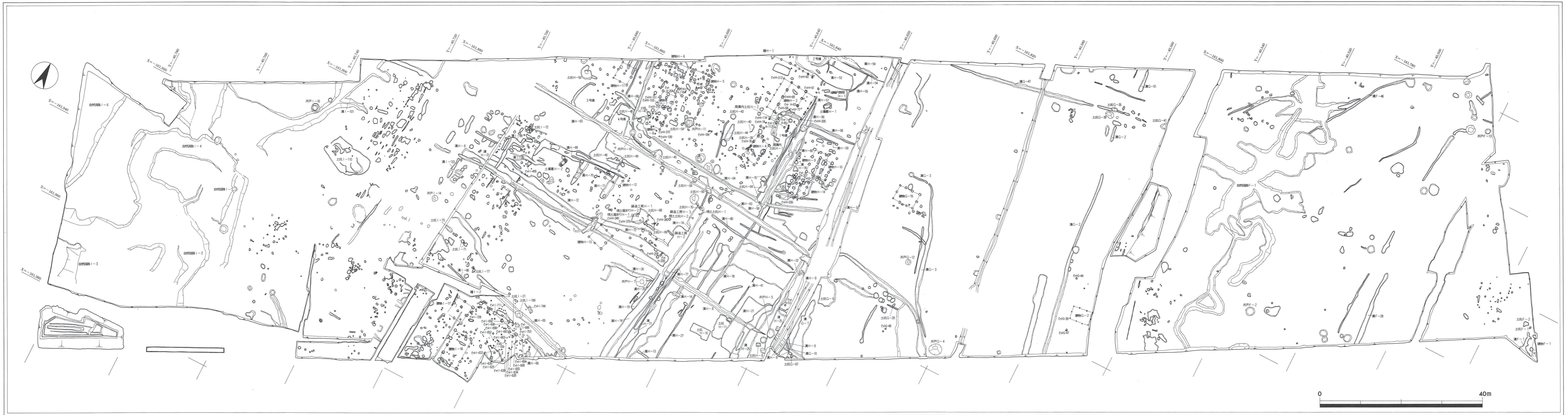
付図Ⅱ-1 Ⅱ調査区全体図