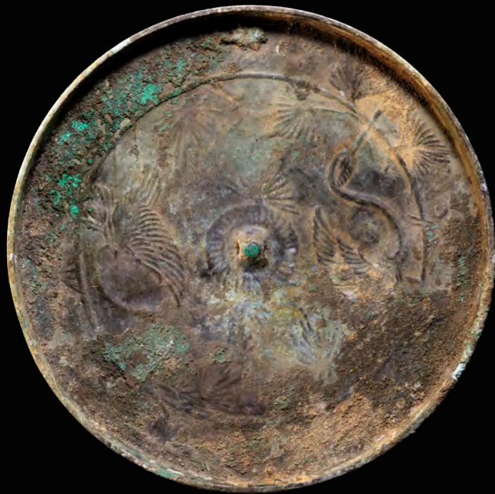
3 松喰鶴鏡 古宿遺跡(石川町) 直径 11.0 cm 縁高 0.6 cm 最大厚 0.4 cm 重量 84g