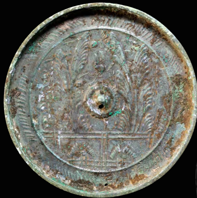
4 竹垣双雀鏡 古宿遺跡(石川町) 直径 9.8 cm 縁高 0.5 cm 最大厚 0.4 cm 重量 64g