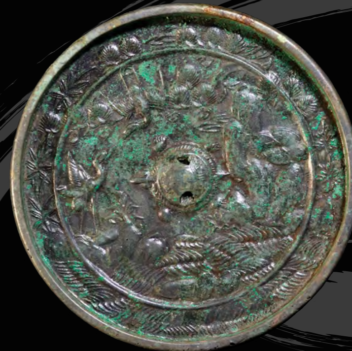
6 蓬莱鏡 向山遺跡(相馬市) 直径 10.9 cm 縁高 1.0 cm 最大厚 0.9 cm 重量 393g

6は5と同様に蓬莱鏡と分類されます。鏡背面の中央には、亀形の鈕が設けられ、頭や手足の表現だけでなく、甲羅には六角形の亀甲模様が施されています。亀形鈕の左側には、二羽の鶴を配し、鈕の右側には滝を表現する流水文が見られます。鈕の下部は内区と外区を跨ぐように、大海のうねりを表す波文が描かれています。鶴や山水文の周りから外区にかえては、松葉や竹を散らし、鏡背面の全体が縁起の良い風景や動植物で飾られています。