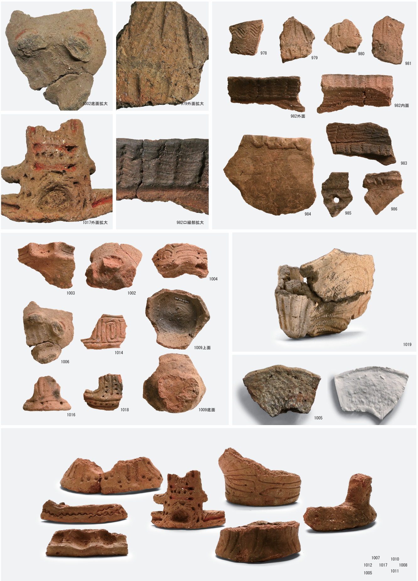
脚・特殊器種・時期不明の土器