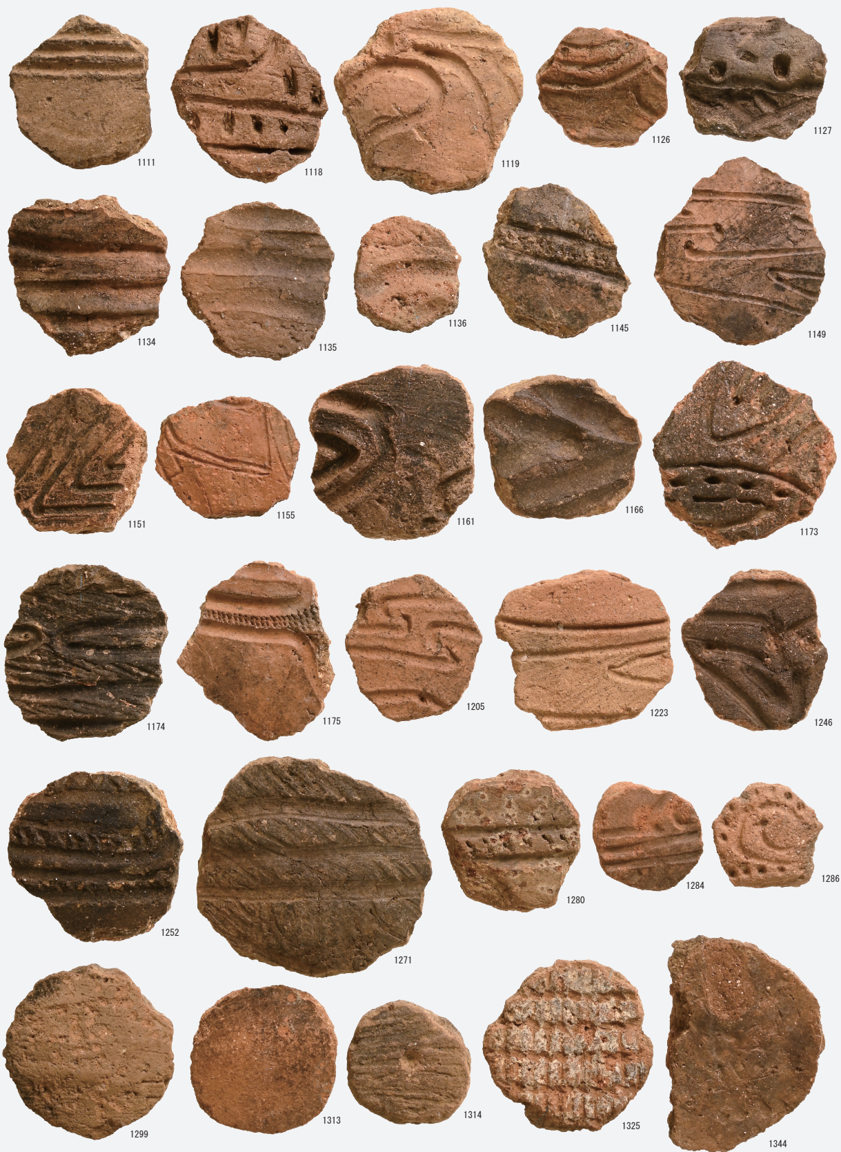
円盤状土製加工品