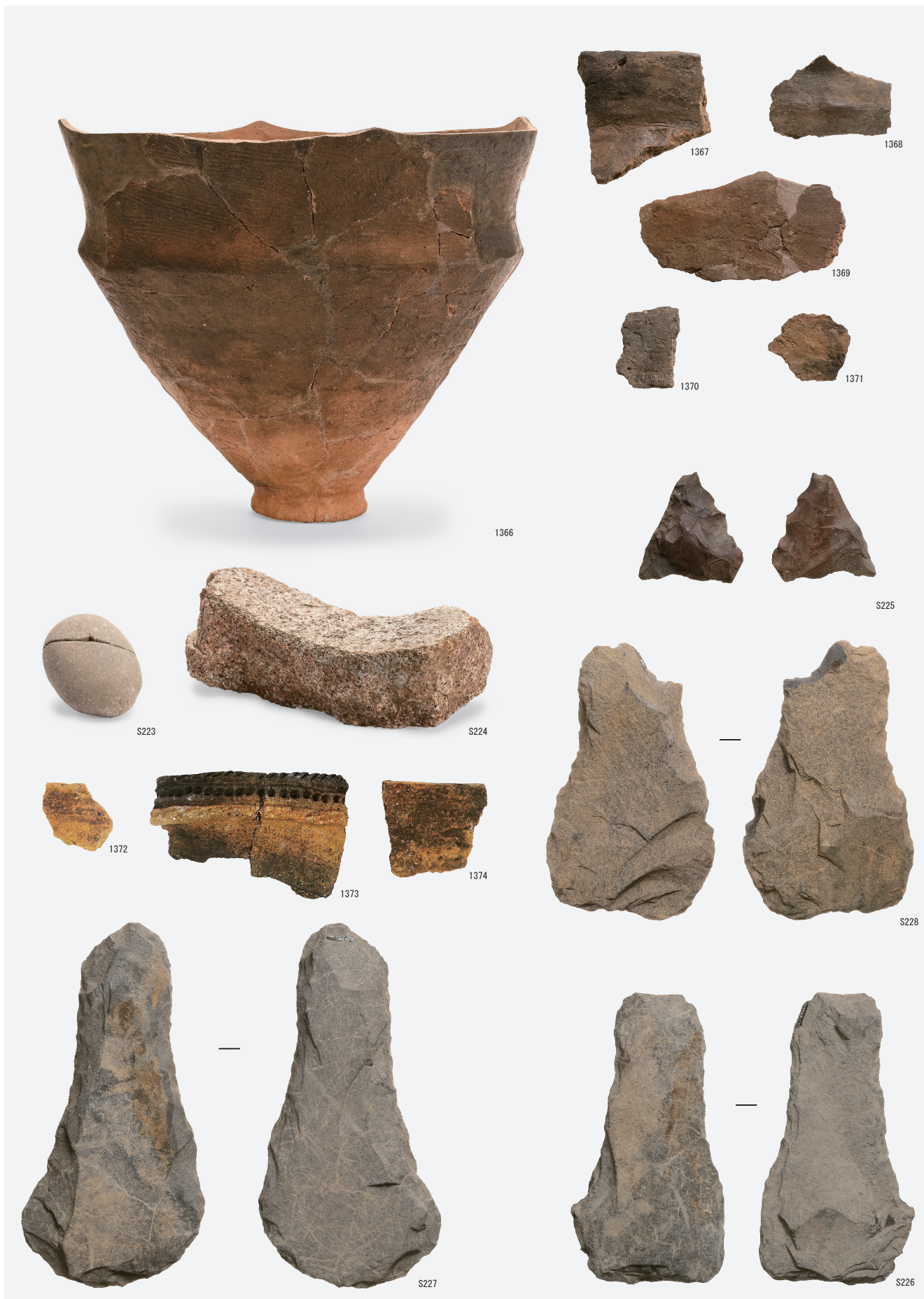
繩文時代晚期遺構内出土遺物