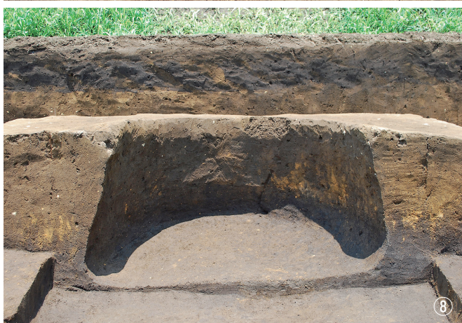
①②土坑59号土器検出と完掘 ③④⑤⑥土坑61号調査過程 ⑦⑧土坑62号断面と半裁完掘