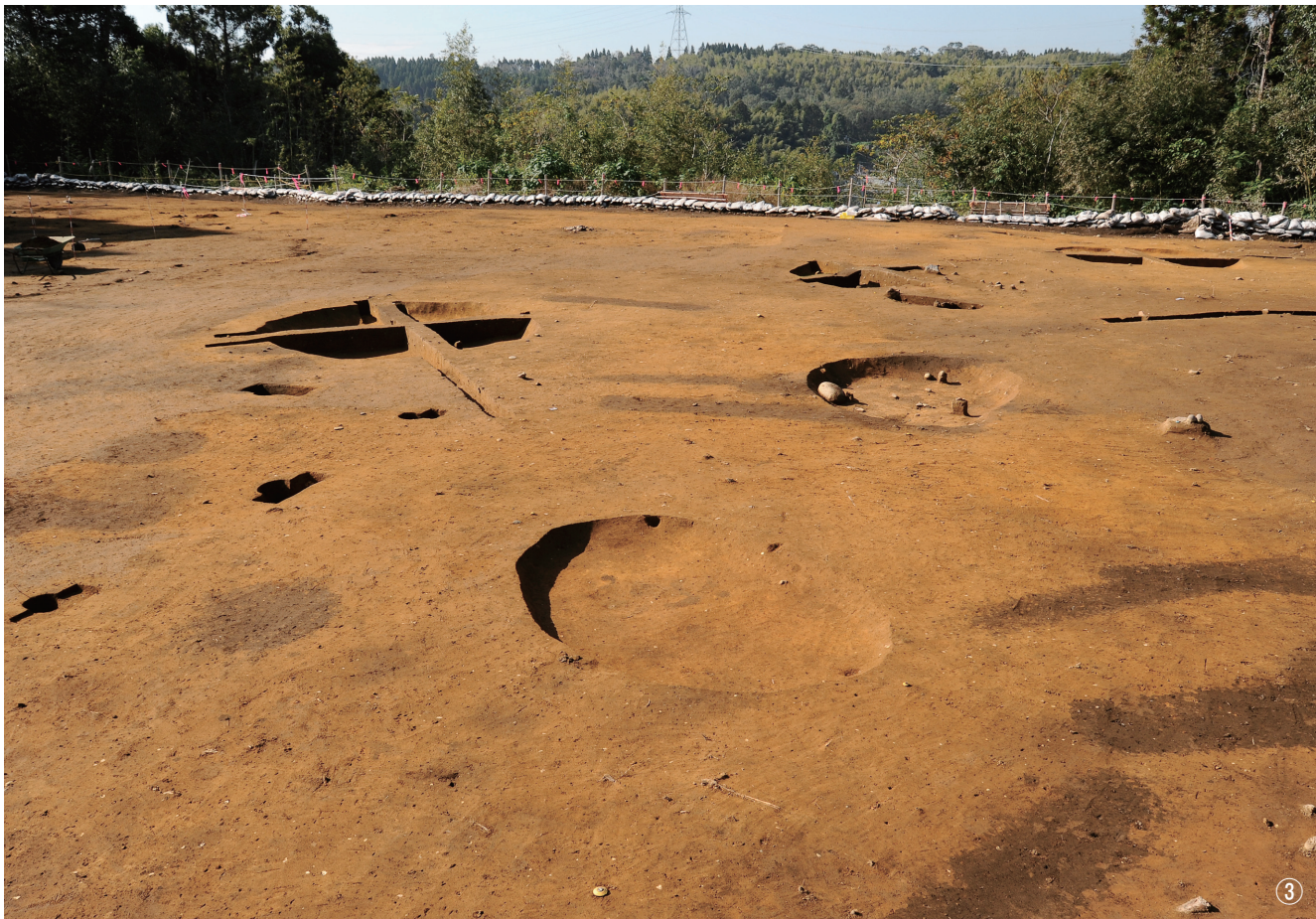
① 竪穴建物跡 2号検出 ② 竪穴建物跡 2号断面 ③ 竪穴建物跡 2号完掘