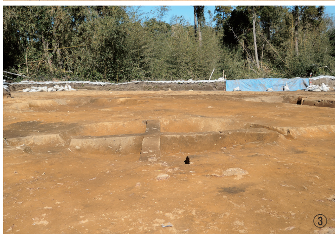
① 竪穴建物跡7号遺物出土状況 ② 竪穴建物跡7号東西断面 ③ 竪穴建物跡7号南北断面 ④ 竪穴建物跡7号完掘