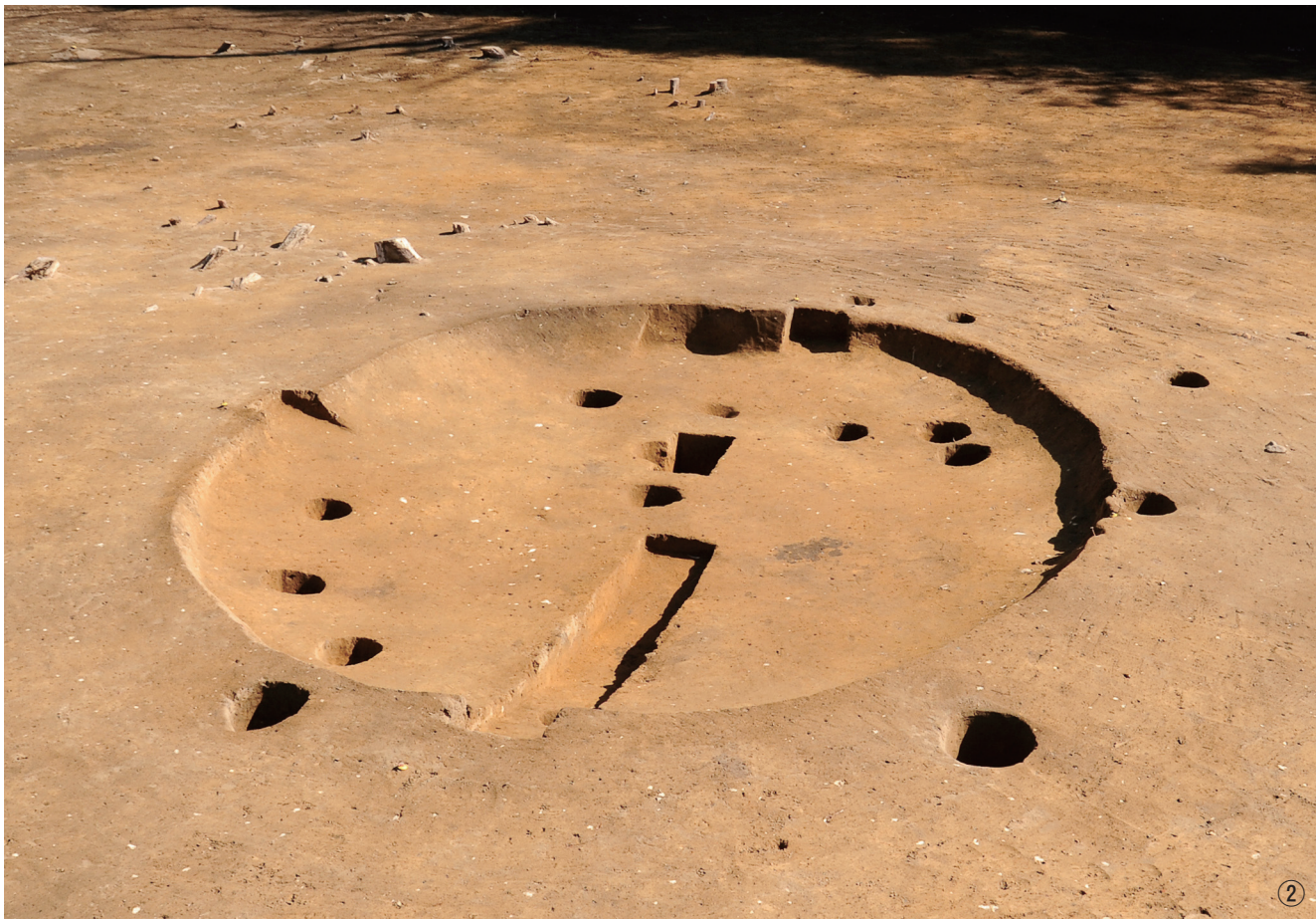
① 竪穴建物跡 1号土層断面 ② 竪穴建物跡 1号完掘