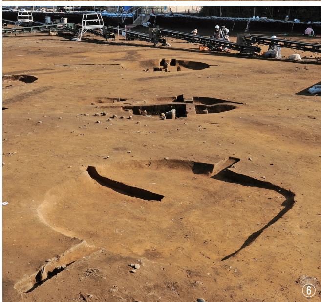
① 竖穴建物跡 3号検出 ② 竖穴建物跡 3号遺物出土状況 ③ 竖穴建物跡 3号完掘 ④ 竖穴建物跡 4号検出 ⑤ 竖穴建物跡 4号断面 ⑥ 竖穴建物跡 4号完掘