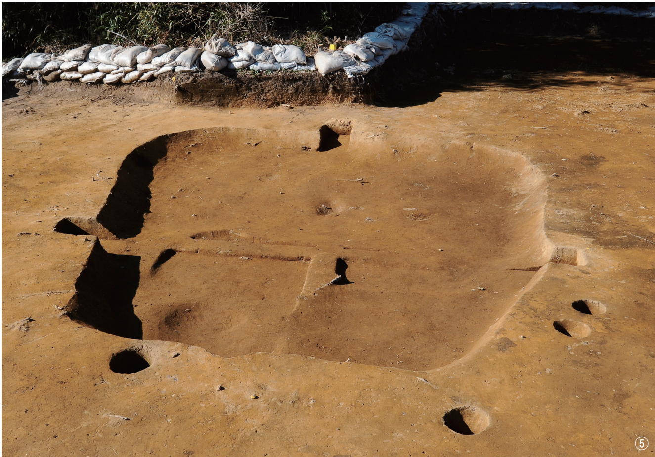
① 竖穴建物跡8号検出 ② 竖穴建物跡8号断面 ③ 竖穴建物跡8号完掘 ④ 竖穴建物跡9号断面 ⑤ 竖穴建物跡8・9号完掘