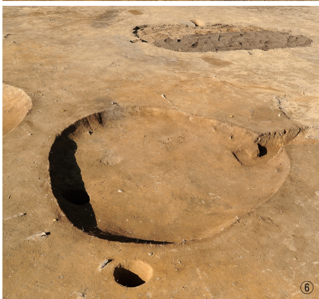
① 竖穴建物跡10号検出 ② 竖穴建物跡10号遺物出土状況 ③ 竖穴建物跡10号完掘 ④ 竖穴建物跡11号断面 ⑤ 竖穴建物跡11号遺物出土状況 ⑥ 竖穴建物跡11号完掘