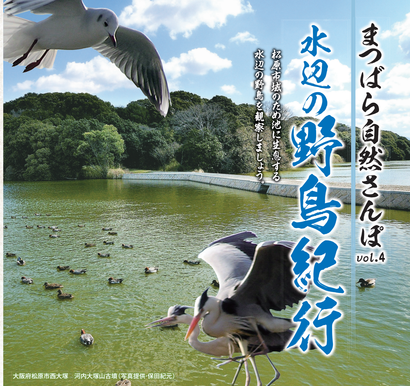
大阪府松原市西大塚 河内大塚山古墳

※西田孝司「松原市域の大きな変化」(『松原市史』第2巻 本文編2、2008年)より加筆