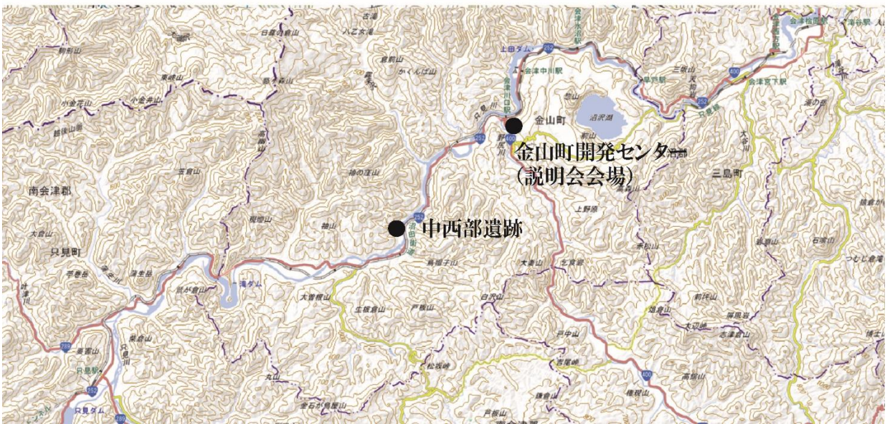
図1 中西部遺跡の位置