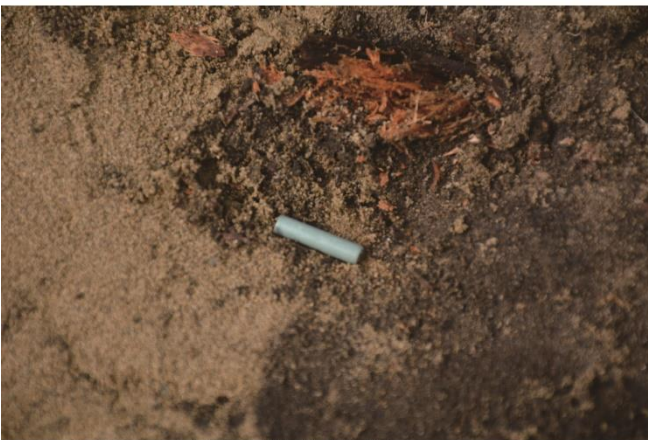
写真5 管玉出土状況