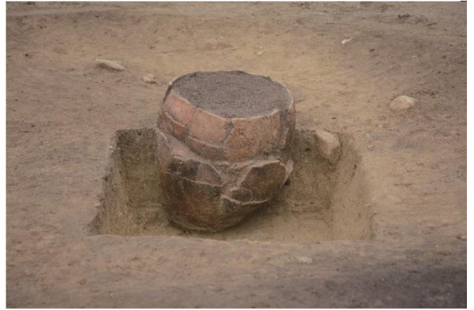
写真2 土器埋設遺構