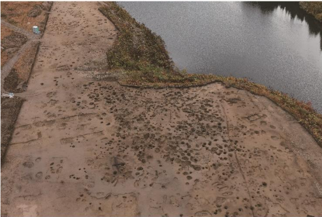
写真3 遺構密集部分