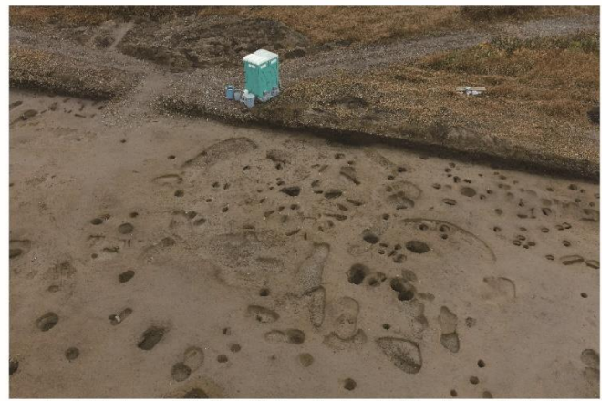
写真6 溝を巡らせた平地式の住居跡