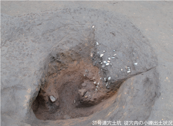
31号連穴土坑 從穴内の小礫出土状況