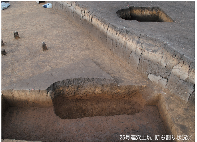
25号連穴土坑 断ち割り状況②