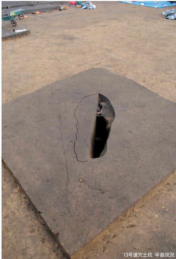
13号連穴土坑 半截状况