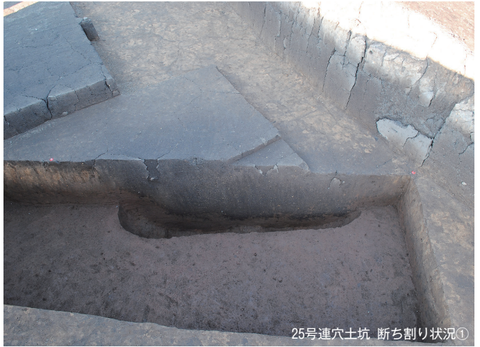
25号連穴土坑 断ち割り状況①