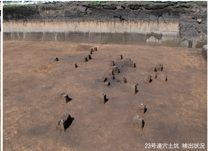
23号連穴土坑 検出状況