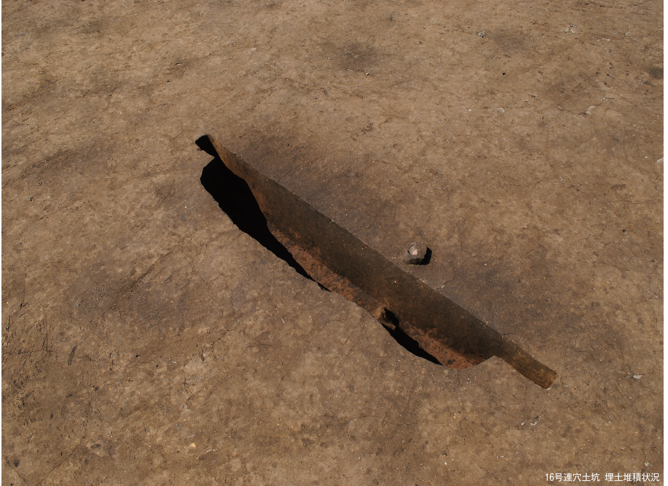
16号連穴土坑 埋土堆積状況