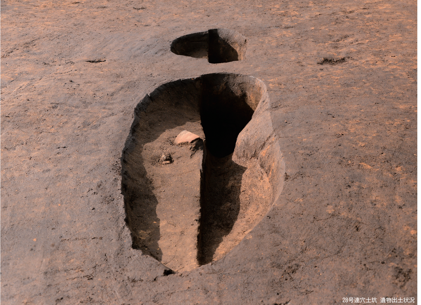
28号連穴土坑 遺物出土状況