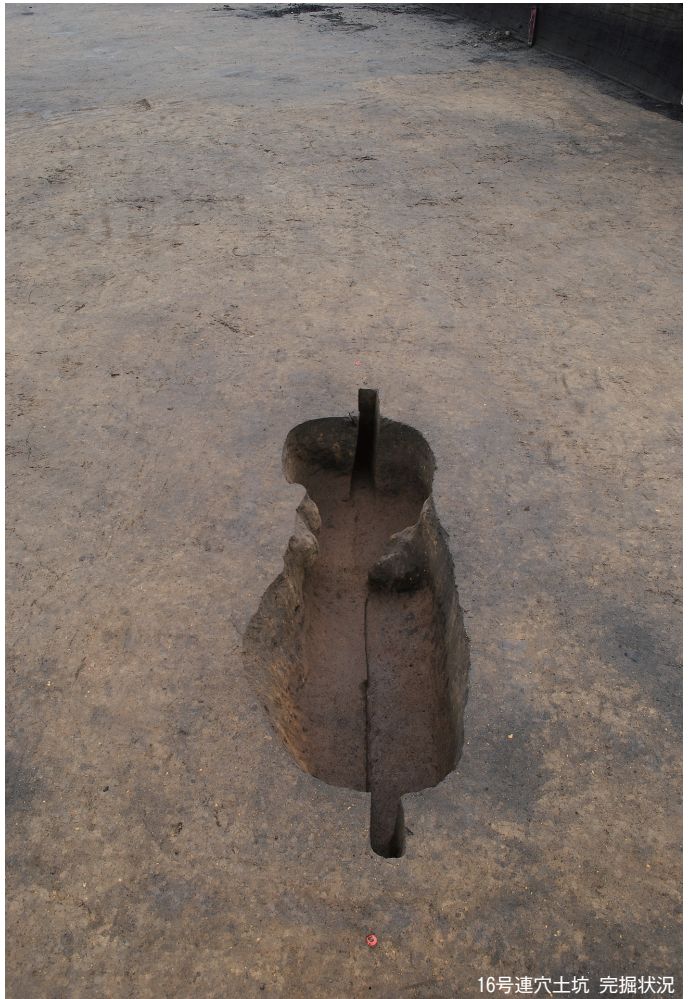
16号連穴土坑 完掘状況