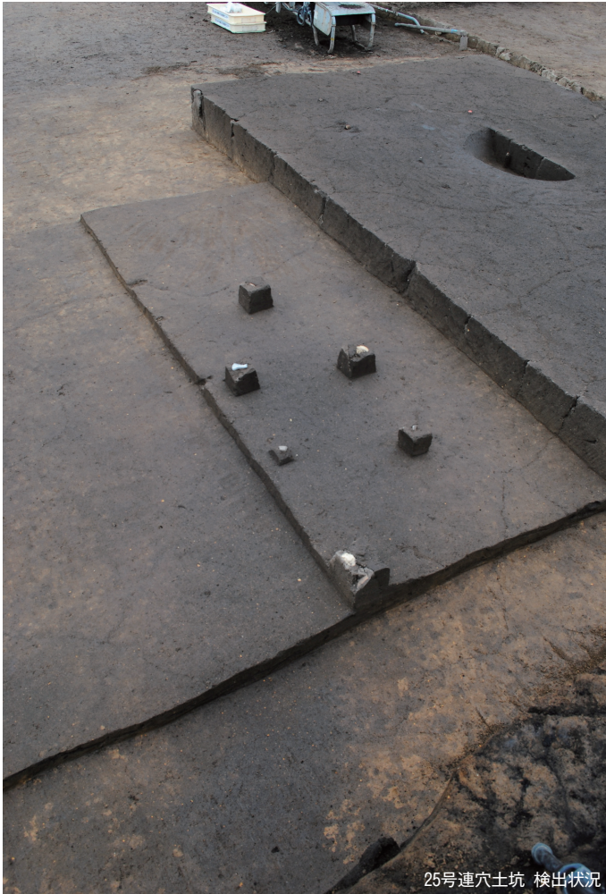
25号連穴土坑 検出状況