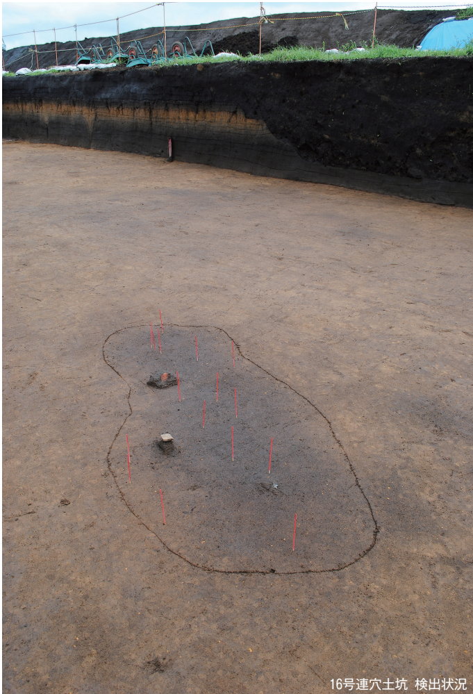
16号連穴土坑 検出状況