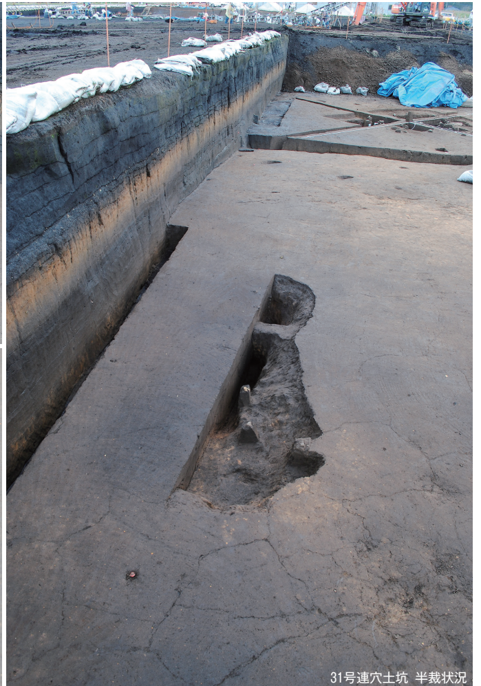
31号連穴土坑 半裁状況