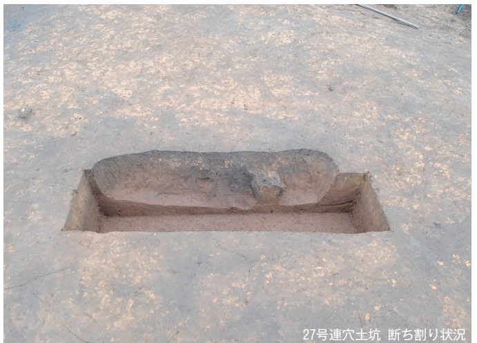
27号連穴土坑 断ち割り状況