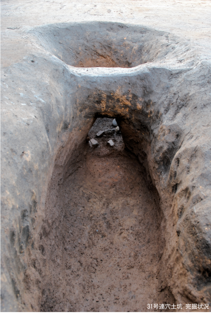
31号連穴土坑 完掘状況