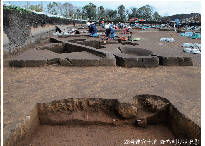
23号連穴土坑 断ち割り状況②