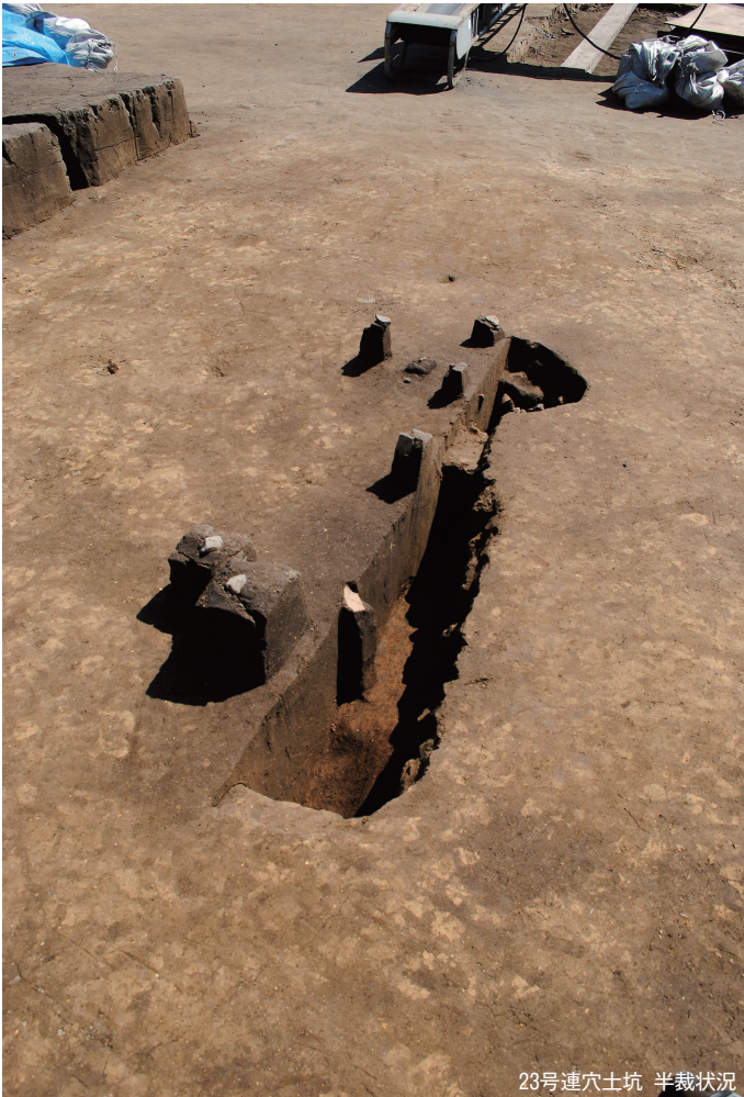
23号連穴土坑 半裁状況