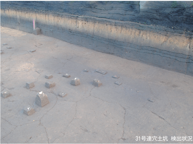
31号連穴土坑 検出状況