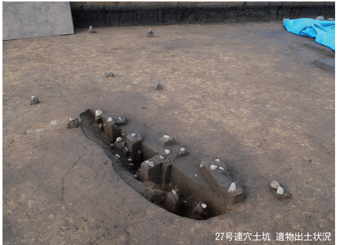
27号連穴土坑 遺物出土状況