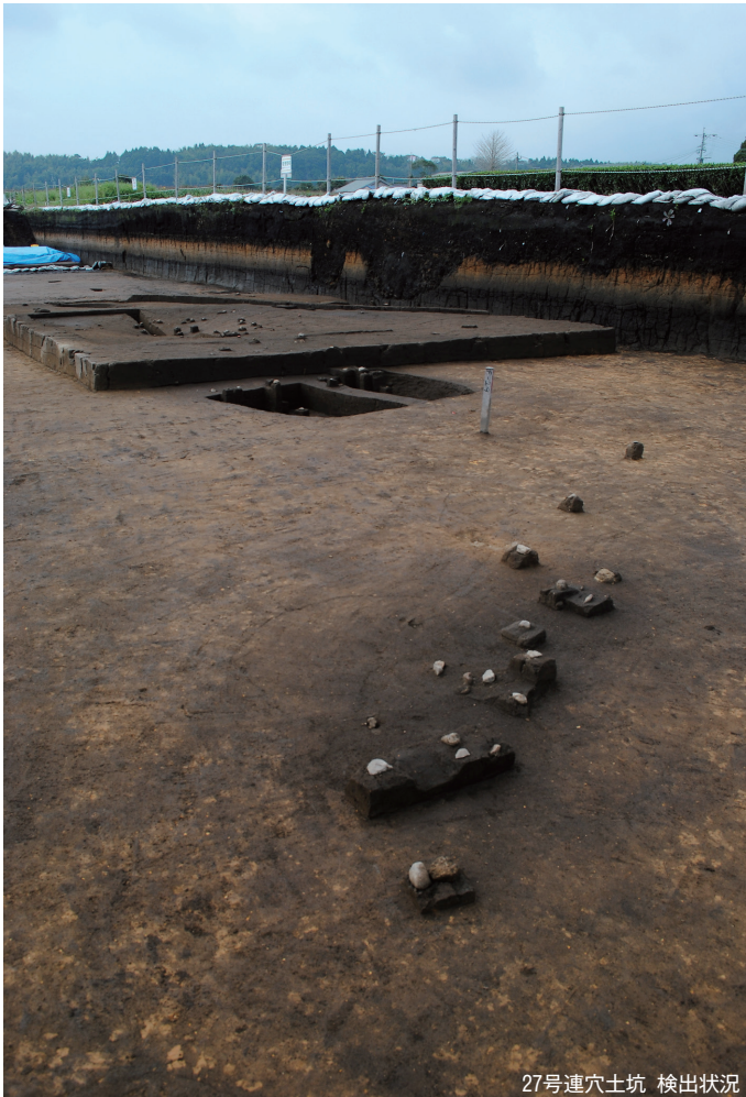
27号連穴土坑 検出状況