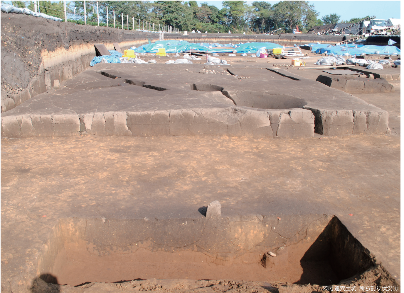
23号連穴土坑 断ち割り状況①