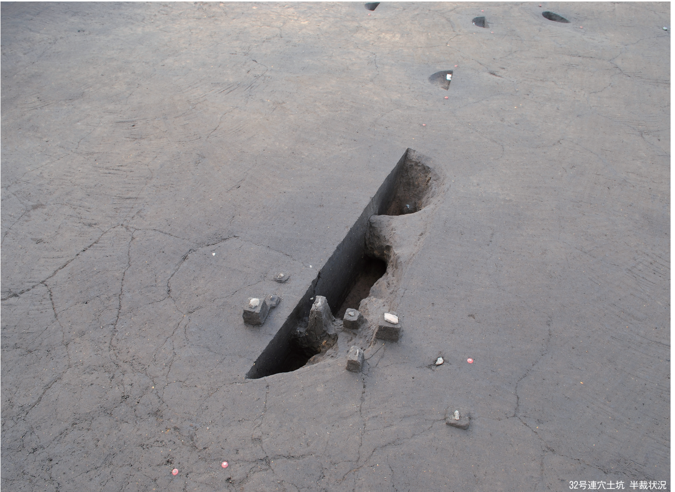
32号連穴土坑 半裁状況