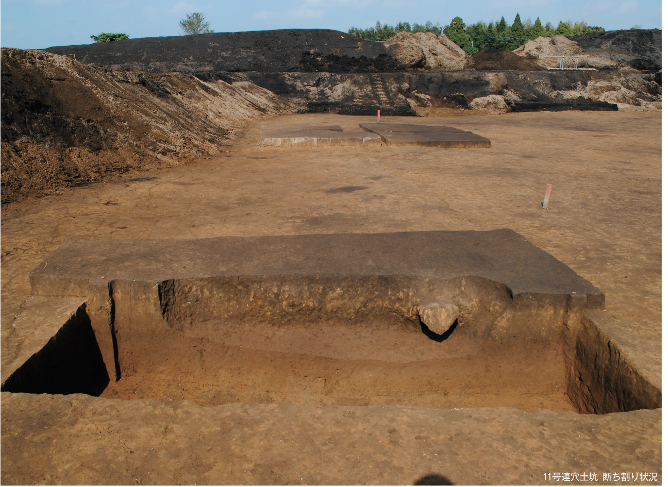
11号連穴土坑 断ち割り状況