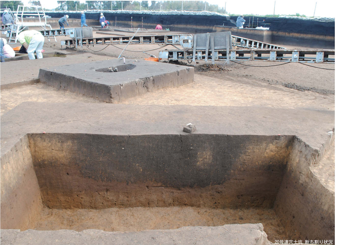
20号連穴土坑 断ち割り状況