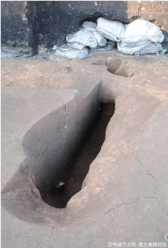
22号連穴土坑 埋土堆積状況