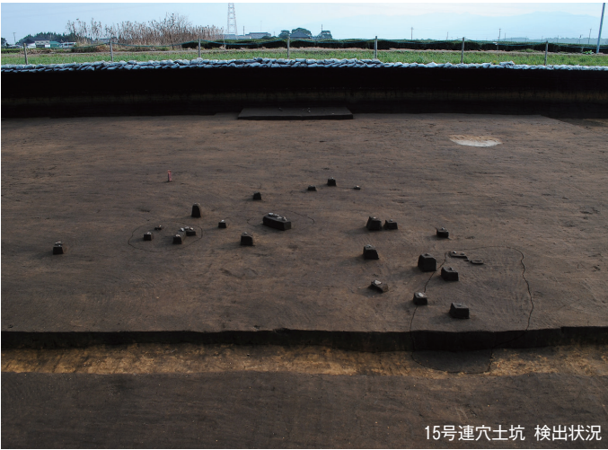
15号連穴土坑 検出状況