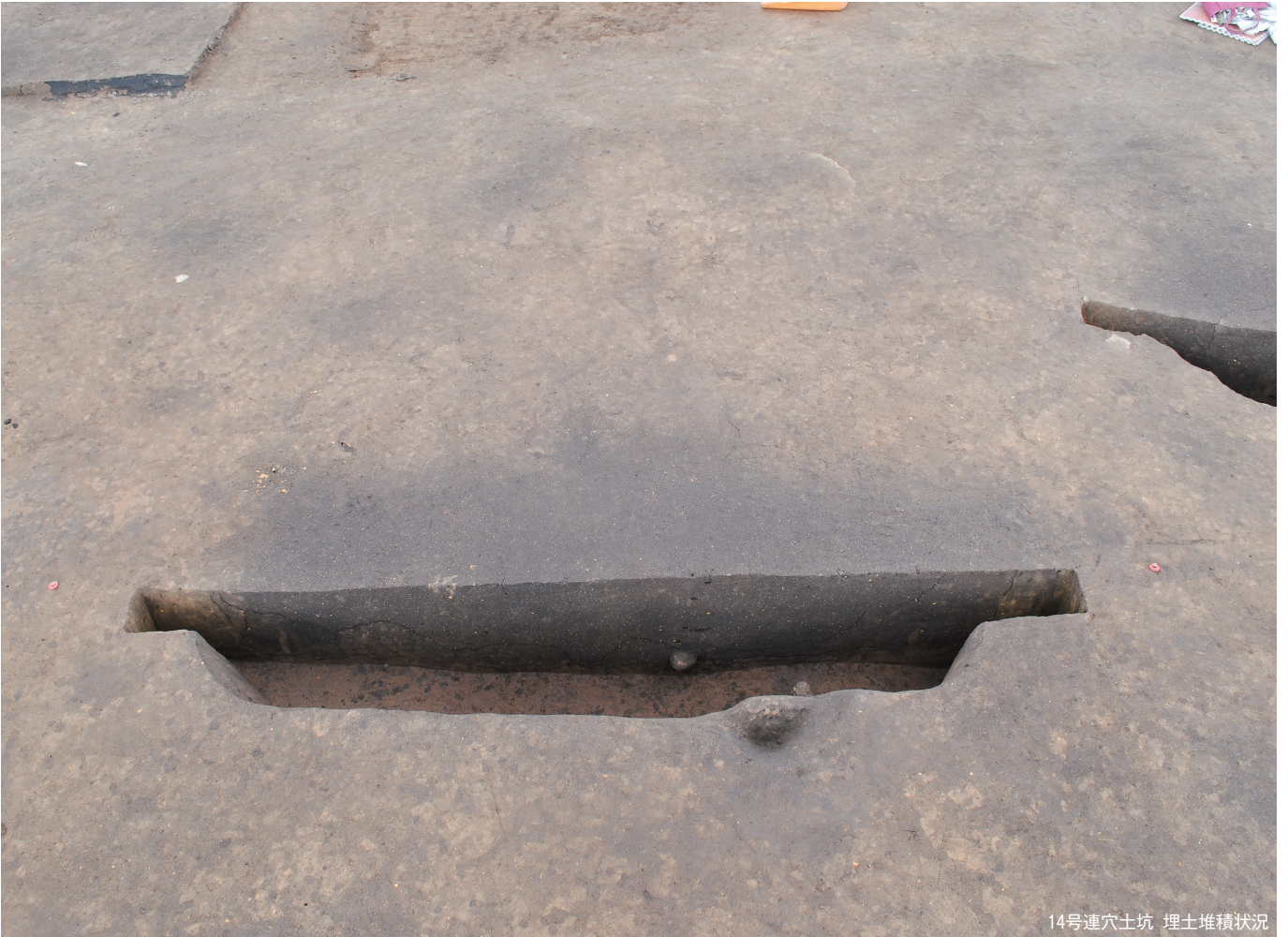
14号連穴土坑 埋土堆積状況