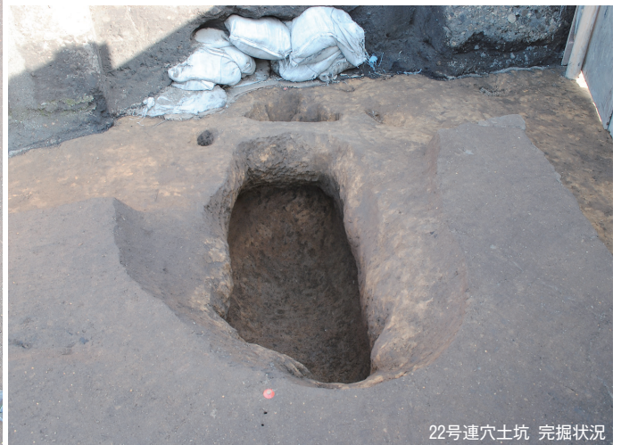
22号連穴土坑 完掘状況