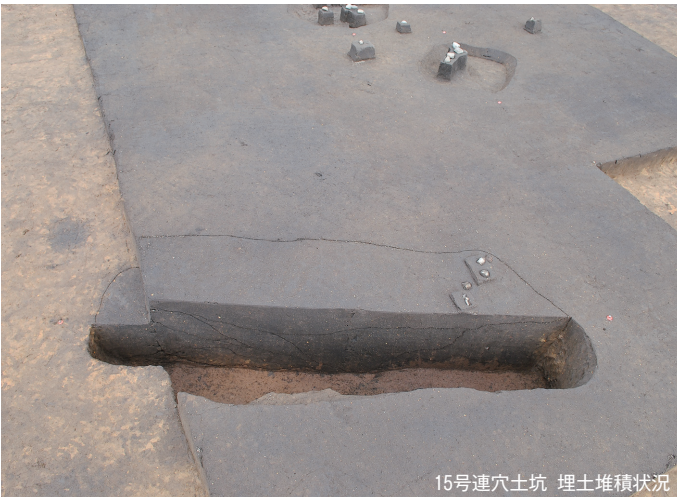
15号連穴土坑 埋土堆積状況