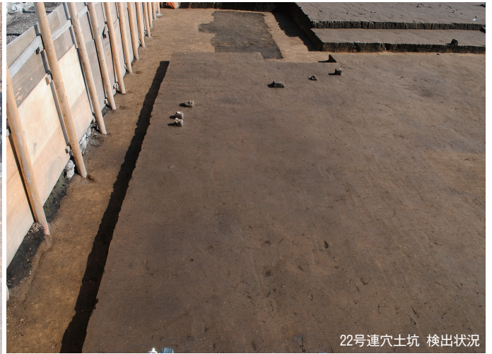
22号連穴土坑 検出状況