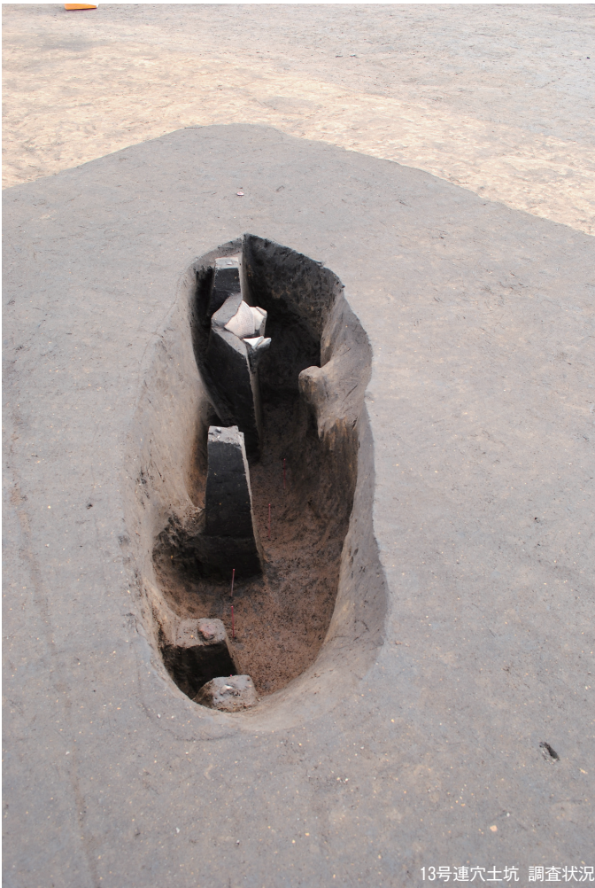
13号連穴土坑 調査状况