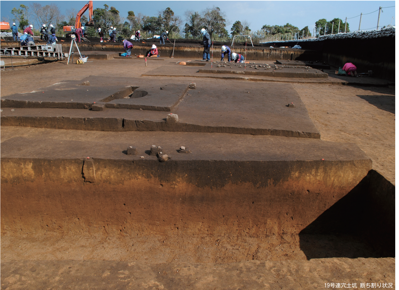
19号連穴土坑 断ち割り状況