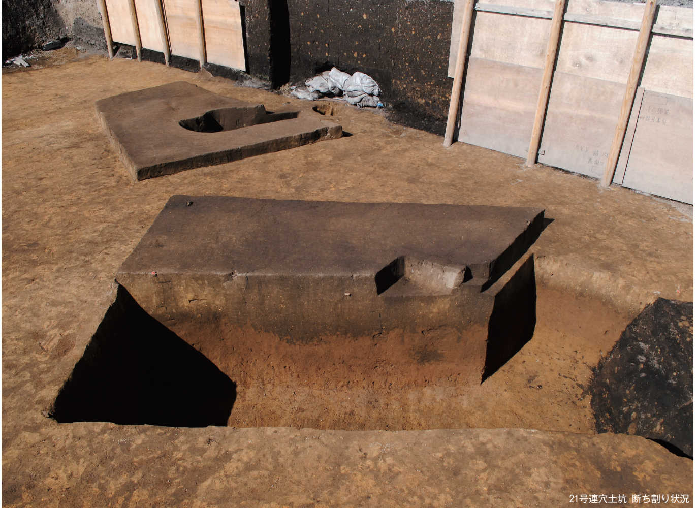
21号連穴土坑 断ち割り状況