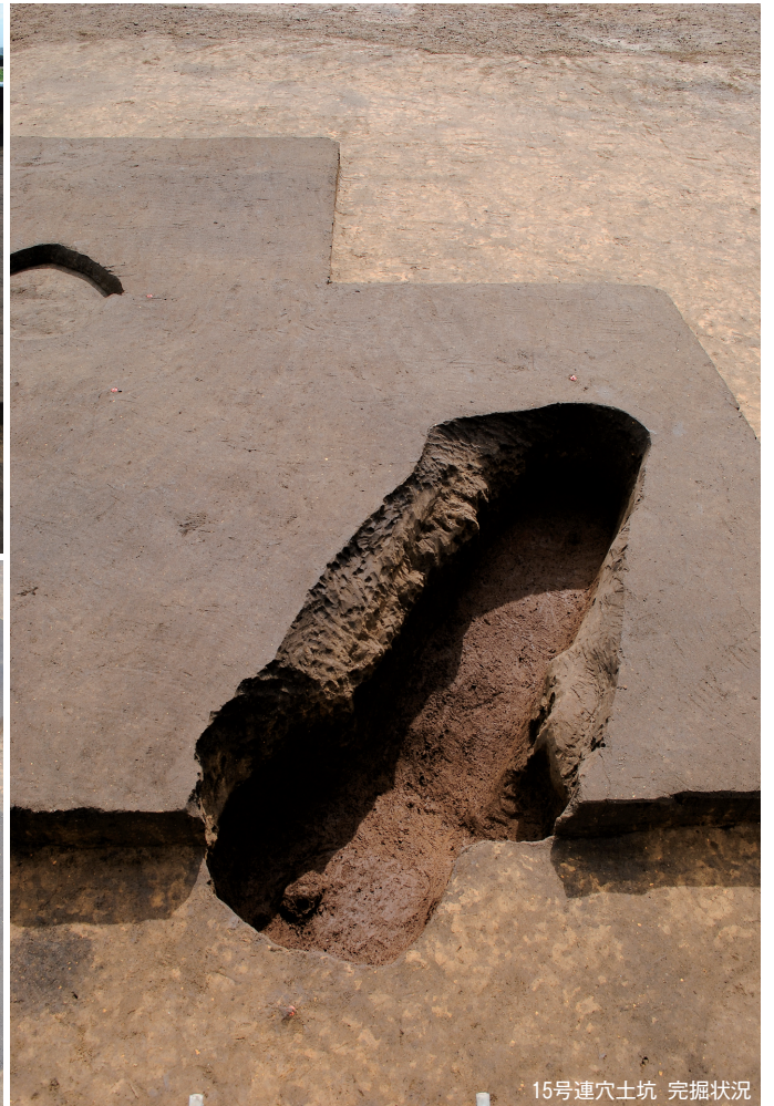
15号連穴土坑 完掘状況