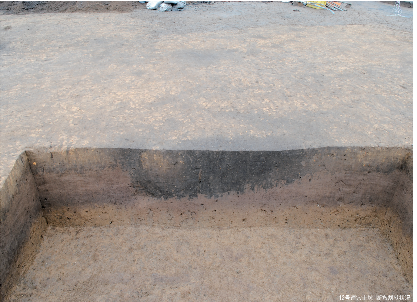
12号連穴土坑 断ち割り状況