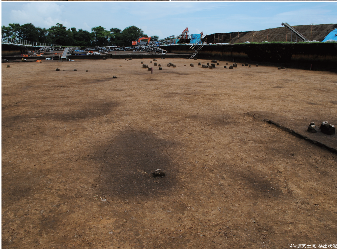
14号連穴土坑 検出状况