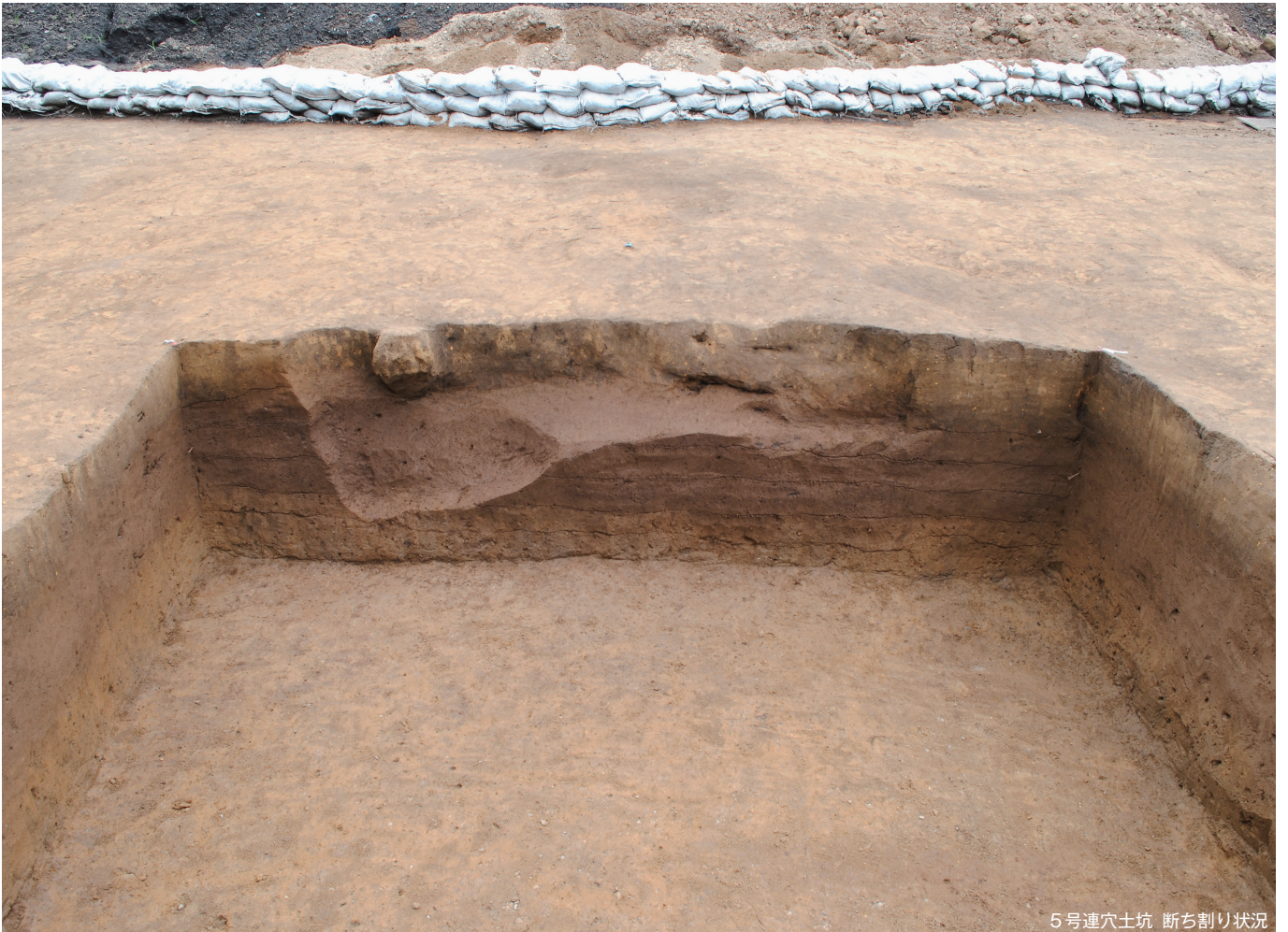
5号連穴土坑 断ち割り状況