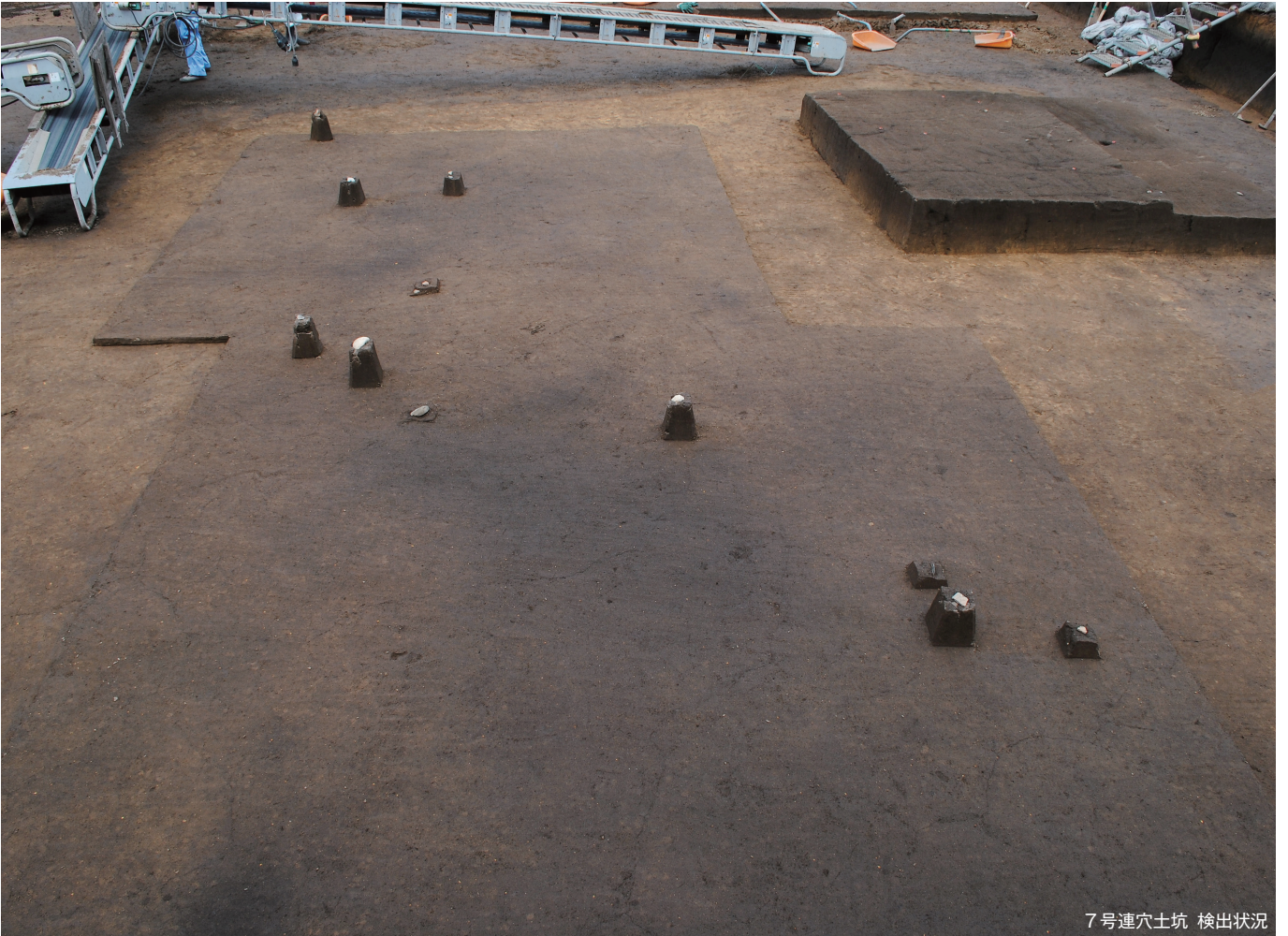
7号連穴土坑 検出状況