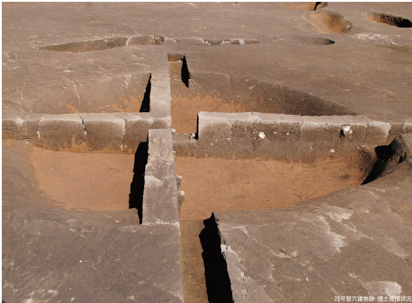
28号竖穴建物跡 埋土堆積状況