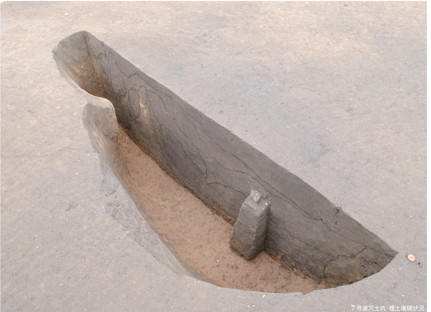
7号連穴土坑 埋土堆積状況