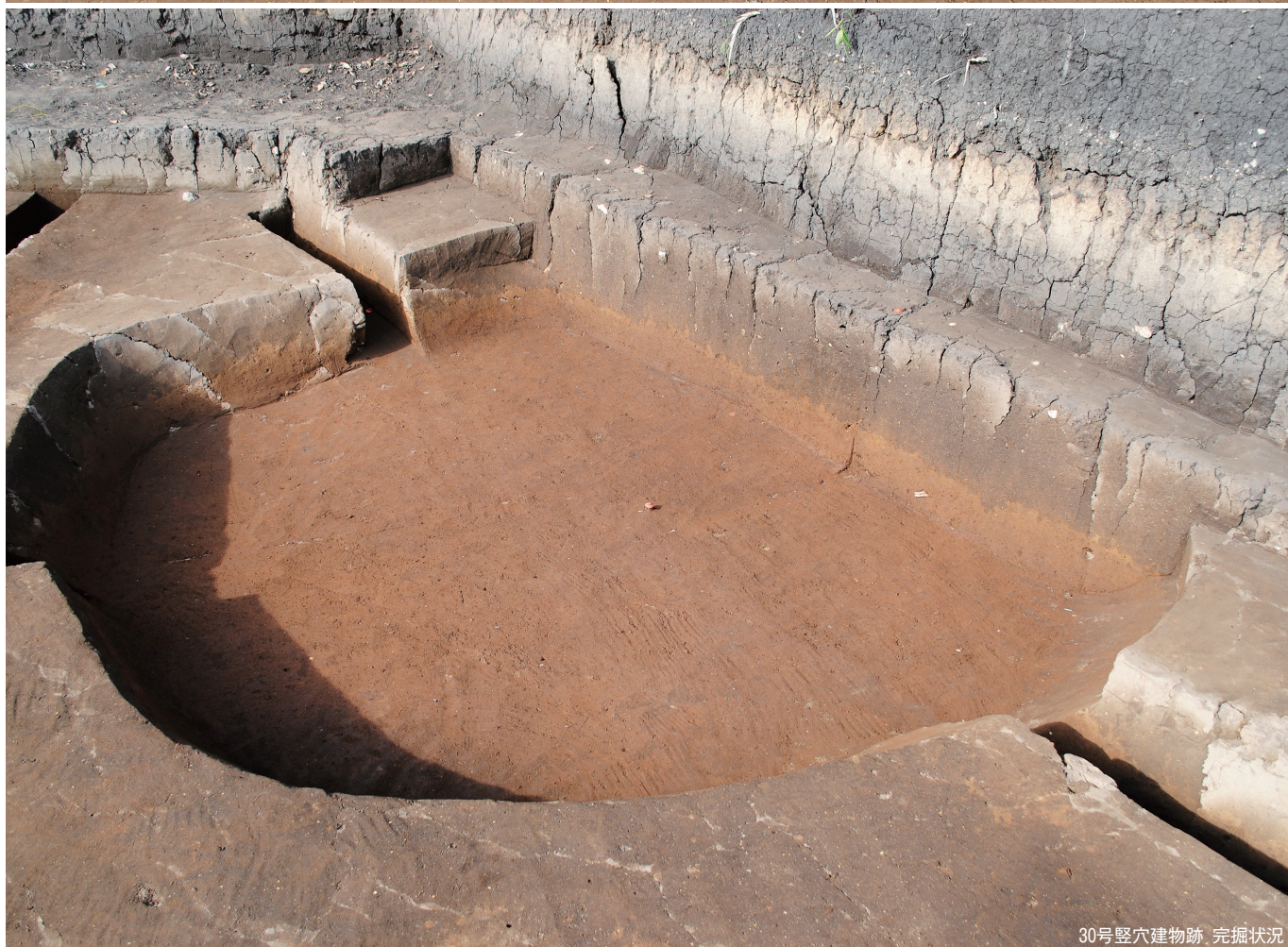
30号竖穴建物跡 完掘状況