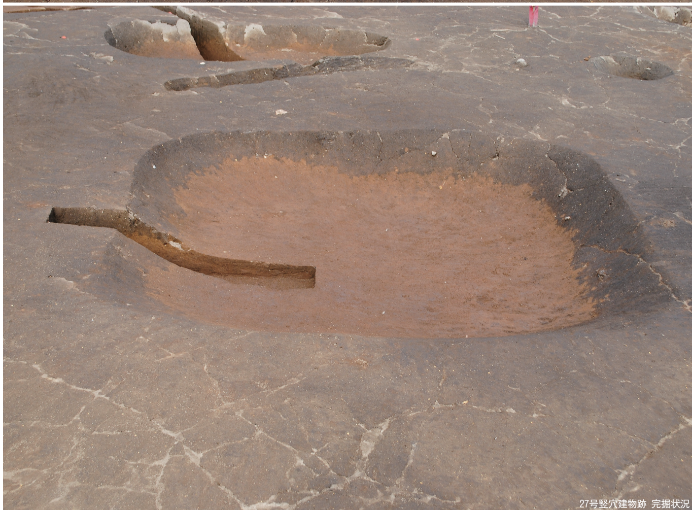
27号竖穴建物跡 完掘状况