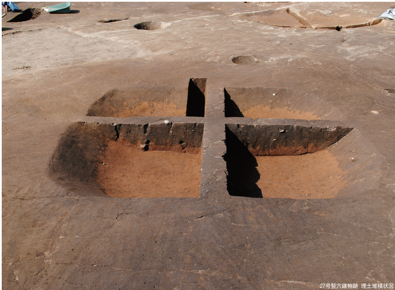
27号竖穴建物跡 埋土堆積状况