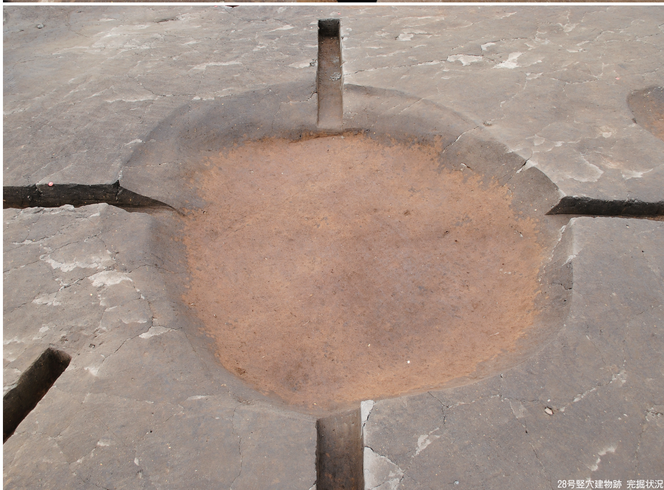
28号竖穴建物跡 完掘状況