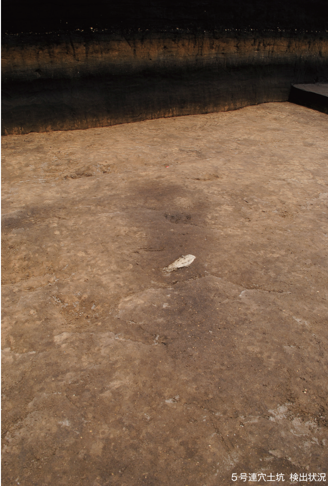
5号連穴土坑 検出状況