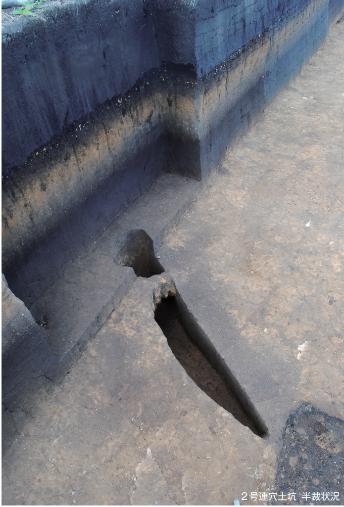
2号連穴土坑 半截状况