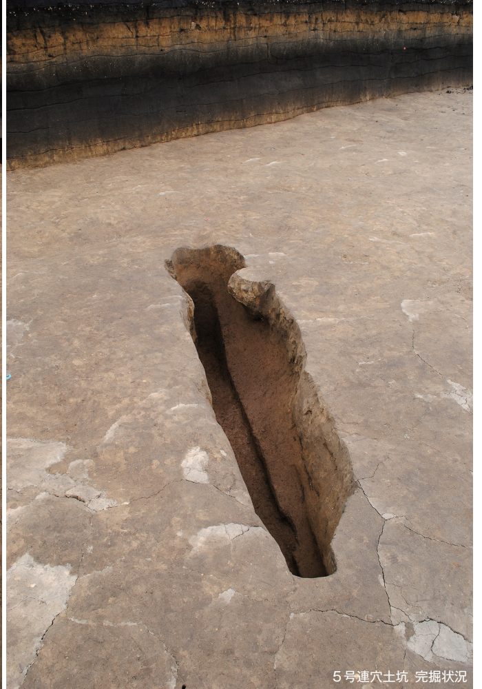
5号連穴土坑 完掘状況