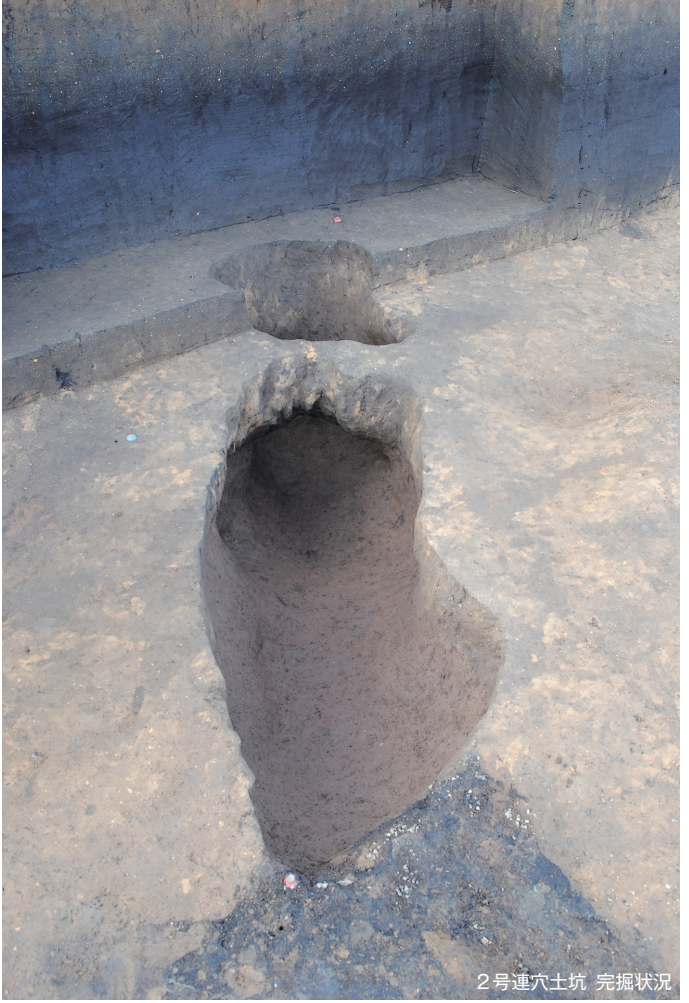
2号連穴土坑 完掘状况