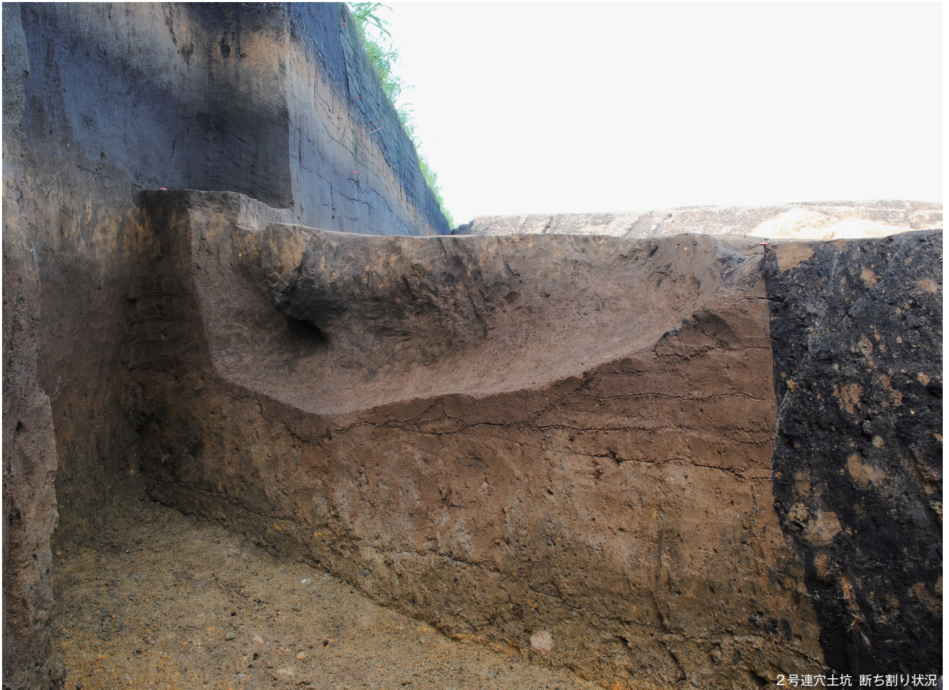
2号連穴土坑 断ち割り状况