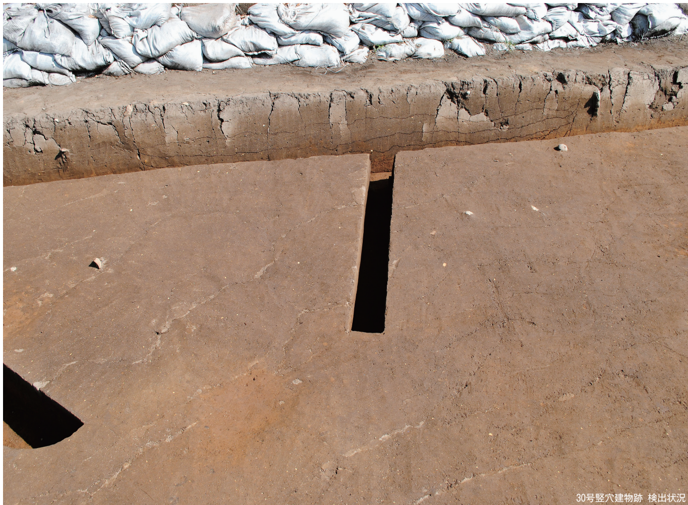
30号竖穴建物跡 検出状況