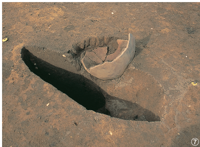
土坑 20 号 ①半裁状况 ②完掘状况 土坑 21 号 ③检出状况 土坑 22 号 ④半裁状况 土坑 23 号 ⑤检出状况 ⑥⑦遺物出土状况