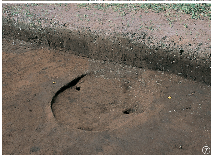
土坑 5号 ①半裁状况 ②完掘状况 土坑 6号 ③埋土状况 ④完掘状况 土坑 7号 ⑤遺物出土状况 土坑 8号 ⑥檢出状况 ⑦完掘状况