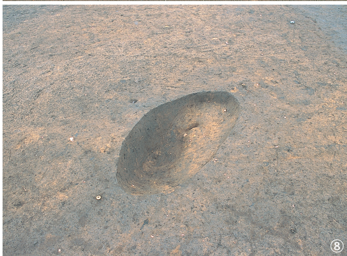
土坑 15 号 ①検出状況 ②完掘状況 土坑 16 号 ③半裁状況 土坑 17 号 ④半裁状況 土坑 18 号 ⑤半裁状況 ⑥完掘状況 土坑 19 号 ⑦半裁状況 ⑧完掘状況