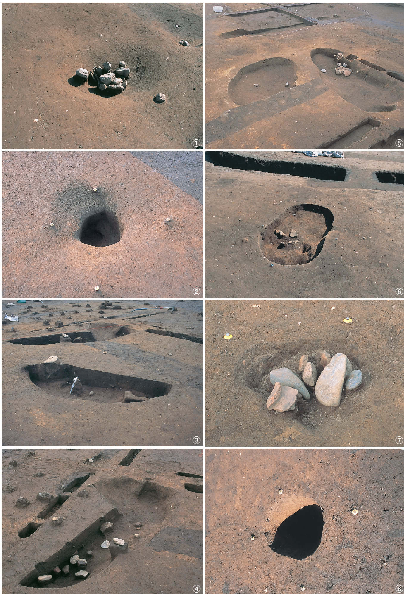
土坑 9 号 ① 検出状況 ② 完掘状況 土坑 11 号 ③ 半掘状況 土坑 12 号 ④ 半掘状況 土坑 11 号 (左), 12 号 (右) ⑤ 完掘状況 土坑 13 号 ⑥ 完掘状況 土坑 14 号 ⑦ 検出状況 ⑧ 完掘状況