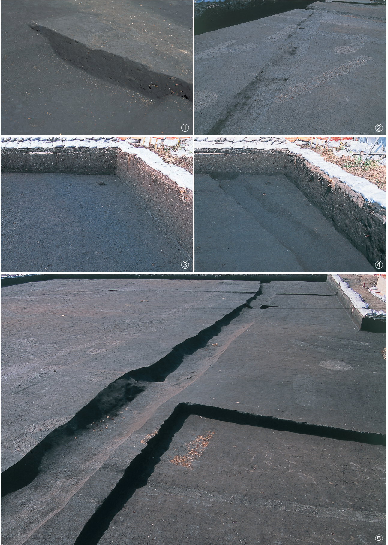
①溝状遺構4号埋土堆積状況 ②溝状遺構4号完掘状況 ③溝状遺構5号検出状況 ④溝状遺構5号完掘状況 ⑤溝状遺構5号完掘状況