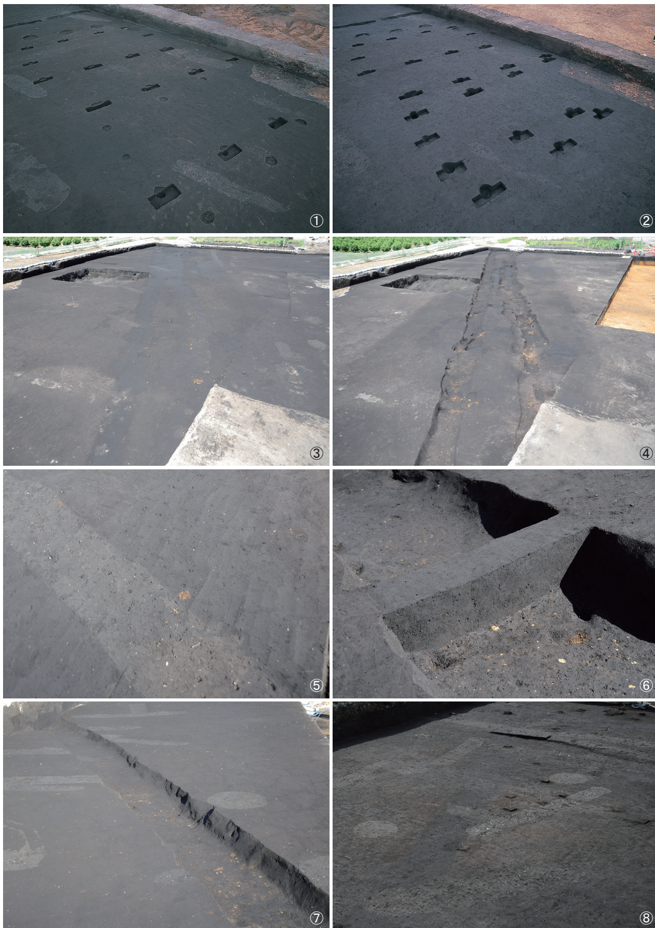
①掘立柱建物跡1号～3号埋土堆積状況 ②掘立柱建物跡1号～3号完掘状況 ③溝状遺構1号・2号検出状況 ④溝状遺構1号・2号完掘状況 ⑤溝状遺構1号検出状況 ⑥溝状遺構1号埋土堆積状況 ⑦溝状遺構1号完掘状況 ⑧溝状遺構4号検出状況