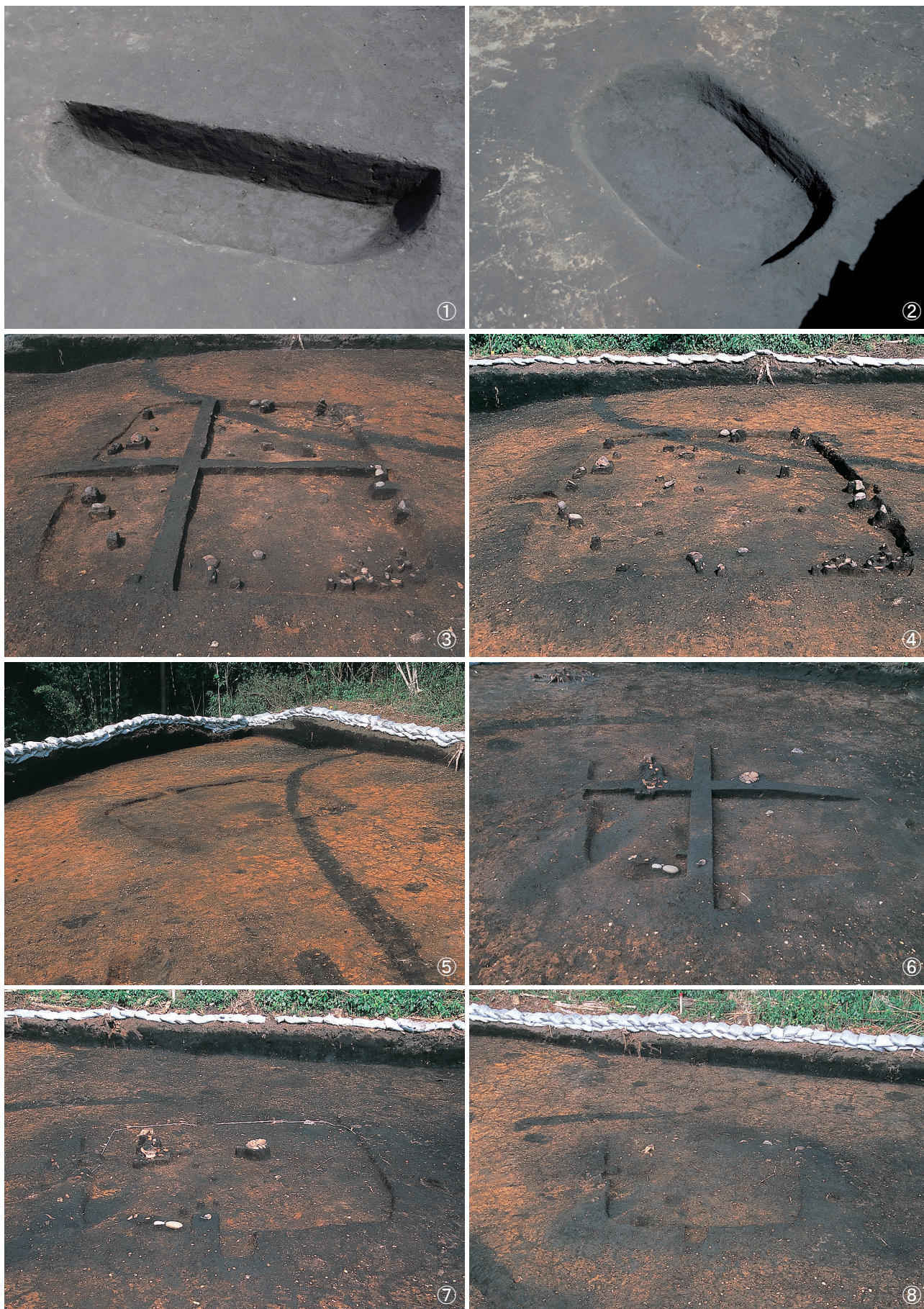
①土坑2号埋土堆積状況 ②土坑2号完掘状況 ③竪穴建物跡8号埋土堆積状況 ④竪穴建物跡8号遺物出土状況 ⑤竪穴建物跡8号完掘状況 ⑥竪穴建物跡9号埋土堆積状況 ⑦竪穴建物跡9号遺物出土状況 ⑧竪穴建物跡9号完掘状況