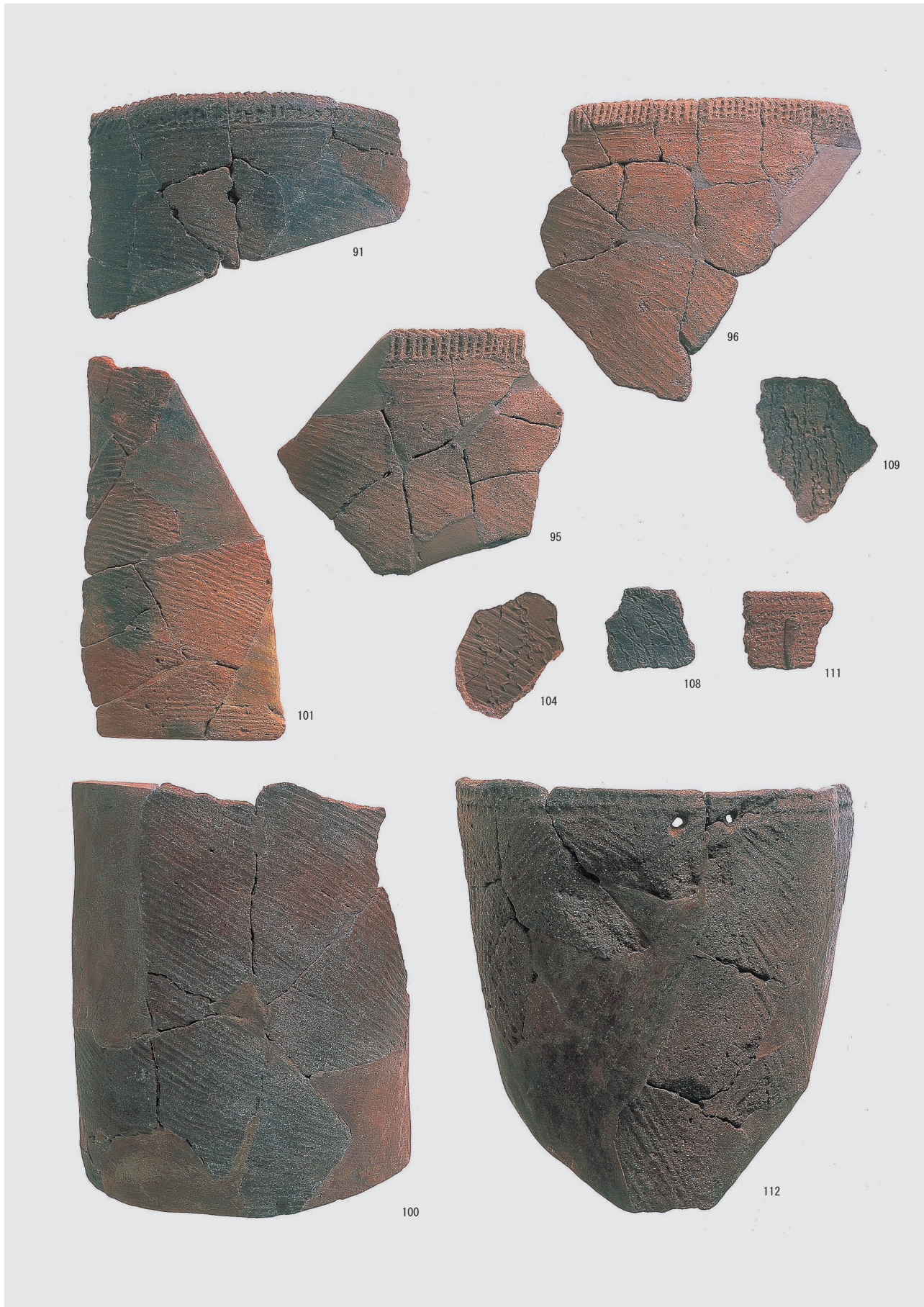
第 I · II · III 類土器