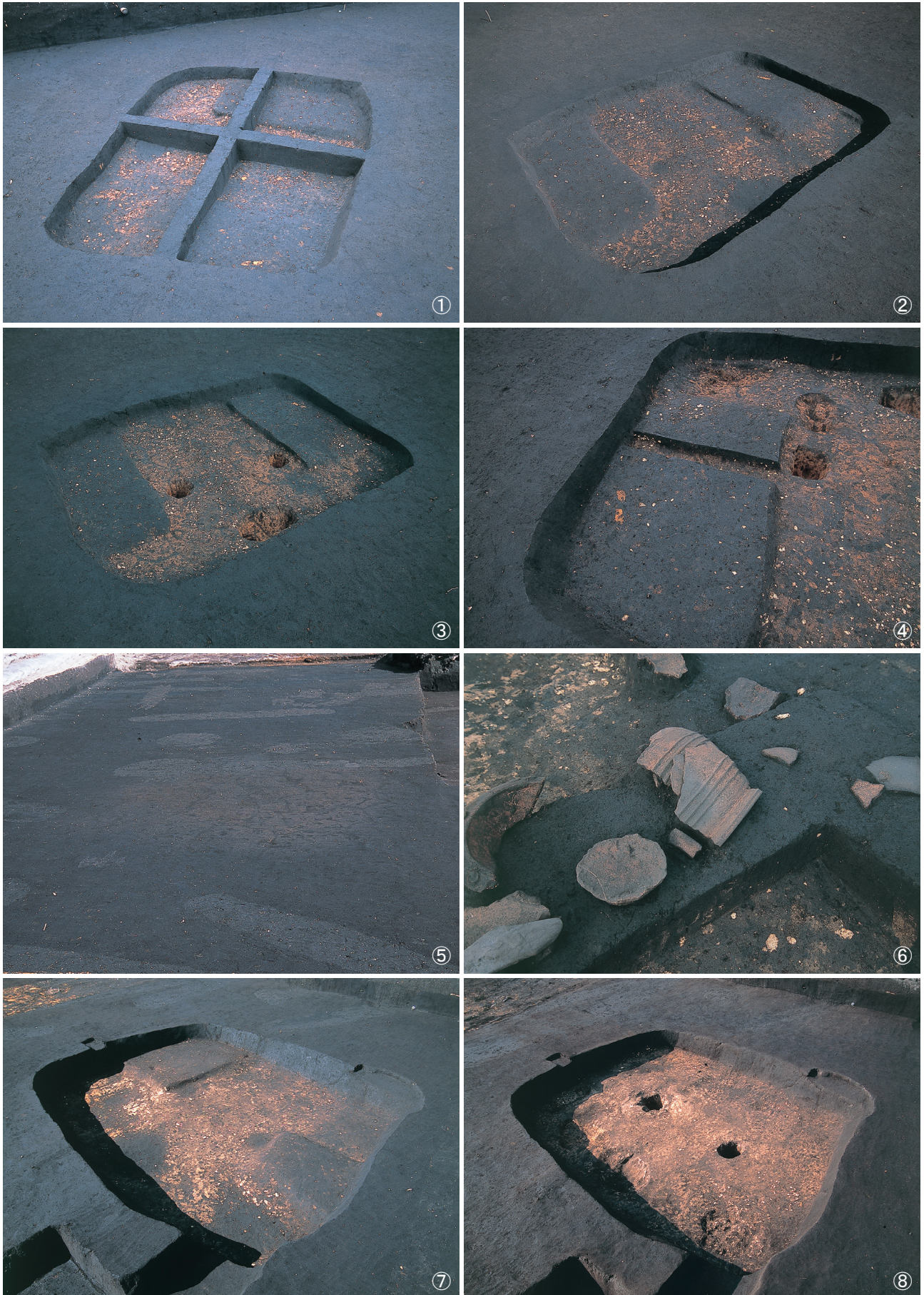
① 竪穴建物跡 6号床面検出・埋土堆積状況 ② 竪穴建物跡 6号床面検出状況 ③ 竪穴建物跡 6号完掘状況 ④ 竪穴建物跡 6号貼床 ⑤ 竪穴建物跡 7号検出状況 ⑥ 竪穴建物跡 7号遺物出土状況 ⑦ 竪穴建物跡 7号床面検出状況 ⑧ 竪穴建物跡 7号掘り方完掘状況