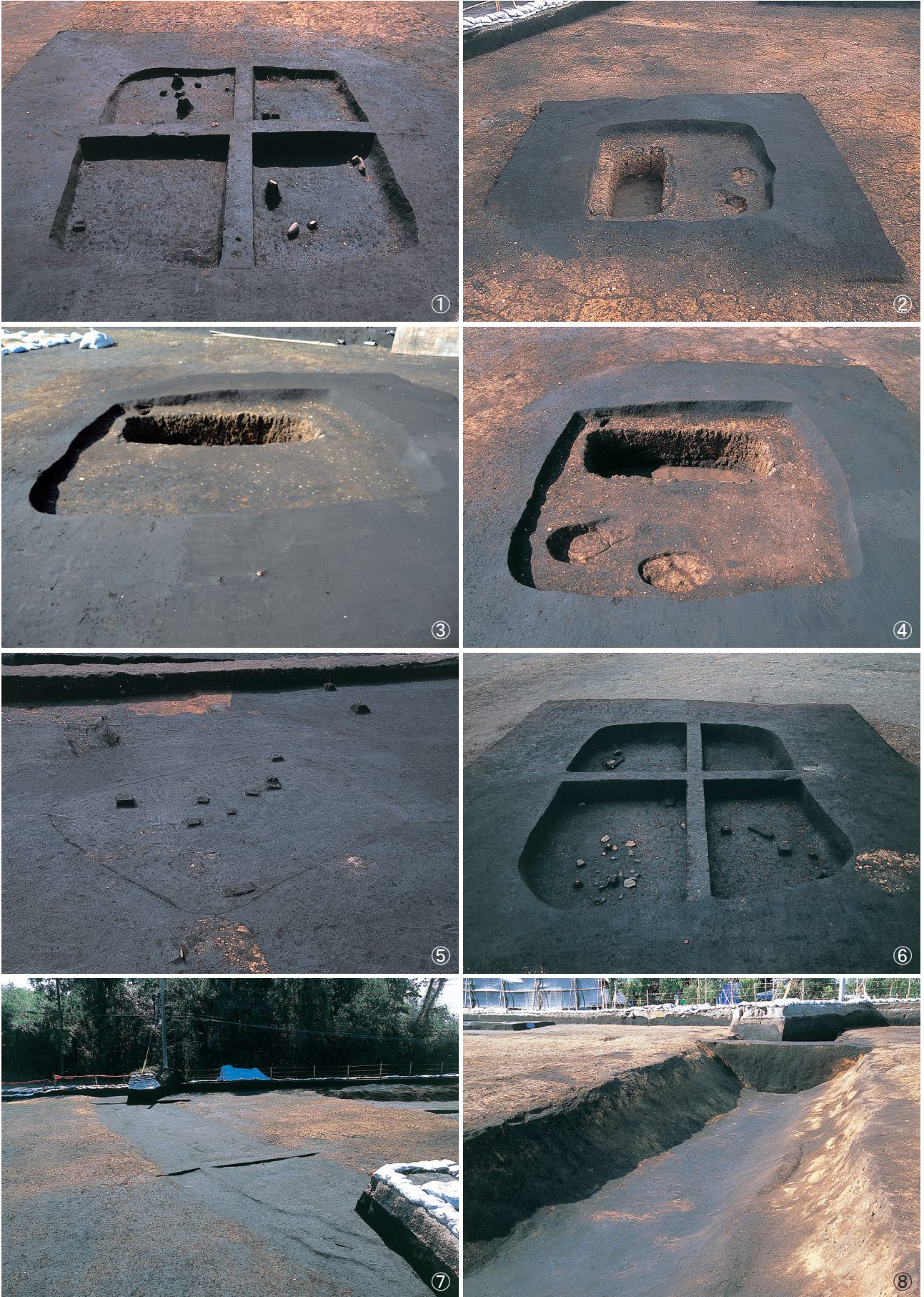
① 竪穴建物跡 10 号掘り込み検出状況 ② 竪穴建物跡 10 号完掘状況 ③ 竪穴建物跡 10 号内土坑検出状況 ④ 竪穴建物跡 10 号内土坑完掘状況 ⑤ 竪穴建物跡 11 号検出状況 ⑥ 竪穴建物跡 11 号埋土堆積状況 ⑦ 堀跡 1 号硬化面検出状況 ⑧ 堀跡 1 号紫コーラ検出状況