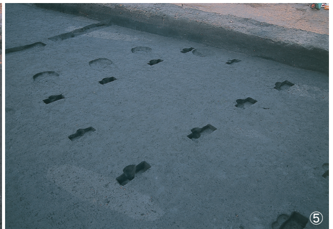
①堀跡 1号南側土層埋土堆積状況 ②掘立柱建物跡 1・2号検出状況 ③掘立柱建物跡 1号埋土堆積状況 ④掘立柱建物跡 2号埋土堆積状況 ⑤掘立柱建物跡 1号完掘状況