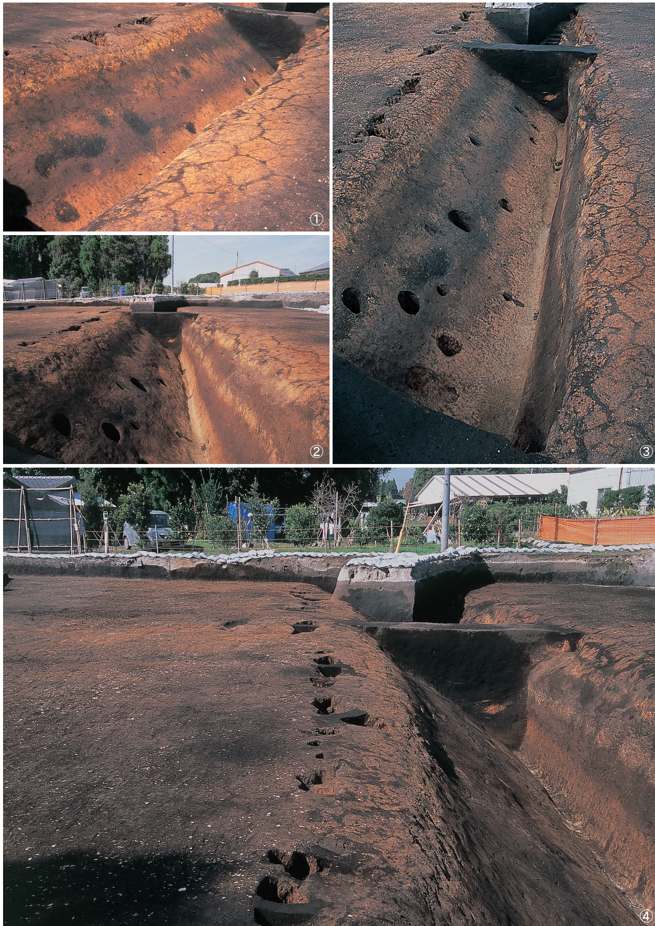
①堀跡 1号逆茂木痕検出状況 ②堀跡 1号完掘状況 ③堀跡 1号完掘状況 ④堀跡 1号西側付帯土坑埋土堆積状況