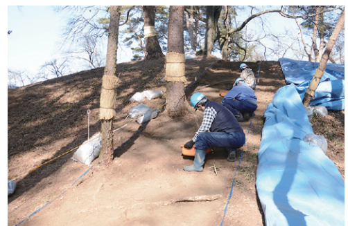
後方部南側斜面の調査の様子(南から)

後方部墳頂の西端及び南端では、江戸時代の発掘坑の範囲を確認するためにトレンチ（試掘溝）を設定しましたが、現在の調査範囲では確認出来ていません。このことから江戸時代の発掘は、今回の調査範囲よりも内側を掘り下げていることが推測されます。