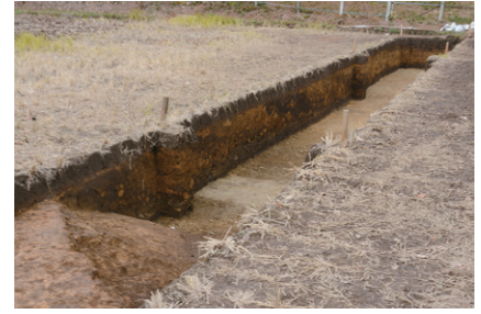
前方部南側の周溝 (南東から)

幅約20mの周溝が昭和になって掘り返された痕跡が見つかりました。底面となる固い砂礫層が東にいくにつれ浅い位置で見つかったので、古墳の周溝も同じく浅くなっていくと考えられます。