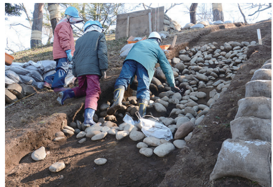
後方部西側斜面の葺石の様子(南西から)

江戸時代の古墳修復に際しての盛土は薄くしか確認出来ず、多くは流出しているようです。