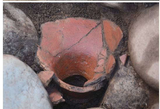
後方部西側斜面の土器出土状況