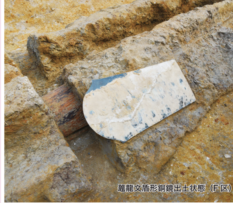
龍文盾形銅鏡出土状態 (F区)