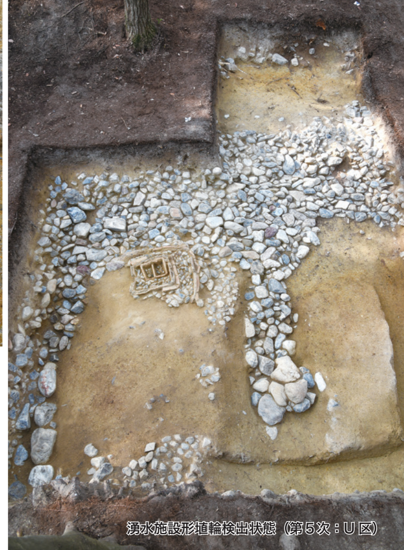
湧水施設形埴輪出土状態 (第5次: U区)