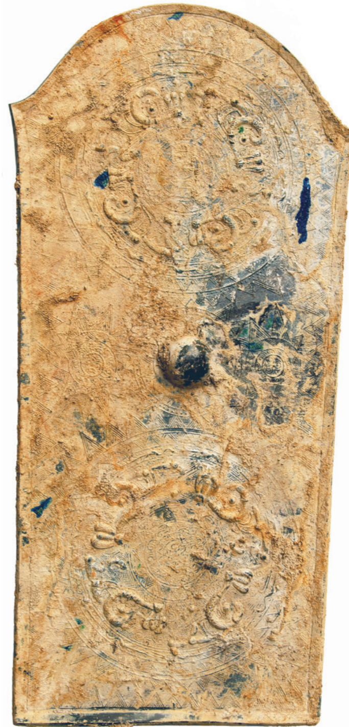
龍文盾形銅鏡 (処置前写真)