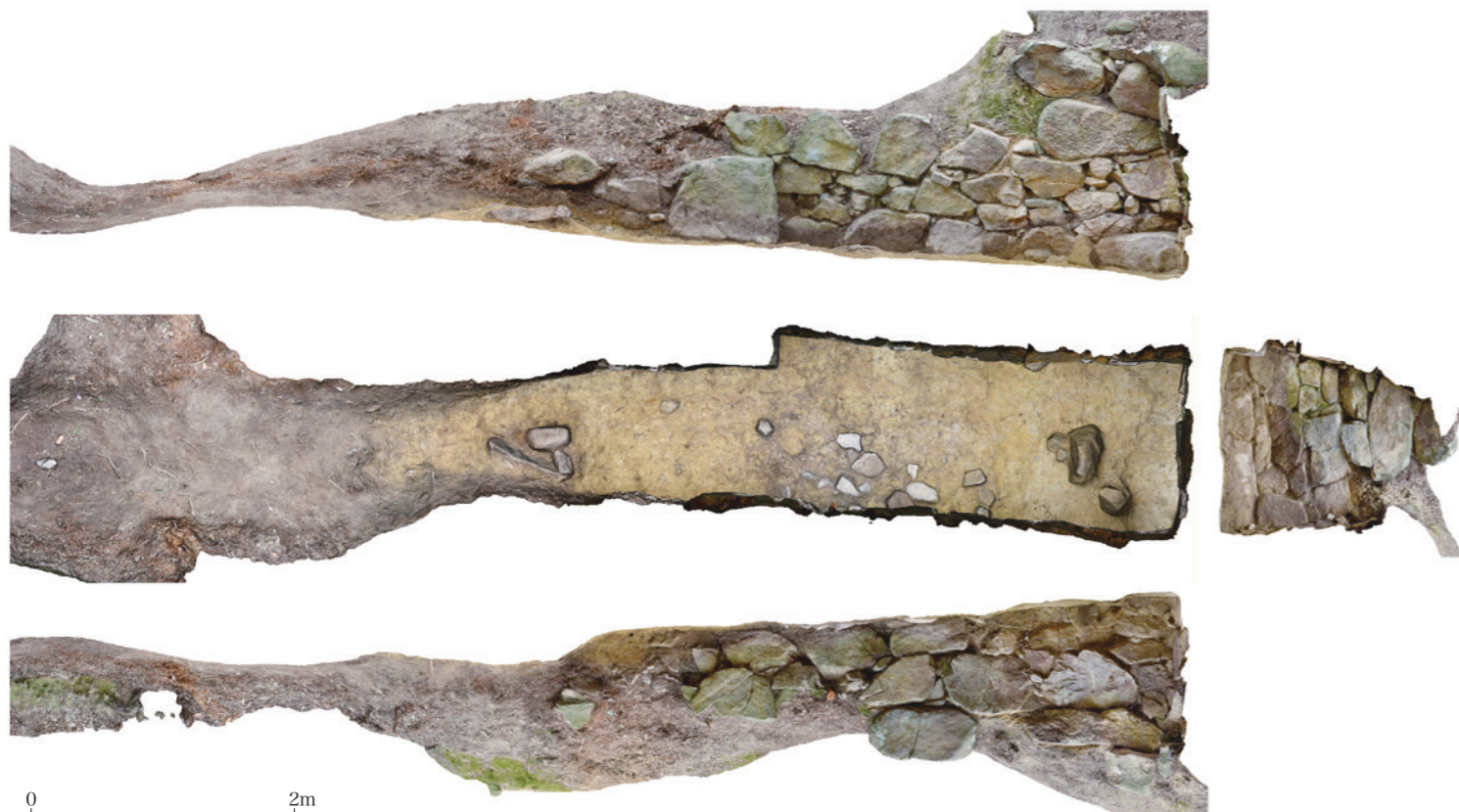
富雄丸山2号墳の横穴式石室 (オルソ画像)