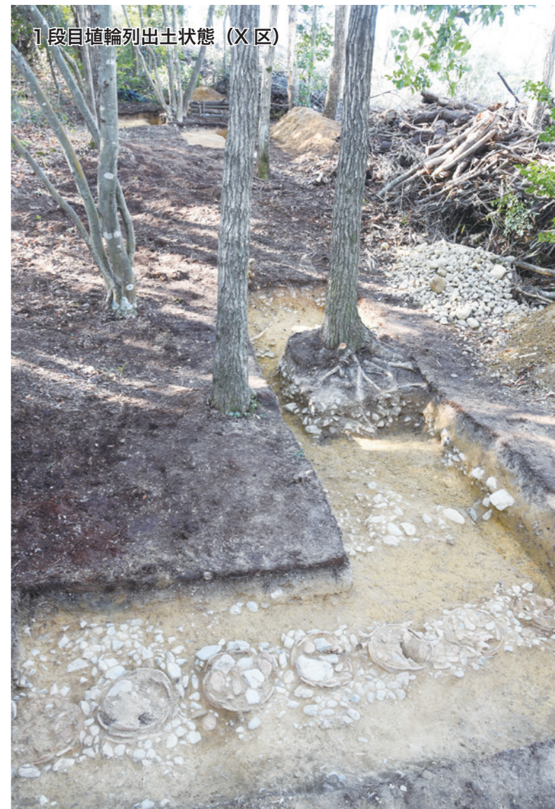
1段目埴輪列出土状態 (X区)