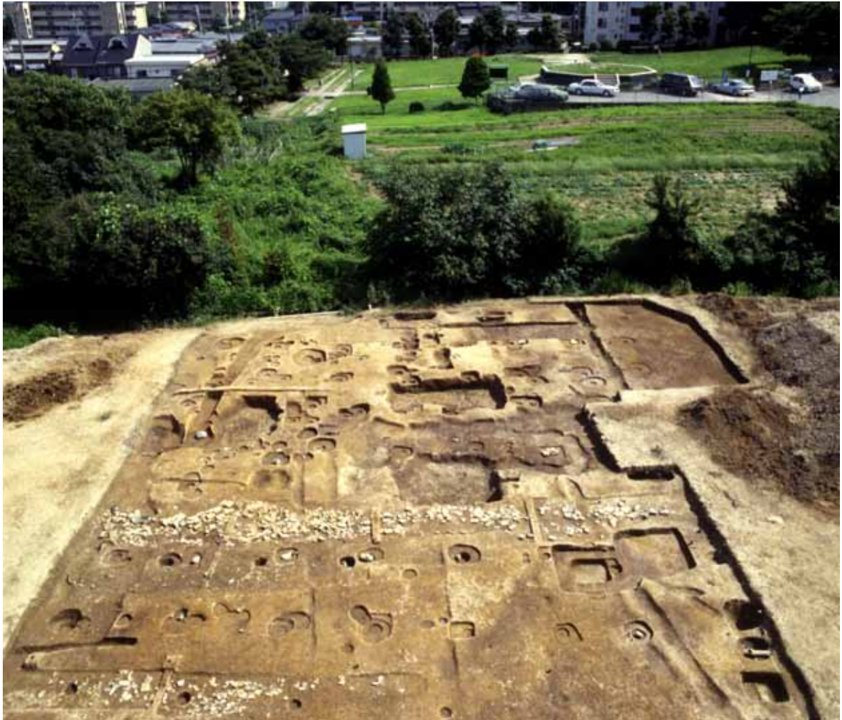
今回の調査区 北回廊と雨落溝・建物跡、奥に史跡公園が見える（北から）

はじめに 檜原廃寺は、京都洛西・桂川右岸にある長岡丘陵の東北端に位置し、三方が開けていて、はるか京都の街を見おろせます。そして古くからの道路と思われる山陰道と物集女街道が交差するところに建立されています。この寺の名称と発願者は不明ですが、檜原一帯は渡来系氏族の秦氏が支配していたので、一族にかかわる者ではないかと考えられます。