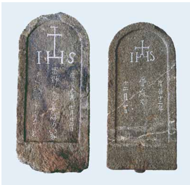
キリシタン墓碑 墓碑1(写真左・分布図の4)と墓碑2(写真右・分布図の5)

銘文は、中央上に「二支十字」と呼ばれる特徴的な十字が「IHS」の「H」に接続し、その下「留野上ちん妾満りいな」、向かって右「慶長九年七月廿二日」、左「さん路加 州? □満んへれ」と読めます。「IHS」は「Iesus Hominum Salvor」、すなわち人類の救済者