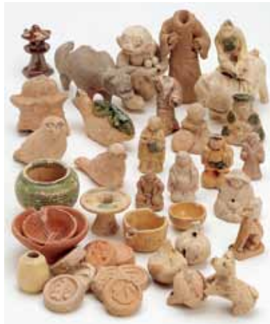
写真2 悪王子町出土の人形・玩具など