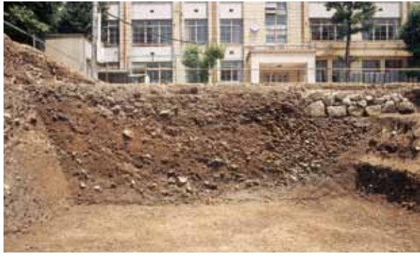
写真4 天明火災を処理した土壌の断面 松山藩邸跡