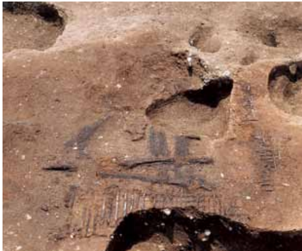
写真5 火災で焼失した町屋 五丁目 木舞（壁の下地に組んだ竹）が密封された状態で残っていた