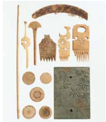
写真3 五丁目出土の工芸品