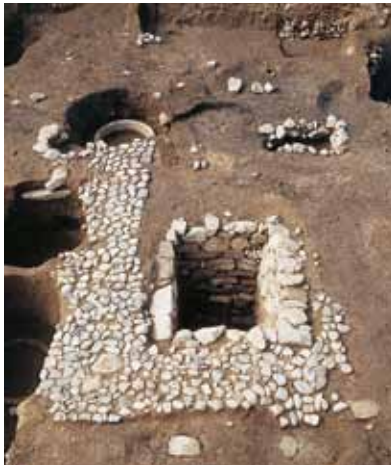
写真1 水戸藩邸跡の石組施設

これらの遺跡からは、大都市であった京都を物語る多種多様な遺物が出土しています。陶磁器では、京焼をはじめとして、伊万里・唐津・備前・美濃・瀬戸など日本の焼物はもちろんのこと、中国・朝鮮、タイ・ベトナムなどの東南アジア、遠くはヨーロッパの陶磁器なども少量出土しており、鎖国下でありながら海外の製品が京都に