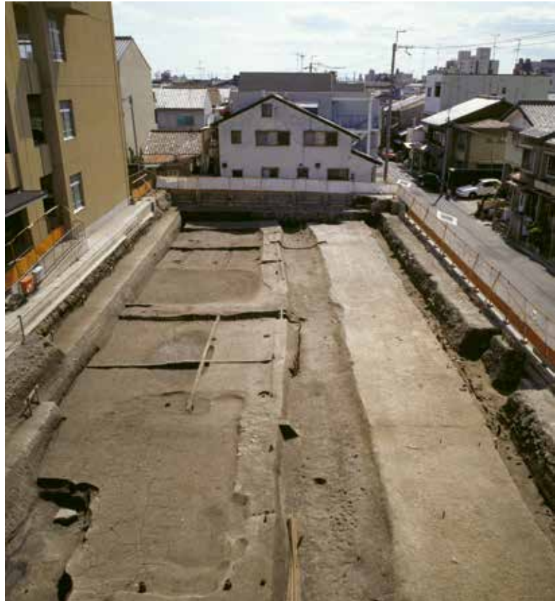
七条小学校構内から発見された西靱負小路 側溝にはさまれた路面に轍がみえる(北から)

道路には大路と小路があり、これらは路面、側溝、犬行、築地で構成され、その規模は両築地の中心から中心までの距離で表わされる。単位(ものさし)は丈尺(一丈=十尺)で表わされ、現在の一尺(30.303cm)よりやや短かく29.8445cmであったことがわかってきた。平安京の東西の中心には