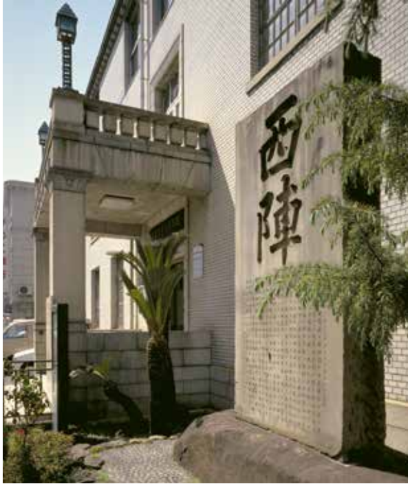
考古資料館前に建つ「西陣」の石碑