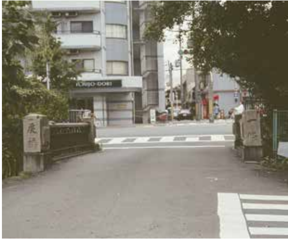
一条戻橋と一条通