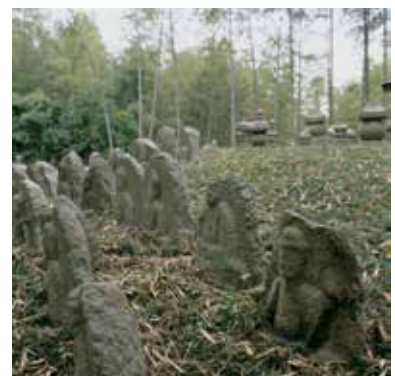
竹林公園の石造物

新しいものを好む信長は、外国から伝来したキリスト教を保護しました。南蛮寺とはキリスト教会のことであり、京都では現在の中京区姥柳町にあった南蛮寺が有名です。この寺は、信長の許可を受け、天正四年(1576)頃に建立された