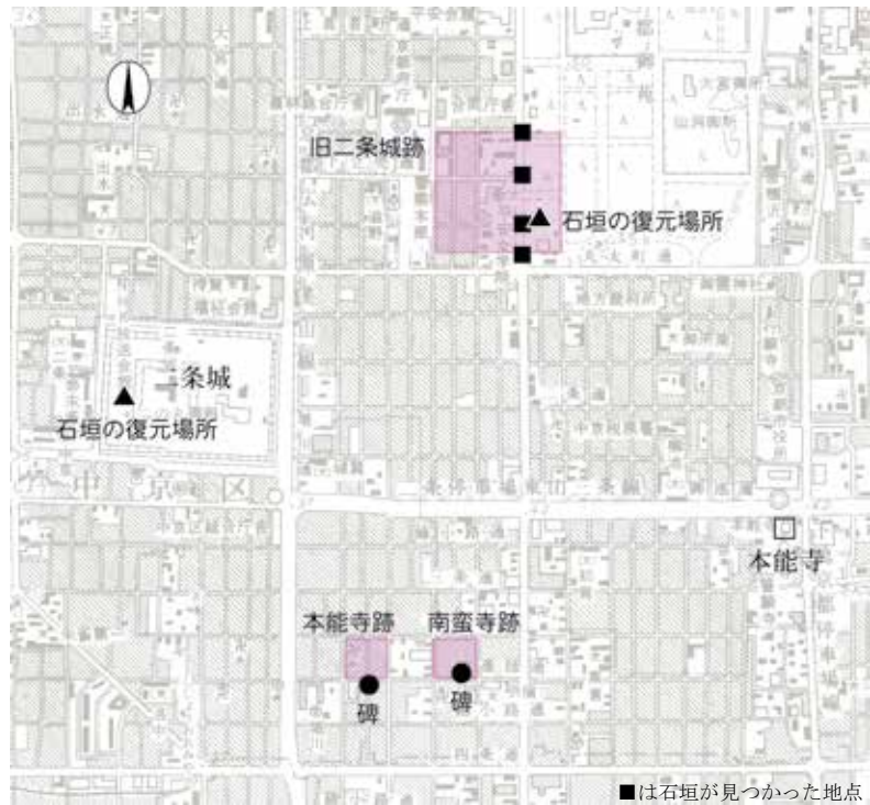
信長ゆかりの遺跡