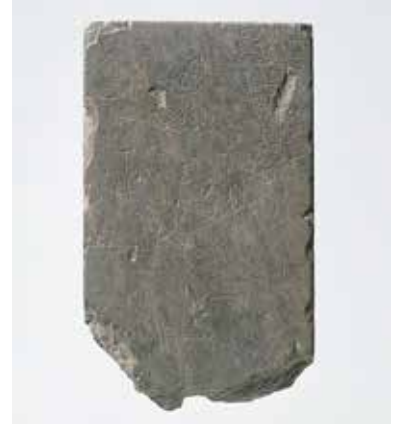
線刻がある石製硯(南蛮寺跡出土) 同志社大学歴史資料館蔵

御苑と二条城に復元し保存されています。また石垣の材料に転用された石造物は、洛西ニュータウンの東部丘陵地にある京都市洛西竹林公園内の生態園の一隅に保存され、見学することができます。