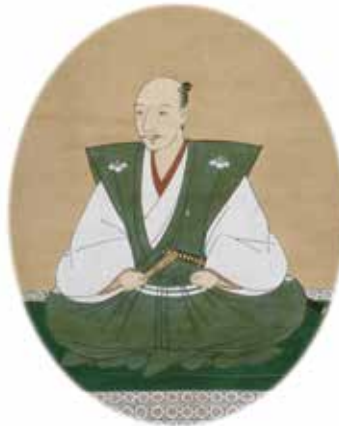
紙本着色織田信長肖像画