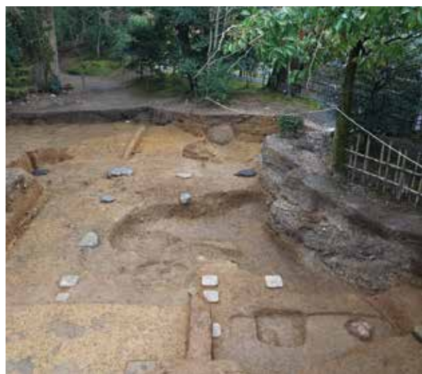
7 特別史跡・特別名勝 鹿苑寺(金閣寺)庭園 北区金閣寺町

平安時代前期の埋納遺構を検出した。元慶8年の火災後の復興事業に伴うものと考えられる。