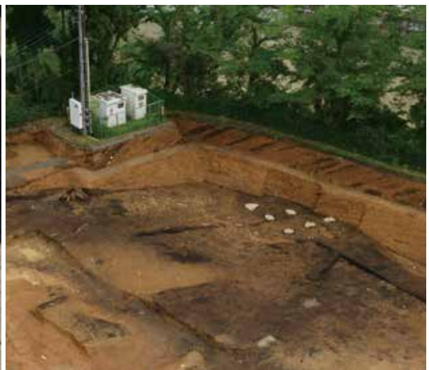
3 周山廃寺 右京区京北周山町(周山中学校内)写真左が北

弥生時代中期前葉の集落。竪穴建物、水田に残る足跡などは当時の人々の暮らしを具体的に示すものである。