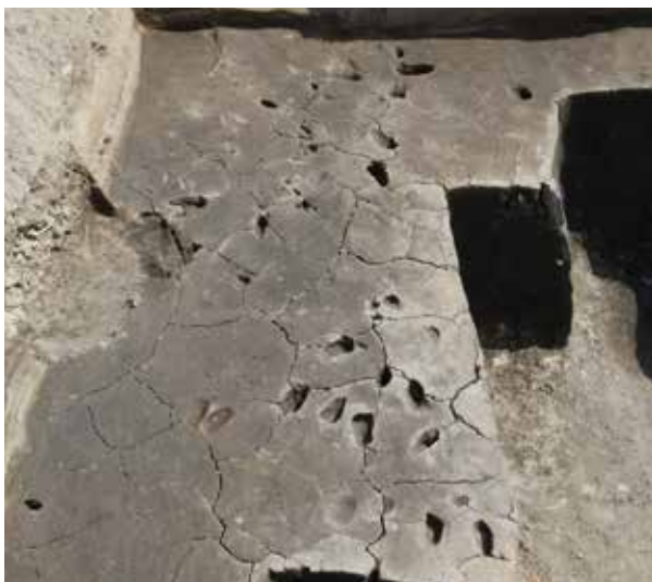
2 烏丸綾小路遺跡 下京区醒ヶ井通松原下る篠屋町(元醒泉小学校)

弥生時代後期の1辺約15mの大型の方形周溝墓と溝が見つかった。また、長岡京期の建物と、室町時代の建物や柵、井戸なども検出した。