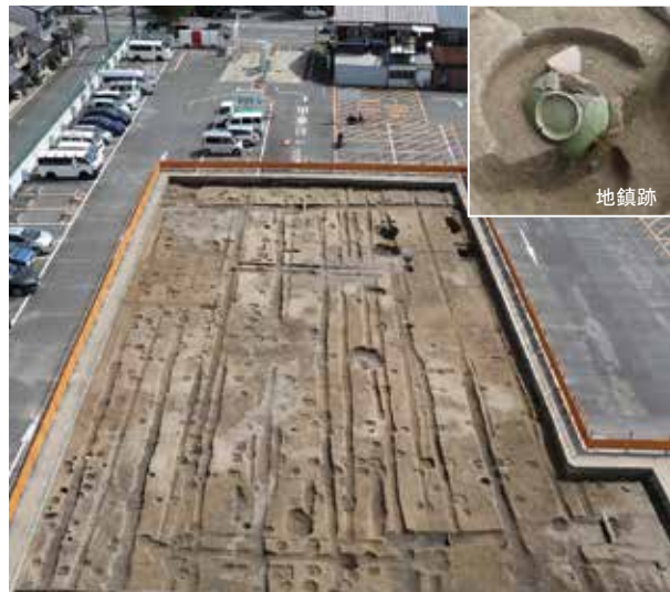
5 平安京右京七条一坊十二町跡 下京区西七条北東野町

長岡京期の建物・柱列・井戸・溝・湿地などを検出した。一辺1.35mの方形木枠組みの井戸は、長岡京内でも有数の大きさ。