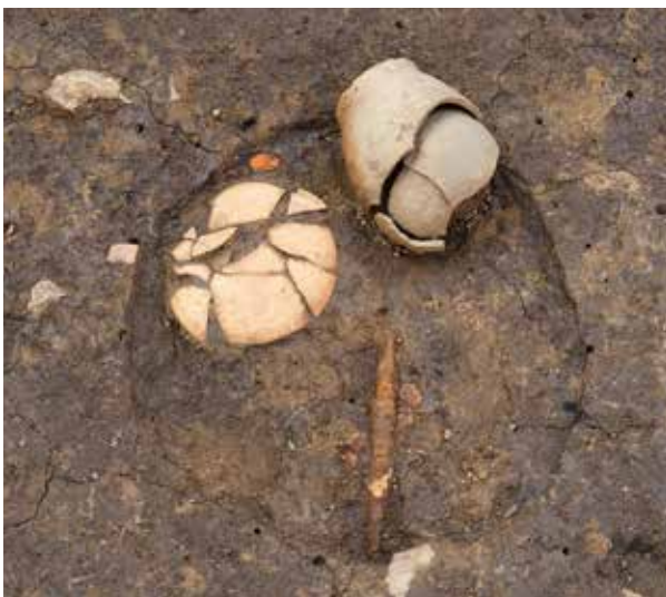
6 北野麁寺 北区北野下白梅町

平安時代前期から中期の建物・井戸・溝を検出し、宅地の様相が明らかになった。土坑から地鎮跡を発見した。