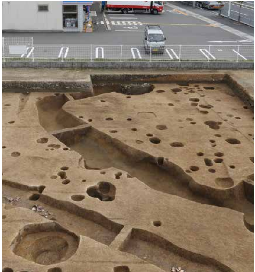
1 大藪遺跡・下久世構跡 南区久世殿城町

2018年度の発掘調査をふりかえってみます。下京区の烏丸綾小路遺跡では、市街地では初めて弥生時代中期前葉の集落と水田が見つかりました。