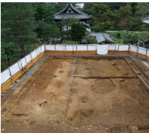
8 史跡名勝高台寺庭園 東山区下河原町

鏡湖池の南側で礎石建物が見つかった。足利義満の北山殿のころのもので、南北6.0m、東西5.4mで、東側に縁が付く。