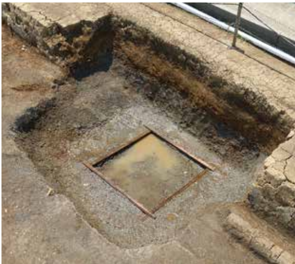
4 長岡京左京三条四坊六町跡 伏見区久我西出町

長岡京期の建物・柱列・井戸・溝・湿地などを検出した。一辺1.35mの方形木枠組みの井戸は、長岡京内でも有数の大きさ。