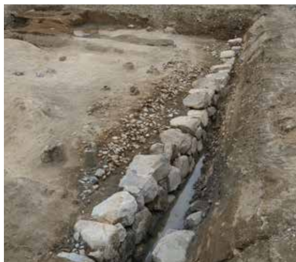
9 長岡京跡・淀城跡 伏見区淀本町

江戸時代後期に再建された小方丈の基壇が見つかった。この下層では創建期の基壇も確認している。