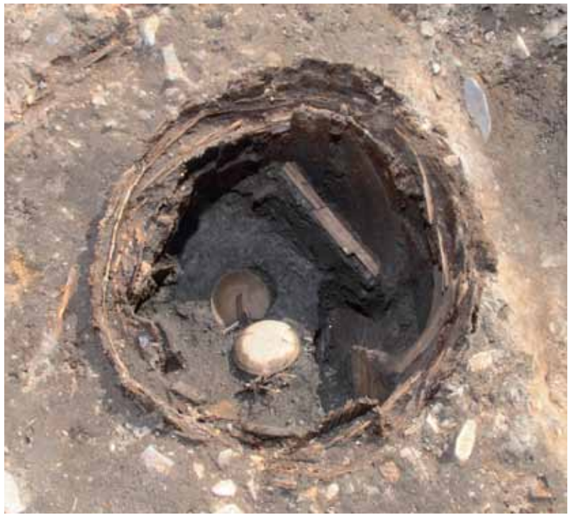
写真2 木簡が出土した井戸（右上に木簡）

これらは次第に文字を崩して書くようになり、これと並行して崩す漢字も限定されていきます。こうした過程を経て「安」の文字から平仮名の「あ」が生まれていくこととなります。このような平仮名のもとになった漢字を「字母」と呼んでいます。平仮名の原形ができてくるのは9世紀代、平仮名47文字の手習い歌である「いろは