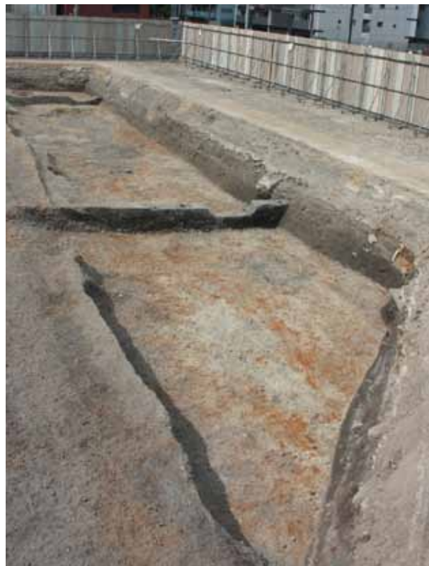
御土居の堀（北から）

調査区の北側では、掘立柱建物、井戸、土坑を確認しました。土坑には、大量の土師器の皿や羽釜が捨てられていました。調査区の南側では、建物の基礎となる地業の痕跡を確認しました。地業とは、地面を掘り込んで、土や礫で埋め戻して行なう地盤改良の方法です。調査地周辺は鴨川の扇状地であったため、整地や地盤改良を行なわなければ建物を建てる事ができなかったでしょう。