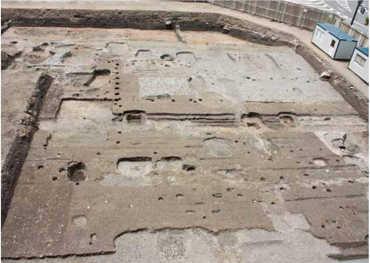
調査区全景（東から）