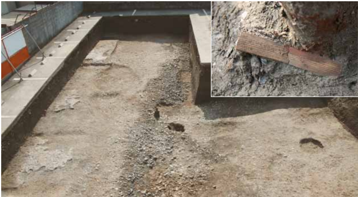
池の東洲浜と木簡3の出土状況（写真右上）