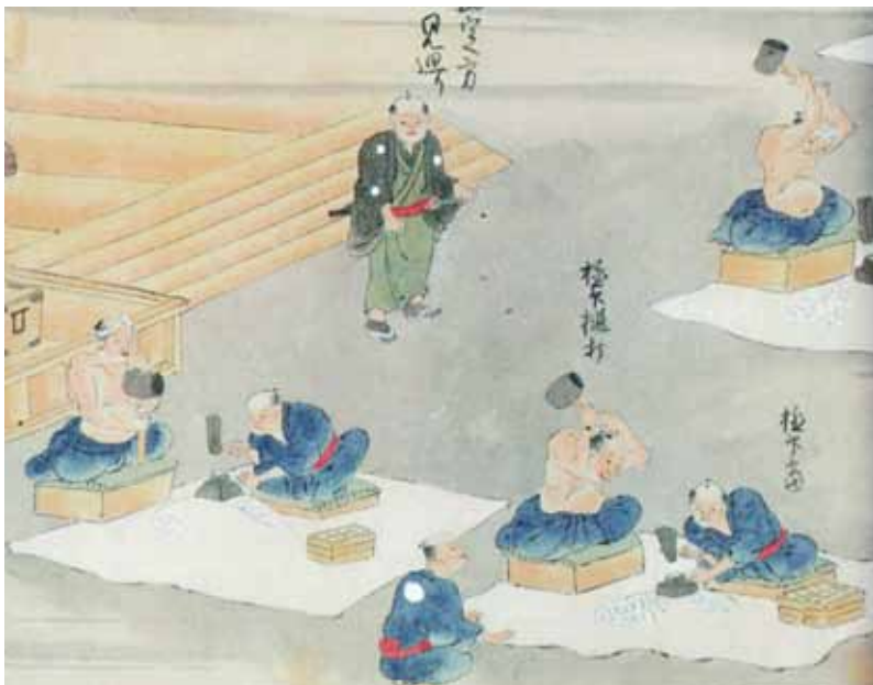
図2 極印打上所の図 銀座巻物[1] 国立国会図書館蔵

おわりに 出土した極印鑽は、最上部が潰れていることや、印面から慶長丁銀に含まれるAg(銀)やCu(銅)が検出されたことなどから、実際に慶長丁銀に打刻するために使用されたと考えられます。しかし、本来は、偽造防止のために印面を潰して廃棄することが原則であるべきものが、京都銀座の所在地である両替町通御池周辺から遠く離れた御土居の濠から出土した理由は謎のままです。また、文献史料から丁銀の偽造品が製造されていたこともわかっており、偽造品製造のための道具であった可能性も残ります。いずれにしても、慶長丁銀の極印鑽は他に例がなく、貨幣製造史を考える上でも貴重な遺物であることは間違いありません。(柏田有香)