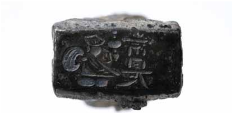
写真2 極印鑽の印面

をはかるため、伏見に銀座を設立し、慶長丁銀の鑄造を行ないました。慶長13年(1608)、江戸幕府は伏見の銀座を京都の室町と烏丸の間、二条から三条までの4町に移転させ、それ以降、慶長丁銀はここで製造されました。