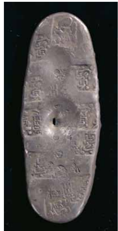
写真3 慶長丁銀 (長径9.3cm・短径3.5cm・厚さ0.6cm) 東京国立博物館所蔵