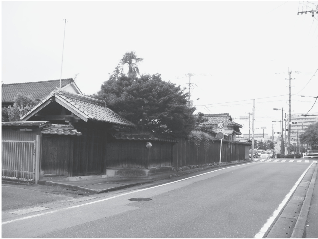
①東門・東塀外観（改修前、南東から）