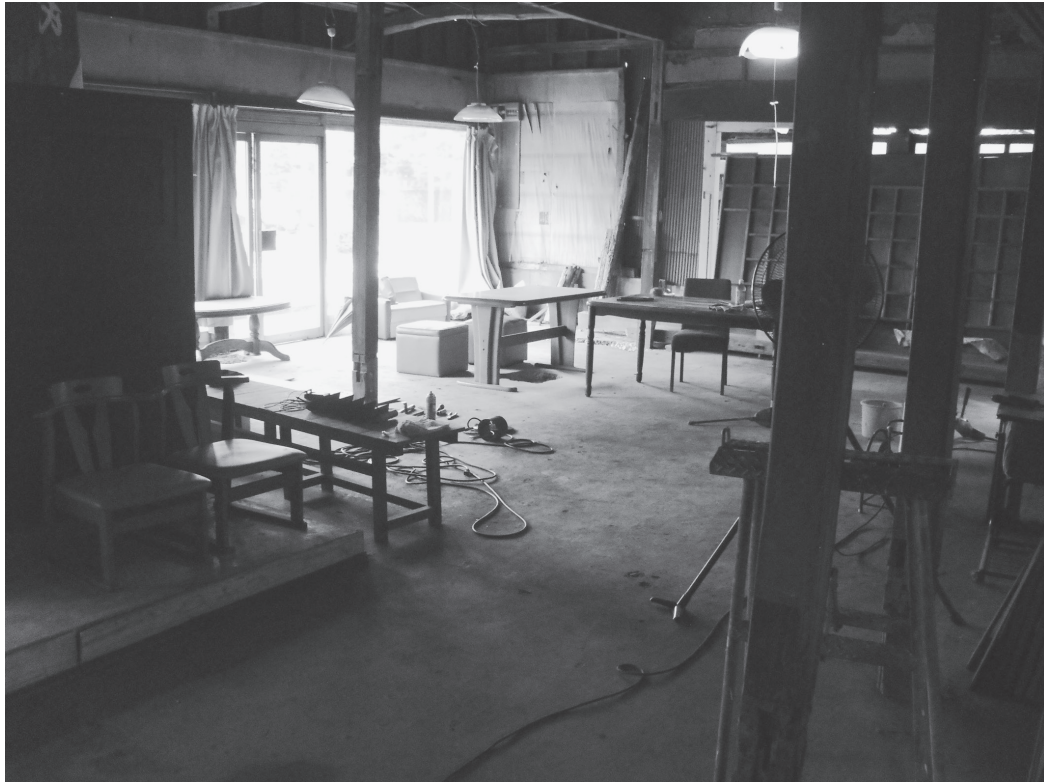
①玄関の間（改修前、南西から）