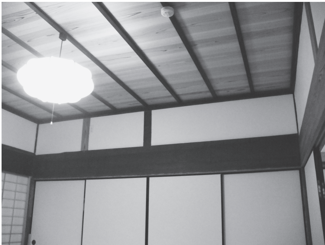
②玄関の間壁面・天井（改修後、北西から）