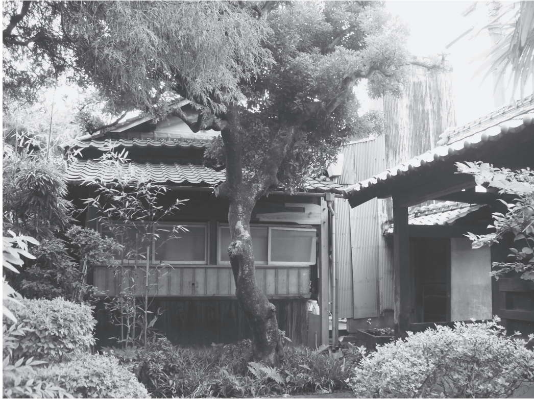
①座敷外観（改修前、東から）