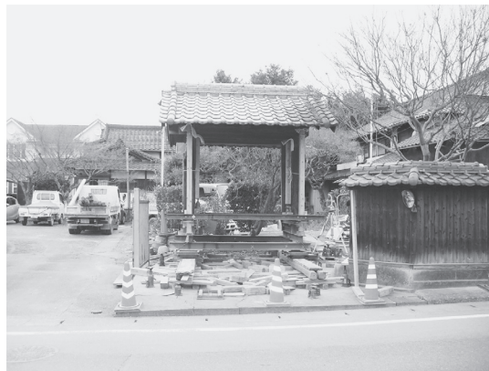
⑧東門 曳移転 (東から)