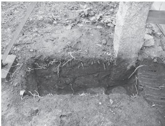
⑦北塀 控柱トレンチ (東から)