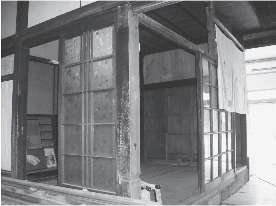
①奥座敷（改修前、南東から）