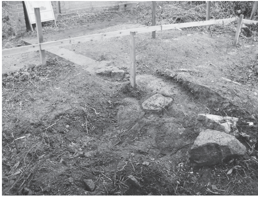
①東門 移設箇所石敷 (南東から)