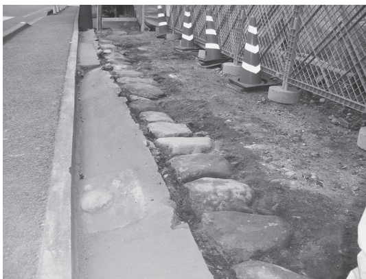
⑤北塀 基礎部分石敷 (北西から)