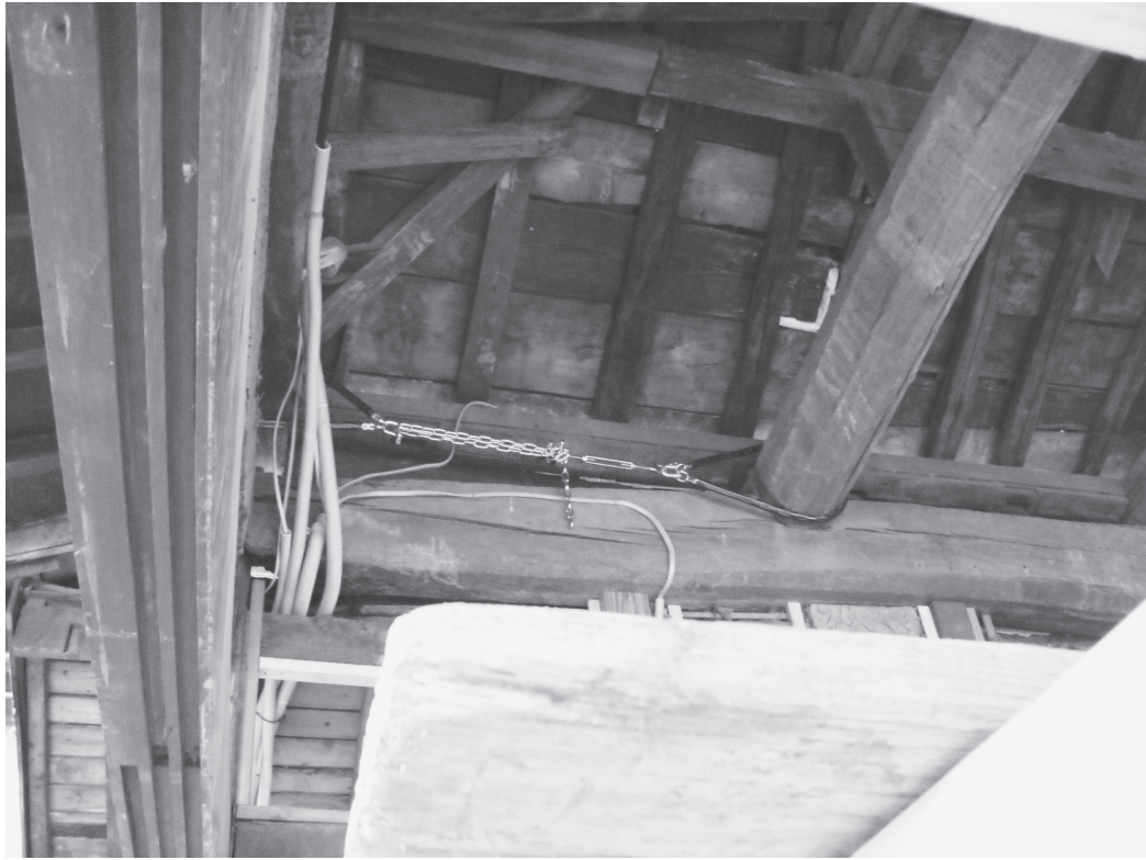
①玄関の間補強工事（北から）