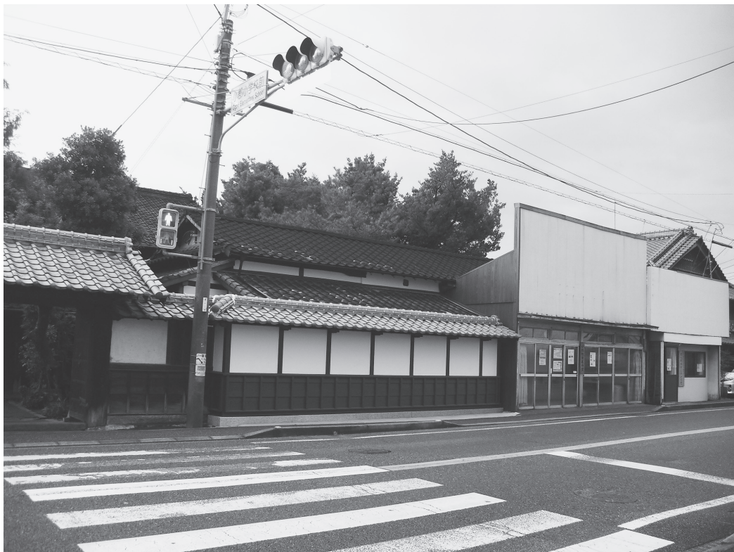
②座敷・北塀外観（改修後、北東から）