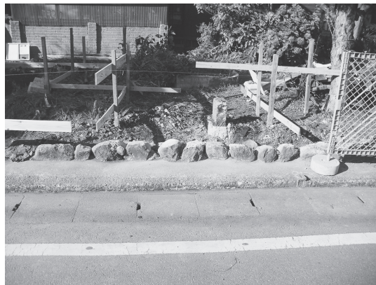
④東門 旧基礎石敷 (東から)