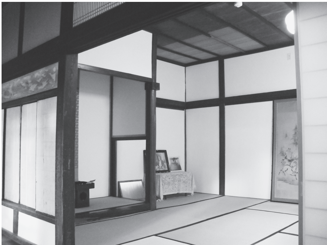
②奥座敷（改修後、南東から）