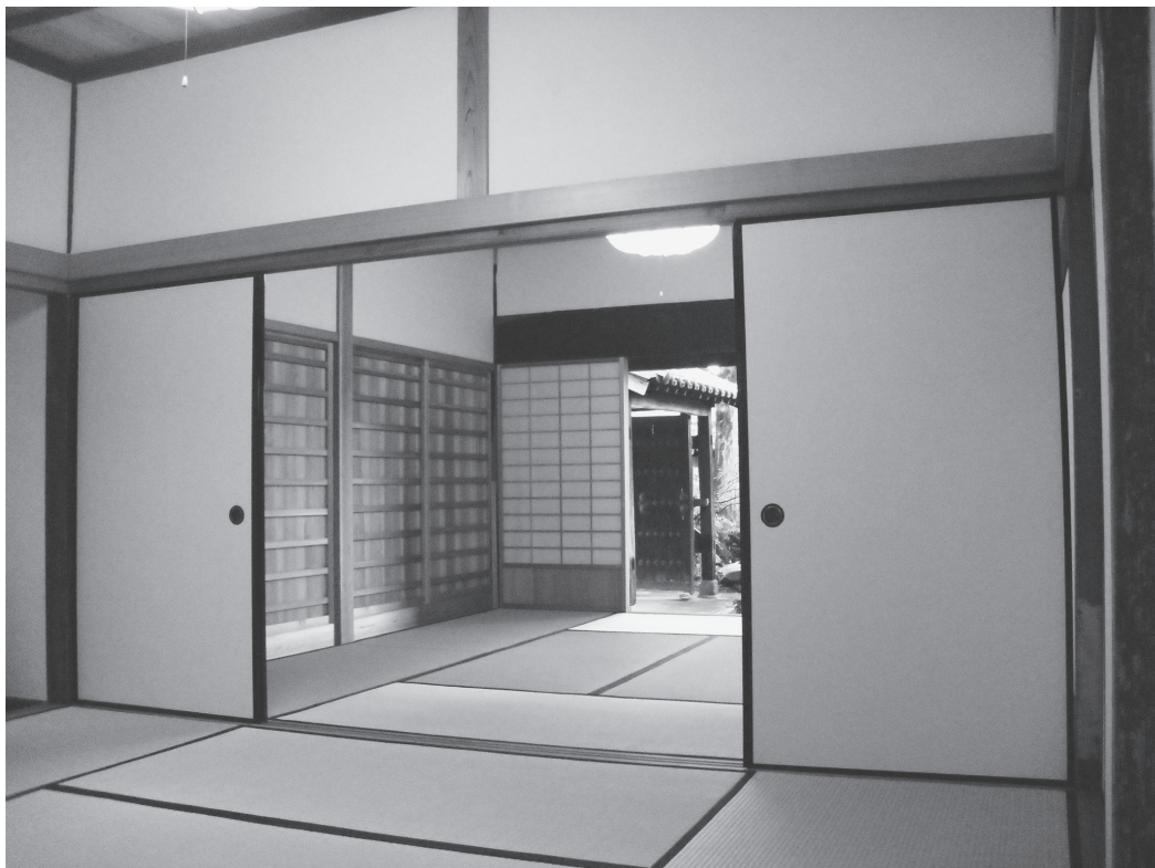
②玄関の間（改修後、南西から）