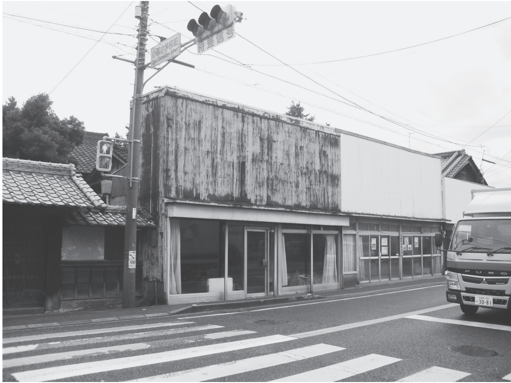
①座敷外観（改修前、北東から）