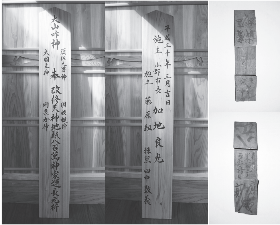
①座敷 新規棟札及び式台玄関腰壁 搦み蟻