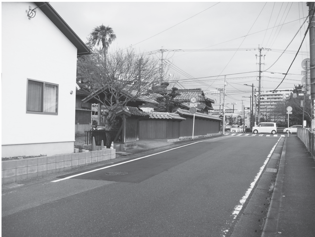
②東門・東塀外観（改修後、南東から）