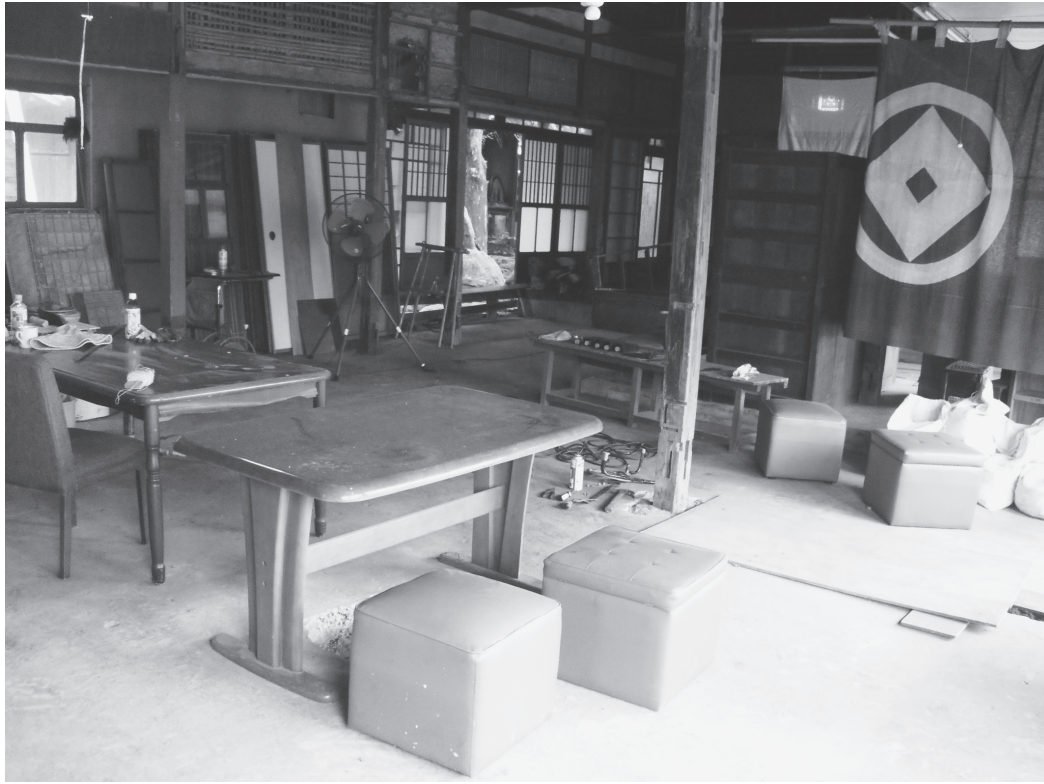
①次の間（改修前、北東から）