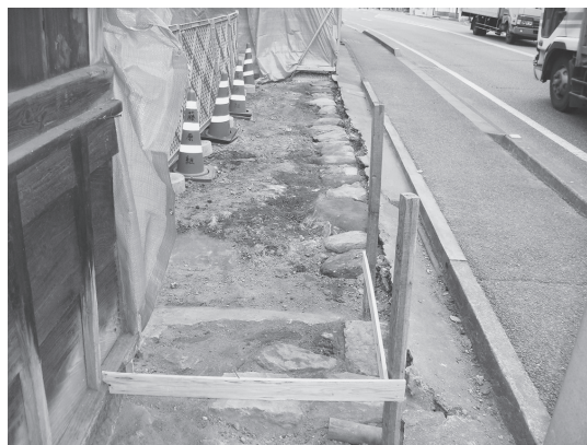
⑥北塀 基礎部分石敷 (東から)