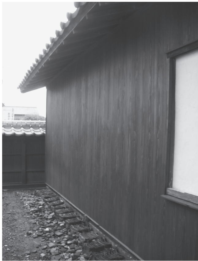
②数寄屋北壁外観（改修後、北西から）