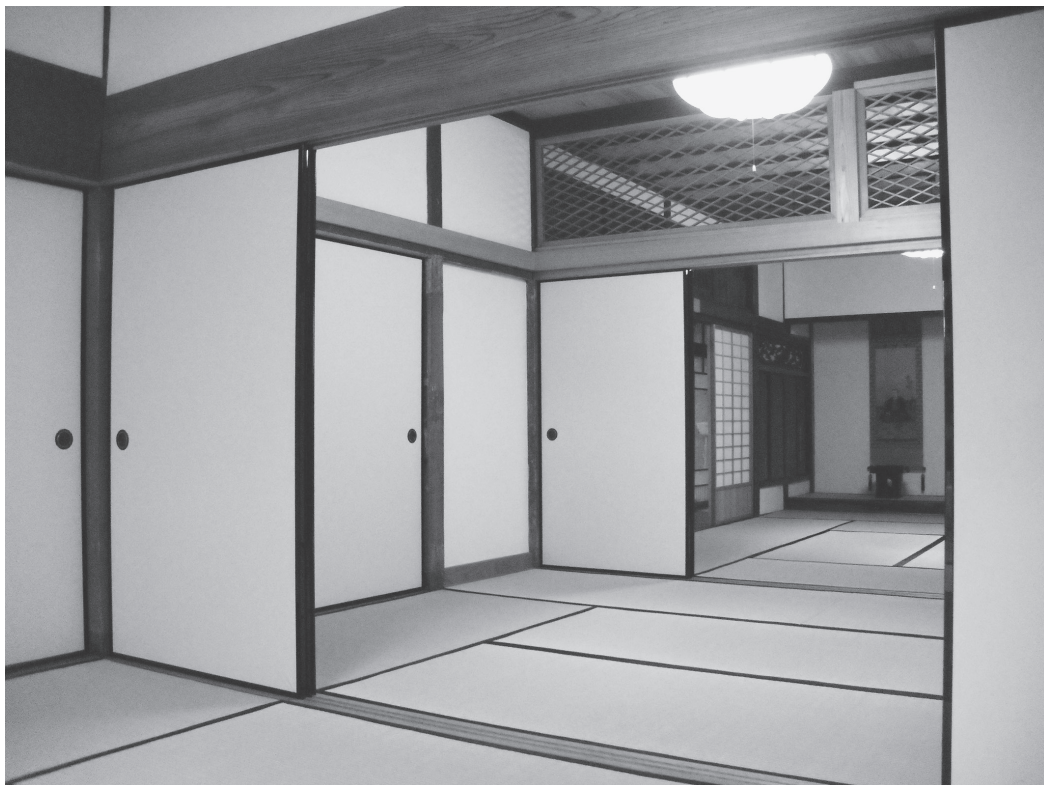
②次の間（改修後、北東から）