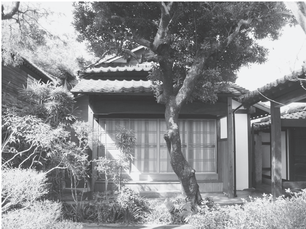
②座敷外観（改修後、東から）