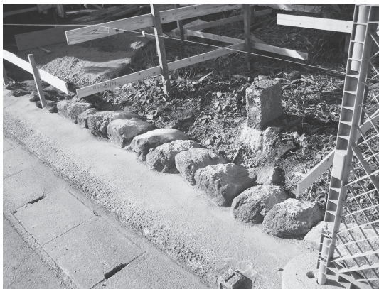
③東門 旧基礎石敷 (北東から)