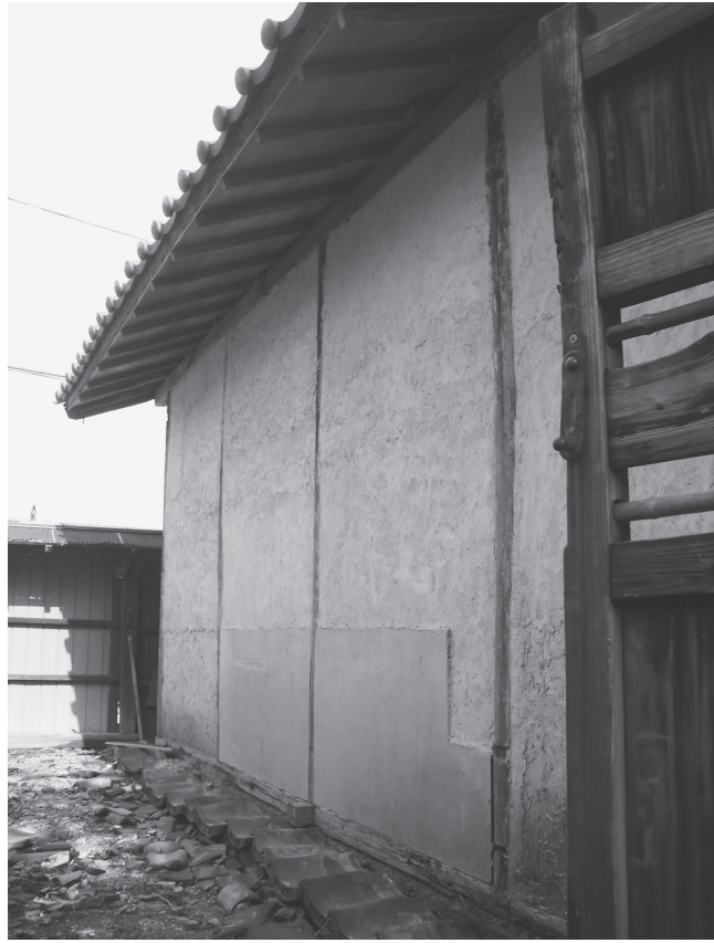
①数寄屋北壁外観（改修前、北西から）