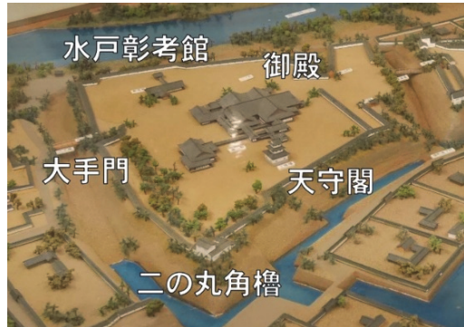
図2 二の丸の建物(水戸市立博物館所蔵模型)