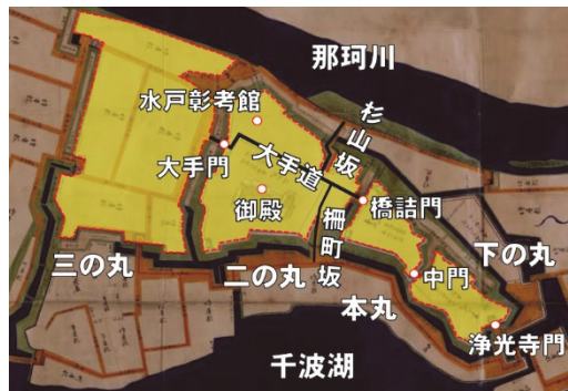
図1 水戸城の区画(正保国絵図を改変)

これらの建物は明治以後に失われてしまったため、市では現在、大手門などの歴史的建造物を当時の姿に復元する「明治維新150年記念 水戸城大手門復元整備事業」を進めています。