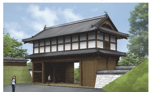
図10 大手門と瓦堀の復元イメージ

なお復元整備では、発掘した瓦堀を覆う形で、新たに瓦堀を復元していきます（図10）。大手門の復元とともに、ぜひご期待下さい。