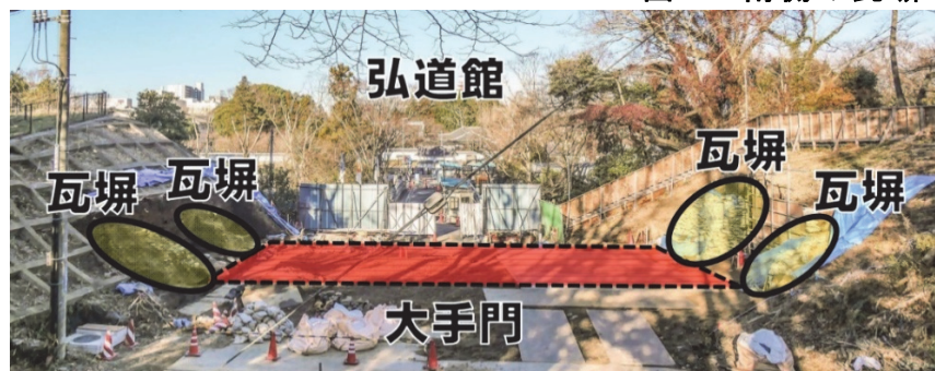
図6 大手門と四つの瓦塼の位置