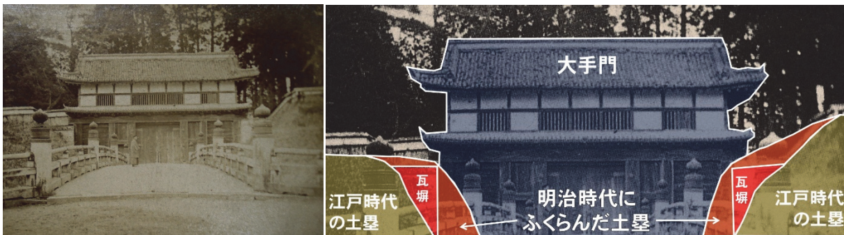
図3 水戸城大手門古写真(左)と、土塁の構造模式図(右)

「復元」とは、できるだけ当時のままの形や寸法で再現することをいいます。一方、大手門の両側にある土塁は、明治時代に埋められて膨らんでいるため、そのままでは大手門を復元できません(図3)。そのため、発掘調査を行いながら、明治時代の土を取り除き、江戸時代の土塁の一部をあらわす作業をしているのです。