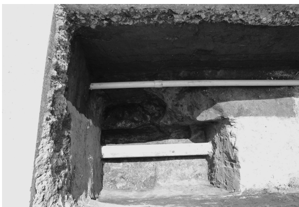
11区1号掘立柱建物跡上層覆土除去（北より）