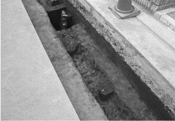
7区1号溝遺物出土状態（南より）