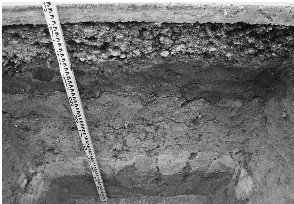
2区基本層序（東より）