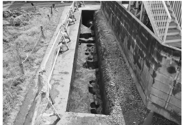
8区完掘状態（西より）