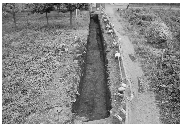
5区完掘状態（北西より）