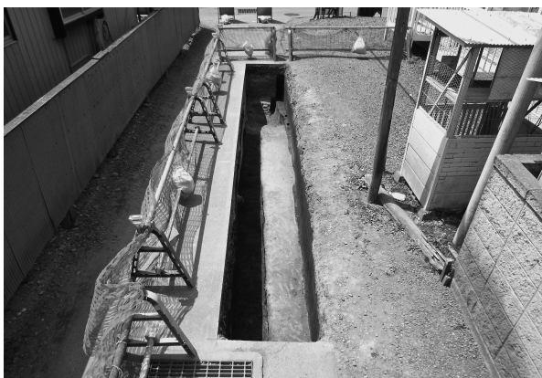
12区完掘状態（東より）