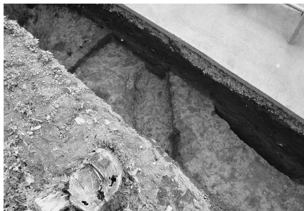
4区3号溝完掘状態（東より）