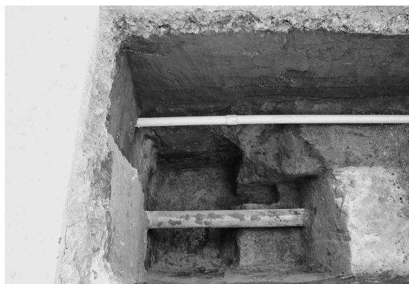
11区1号掘立柱建物跡下層柱穴完掘（北より）