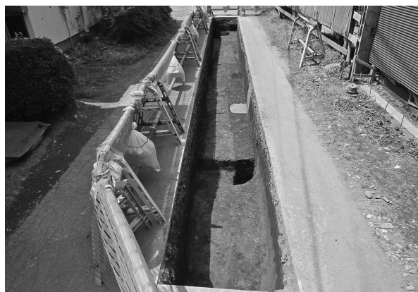
13区完掘状態（東より）