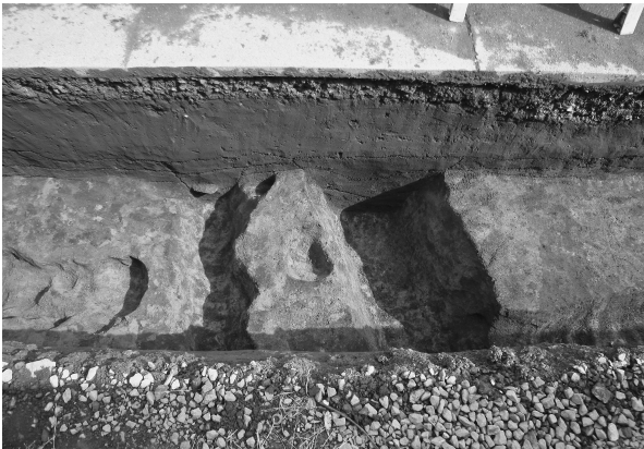
8区1・2号溝完掘状態（南より）