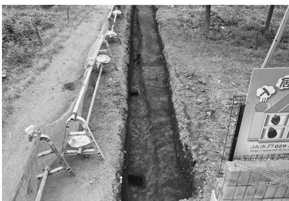
5区1号溝完掘状態（南東より）