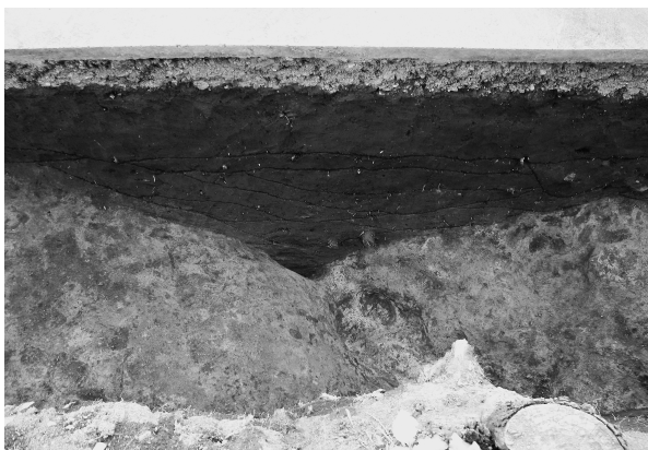
4区2号溝セクション（東より）