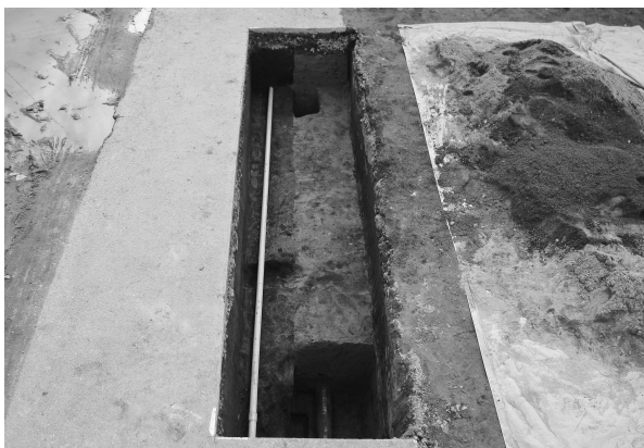
11区完掘状態（東より）