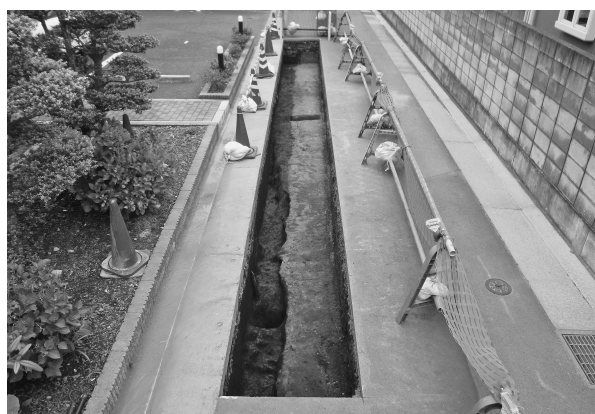
6区完掘状態（北西より）