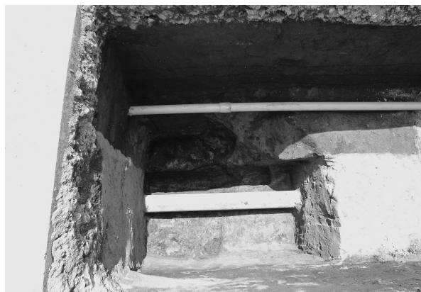
11区1号掘立柱建物跡上層柱痕（北より）