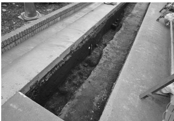
6区1号溝完掘状態（北西より）