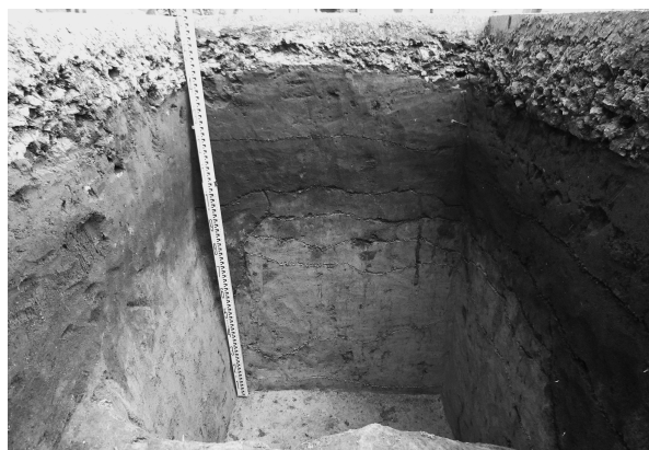
9区基本層序（西より）