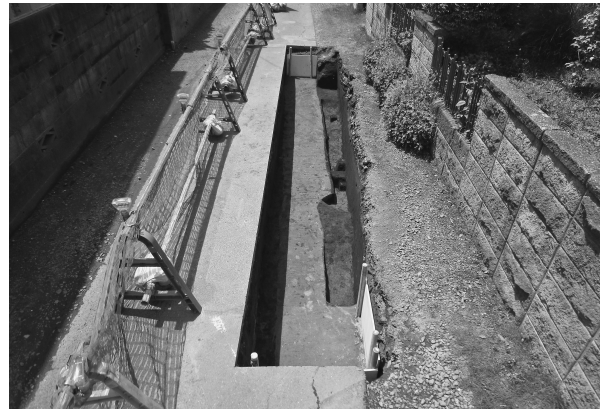
10区完掘状態（東より）