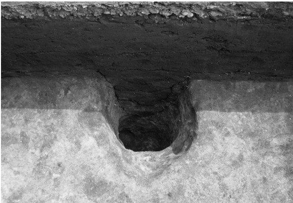
9区P3完掘状態（北より）