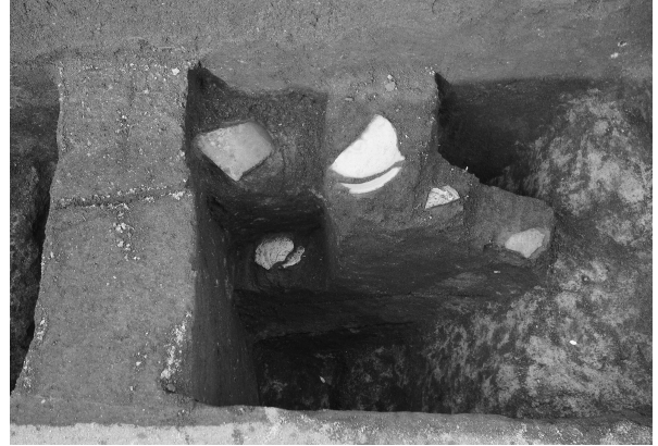
7区2号溝遺物出土状態（西より）