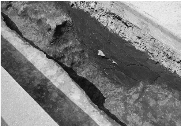
7区2号溝完掘状態（南西より）