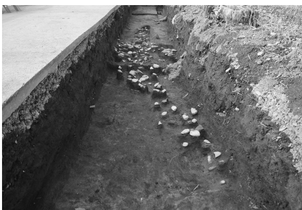
4区1号性格不明遺構礫出土状態（南西より）