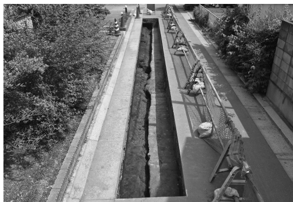
7区完掘状態（北西より）