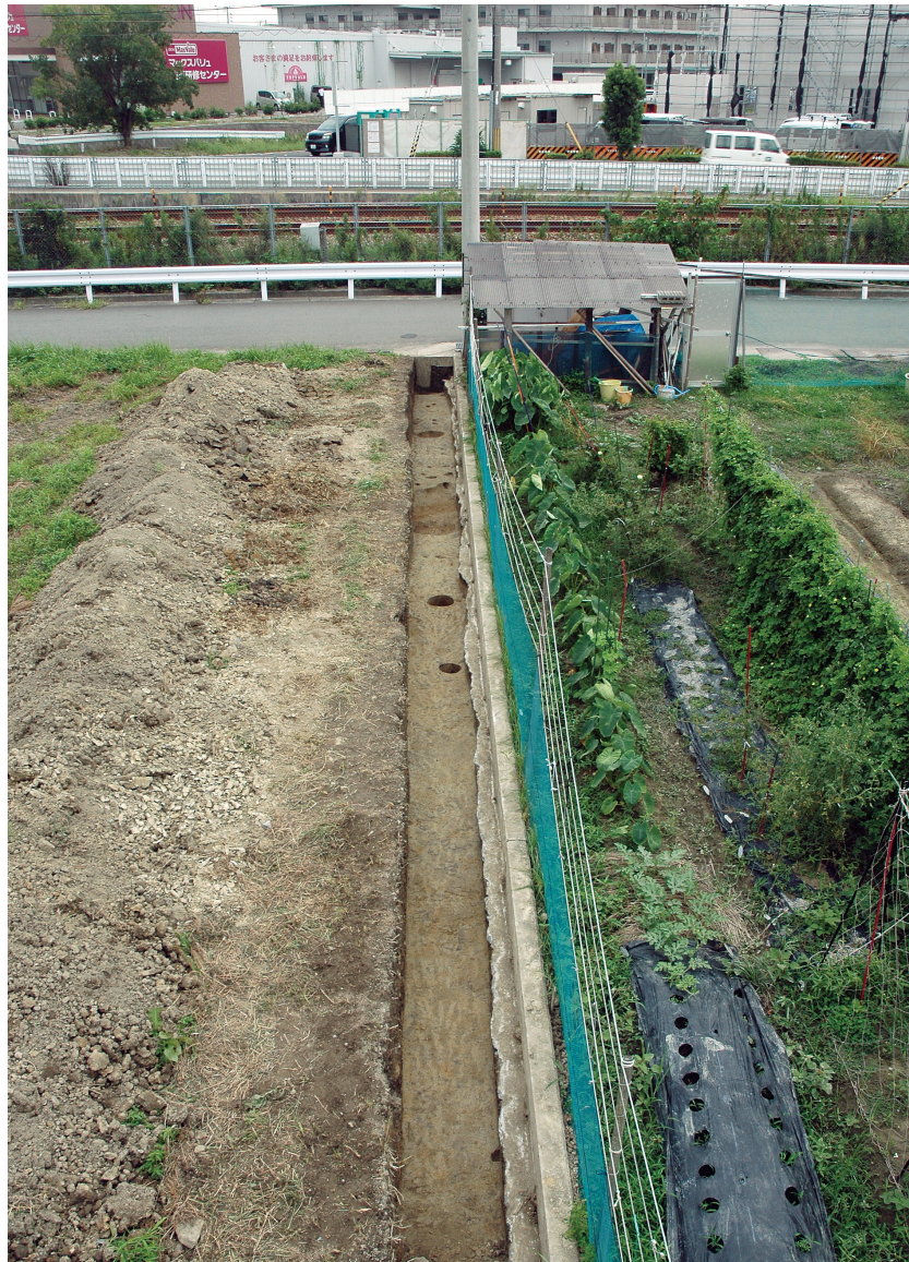
調査区南側全景（北から）