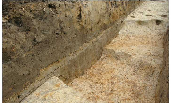
写真3 SD04 土層断面 (北西から)