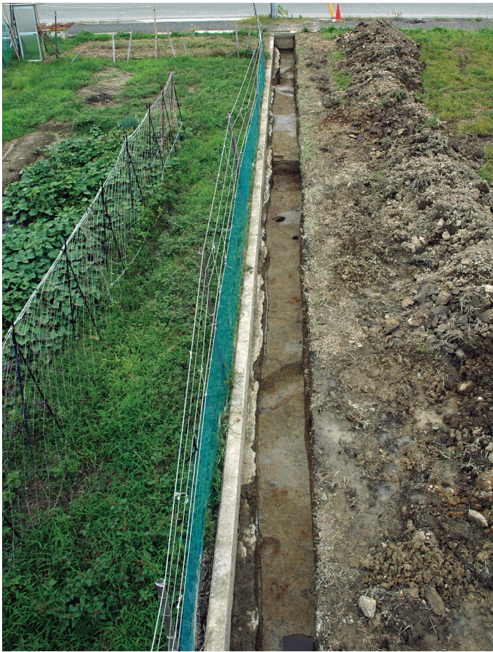
写真1 調査区北側全景 (南から)