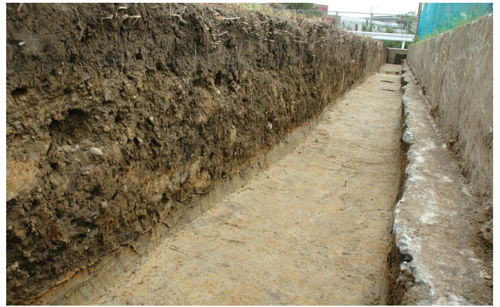
写真2 調査区東壁土層断面 (南東から)