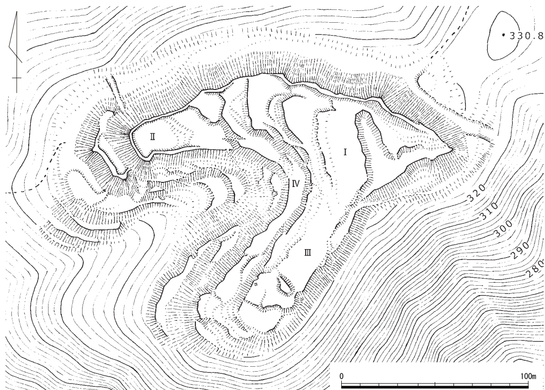
第 74 図 瀧ノ城跡縄張り図 (1/2,000) 作図：畑和良